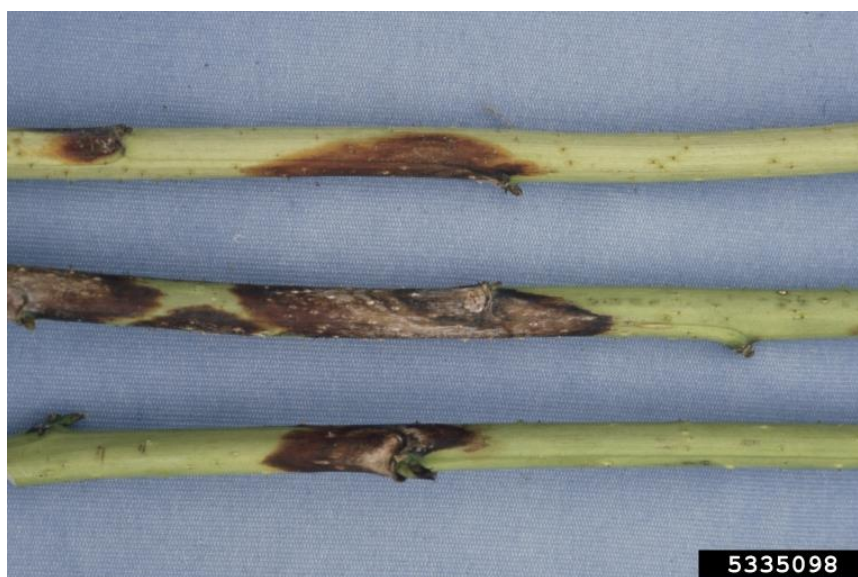
Slika 4. Kestenjasta pjegavost na izdanku kupine ( Didymella applanata )

Glavna mjera zaštite je pravilno provođenje agrotehničkih mjera radi boljeg provjetravanja. Vrlo je bitno da se uklanjaju zaraženi izdanci (spaljivanje). Pri podizanju nasada treba izbjegavati mjesta na kojima se dugo zadržava vlaga te redove okrenuti u smjeru vjetrova. Kemijske mjere zaštite provode se u jesen poslije otpadanja lišća i u proljeće prije vegetacije. Koriste se sredstva na bazi bakra (Nikolić i Milivojević, 2010.)