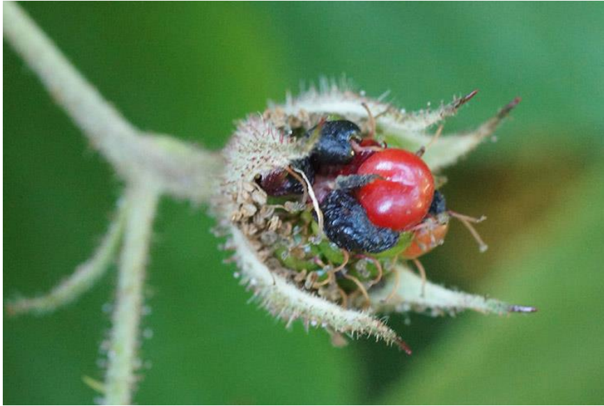
Slika 9. Kupinina grinja ( Acalitus essygi )