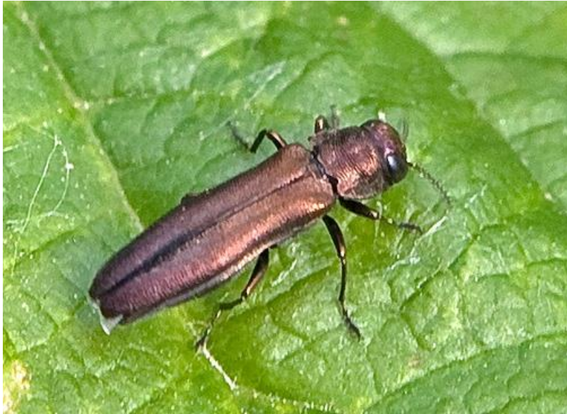
Slika 8. Malinin prstenar ( Agrilus aurichalceus )