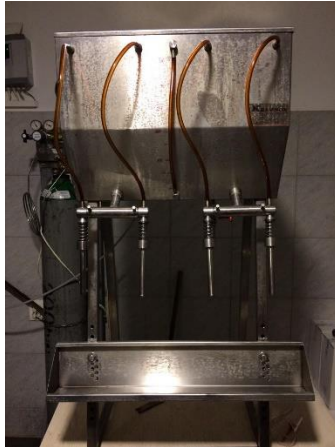
Slika 12. Punilica za kupinovo vino