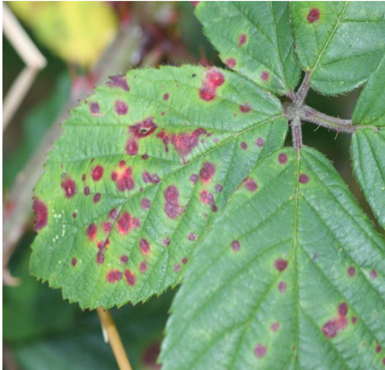
Slika 1. Ljubičasta hrđa na listu kupine ( Phragmidium violaceum )

Od kemijskih sredstava koristi se: Baycor WP 25, Stoper, Chorus 75 WG, Gong EC, Tilt 250 EC, Stil (Cvijetković, 2010.)