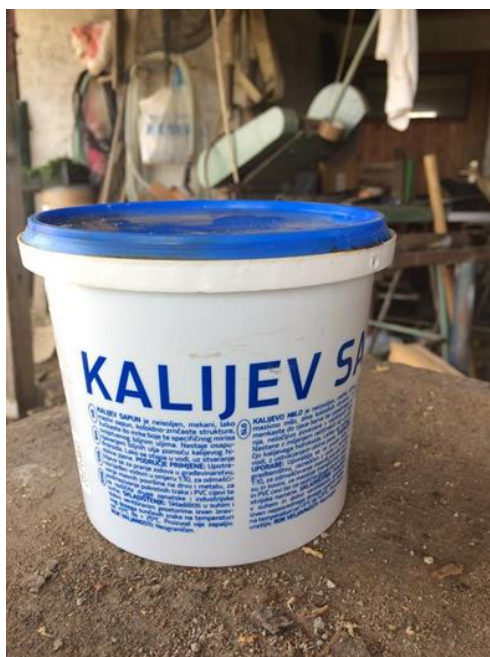
Slika 17. Kalijev sapun

Protiv lisnih ušiju koristi se i kalijev sapun i on daje dobre rezultate u kupinjaku (Slika 17). Koristi se kao otopina koncentracije od 1 do 2%. Sapun se na kupinama primjenjuje po lišću, ispod lišća, po deblu i stabljikama.