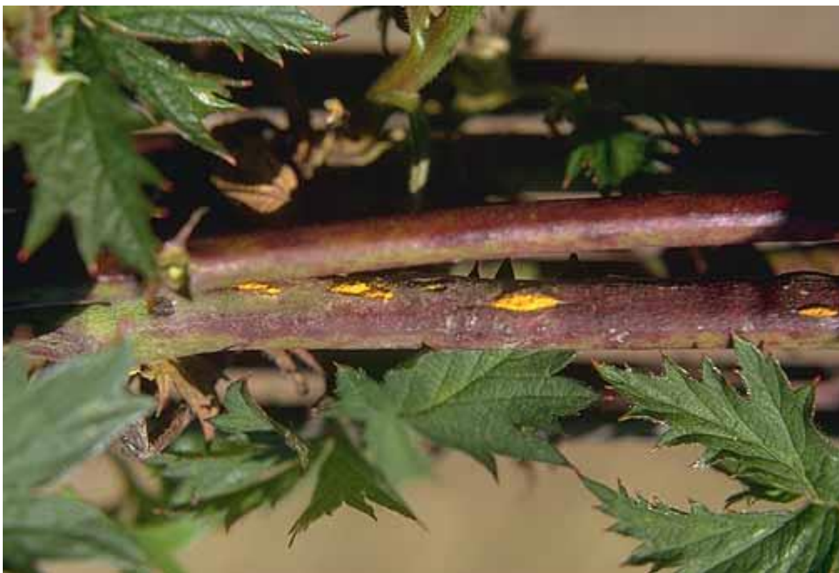
Slika 2. Žuta hrđa na izdanku kupine ( Kuehneola uredinis )