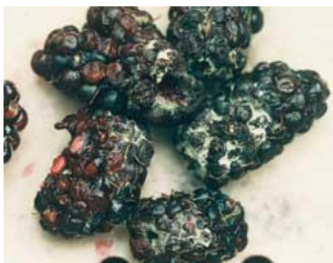
Slika 5. Siva plijesan na plodovima kupine ( Botrytis cinerea )

U Hrvatskoj postoji veći broj fungicida koji se mogu koristiti za zaštitu kupine od sive plijesni.