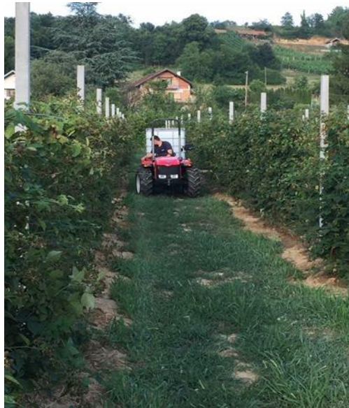
Slika 18. Zalijevanje kupina

Zalijevanje se provodi cisternom. Zalijevanje kreće u 6 mjesecu i zaljeva se svaki tjedan (Slika 18). Voda koja se koristi mora odgovarati uredbi o klasifikaciji voda i uredbi o opasnim tvarima koje se nalaze u vodi.