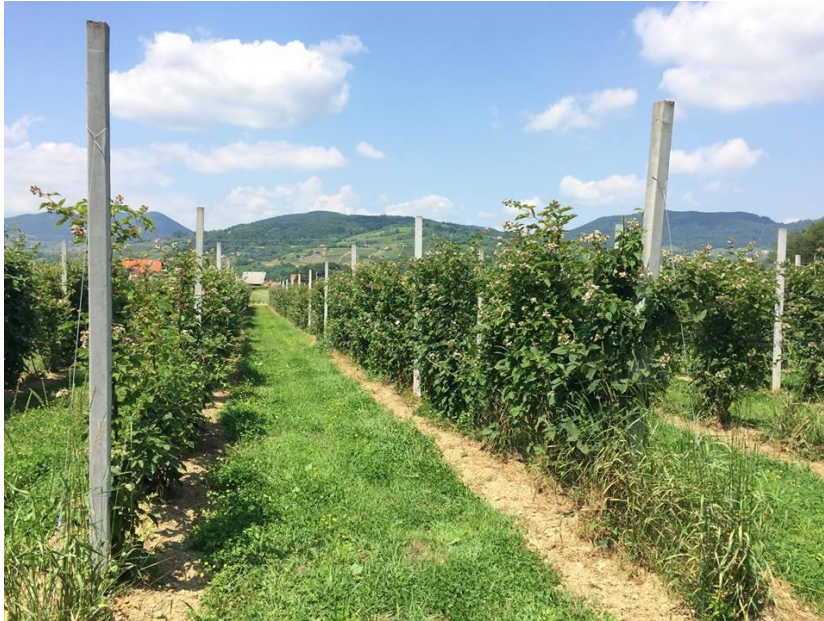
Slika 11. Novi kupinjak