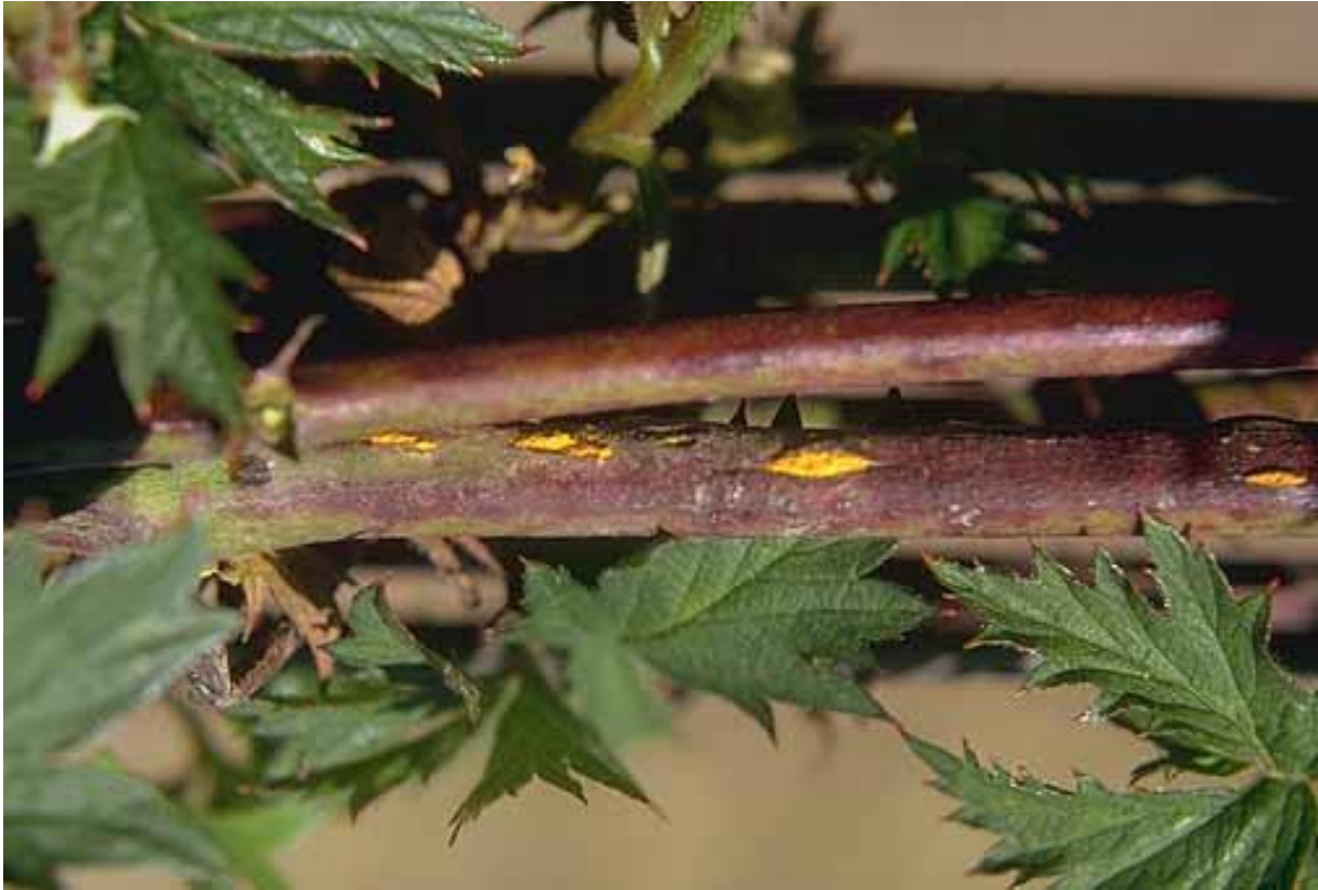
Slika 2. Žuta hrđa na izdanku kupine ( Kuehneola uredinis )