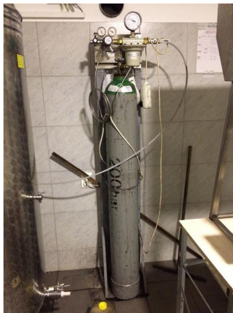
Slika 13. Sustav za argonsko čuvanje vina