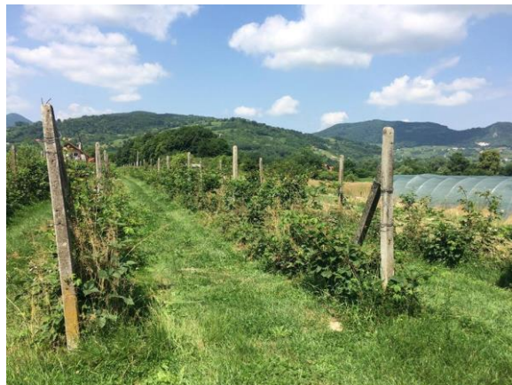
Slika 10. Stari kupinjak iz 1991. godine

Proizvodnju kupina započeli su davne 1991. godine, a znak za ekološki proizvod dobili su 2007. godine (Slika 10). Trenutnu proizvodnju rade na dva kupinjaka od čega je jedan veličine 0,20 ha, a drugi 1,20 ha.