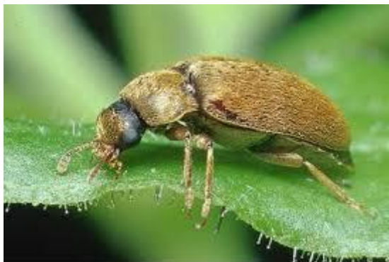
Slika 6. Malinin pupar ( Byturus tomentosus )

Malinin pupar štetni je organizam koji radi štetu na pupoljcima, cvjetovima i plodovima kupine i maline (Slika 6). Ima jednu generaciju godišnje i prezimljava u zemljištu. Tijekom četvrtog mjeseca imago počinje raditi štete na višnjama i trešnjama, a kasnije prelazi na kupinu. Ženke polažu svoja jaja na pupoljcima kupine bušeći rupu. Plodovi i cvjetovi na kojim se hrani su sitni i suše se. http://www.poljosfera.rs/