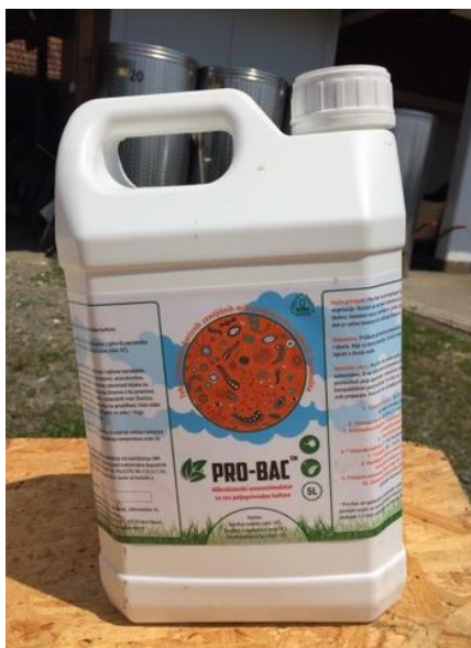
Slika 15. Sredstvo za zaštitu ProBac

Sredstvo se primjenjuje 3 do 4 puta sredinom kolovoza. Velike štete u nasadu uzrokuje napad sive plijesni. Za zaštitu od plijesni primijenjeno je sredstvo Probac nakon cvatnje i dobiveni su zadovoljavajući rezultati. Sredstvo Probac sadrži prirodne mikroorganizme, vitamine, enzime i aminokiseline koji pojačavaju otpornosti biljke na fitopatogene gljive (slika 15). Prilikom tretiranja sredstvo djeluje na mobilizaciju hraniva i povećanje prinosa.