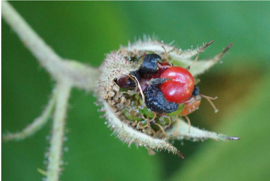
Slika 9. Kupinina grinja ( Acalitus essygi )