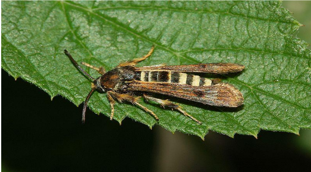
Slika 7. Malinin staklokrilac ( Bembecia hylaeiformis )