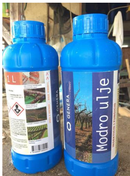
Slika 16. Insekticid-fungicid Modro ulje

Pripravke koje koriste protiv štetnika su pripravak od koprive, pripravak od čili paprika, kalijev sapun i modro ulje. Pripravak od koprive rade na vlastitom imanju tako što uberu 1 kg mlade koprive koju potapaju u 10 l vode tijekom 24 sata. Pripravak se pokazao učinkovit u kontroli lisnih ušiju. Također, pripravak od čili paprika izrađuju sami, a recept je sljedeći: šaka čili papričica prelije se vodom i usitni se u sjeckalici te se tekućina procijedi, doda se \frac{3}{4} l vode i zatim se primjenjuje prskanjem. Pripravak se koristi za suzbijanje lisnih ušiju i drugih štetnika koji napadaju voćarske kulture. Osim sredstava za zaštitu štetnika koje sami izrađuju na Opg-u se koristi i modro ulje. Modro ulje je tekuća uljna koncentrirana suspenzija koja je dobivena iz bakrova (II) hidroksida i mineralnog ulja odnosno to je kombinirani insekticid-fungicid za suzbijanje štetnika (zimskih jaja). Prskanje je obavljeno 20.03.2017. godine (Tablica 2).