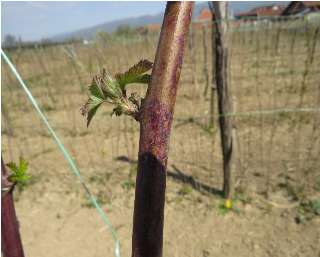
Slika 3. Purpurna pjegavost na izboju kupine ( Septocytia ruborum )

Pred sam kraj vegetacije treba koristiti sredstva na bazi bakra, dok je u vegetaciji potrebno obaviti prskanje fungicidima na osnovi karbendazima.