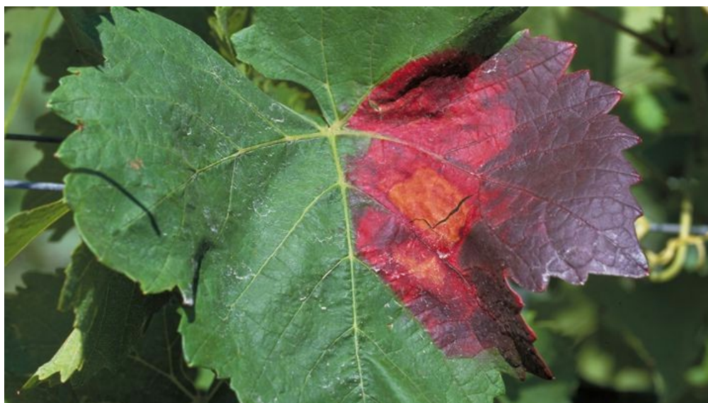
Slika 6. Crveni palež vinove loze

Kod crvenih sorata napadnute zone lista postanu crvenkastoljubičaste (Slika 6). Centralni dio pjege se suši i izgleda kao da je spaljen. Kod bijelih sorti pjege na listu su svjetlije nego kod sorata s obojenim bobicama.