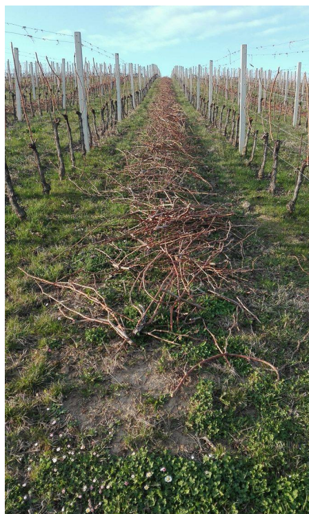
Slika 9. Rezidba