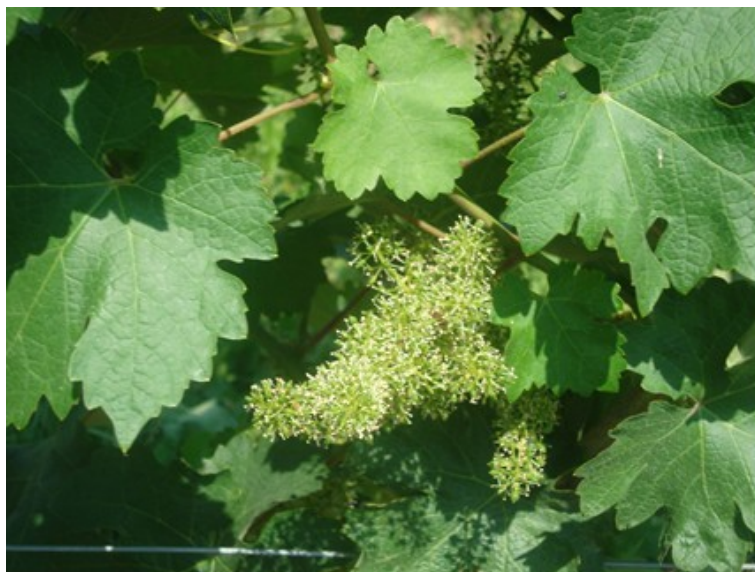
Slika 2. Cvat vinove loze

❖ Generativni organi- cvat (Slika 2), cvijet, grozd, bobica i sjemenka. Služe za razmnožavanje vinove loze u prirodnim uvjetima (Maletić i sur., 2008.).