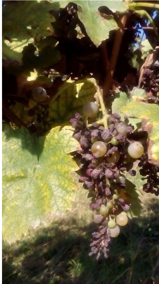
Slika 4. Plamenjača vinove loze