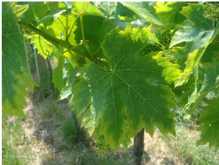
Slika 1. List vinove loze

Služe za usvajanje mineralnih hranjiva i vode, proizvodnju asimilata i skladištenje hranjivih tvari, a sudjeluju i u rastu vinove loze.