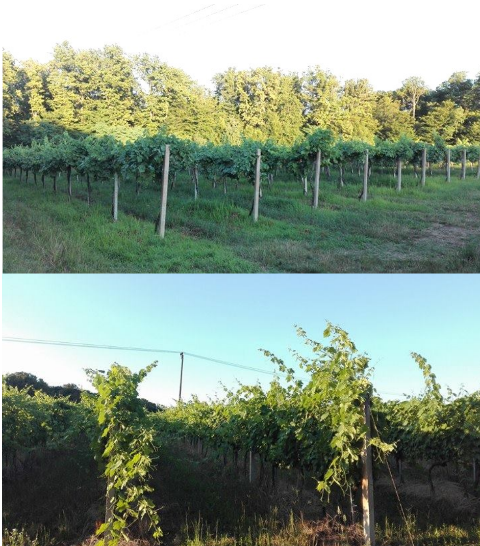
Slika 8. Vinograd

Za izradu diplomskog rada istraživanje je provedeno u vinogradu koji je u vlasništvu Hrvoja Lukačevića (Slika 8), u Trnavi tijekom 2016. godine. Zbog želje za što boljim i kvalitetnijim prinosom u vinogradu se provode intenzivne mjere suzbijanja raznih bolesti.