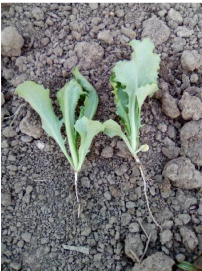
Slika 23. Presadnica salate kristalke

Presadnice obje sorte salate (slika 23.) presađene su 7. svibnja 2018. godine na pokusnu parcelu (slika 25.) veličine 121 \text{ m}^2 . Veličina osnovne parcele čimbenika a (navodnjavanje) bila je 9 \text{ m}^2 , a čimbenika b (sorta salate) bila je 3 \text{ m}^2 . Razmak biljaka unutar reda bio je 30 cm, a razmak između redova bio je 40 cm (slika 24.). Kako ne bi došlo do preklapanja tretmana navodnjavanja u istraživanju određen je razmak između parcela od 1 m.