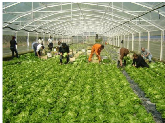
Slika 14. Mehanizirana berba salate (lijevo) i ručna berba salate (desno),