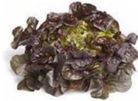
Slika 3. Lisnata salata hrastov list

Lisnata salata (slika 3.) odlikuje se po bogatoj rozeti zelene, žutozelene ili smeđe-crvene boje. Listovi rozete su glatke ili naborane površine, ravnog, više ili manje nazubljenog ili urezanog ruba. Berba ove salate ovisi o sorti, kod nekih se kidaju pojedinačni listovi, dok se kod drugih bere cijela rozeta.