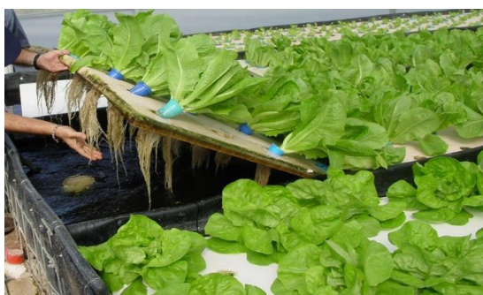
Slika 13. Plutajuće polistirenske ploče sa salatom u plitkim bazenima

Pozitivna strana ovakvog uzgoja je u tome što je omogućeno prozračivanje i brzi razvoj korijenovog sustava. Posebno se na ovaj način uzgaja lisnato povrće (salata, endivija, matovilac i dr.). Princip uzgoja bazira se na plitkim bazenima u kojima je hranjiva otopina i na čijim površinama plutaju polistirenske ploče zasijane sa kulturom (slika 13.). Ovaj način omogućuje berbu više puta u jednoj sezoni. Smatra se da ovaj način uzgoja zbog reciklirane vode ne onečišćuje se okoliš na području proizvodnje. U Hrvatskoj je tek u 2006. godini započeo uzgoj lisnatog povrća zasnovan na ovoj metodi. Metoda se pokazala isplativa, pružajući kvalitetniji proizvod i tražen na tržištu. S takvim pozitivnim rezultatima ovaj način uzgoja se počeo širiti.