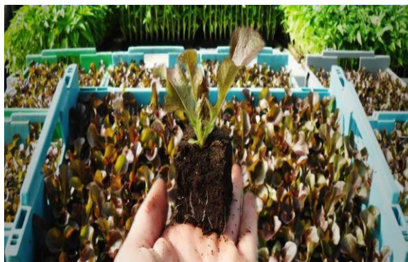
Slika 9a. Uzgoj presadnica u kockama treseta

Kada je sjetva u ljetnom razdoblju sjeme u kontejnerima do faze nicanja treba biti u hladnom i tamnom prostoru. Na taj način se izbjegne dormantnost sjemena. Kada presadnica razvije 3 do 4 dobro razvijena lista i dobro razvijen korijen biljka je u fazi za presađivanje. Presadnice su razvijene poslije dva i pol tjedna i spremne za presađivanje. S presadnicama je potrebno oprezno rukovati, ukoliko oštetimo presadnicu, ona se sporije ukorjenjuje i pri tome ima neujednačen rast i osjetljivija je na bolesti. Najkvalitetnije se presadnice dobivaju uzgojem u kontejnerima ili prešanim tresetnim kockama (slika 9a.).