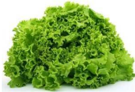
Slika 6. Lišće salate

Lišće salate (slika 6.) je sjedeće, okruglo, ovalno, a vanjsko lišće rozete je položnije i tamnije boje, dok je lišće glavice uspravnije i svjetlije. Listovi mogu biti različite nijanse zelene boje koji mogu biti sa ili bez izraženim pigmentima. Osim varijacija u zelenoj boji, listovi se mogu razlikovati i u nijansama crvenkasto-smeđe boje. Ovisno o sorti salate lišće je manje ili više nazubljeno.