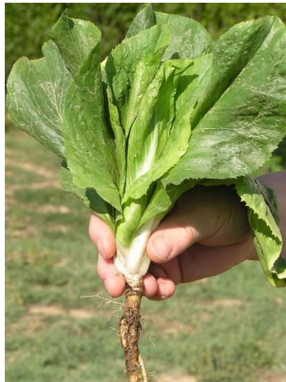
Slika 5. Korijen salate

Salata je jednogodišnja povrtna kultura te pripada u porodicu glavočika. Korijen salate (slika 5.) je vretenast, mesnat, dobro razvijen, koji se uglavnom razvija u površinskom sloju tla 25 do 30 cm, te je rastresit i prozračan. Iz glavnog korijena salate izbijaju postrane korijenove žilice koje se dijele na prvi i drugi red. Korijen u promjeru odgovara promjeru rozete. Naročito se plitko ukorjenjuje salata uzgojena iz presadnica.