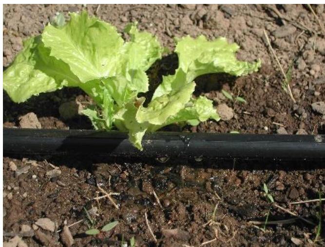
Slika 16. Navodnjavanje salate sustavom „kap po kap“