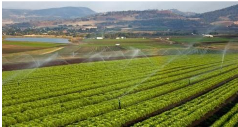
Slika 18. Navodnjavanje salate rasprskivačima

Rasprskivači (slika 18.) koriste se za navodnjavanje većih površina, sastoje se od jedne ili dvije mlaznice i tijekom rada kiše cijeli ili samo određeni sektor kruga. Za veće površine na kojima se uzgaja povrće koriste se rasprskivači koji stvaraju fine, sitne kapljice vode, slične kiši, kako ne bi došlo do oštećenja usjeva. Rasprskivač za veće površine radi intenzitetom kišenja od 10 mm/h do 20 mm/h, domet mlaza jeste od 20 m do 30 m i prema radnom pritisku od 2,5 bara do 5 bara. Rasprskivači se na polju koje se navodnjava postavljaju po određenom