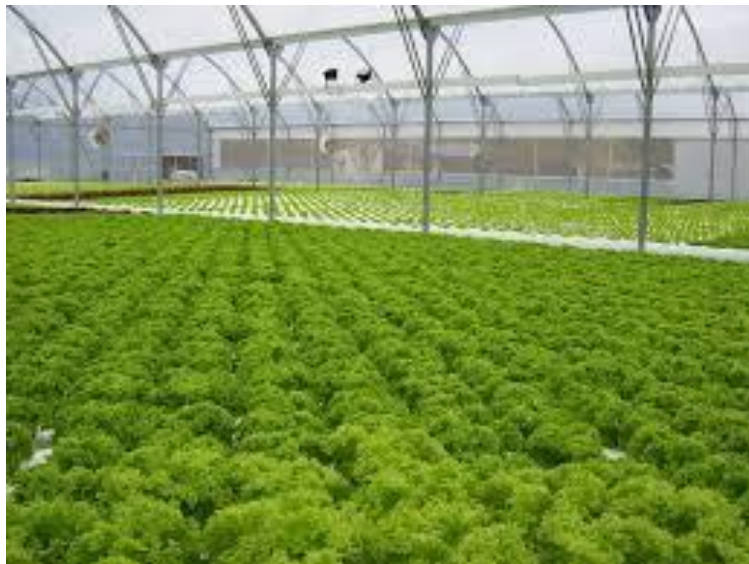
Slika 19. Navodnjavanje salate sustavom „kap po kap“ u zaštićenom prostoru

U zaštićenim prostorima (plasticima, staklenici i tuneli) nema priliva vode putem oborina te je svu potrebnu količinu za rast i razvoj biljke potrebno dodati na umjetan način – navodnjavanjem. Osim vode biljka putem sustava za fertigaciju dobiva i hraniva tako da navodnjavanje u zaštićenim prostorima ima dvojaku ulogu. U zaštićenim prostorima najčešće je korišten sustav za navodnjavanje „kap po kap“ (slika 19.).