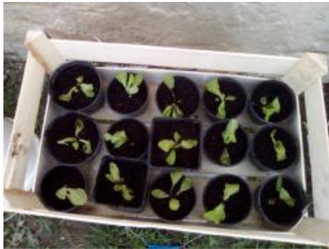
Slika 20. Uzgoj presadnica salate

Presadnice salate uzgojene su iz sjemena Kristalka (Great lakes) i puterica (Atrakcija) 11. travnja 2018. godine. Presadnice su uzgojene na mješavini tla i supstrata Florasan (slika 20.).