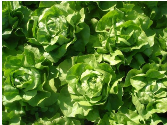
Slika 2. Salata maslenka

Salata glavatica dijeli se na maslenke (slika 2.) i kristalke. Maslenke formiraju sitnije glavice, listovi su joj mekani i sočni. Ima vrlo nježne, ovalne listove glatke površine i cjelovitog ruba. Kristalke imaju veću rozetu, ali je vrlo krhka. Listovi su joj nazubljenog ruba, naborane površine i hrskave strukture s izraženim žilama.