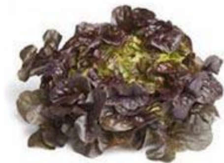
Slika 3. Lisnata salata hrastov list

Lisnata salata (slika 3.) odlikuje se po bogatoj rozeti zelene, žutozelene ili smeđe-crvene boje. Listovi rozete su glatke ili naborane površine, ravnog, više ili manje nazubljenog ili urezanog ruba. Berba ove salate ovisi o sorti, kod nekih se kidaju pojedinačni listovi, dok se kod drugih bere cijela rozeta.