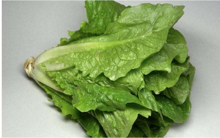
Slika 4. Salata romana