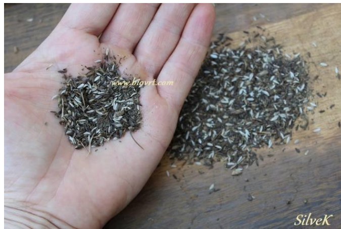
Slika 8: Sjeme salate

Plod salate je jednosjemeni plod roška s papusom, koja može biti sive, crne ili smeđe boje (slika 8.), duguljastog oblika 3 do 9 mm, zaoštrena s oba kraja. Sjeme salate je crne, tamnosmeđe ili sivobijele boje, dužine 3 do 4 mm i širine 0,3 do 0,5 mm. Masa 1.000 sjemenki je 1,0 do 1,5 g. Jedan gram sadrži oko 800 do 1.000 sjemenki. Ako se sjeme pravilno čuva, ono zadržava klijavost do 4 godine (Parađiković, 2009.).