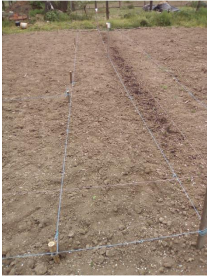
Slika 21. Priprema pokusne parcele