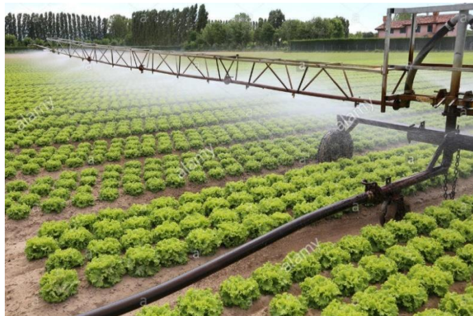
Slika 17. Navodnjavanje salate kišnim krilom

kreće od 200-400 m. Intenzitet kišenja kreće se od 10-15 mm/h. Jedan uređaj može navodnjavati površinu od 30-70 ha.