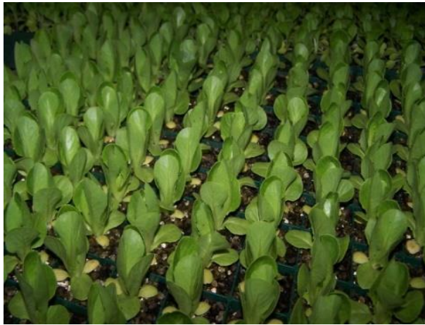
Slika 9. Uzgoj presadnica u kontejneru

Salata se uglavnom proizvodi iz presadnica (slika 9.). Za ranu ljetnu proizvodnju presadnice se proizvode u zaštićenim prostorima: klijalištima, plastenicima, staklenicima i tunelima.