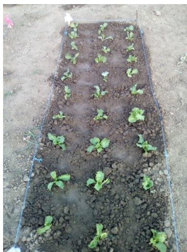
Slika 26. Navodnjavana salata kristalka

Njega i zaštita koja je provedena tijekom razdoblja vegetacije prikazane su tablicom 4. Obzirom na nedostatak oborina i nadprosječno visokih temperatura zraka primijećena je pojava pokorice pa je nasad salate ručno okopavan. Nasad je okopavan i zbog korova, koji su niknuli na području pokusa.