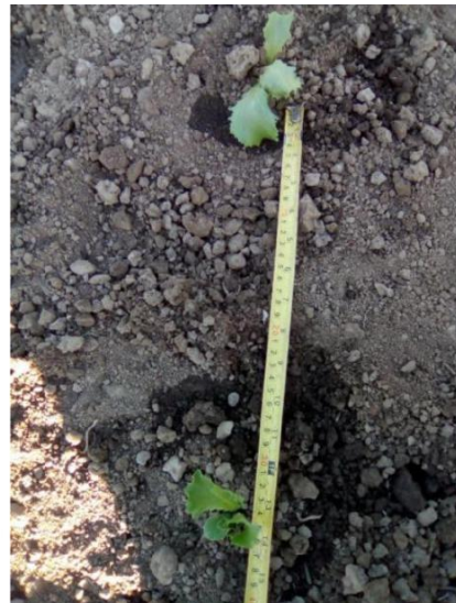
Slika 24. Međuredni razmak