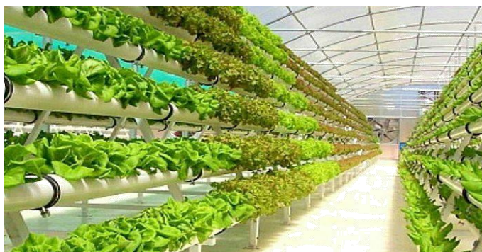
Slika 12. Hidroponski način uzgoja salate

Pozitivna strana ovakvog uzgoja je u tome što je omogućeno prozračivanje i brzi razvoj korijenovog sustava. Posebno se na ovaj način uzgaja lisnato povrće (salata, endivija, matovilac i dr.). Princip uzgoja bazira se na plitkim bazenima u kojima je hranjiva otopina i na čijim površinama plutaju polistirenske ploče zasijane sa kulturom (slika 13.). Ovaj način omogućuje berbu više puta u jednoj sezoni. Smatra se da ovaj način uzgoja zbog reciklirane vode ne onečišćuje se okoliš na području proizvodnje. U Hrvatskoj je tek u 2006. godini započeo uzgoj lisnatog povrća zasnovan na ovoj metodi. Metoda se pokazala isplativa, pružajući kvalitetniji proizvod i tražen na tržištu. S takvim pozitivnim rezultatima ovaj način uzgoja se počeo širiti.