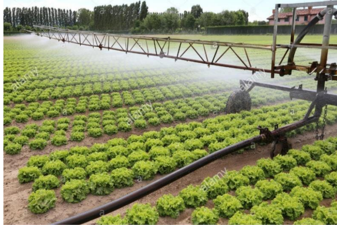
Slika 17. Navodnjavanje salate kišnim krilom

kreće od 200-400 m. Intenzitet kišenja kreće se od 10-15 mm/h. Jedan uređaj može navodnjavati površinu od 30-70 ha.