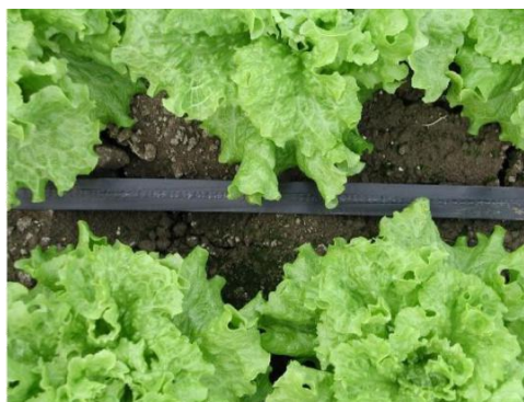
Slika 11. Uzgoj salate u zaštićenim prostorima na crnoj foliji (slika lijevo) i bez folije (slika desno) (izvor: www.pinova.hr i http://www.access-irrigation.co.uk )

Sadnja se obavlja na razmak između redova 25 cm, s razmakom u redu od 25 do 30 cm čime se postiže sklop od 16 do 20 biljaka po četvornom metru. Biljke sa supstratom sade se nešto pliće nego što su rasle, tako da trećina tresetnih blokova bude iznad površine tla. Za uzgoj u zaštićenim prostorima uzgajaju se sorte koje bolje podnose niže temperature i manje osvjetljenja kao što su maslinike, a koje u tim uvjetima razvijaju dosta kvalitetne glavice. Tijekom uzgoja prostor se prozračuje kako bi se održala odgovarajuća vlažnost zraka, a navodnjavanje se vrši svakih 8 do 10 dana s 10 do 15 l/m 2 . Navodnjavanjem se ujedno salata i prihranjuje. Ovisno o temperaturnim uvjetima, salata može biti spremna za berbu već pedesetak dana nakon sadnje.