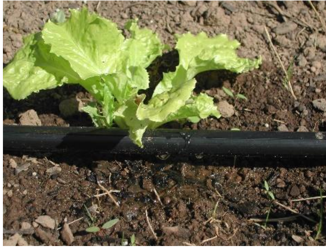
Slika 16. Navodnjavanje salate sustavom „kap po kap“