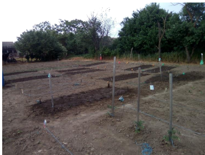
Slika 25. Pokusna parcela (fotografija: Ilić, S., 2018.)

Istraživanje je postavljeno u split-plot shemi u tri ponavljanja kao dvočimbenično istraživanje. Prvi čimbenik u istraživanju bili su tretmani navodnjavanja (a). Na tretmanu a1 obrok navodnjavanja bio je 5 \text{ l/m}^2 , na drugom tretmanu (a2) salata je navodnjavanja s obrokom od 10 \text{ l/m}^2 , a na trećem tretmanu navodnjavanja (a3) obrok navodnjavanja bio je 15 \text{ l/m}^2 . Salata je navodnjavanja ručno, a trenutak početka navodnjavanja određen je slobodnom procjenom prema vanjskom izgledu biljke. Voda za navodnjavanje korištena je iz vodovoda grada Vukovara. Norme navodnjavanja prikazane su tablicom 3. Sveukupno je tijekom istraživanja na a1 tretmanu navodnjavanja dodano 45 mm vode. Na a2 tretmanu dodano je 90 mm, a na a3 tretmanu 135 mm vode. Navodnjavana parcela prikazana je slikom 26.