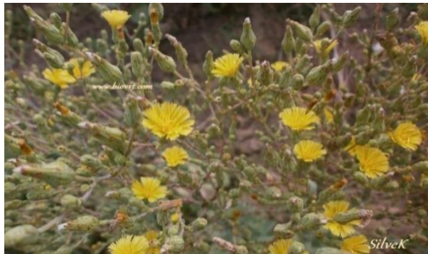
Slika 7: Cvat salate

Pri visokim temperaturama i dugim danima salata prelazi u generativnu fazu. Generativnom fazom formiraju se glavičasti cvatovi na vrhovima cvjetne stabljike. Cvatovi formiraju cvat glavicu, koja je obavijena pricvjetnim listovima (slika 7.).