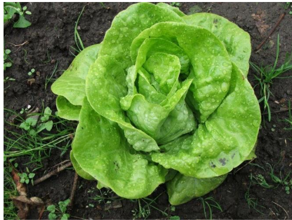
Slika 1. Salata

domaćinstvima kao i relativno mali udio salate iz zaštićenih prostora gdje su prinosi znatno viši od onih iz uzgoja na otvorenom.