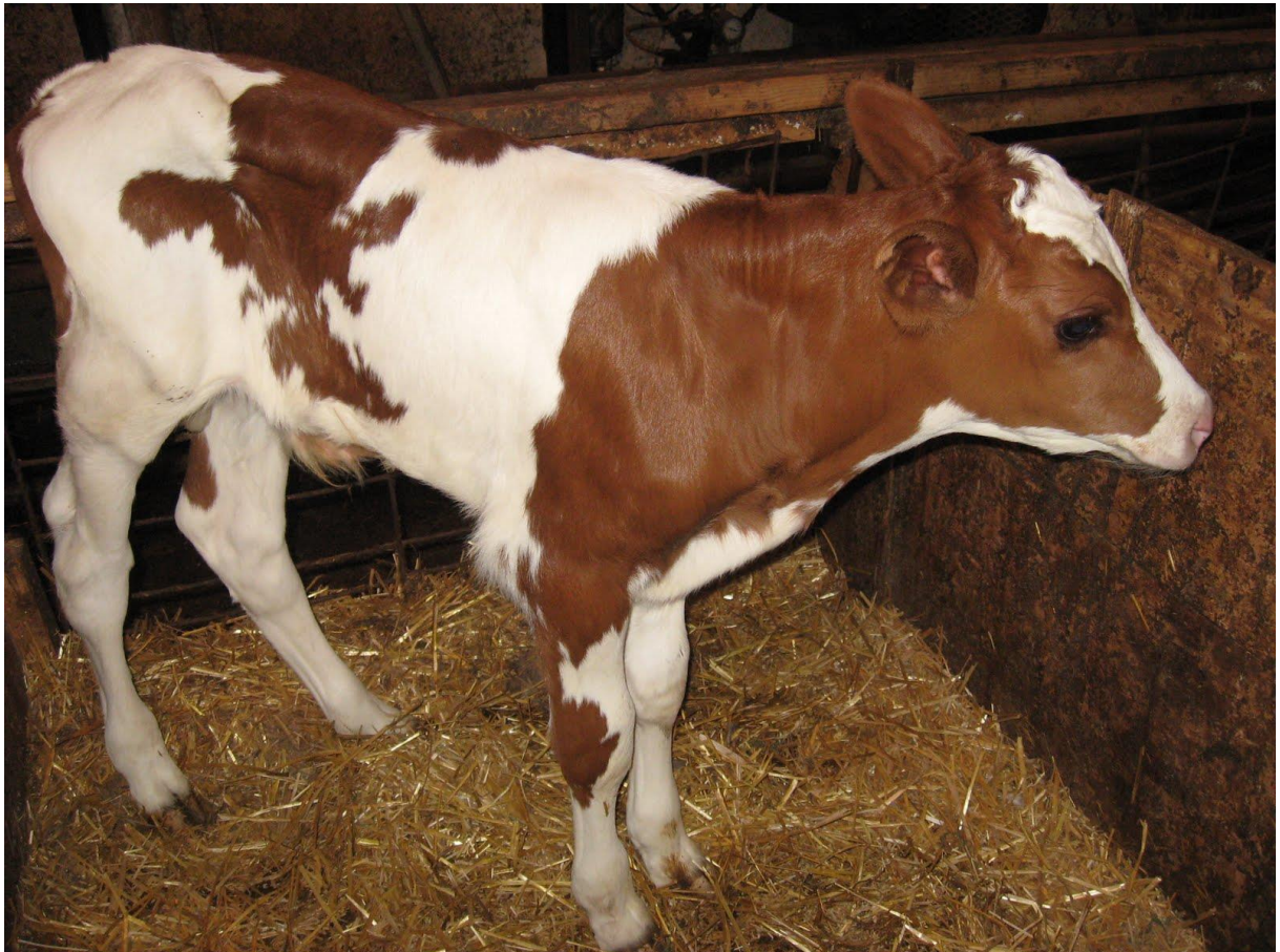
Slika 3: Tele (agroportal.hr, 7.7.2018.)

Na tovilištima se često mogu zateći križanci, uglavnom mesnih pasmina goveda, koji postižu dobru dinamiku rasta i povoljnu kvalitetu mesa. Odabir pasmine u proizvodnji mesa je važan je, smatra Ivanković ((2015.), koliko i odabir tehnologije proizvodnje, a bez primjerene pasmine teško je postići očekivani rezultat u okruženju u kojem će goveda (telad, junad, starija goveda) biti tovljena. Neke pasmine su većeg okvira, iziskuju više krmiva, teže se prilagođavaju oskudnijoj paši ili su sklone zamašćenju trupa, dok druge dobro podnose skromniju ispašu, lakše se tele ili imaju bolje mramorirano meso (prožeto masnim tkivom). Farmeri koji se žele baviti uzgojem teladi (ili junadi) za prodaju trebaju pažljivo birati pasminu u trenutku oblikovanja svojeg osnovnog stada (krava i bikova), jer u skladu s odabranim pasminama mogu očekivati i odgovarajući rezultat (masu, kvalitetu i