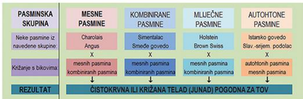
Prikaz mogućih načina uključivanja različitih pasmina u proizvodnju teladi za tov