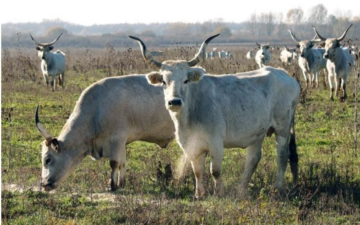
Slika 1: Slavonsko-srijemski podolac

U pogledu proizvodnje mesa vrijedno je spomenuti naše dvije autohtone pasmine goveda, istarsko govedo i slavonsko-srijemskog podolca , premda i buša ima određeni, nešto manji potencijal u proizvodnji mesa. Ove pasmine su zbog svoje otpornosti i prilagodljivosti osobito pogodne za pašne i ekološke sustave proizvodnje mesa. Meso ovih pasmina nešto je nešto tvrđe (nakon primarne obrade trupa poželjno je podvrgavanje mesa ‘‘zrenju’’), no vrlo je aromatično i pogodno za pripremu delicija, posebice tradicijskih, primjećuje Ivanković A. (2015.).