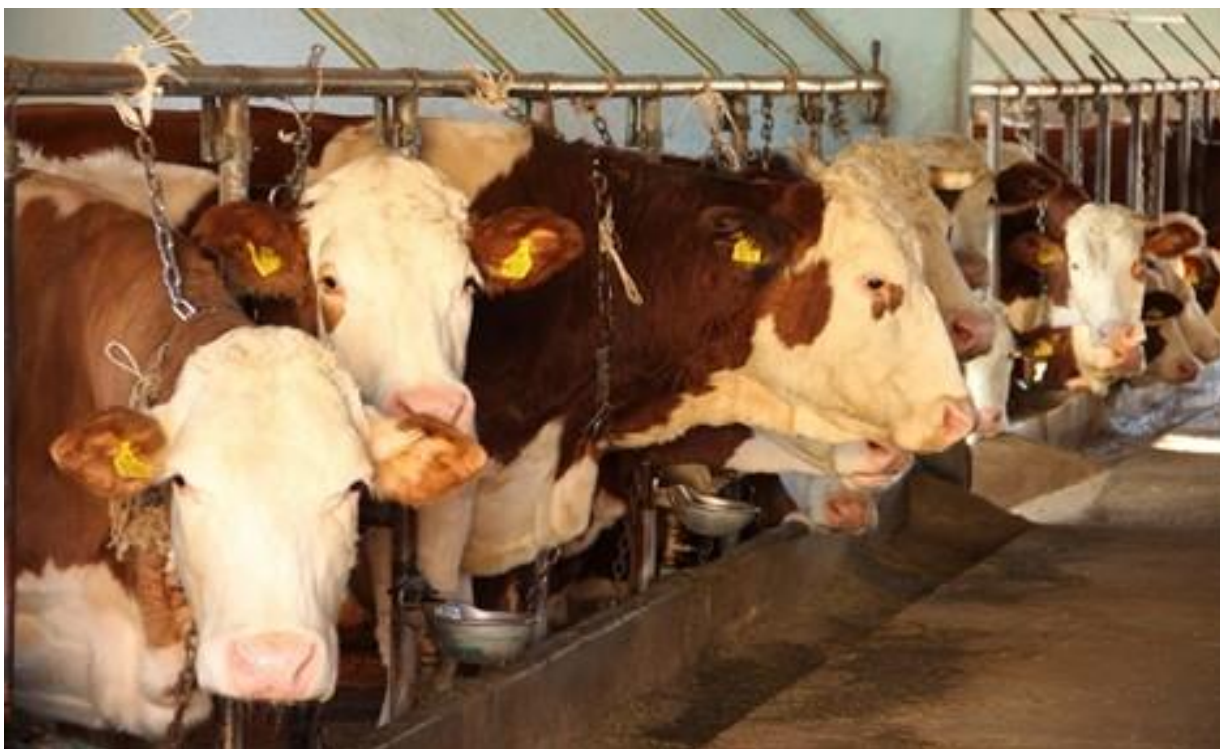
Slika 5: Krave na farmi

Dodjela sredstava za kupnju steonih junica ide preko javnog poziva koji se objavljuje jednom godišnje i otvoren je 60 dana. Ako se u prvom pozivu ne iskoristi sav novac predviđen na godišnjoj razini za tu namjenu, raspisuje se drugi. Prednost pri kupnji steonih junica imaju mladi poljoprivrednici registrirani kao nositelji OPG-a ili ovlaštene osobe u drugim pravnim subjektima i gospodarstva koja se mogu svesti pod kategoriju mikro i malih poduzeća. Steone junice moraju se oteliti na farmi korisnika potpore te se u proizvodnji moraju zadržati najmanje tri godine. Druga potpora, a vezana za gubitak prihoda u uzgoju rasplodnih junica, teška je 135 milijuna kuna, odnosno 45 milijuna za svaku godinu programa. Iznos potpore po grlu nije fiksna i ovisit će o ukupnom broju prihvatljivih rasplodnih junica u RH prijavljenih na tu mjeru. Tu potporu mogu koristiti poljoprivrednici upisani u Upisnik PG-ova koji na svom gospodarstvu drže krave koje koriste u proizvodnji mlijeka i koje su evidentirane u JRDŽ-u te ne smiju biti dužni državi.