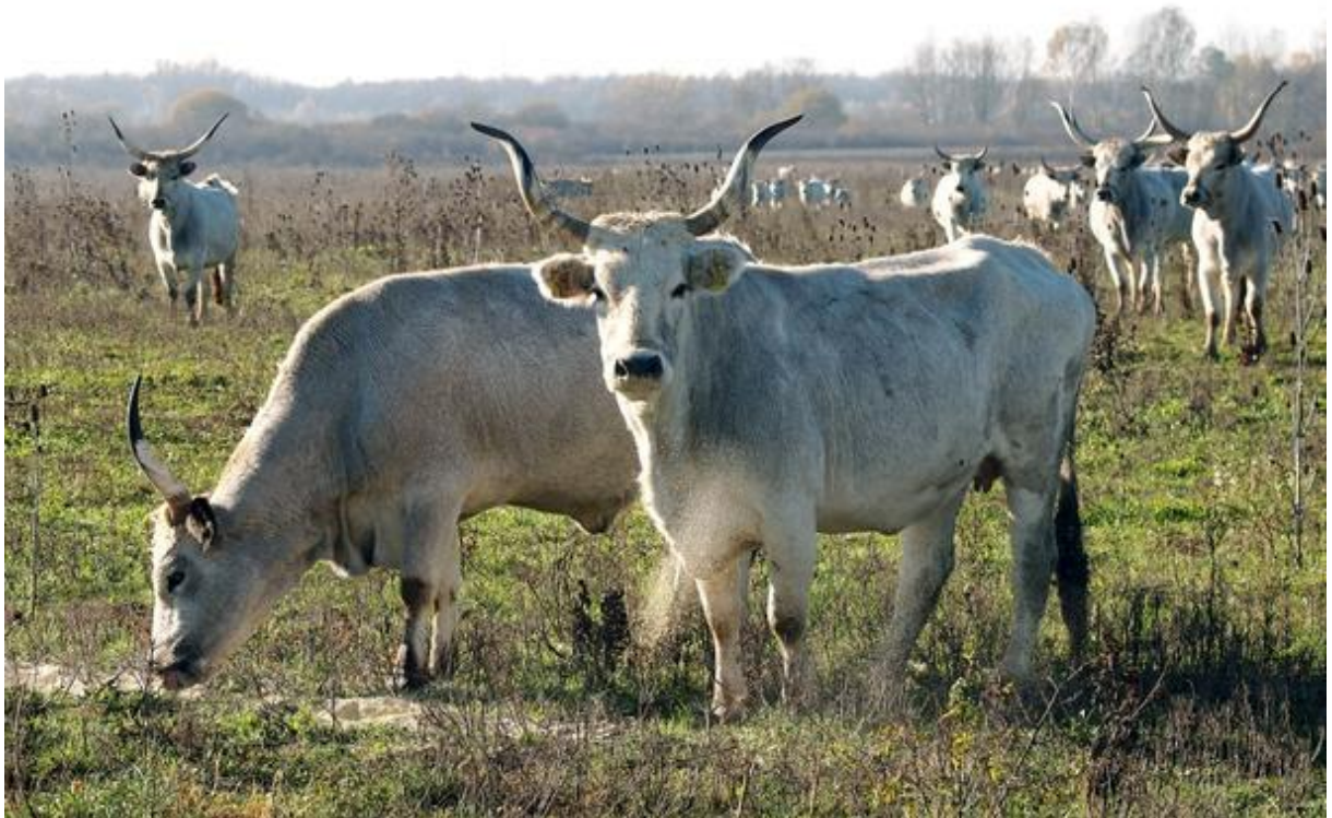
Slika 1: Slavonsko-srijemski podolac (vecernji.hr, 7.7.2018.)

U pogledu proizvodnje mesa vrijedno je spomenuti naše dvije autohtone pasmine goveda, istarsko govedo i slavonsko-srijemskog podolca , premda i buša ima određeni, nešto manji potencijal u proizvodnji mesa. Ove pasmine su zbog svoje otpornosti i prilagodljivosti osobito pogodne za pašne i ekološke sustave proizvodnje mesa. Meso ovih pasmina nešto je nešto tvrđe (nakon primarne obrade trupa poželjno je podvrgavanje mesa ‘‘zrenju’’), no vrlo je aromatično i pogodno za pripremu delicija, posebice tradicijskih, primjećuje Ivanković A. (2015.).