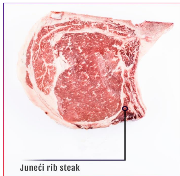
Slika 4: Juneći rib steak (telegram.hr, 1.7.2018.)

Intenzivni tov goveda kao završna faza preko koje se finalizira proizvodnja u govedarstvu provodi se u područjima intenzivne biljne proizvodnje i temelji se na hranidbi kukuruzom. Tov junadi s koncentratima s visokim udjelom kukuruza ima za cilj po Uremoviću (2004.) da se u što kraćem vremenu iskoristi kapacitet za rast i postigne tjelesna masa junica od 380 do 400 kg i muške junadi 450 kg. Na taj način proizvodi se mlada utovljena junad tipa baby beef u dobi od 12 do 13 mjeseci. Za takav tov najprikladnije su kombinirane pasmine goveda, od kojih najbolja i najpoznatija simentalaska pasmina. Meso mlade utovljene junadi svijetlocrvene je boje, karakterističnog ukusa govedine i dobro prorašteno masnim tkivom (mramorirano meso).