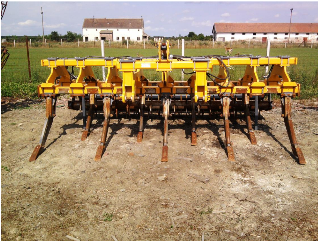
Slika 10. Podrivač "Dondi 809"

"Hana-Koška" posjeduje dva podrivača, jedan marke "Dondi", drugi "Ag Cret". Podrivač slika 10., u tvrtci se koristi u osnovnoj obradi tla. Podrivač se održava tako da se prije početka rada vizualno pregleda, provjeri ispravnost radnih organa i podmažu se ležajevi valjaka. Nakon završetka rada podrivač se čisti od nalijepljene zemlje i biljnih ostataka. Ostale mjere koje navode Emert i dr. (1995.) se ne provode, a to su: provjera zategnutosti vijčanih spojeva. Održavanje se ne provodi u skladu s naputkom za rukovanje i održavanje stroja.