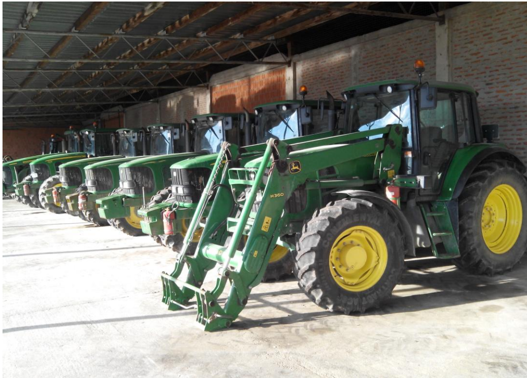
Slika 4. Teški traktori "John Deere"