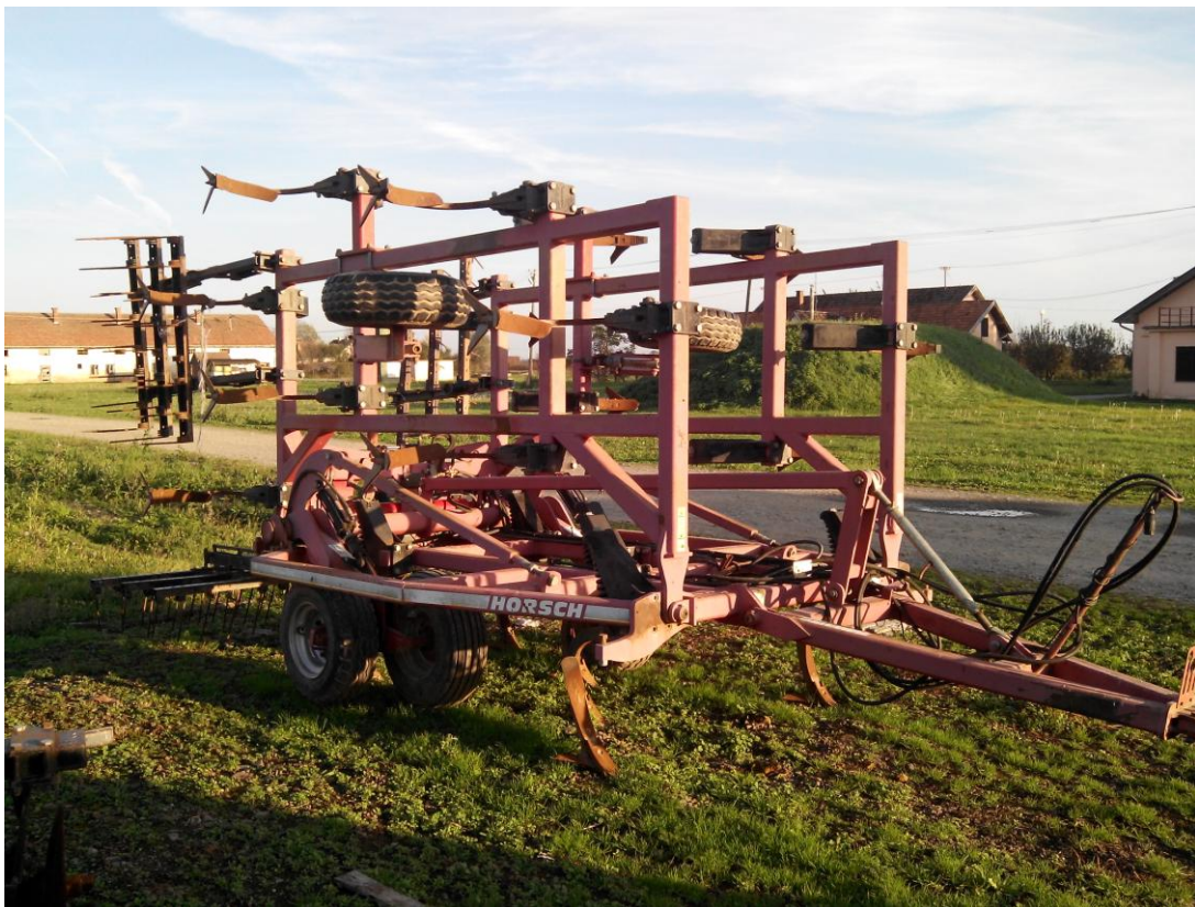
Slika 11. Gruber "Horsch Terrano F6"

"Hana-Koška" posjeduje gruber marke "Horsch Terrano F6". Gruber slika 11., u tvrtci se koristi u osnovnoj i dopunskoj obradi tla. Gruber se održava tako da se prije početka rada stroj vizualno pregleda, provjeri se naoštrenost motičica, podmažu mjesta predviđena za to, te se povremeno provjerava tlak u pneumaticima. Nakon završetka rada čisti se od nalijepljene zemlje i biljnih ostataka. Od ostalih mjera koje navode Emert i dr. (1995.), ne provodi se provjera zategnutosti vijčanih spojeva, zbog čega održavanje nije sukladno napatku za rukovanje i održavanje stroja.