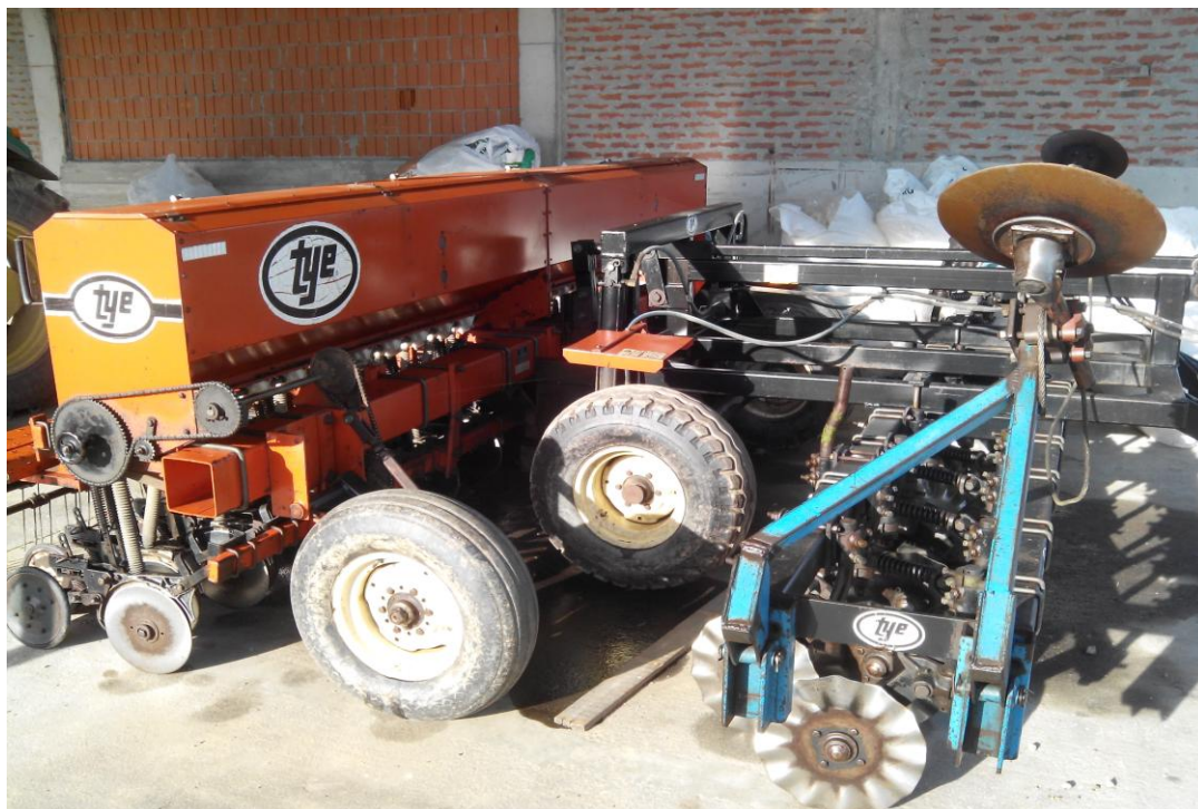
Slika 17. Sijačica za sjetvu strnih žitarica "Tye Notill system 2015"

Sijačica za sjetvu strnih žitarica, slika 17., održava se tako da se prije početka rada vizualno pregleda, provjeri ispravnost sprovodnih cijevi te podmažu za to predviđena mjesta. Prije početka sezone provjerava se tlak zraka u pneumaticima, a nakon završetka rada sijačica se čisti od nalijepljene zemlje. Kao redovita mjera održavanja izostaje provjera zategnutosti vijčanih spojeva.