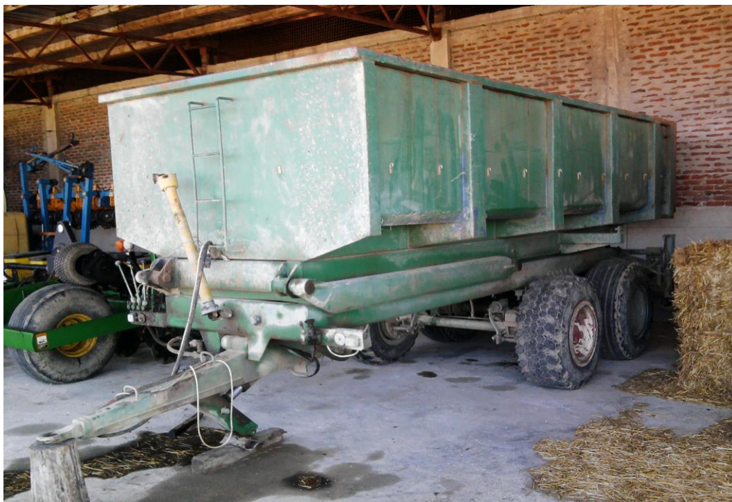
Slika 22. Prikolica "Tehnostroj PDU 10"