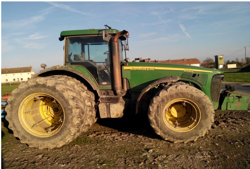
Slika 5. Vrlo teški traktor "John Deere 8520"