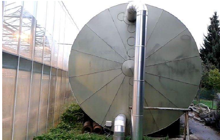
Slika 19. Spremnik za čuvanje tople vode