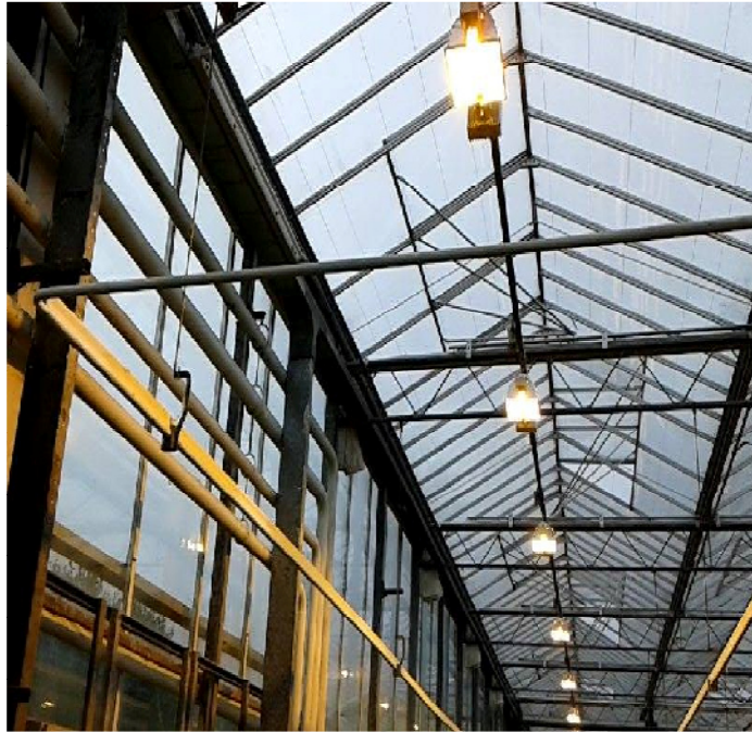
Slika 14: Asimilacijske lampe