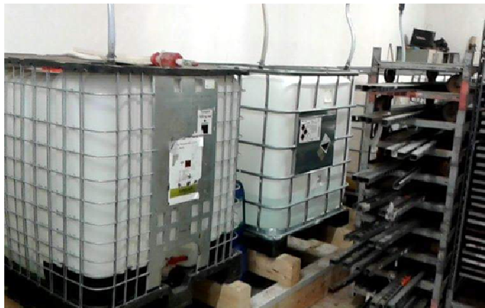
Slika 13. Makroelementi u plastičnim kontejnerima

Makroelementi (Slika 13) u tekućem obliku u Gartenbau Wallner se nalaze u plastičnim kontejnerima zapremnine 1000 litara, a mikroelementi se nalaze u praškastom obliku i u hranjivu otopinu se stavljaju u vrlo malim količinama.