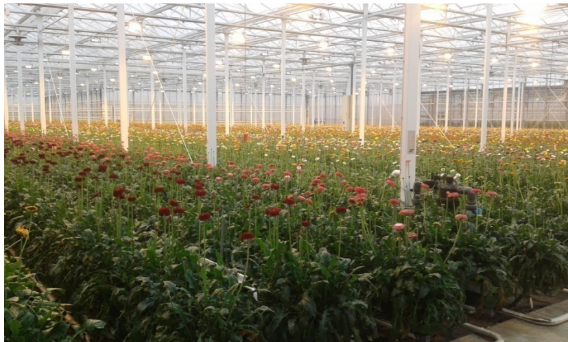
Slika 15: Asimilacijske lampe u gerberima