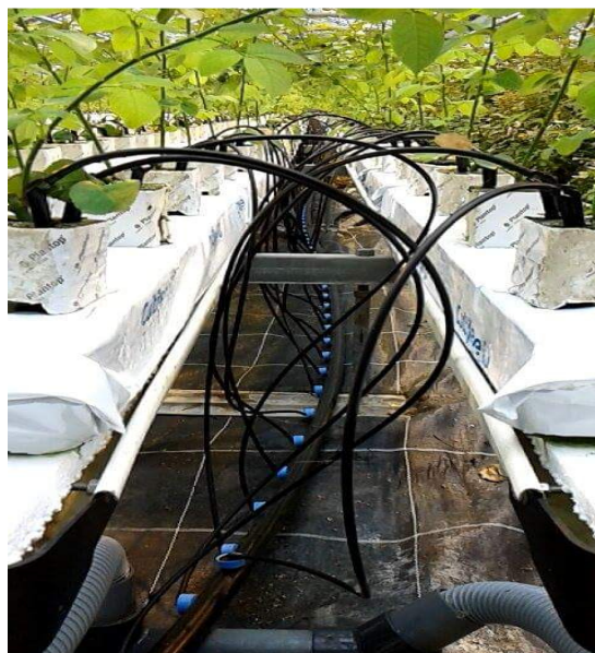
Slika 7. Kapajući ili drip sustav u uzgoju ruža

kapaljkom (cjevčica). U zatvorenom sustavu višak hranjive otopine koja otječe se vraća u spremnik za ponovnu upotrebu. Otvoreni sustav ne preuzima korištenu hranjivu otopinu.