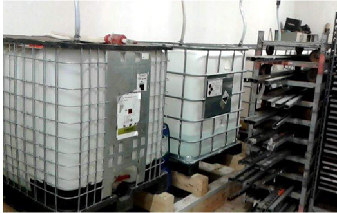
Slika 13. Makroelementi u plastičnim kontejnerima

Makroelementi (Slika 13) u tekućem obliku u Gartenbau Wallner se nalaze u plastičnim kontejnerima zapremnine 1000 litara, a mikroelementi se nalaze u praškastom obliku i u hranjivu otopinu se stavljaju u vrlo malim količinama.