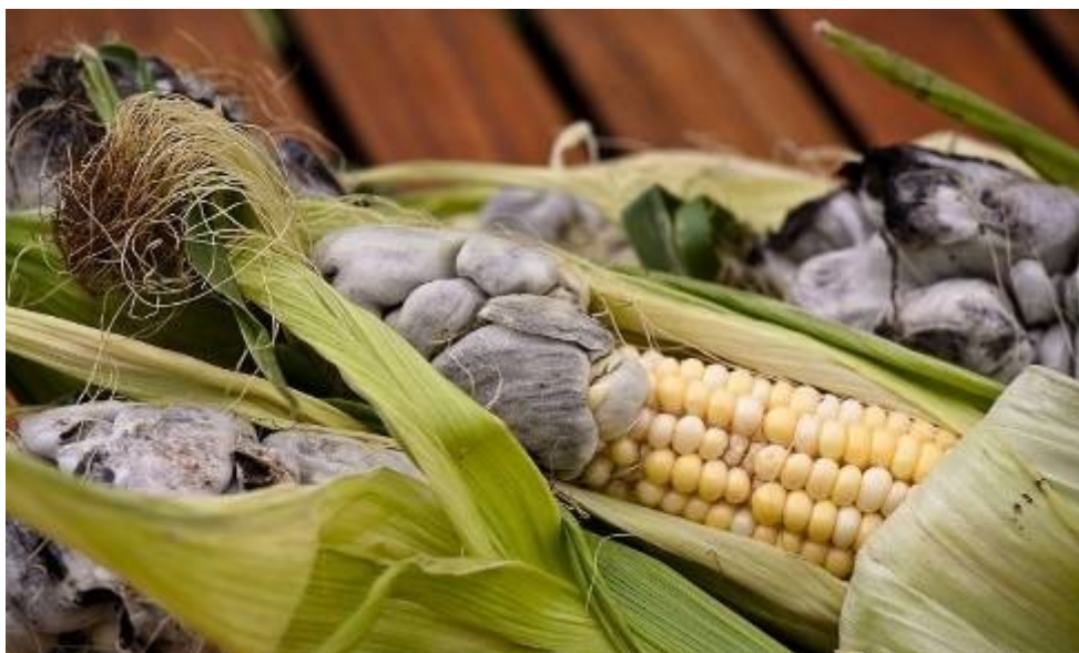
Slika 25. Ustilago maydis - na klipku kukuruza

Kod zaraženih biljaka javljaju se izrasline-tumori koji su puni spora. Izrasline su u početku svijetle boje (sivo-zelene), a kasnije dobiju tamnu sivu boju, raspuvacaju se i iz njih se oslobada crna praškasta masa spora.