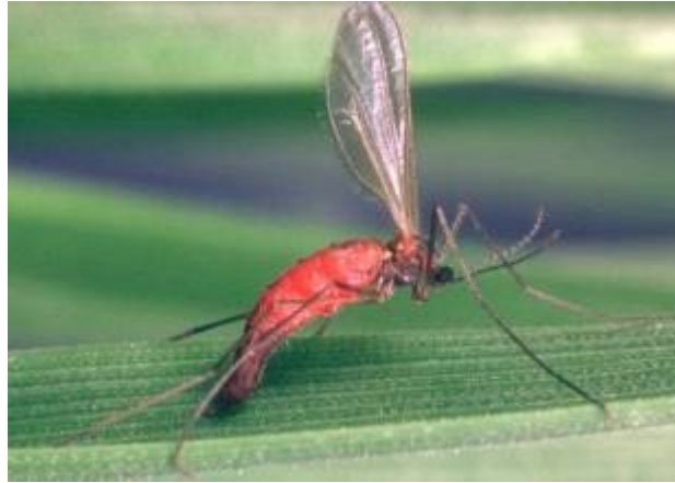
Slika 6. Sedlasta mušica