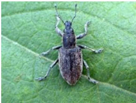
Slika 10. Tanymecus dilaticollis

lišće mladih biljaka kukuruza. Hrani se prije podne i navečer dok je za vrijeme lijepog vremena, preko dana, skrivena u pukotinama u tlu. Ne hrani se kada je vrijeme svježije te kada pada kiša.