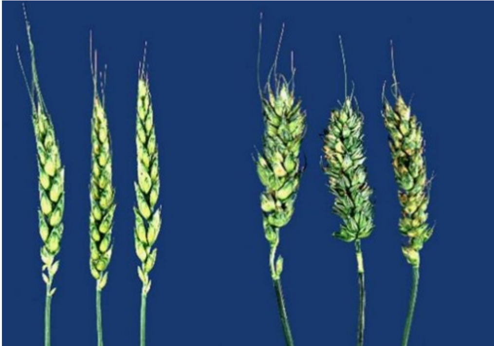
Slika 8. Zaražena pšenica (desno) i zdrava pšenica (lijevo)