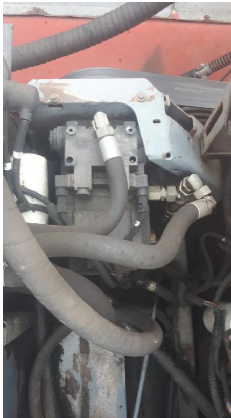
Slika 13. Prikaz pogonske hidro crpke kombajna „MF Cerea 7274“