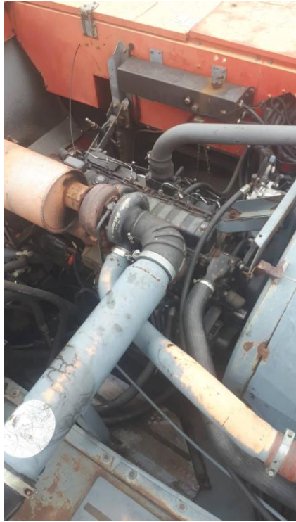
Slika 12. Prikaz motora „SISU VALMET“ kombajna „MF Cerea 7274“