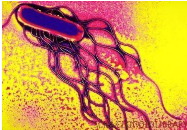
Slika 2. Salmonella spp. snimljena elektronskom mikroskopom

U većini zemalja Europske unije, najčešći nalaz kod gastroenteritisa ljudi čine S. enteritidis i S. typhimurium . Od ostalih serotipova koji se prilično često spominju kao uzročnici alimentarnih trovanja, najvažniji su: S. agona , S. hadar , S. heidelberg , S. infantis , S. newport , S. anama , S. saint-Paul , S. thompson i S. wirchow .