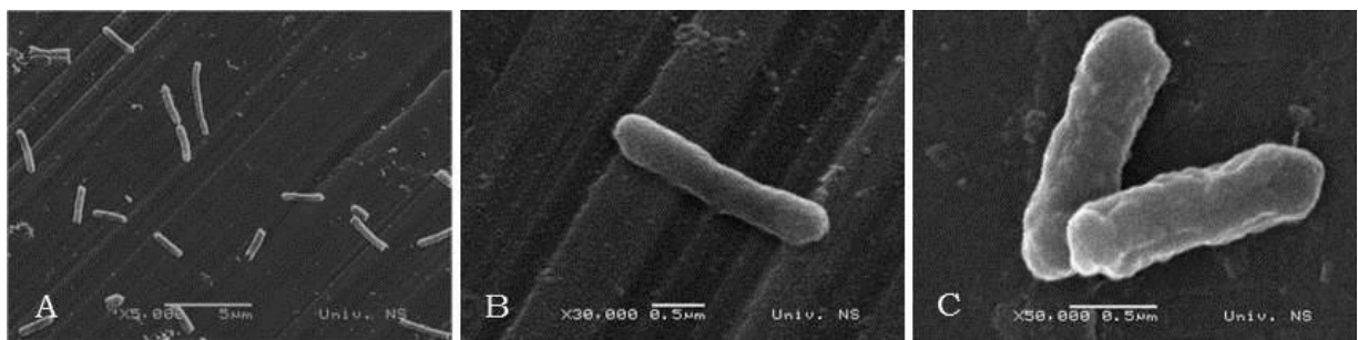
Slika 1. Scan elektronske mikrografije bakterije Salmonella enteritidis ; uvećanja 5.000x (A), 30.000 (B) i 50.000 (C). (Izvor: Čabarkapa, 2015.,str.4)

Salmonele su gramnegativni, fakultativno anaerobni, nesporogeni štapići širine od 0,7 do 1,5 \mu\text{m} , i dužine od 2 do 5 \mu\text{m} (Slika 1). One nemaju vidljivu kapsulu, te su sve osim S. gallinarum i S. pullorum pokretne, zahvaljujući peritrihijalno raspoređenim flagelama, a pojedini sojevi proizvode i fimbrije (Škrinjar, 2001.).