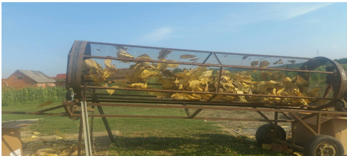
Slika 7. Otprašivanje duhana

Nakon što je završen proces sušenja duhana pristupa se otprašivanju duhana u separatoru (Slika 7.). Prilikom berbe duhana moguće je u sušaru na sušenje unijeti i korove, a posebno prašinu ili zemlju. Nakon što je duhan osušen pristupa se otprašivanju duhana kako bi se iz njega uklonile sve nečistoće i kako bi se mogao pravilno skladištiti. Otprašivanje se obavlja u separatoru za duhan. Nakon otprašivanja duhan se sortira po insercijama i kvaliteti te pakira u kutije te do otkupa skladišti u suhim, tamnim i prozračnim prostorima.