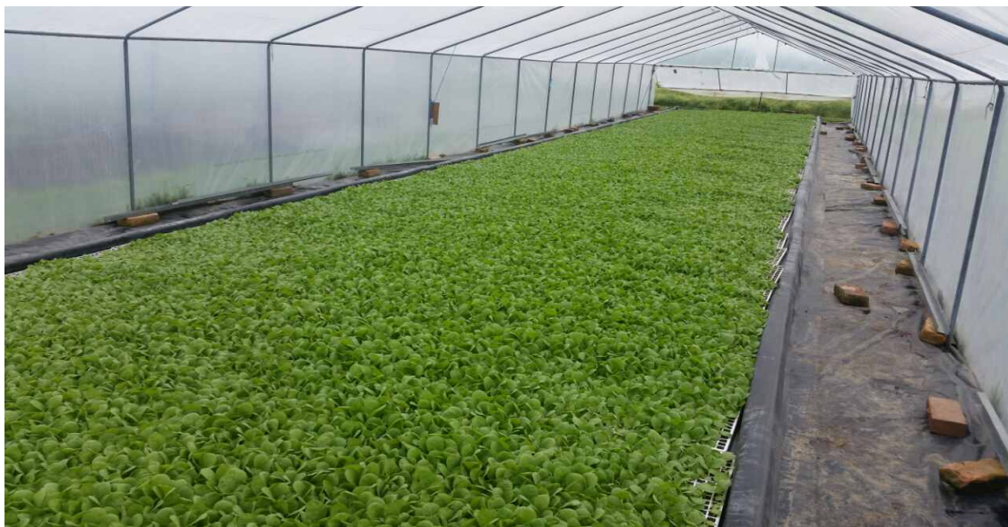
Slika 2. Uzgoj duhana u hidroponima

Oko bazena unutar hidropona sa jedne ili obje strane ostavlja se put širine pola metra (Slika 2.). Kod postavljanja konstrukcije hidropona treba voditi računa da ne bude izložen vjetru, te da je na ravnoj podlozi.