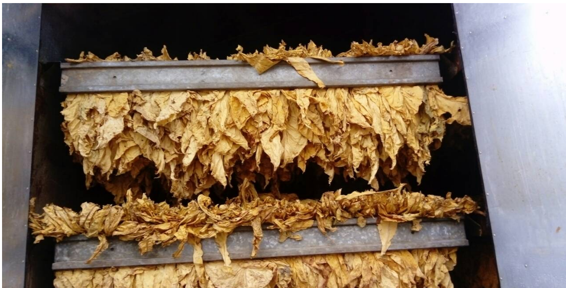
Slika 6. Duhan na kraju sušenja