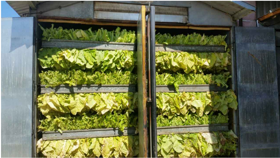
Slika 5. Duhan na početku sušenja (Izvor: Autor)