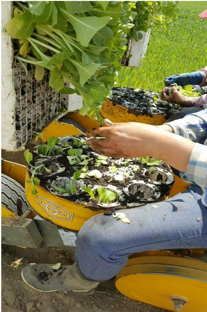
Slika 3. Sadnja duhana