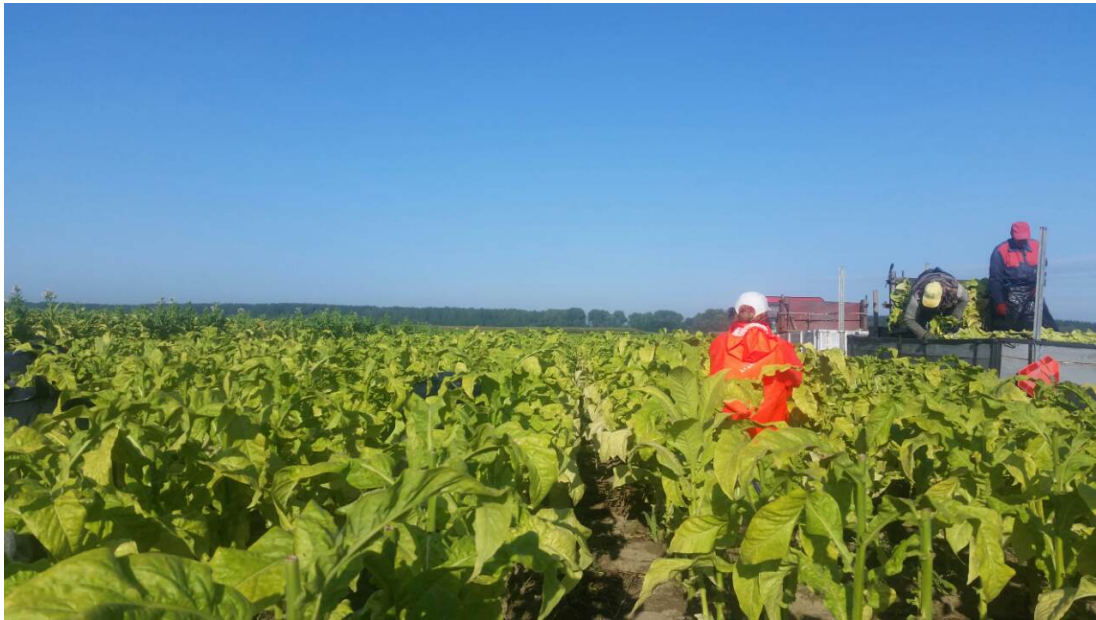
Slika 4. Berba duhana