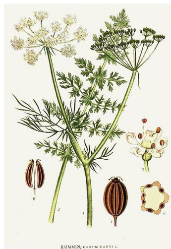
Slika 1. Kim ( Carum carvi L.)