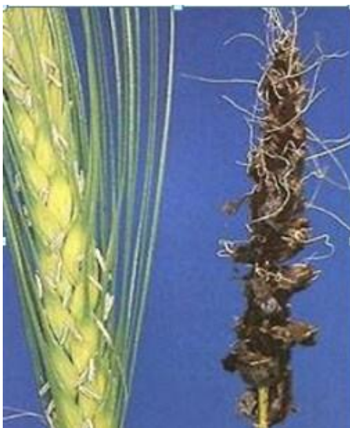
Slika 10. U potpunosti zahvaćen klas ječma

Suzbijanje - sjetva otpornih sorata, odstranjivanje snjetljivih klasova, što je efikasno kod uzgoja sjemenske pšenice. Sjetva tretiranog sjemena, aprobacija sjemenskih usjeva.