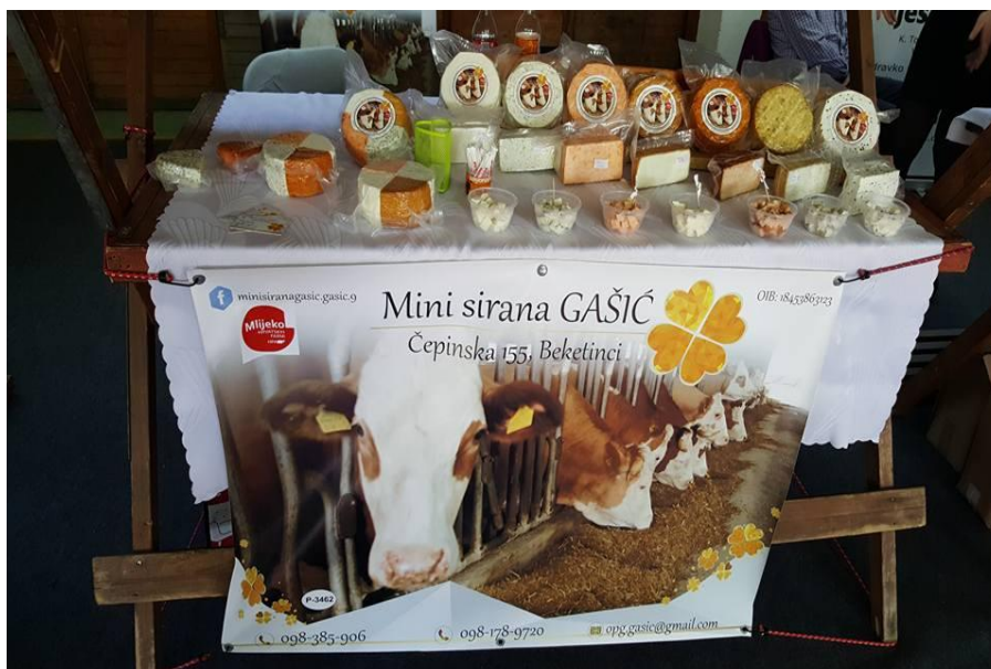
Slika 15. Mini sirana Gašić

Obiteljsko poljoprivredno gospodarstvo i mini sirana „Gašić“ nalazi se u selu Beketinci, u Osiječko-baranjskoj županiji, općina Čepin (Slika 15.). Na tom gospodarstvu obavljeno je dvogodišnje istraživanje s ciljem da se utvrdi pojava bolesti na ječmu u vegetacijskim godinama 2016./2017. i 2017./2018.