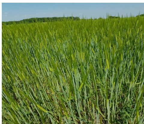
Slika 19. Ječam u vegetacijskoj godini 2016./2017.

Tokom čitave vegetacijske sezone, na ječmu je rađen stalni zdravstveni pregled. Tijekom čitavog rasta i razvoja ječma i do same žetve, nisu se uočile nikakve promjene u morfologiji ječma niti bilo kakva značajnija pojava bolesti. Sporadično na vrlo malom broju biljaka je uočena pepelnica. Ječam je u toj godini bio iznimno zdrav, a tome je zasigurno pridonijela preventivna zaštita s fungicidima.