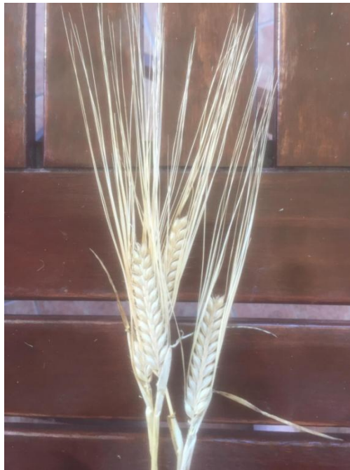
Slika 6. Klas ječma

Ječam u klasiću oblikuje samo jedan plodan cvijet, a drugi je zakržljao. Donja pljevica ječma nosi posije, pljevicae su srasle sa zrnom. Ječam je samooplodan i oplodnja se uglavnom odvija prije nego klas izađe iz zadnjeg rukavca lista.