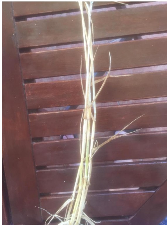
Slika 4. Stabljika ječma

Ječam može oblikovati i do 5 sekundarnih stabljika. Snaga busanja ovisi o kultivaru vegetacijskom prostoru, vremenskim uvjetima i agrotehnici.