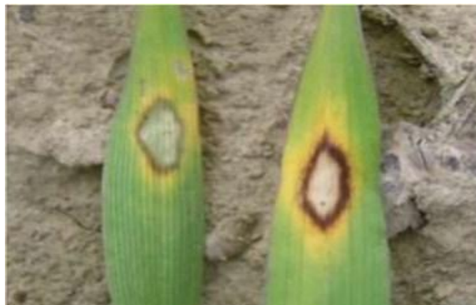
Slika 13. Pjege na listu ječma

Ova bolest je prvi puta opisana u Norveškoj 1880. Godine. Gubitci prinosa zrna mogu biti veći od 35%.