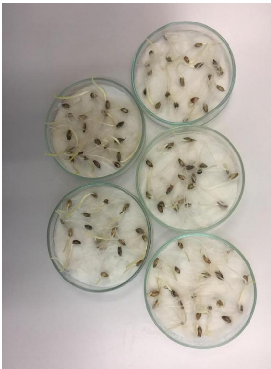
Slika 21. Zrna ječma nakon inkubacije

Zdravstvena analiza zrna je obavljena u laboratoriju Katedre za fitopatologiju nakon žetve. Nakon tjedan dana inkubacije zrna pregledom uz pomoć mikroskopa i lupe na zrnima ječma utvrđene su gljive iz rodova Alternaria , Epicoccum i Cladosporium (Slika 21.).