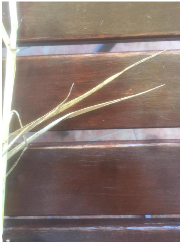
Slika 5. List ječma

Na prijelazu lisnog rukavca u lisnu plojku ječmam razvijene roščiće, koji obuhvaćaju stabljiku i prelaze jedan preko drugog, pa se prema tome svojstvu ječmam izrazito razlikuje od drugih žitarica. Prvi listovi nešto su širi, mogu biti malo ljubičasto obojeni.