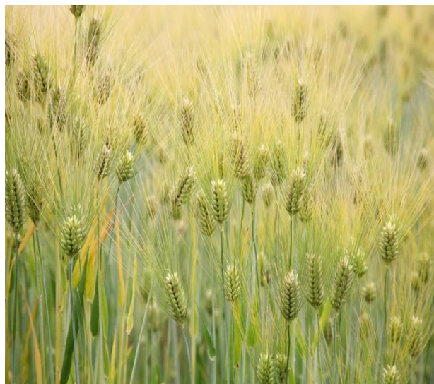
Slika 1. Ječam ozimac ( Hordeum vulgare ),

Neke od njegovih najpoznatih vrsta su stoklasica ili lukovičasti ječam ( H. bulbosum ) (Slika 2.), ječam dvoredac ( H. distichon ), muški ječam ( H. jubatum ), primorski ječam ( H. marinum ).