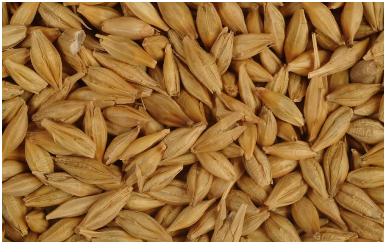
Slika 7. Zrno ječma

Dvoredni ječam ima veću masu i hektolitarsku težinu od šesterorednog ječma. Ječam ima ozime, jare i prijelazne forme i najkraću vegetaciju od svih žitarica. Vegetacijsko razdoblje jarog ječma traje 55 do 130, a ozimog 240 do 260 dana, a to ovisi o kultivarima, vremenu sjetve, klimatskim uvjetima i agrotehnici.