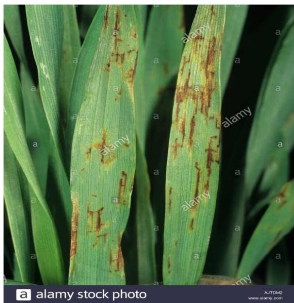
Slika 14. Mrežaste pjege na ječmu

Mrežasta pjegavost lista ječma je bolest koja je česta i raširena kod uzgajanih i divljih vrsta roda Hordeum , osobito ječma, u području umjerene klime, ali i u suhim područjima zapadne Australije. U Hrvatskoj je ova bolest redovito prisutna, osobito kada je proljeće vlažno. Tipičan simptom, po kojemu je bolest dobila ime, razvoj je malih tamnih pjega na plojci povezanih finom mrežom. Osim na plojci lista, simptomi mogu biti prisutni i na rukavcu, vlati i zrnu. Intenzitet zaraze ovisi o otpornost domaćina, patogenost uzročnika i okolinskim uvjetima. Prvi simptomi infekcije su male tamno smeđe pjege okruglog ili eliptičnog oblika. Pjege se s vremenom povećavaju, zahvaćaju tkivo između žila, a od njih dolaze uzdužne i poprečne linije koje stvaraju mrežu (Slika 14.). Preventivne i agrotehničke mjere značajno smanjuju intenzitet bolesti. To podrazumjeva plodored od najmanje dvije godine i zaoravanje biljnih ostataka, treba voditi računa i o gnojidbi. Pojačanom gnojidbom dušikom povećava se osjetljivost ječma na infekciju.