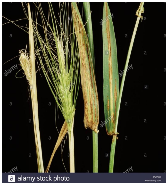
Slika 11. Prugavost ječma

Početakom 20. Stoljeća najraširenija i najštetnija bolest ječma. Pri jakim zarazama gubitci su 60-80 %. Što se tiče ove bolesti, više oboljeva ozimi od jarog ječma. Prvi simptomi se javljaju na mladim listovima, tamo nastaju svijetle pruge između žila lista. (Slika 11.). Kasnije tkivo nekrotira, a listovi se osuše. Kod jačeg napada klasovi tvore samo šturo zrno. Klasovi slabo klasaju ili su sterilni. Na odumrlom tkivu prugavog lista tvori se mnogo spora (konidije) ( Slika 12.), koje raznosi vjetar pa dospiju na klasove zdravih biljaka. Tu kliju, te ostaju između pljevica i zrna u stadiju mirovanja sve do sjetve. Gljiva se prenosi isključivo sjemenom.