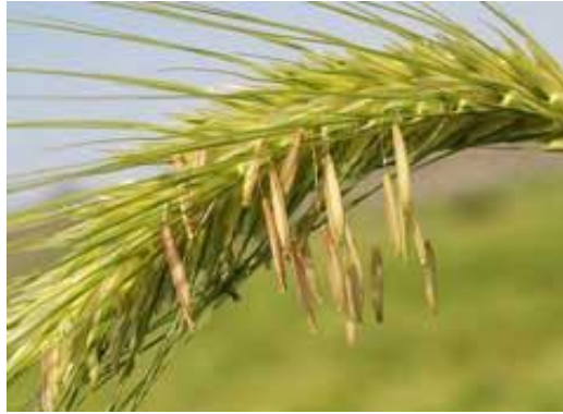
Slika 2. Lukovičasti ječam ( Hordeum bulbosum )