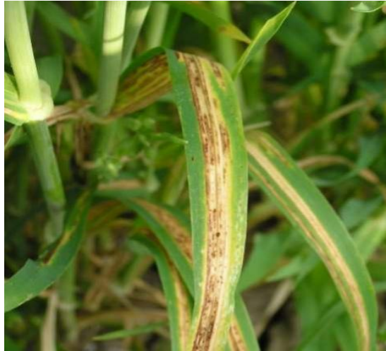
Slika 12. Prugavost na ječmu