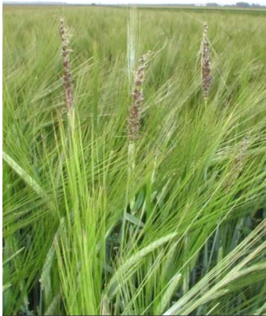
Slika 9. Ustilago nuda

Pošto zaražene biljke klasaju ranije, teliospore nosi vjetar na zdrave cvatuće klasove gdje one prokliju i rastu prema sjemenom zametku ostvarujući zarazu. Čim zaraženo zrno nakon sjetve proklije, u unutrašnjosti biljke raste gljiva zajedno sa zametkom budućeg klasa i razara ga u doba cvatnje tvoreći masu spora (teliospore).