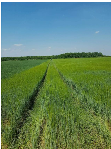
Slika 20. Ječam u vegetacijskoj godini 2017./2018.

Kroz cijelu vegetacijsku sezonu, obavljao se pregled zdravstvenog stanja ječma. Kako nije bilo značajnije pojave bolesti nije obavljen drugi fungicidni tretman.