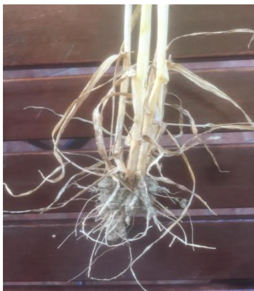
Slika 3. Korijen ječma

Korijen ječma je žiličast i sastoji se od primarnog i sekundarnog korijena (Slika 3.). Primarni korijen se sastoji od 4 do 8 korjenčića. Sekundarni korijenov sustav je slabo razvijen i ima male opojne snage. Među pravim žitaricama korijen ječma najslabije je razvijen i ima najmanje upojne moći. To nam govori da je potrebno osigurati bolje površine za proizvodnju.