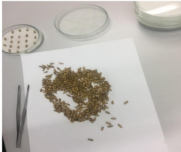
Slika 16. Zrna ječma

U laboratoriju smo za analizu zdravstvenog stanja uzeli zrna, te smo ih isprali da se površinska nečistoća makne (slika 16.), zatim smo Petrijeve zdjelice raširili po stolu i u donji dio zdjelice smo stavili 3 filter papira, a u gornji dio zdjelice 2 filter papira, svaki smo filter papir namočili vodom. Za analizu zdravstvenog stanja ječma koristili smo 20 zrna po ponavljanju (slika 17.). Ispunjene petrijevke sa zrnima ječma stavili smo u komoru na 7 dana (Slika 18.).