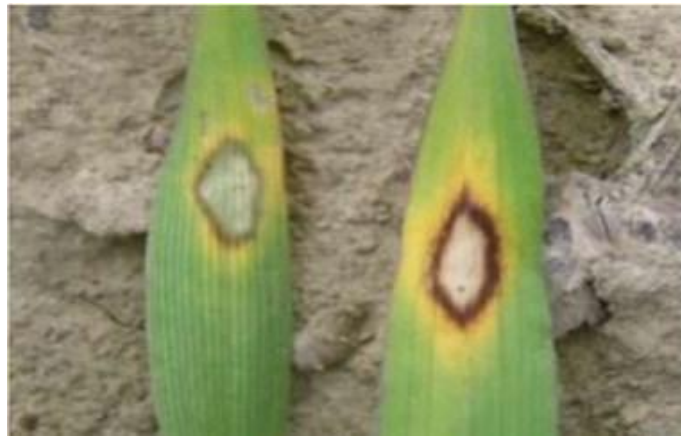
Slika 13. Pjege na listu ječma

Ova bolest je prvi puta opisana u Norveškoj 1880. Godine. Gubitci prinosa zrna mogu biti veći od 35%.