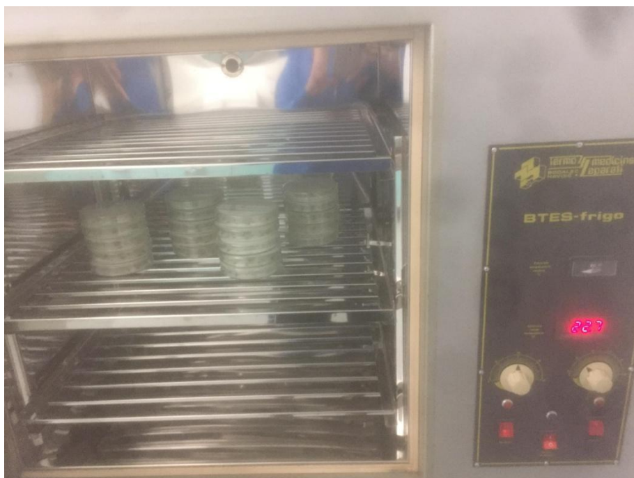
Slika 18. Komora