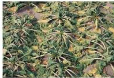
Slika 3. Izgled sjetve repe u suši

Za klijanje je potrebno više od 200% vode od težine sjemena zbog debljine pilete (120-170% od golog sjemena). Da bi proizvodnja bila uspješna, dovoljno je 600 mm ukupnih godišnjih oborina, a tijekom vegetacije je potrebno oko 350 mm. Potrebe za vodom ovise o toplini.