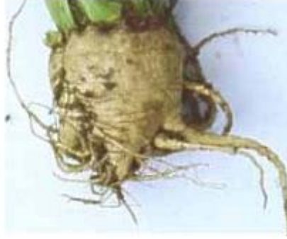
Slika 2. Razvoj korijena repe u vlažnom tlu

Izvor: http://repa.hr/wp-content/uploads/2014/03/PrirucnikRepa.pdf