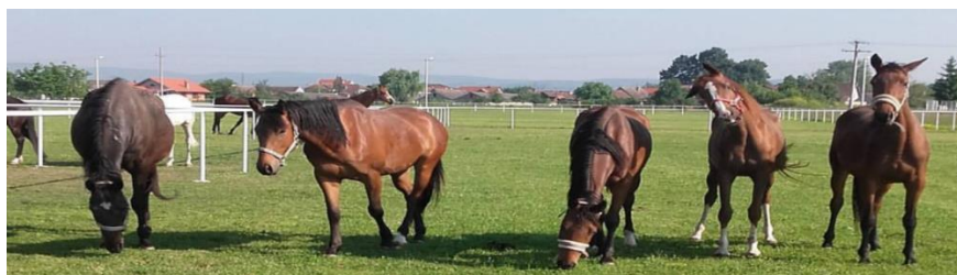
Slika 3. Konji na ranču „Marin“ (Perković, 2017.)

Što se mladih konja tiče, najprije moraju sa svojim jahačem položiti ispit iz dresurnog jahanja da bi se tek onda mogli natjecati. Na ranču „Marin“ svaki jahač ima svog konja, a odabiru se ovisno o poslušnosti i izvršavanju zapovijedi jahača. Važno je da konj prihvati jahača kao vođu, ali i obrnuto jer je međusobna interakcija najvažnija. S konjem se počinje intenzivno raditi od treće godine starosti, s tim da je on od najranije dobi socijaliziran - naviknut na ljude, povodac, ular, žvale, čišćenje kopita, lonžu. Svakodnevna rutina za konje na ranču „Marin“ započinje jutarnjim hranjenjem koje traje oko sat i pol. Nakon hranjenja, konje se pušta iz boksova na ispuste (Slika 3.), a nakon toga slijedi trening. Konji se potom odmaraju. Popodne se timare, neki sudjeluju u školi jahanja, neki treniraju u vodi. Navečer se uvode u boksove te hrane i napajaju (izvor: djelatnici ranča „Marin“).