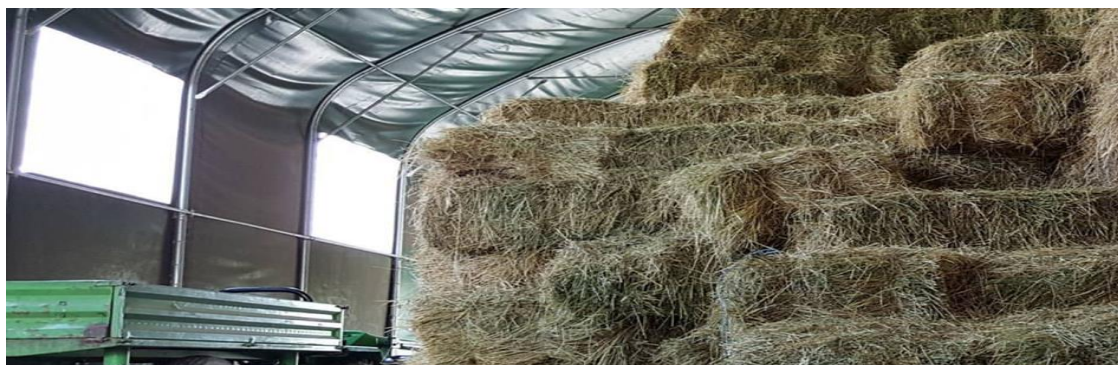
Slika 6. Hala sa sijenom na ranču „Marin“ (Perković, 2017.)