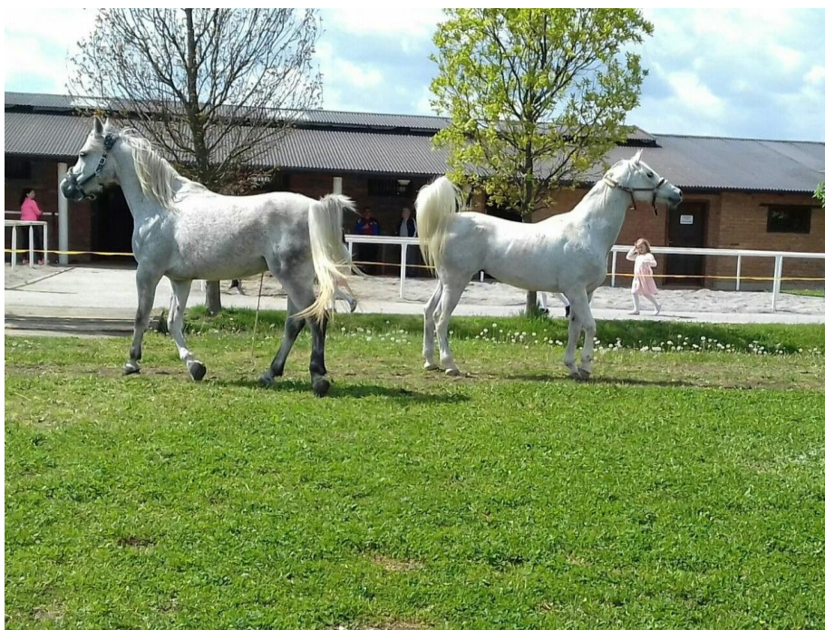
Slika 4. Arapski konji u vlasništvu ranča „Marin“ (Perković, 2017.)

Odabir konja u konjičkom klubu „Ramarin“ najbolje opisuje primjer uvoza arapskih pasmina konja. Svi koji i malo poznaju konje i konjički sport, kada je u pitanju daljinsko jahanje, znaju da su arapske pasmine konja najbolji odabir za taj sport (Slika 4.). Što zbog njihove brzine i izdržljivosti, što zbog njihove građe i dobro razvijenih pluća i srca. Što se tiče vlastitog uzgoja, za natjecanja su im na raspolaganju trakheneri s kojima se radilo od malih nogu. Stoga, svaki uspjeh konja uzgojenog i treniranog u konjičkom klubu „Ramarin“, svakako je uspjeh za članove i vodstvo kluba koji su nakon dugogodišnjeg rada i uloženog truda došli do cilja (izvor: djelatnici ranča „Marin“).