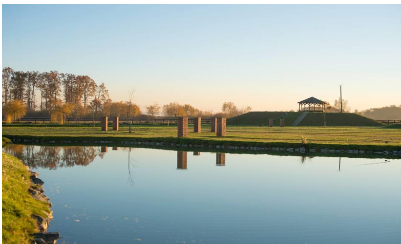
Slika 14. Jezero na kojemu je moguće pecati

Za one koji imaju želju naučiti jahati, mogu to i ostvariti u školi jahanja. Izabrani konji, mirni i staloženi, uz vrhunske trenere dobitna su kombinacija za svakog budućeg jahača (Slika 15.).