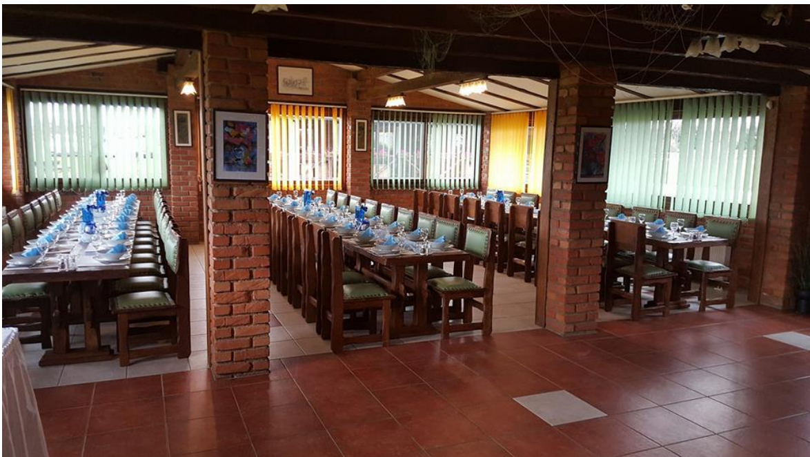
Slika 13. Klet za razne prigodne

Ako je pak riječ o većem slavlju, na raspolaganju je „klet“ kapaciteta za 80 ljudi, pogodna za proslave kao što su zaruke, krštenje, rođendani, itd. (Slika 13.).