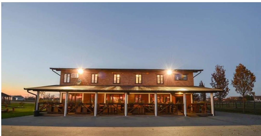
Slika 11. Restoran, prenoćište i caffe-bar ranča „Marin“

U sklopu ranča nalazi se caffe bar i restoran s velikom terasom u kojem se može uživati na svježem zraku i u prirodi. Izgrađen je od prirodnih materijala tako da bi se što bolje uklopio uz okolni krajolik, a pritom ipak bio moderan i funkcionalan. Dok odrasli uživaju u toplom obroku i piću, djeca se zabavljaju u „zabavnom parku“ na kojemu se nalaze trampolin, ljujačke, tobogan i sve ostalo namijenjeno najmlađima. Ako se popije koja čašica više, posjetiteljima je na raspolaganju pansion koji broji 40 ležajeva (Slika 11.).