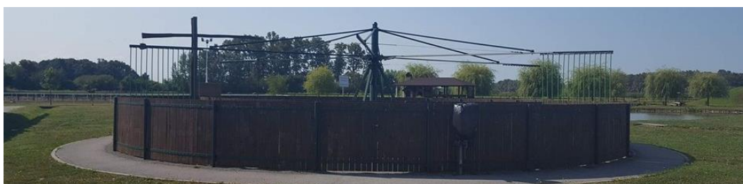
Slika 8. Šetalica za trening konja (Perković, 2017.)

Konji na ranču „Marin“ nakon napornog treninga mogu se opustiti u šetalici. Šetalica je mehanička sprava koja konja vodi u krug te mu omogućava da se stalno kreće. Na taj se način konji mogu ohladiti nakon treninga te mu se mišići postupno hlade i opuštaju. Šetalica također služi kao lagani trening zimi, kada se konji odmaraju za nadolazeću sezonu. Konji u šetalici treniraju svaki dan, 20 minuta. Tako im se održava kondicija te ih se lagano uvodi u pripreme koje su kasnije sve intenzivnije (Slika 8.) (Podaci trenera konjičkog kluba „Ramarin“).