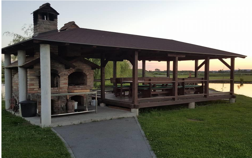
Slika 12. Sjenica s roštiljem i krušnom peći

Ako je pak riječ o većem slavlju, na raspolaganju je „klet“ kapaciteta za 80 ljudi, pogodna za proslave kao što su zaruke, krštenje, rođendani, itd. (Slika 13.).