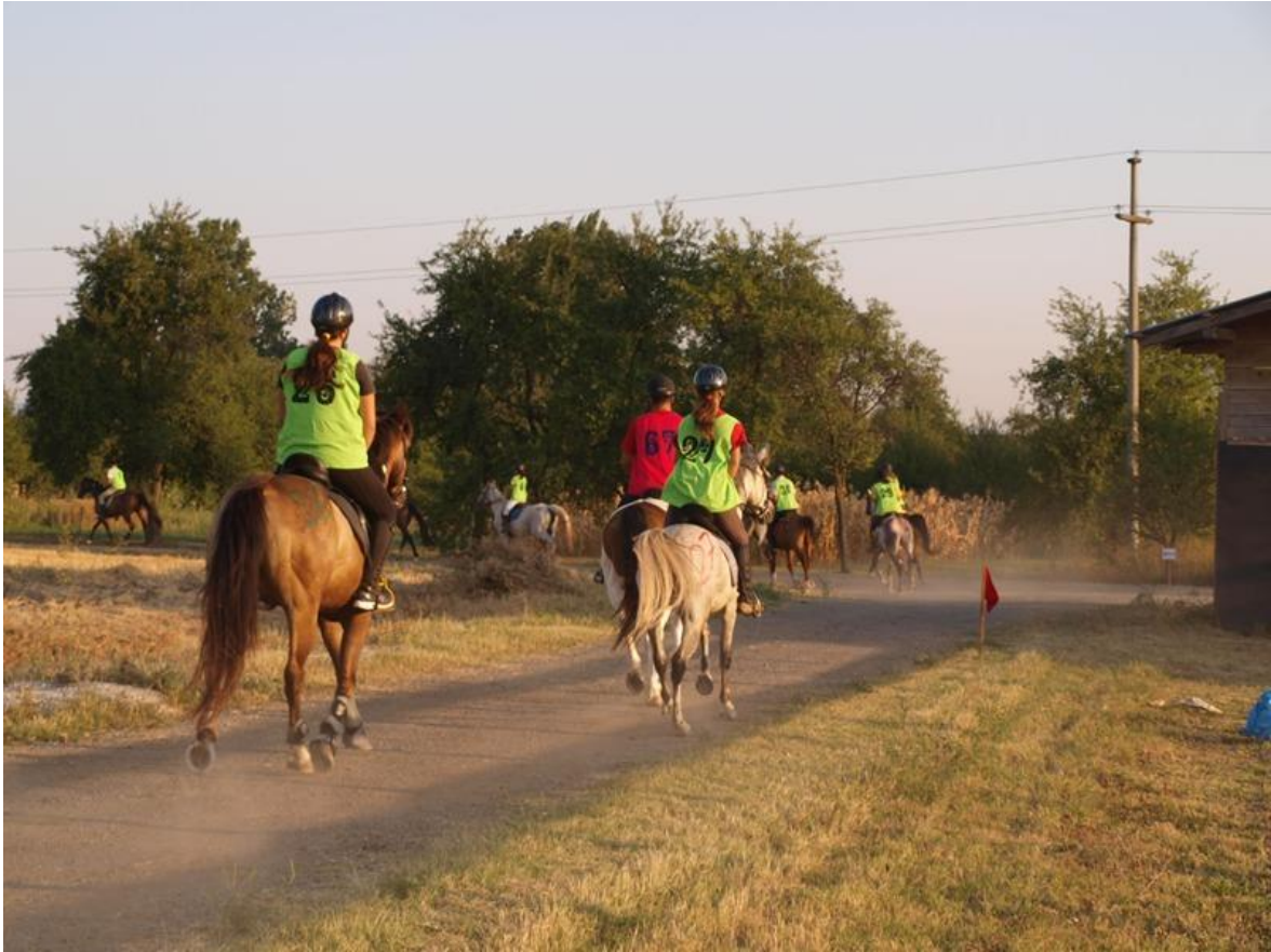
Slika 1. Početak endurance utrke na 80 km na ranču „Marin“ u Garčinu