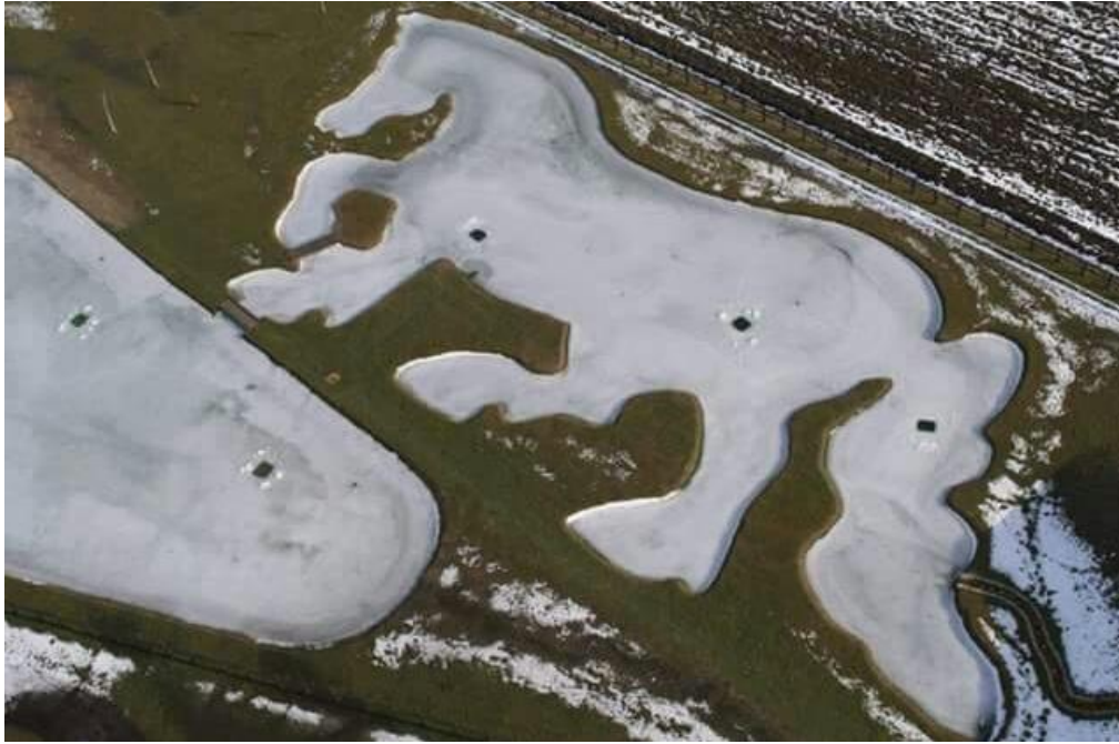
Slika 2. Jezero u obliku konja na ranču „Marin“