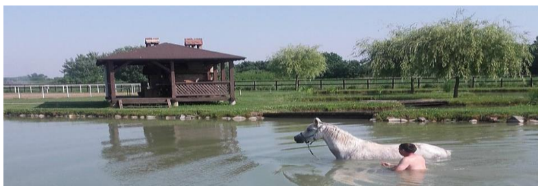
Slika 7. Trening konja u vodi (Perković, 2017.)

vodi tijelo lakše, teže se kreće. Nakon toga se na dubini manjoj od 1 m obavlja trening od 5 minuta kasom zbog jačanja mišića i tetiva nogu konja (Mišanec, 2012.).