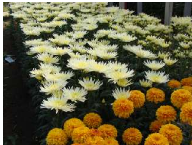
Slika 10. Špine i loptice ostavljene na 1 vrh