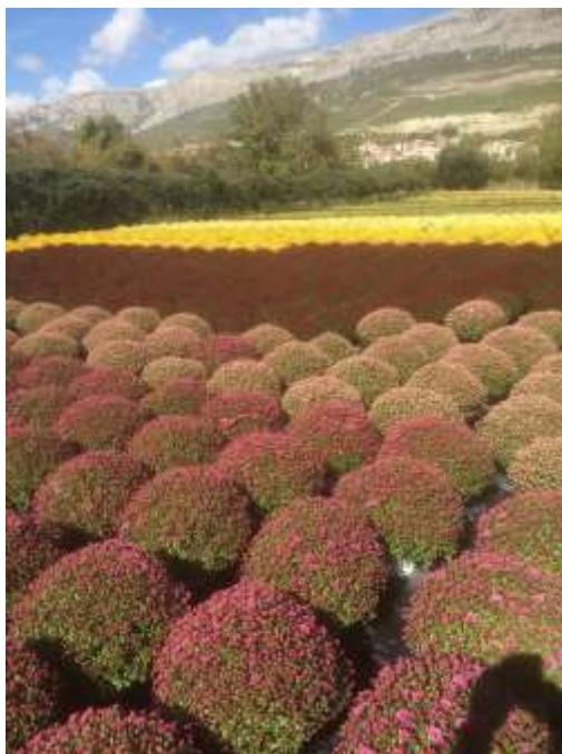
Prilog 1. Multiflora na otvorenom, Split