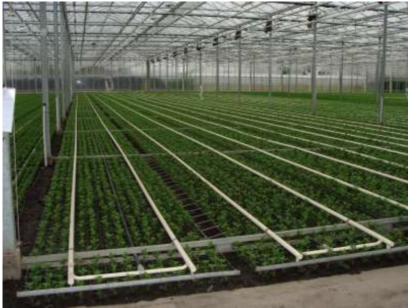
Slika 3. Sadnja krizanteme