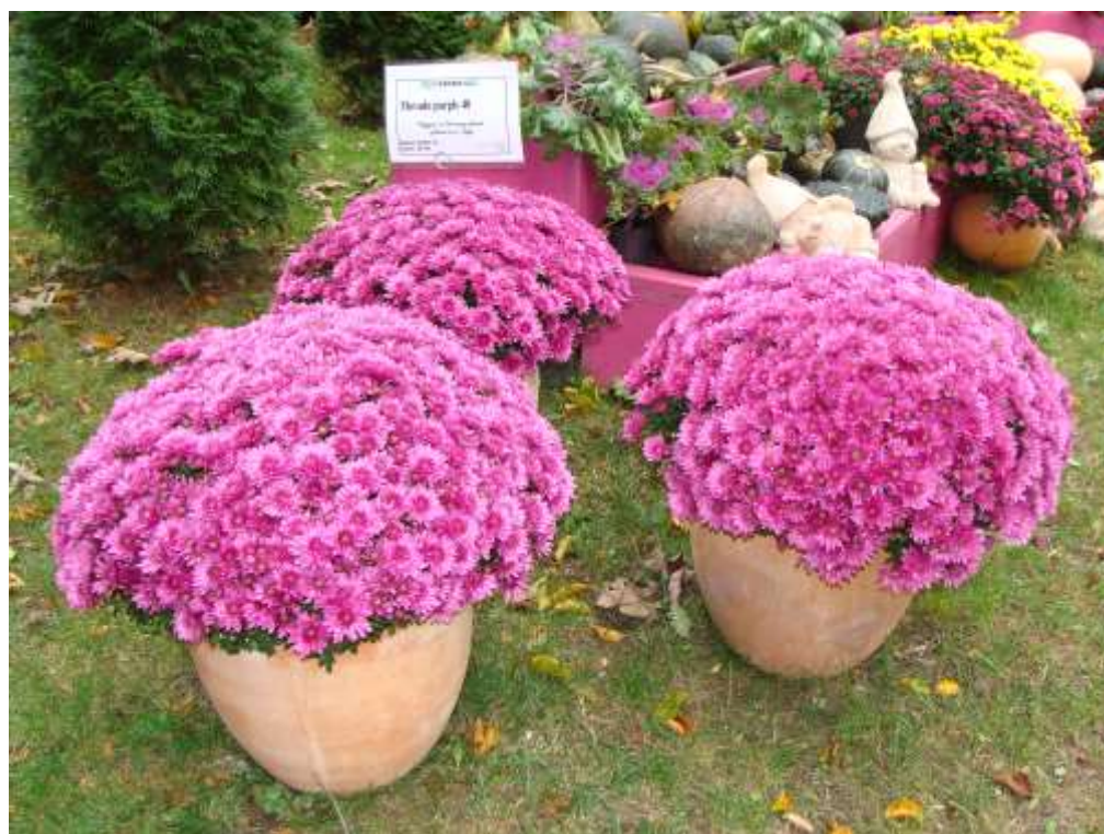
Slika 19. Multiflora, sorta Movado purple 40