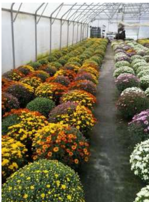
Slika 17. Cvjetanje multiflore u zaštićenom prostoru