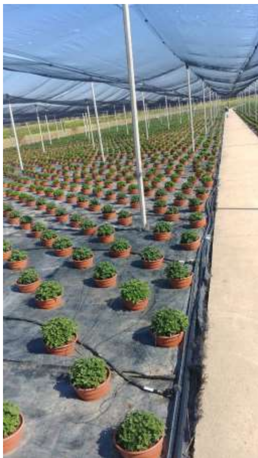
Slika 14. Raspored zdjela