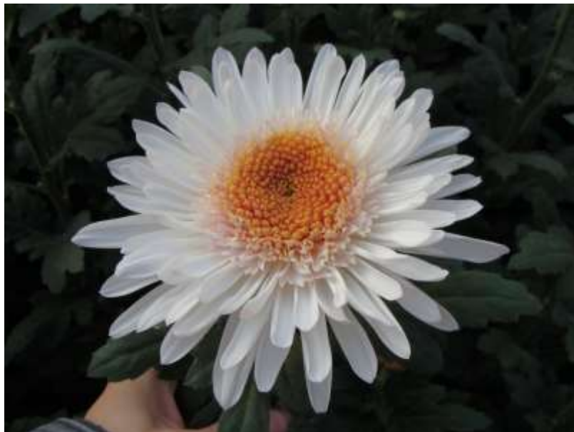
Slika 12. Margareta ostavljena na 1 vrh