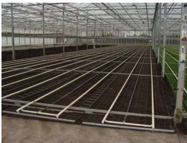
Slika 2. Priprema zemljišta za sadnju krizantema

Biljke se sade ručno i pojedinačno na gredice koje na otvorenom trebaju biti širine 1,20 m, a u plasteniku 1,25 m. Na otvorenom se pravi 5-6 redova, a među biljkama je razmak 25x25 cm ili 15x20 cm (krupnocvjetni kultivari) tako da je sklop biljaka 16-30 biljaka/m 2 . Kod sitnocvjetnih kultivara gustoća sklopa je 44 biljke/m 2 (Capan, 2006). U plasteniku se prije sadnje na gredice postavlja mreža sa rupama veličine 12,5x12,5 cm koja se pomoću nosača diže kako biljke rastu iz razloga da ne dođe do polijeganja. Sadnjom biljaka u svaku ili svaku drugu rupu određuje se broj redova na gredici i razmak između biljaka u redu. Takvim rasporedom sadnje dobiva se oko 45 biljaka/m 2 krupnocvjetnih kultivara i do 55 biljaka/m 2 sitnocvjetnih kultivara. Sade se plitko, jer je krizantema biljka koja plitko razvija korijen, a u površinskom sloju ima dovoljno kisika za rast korijena i rad mikroorganizama (Parađiković, 2018.).