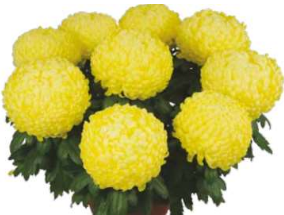
Slika 24. Žuta lončanica sa 9 glava