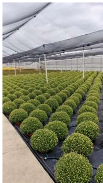
Prilog 4. Multiflora, Doljan