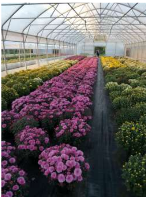
Slika 18. Cvjetanje multiflore u zaštićenom prostoru