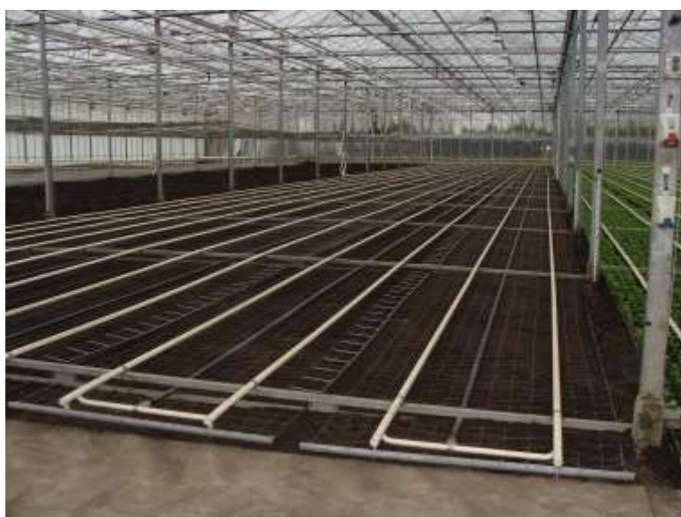
Slika 2. Priprema zemljišta za sadnju krizantema