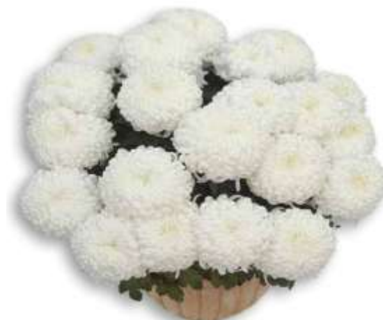
Slika 21. Krupnocvjetna lončanica, bijela