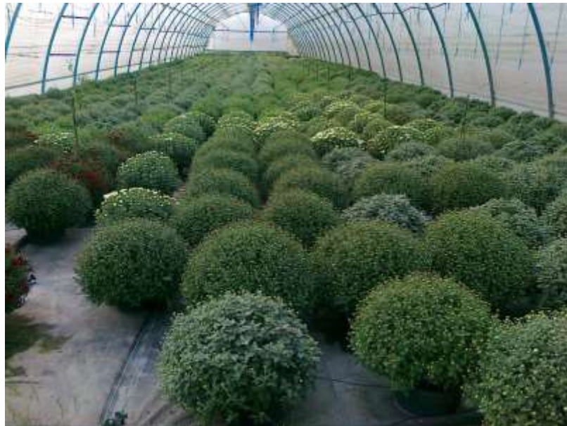
Slika 15. Proizvodnja multiflore u zaštićenom prostoru

Zaštita i razmnožavanje se provode isto kao kod krizanteme za rez.