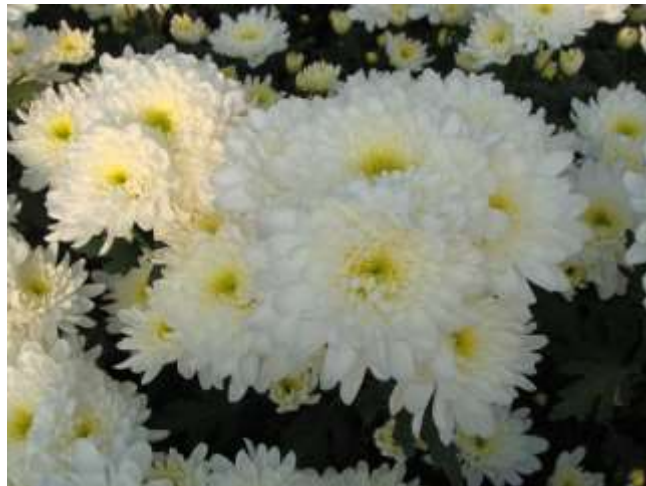
Slika 9. Margareta pincirana na više vrhova