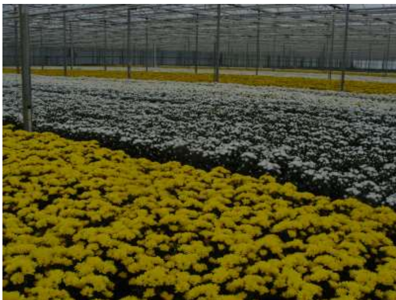
Slika 5. Margarete