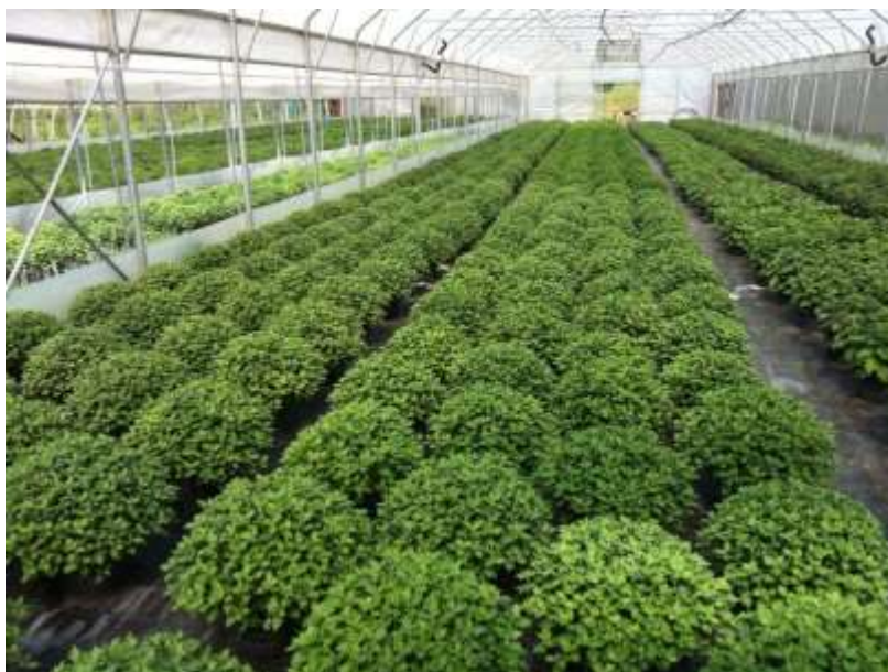
Slika 16. Proizvodnja multiflore u zaštićenom prostoru