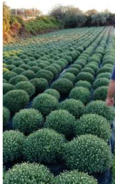
Prilog 2. Multiflora na otvorenom, Split