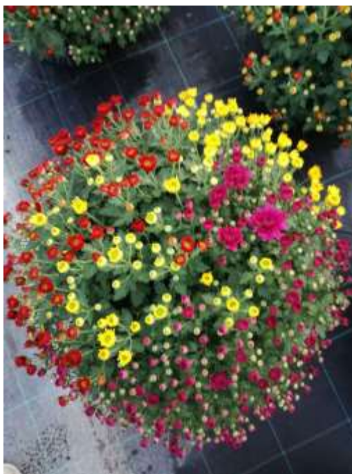
Slika 13. Multiflora

Osnovna odlika multiflore je okrugla, loptasta forma, promjera 15-80 cm (ovisno o veličini tegle, vremenu sadnje, broju sadnica u tegli itd.) s puno cvjetova koji mogu biti različite boje.