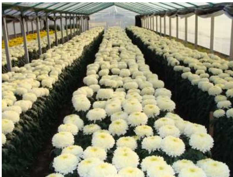
Slika 6. Shoemith may uzgojen na 1 vrh