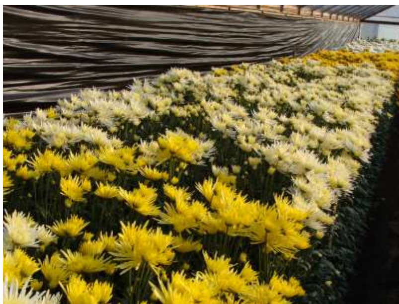
Slika 7. Špine pincirane i uzgojene na više vrhova