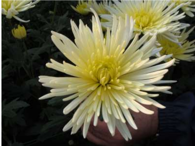
Slika 11. Špina ostavljena na 1 vrh