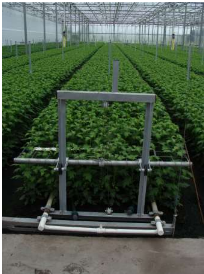
Slika 4. Podizanje mreže