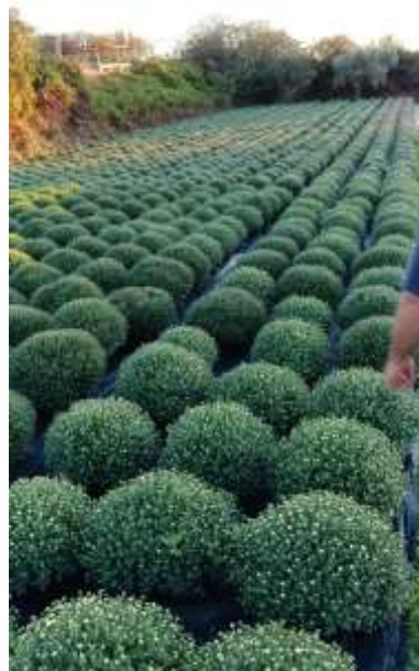
Prilog 2. Multiflora na otvorenom, Split