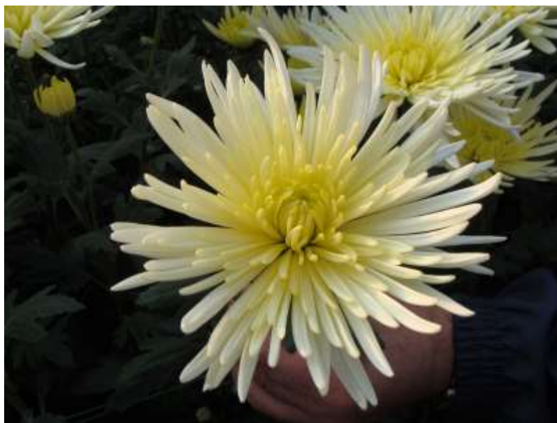
Slika 11. Špina ostavljena na 1 vrh