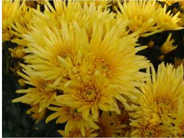
Slika 8. Špina pincirana na više vrhova