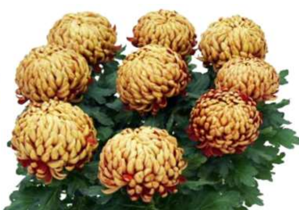
Slika 25. Lončanica boje starog zlata s 9 glava