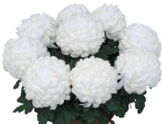
Slika 22. Bijela lončanica sa 9 glava

Ukoliko se žele dobiti jako krupne glave, pinciranje se ne radi, nego se uzgaja po sistemu jedna sadnica – jedna glava (cvijet) i tom slučaju treba paziti da se pri sadnji posadi više sadnica (ovisno koliko se glava želi dobiti).