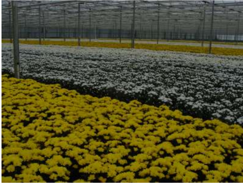
Slika 5. Margarete