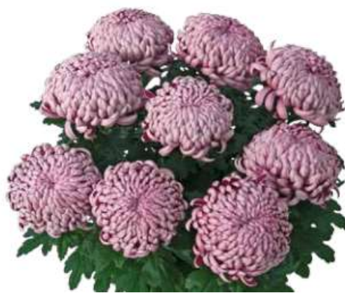
Slika 23. Ljubičasta lončanica sa 9 glava