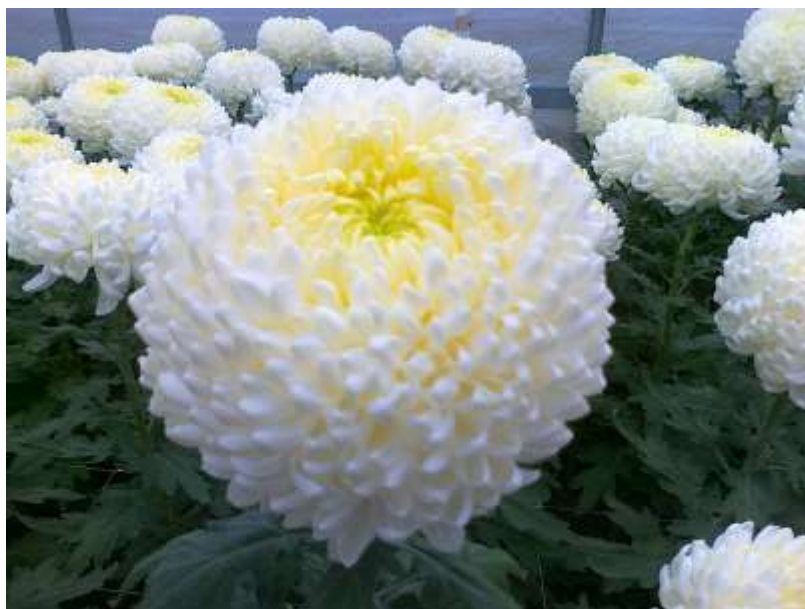
Slika 1. Shoesmith may

Krizantemu su prvo uzgajali u Kini kao biljke cvjetnice još od 15. stoljeća prije Krista. Više od 500 sorata zabilježeno je do 1630. godine. U Japan je prenesena početkom 8. do 12. stoljeća, a popularnost je dobila početkom 17. do 19. stoljeća. Oblikovani su mnogi cvjetovi, raznih boja i oblika. Način na koji su cvjetovi uzgojeni i oblikovani također se razvijao, kao i kultura krizantema. Brojni festivali održavaju se diljem Japana u jesen kada cvjetaju krizanteme. Dan krizantema (菊の節句 Kiku no Sekku) jedan je od pet drevnih sakralnih festivala. Slavi se 9. dana 9. mjeseca. Pokrenut je 910., kada je carski sud održao prvu krizantemsku predstavu ( https://en.wikipedia.org/wiki/Chrysanthemum ). Još i danas, Kinezi i Japanci su najveći i najuspješniji proizvođači. Krizantema je prenesena u europsku kulturu u 17. stoljeću. Neke europske zemlje dale su cvijetu izrazito drugačije značenje, prihvaćajući ga kao simbol smrti, koristeći ga za sprovode i grobnice ( http://libguides.nybg.org/chrysanthemumform ). Danas se kod nas najviše proizvodi krizantema za rez i lončanica krizantema te se proizvodi za dan Svih svetih.