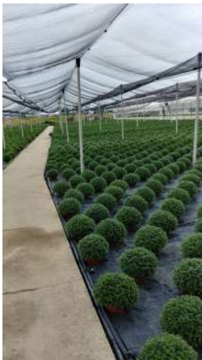
Prilog 3. Multiflora, Doljan