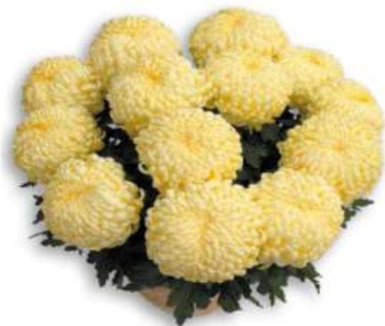
Slika 20. Krupnocvjetna lončanica, krem

Krupnocvjetna lončanica izgledom cvijeta slična je kultivarima Shoemith. Osnovna razlika je u tome što se uzgaja u zdjelama većega promjera i proizvodi se način da se dobije niska biljka sa više glava (cvjetova). Boja cvijeta može biti bijela, žuta, ljubičasta, staro zlato, krem. Oblik glavice cvijeta može biti takav da su sve latice lijepo uvijene prema središtu i čine pravilnu okruglu glavu, a ima sorti kod kojih se latice ne uvijaju skroz prema sredini glavice pa cvijet izgleda kao da je „čupav“. Kod svih sorti, cilj je dobiti kompaktnu biljku sa više cvjetova.