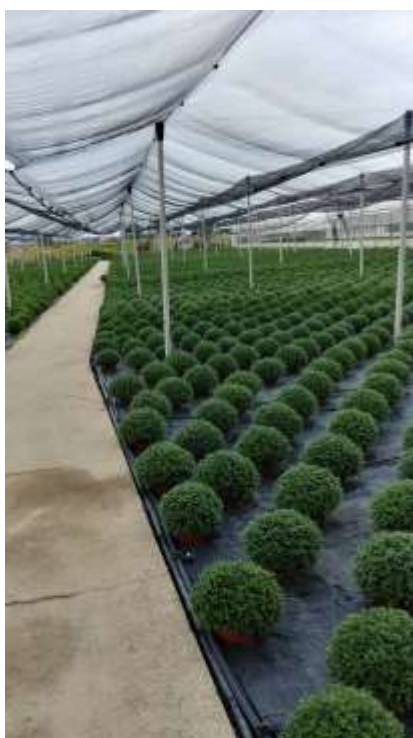
Prilog 3. Multiflora, Doljan