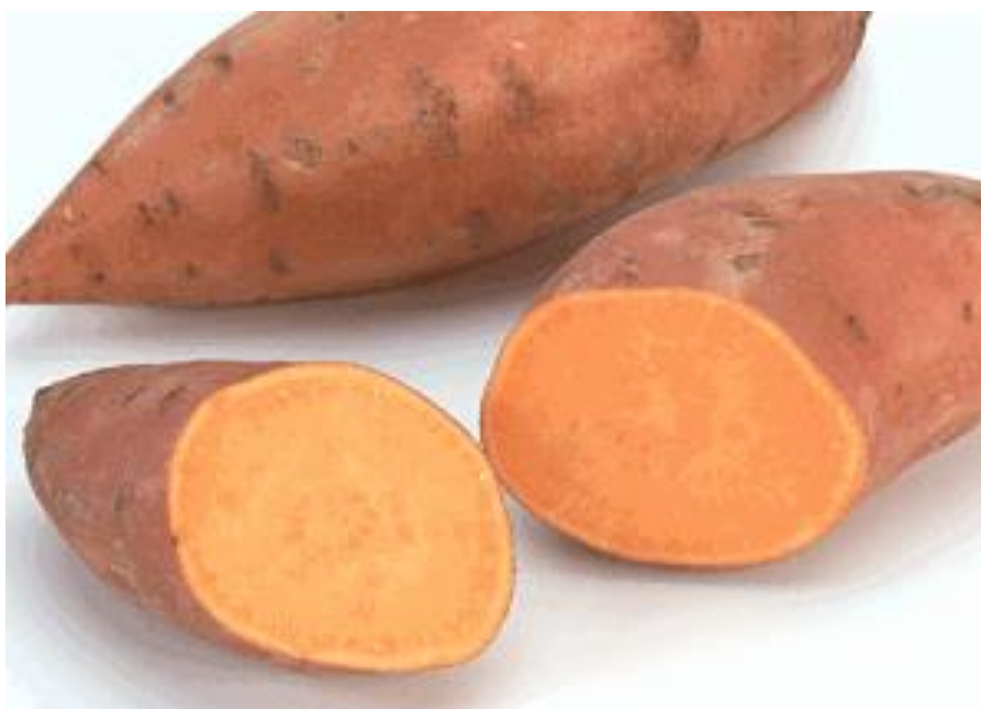
Slika 1. Batat

Masovno se uzgaja i konzumira u Americi, Africi i Aziji, a od nedavno i u Europi. U Hrvatskoj je batat gotovo posve nepoznat, te je njegova proizvodnja tek u začetku (Bušić i sur., 2013.). Najveći svjetski proizvođači su: Kina (80% svjetske proizvodnje), Indonezija i Uganda (FAOSTAT, 2018.).