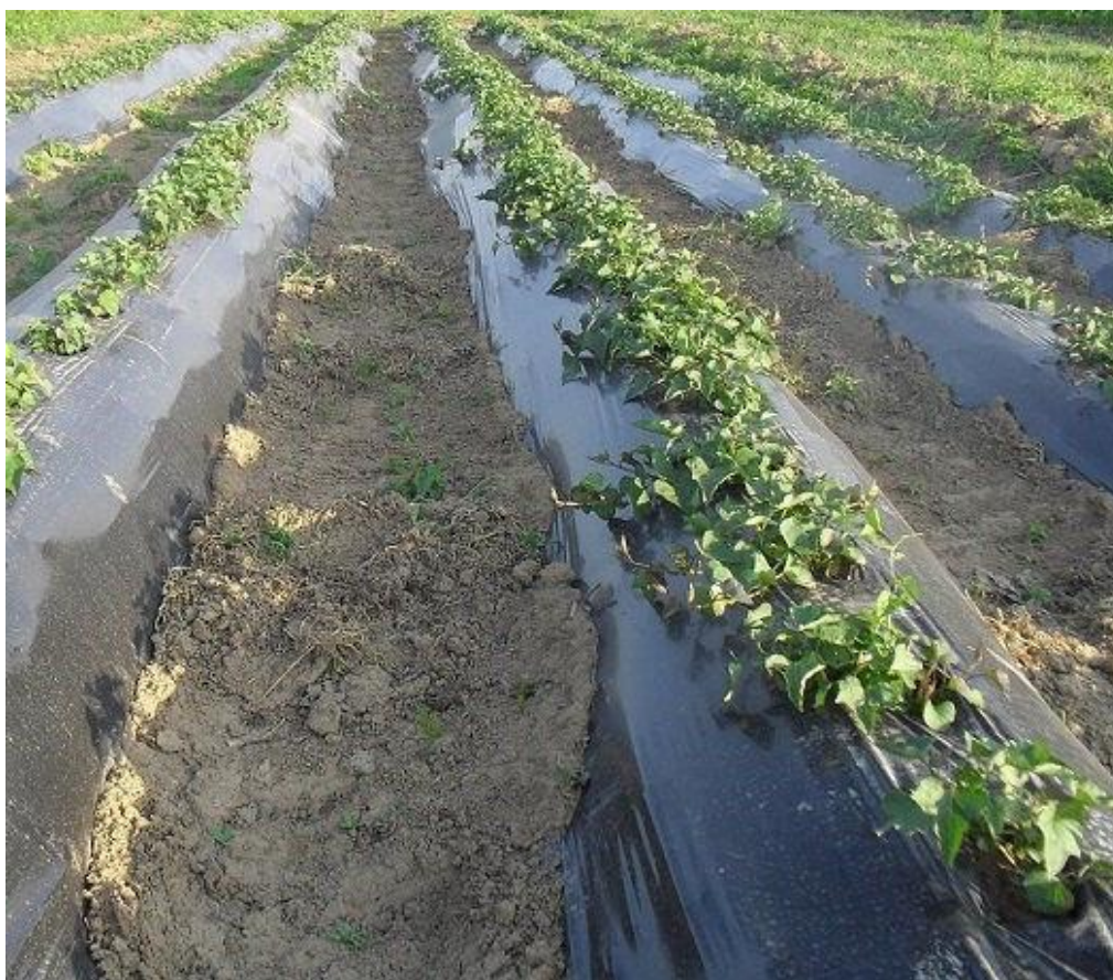
Slika 3. Nasad batata

Batat se uzgaja iz presadnica (Slika 2). Sade se u polje oko 15. svibnja u kontinentalnom dijelu, te oko 15. travnja u mediteranskom dijelu Hrvatske, uz uvjet da je temperatura tla viša od 10°C. Sadi se ručno ili strojno sadilicama. Presadnice se najčešće sade na 120 x 30 - 40 cm razmaka. Time se postiže sklop od 20.000 do 27.000 biljaka po hektaru. Sadi se na uzdignute gredice uz uporabu PE filma. Pri ručnoj sadnji, nakon postavljanja PE filma, potrebno je izbušiti sadna mjesta i pri tome paziti da se ne oštete postavljene cijevi za navodnjavanje (Slika 3). Biljke je potrebno navodnjavati odmah nakon presađivanja i idućih 7 do 10 dana. Kasnije, tijekom uzgoja navodnjavati treba vrlo oprezno, samo ako prijete jake suše, jer prevelika količina vode u zoni korijena znatno smanjuje prinos. Korijen batata osjetljiv je na primjenu zemljišnih herbicida te se njihova primjena ne preporučuje. Ako je potrebno, korovi se mogu ukloniti ručno, i to prije potpunog zatvaranja redova, a ne preporučuje se uklanjanje korova u poodmakloj fazi vegetacije (Bušić i sur., 2013.).