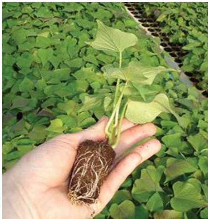
Slika 2. Presadnica batata

U proljetnoj pripremi tlo se gnoji mineralnim gnojivom, i to s 50 kg N, 100 kg P 2 O 5 i 150 kg K 2 O po jednom hektaru. Ne treba smetnuti s uma da batat traži slabiju gnojidbu nego većina povrtnih kultura. Gnojidba ovisi o prethodnoj kulturi i o rezultatima kemijske analize tla. Na loše strukturiranim tlima moguća je i uporaba stajnjaka ili komposta (Bušić i sur., 2013.).