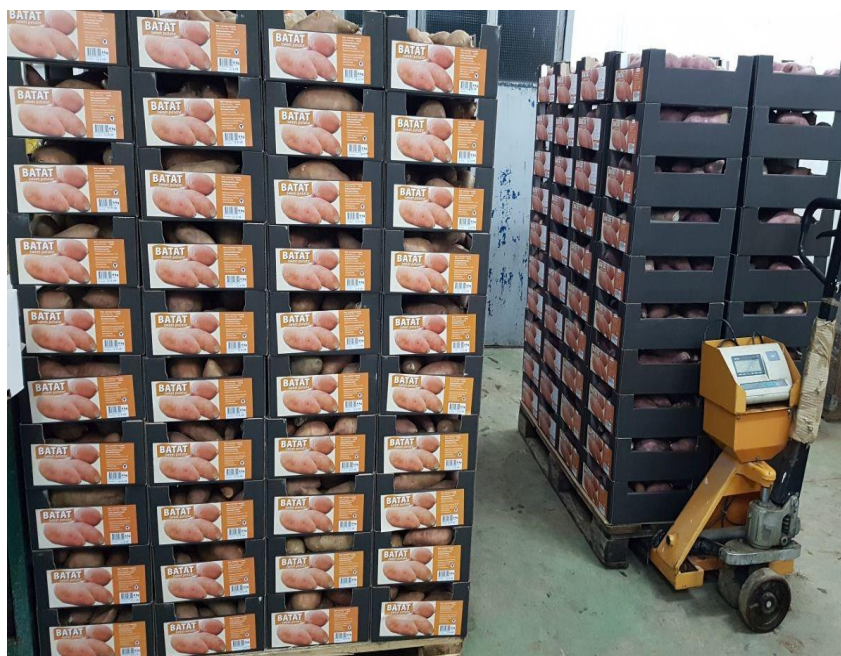
Slika 4. Pakiranje batata