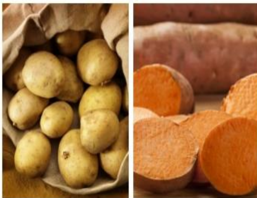
Slika 5. Batat i krumpir

Batat je jedinstven po svojoj slatkoći i raznim načinima pripreme. Uz to što se može spremati na iste načine kao i običan krumpir - kuhan, pečen, pržen i pire, batat se koristi i u pripremanju poslastica poput pudinga, štrudli i slično. Izvrstan je za djecu i sladokusce (www.alternativa.hr, 2018.).