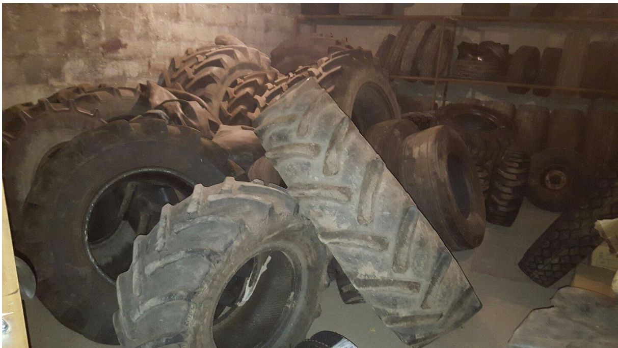
Slika 5. Skladište starih guma