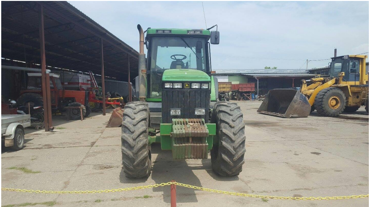
Slika 10. Garažiranje traktora na otvorenom prostoru.

Traktori su garažirani na otvorenom prostoru, na betonskoj podlozi (Slika 10.)