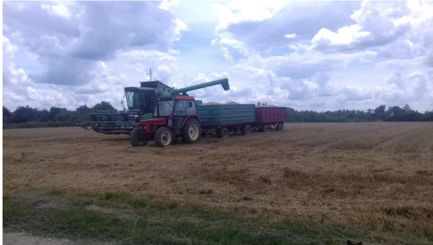
Slika 5. Žetva pšenice