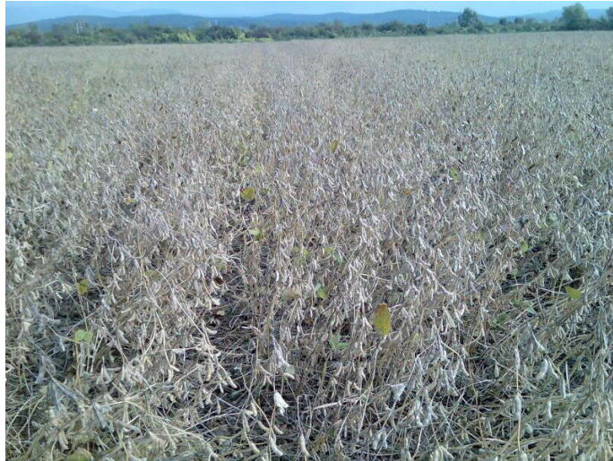
Slika 2. Soja pred žetvu

http://poljoprivredni-forum.com/showthread.php?t=16343&page=14