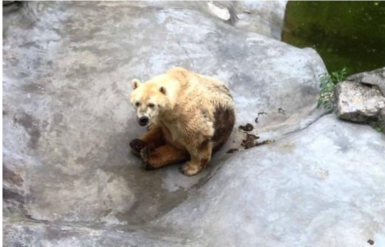
Slika 2. Polarni medvijed u beogradskom zoološkom vrtu

Jedan zoološki vrt u Argentini išao je toliko daleko zbog novca, da su drogirali životinje samo kako bi se ljudi mogli s njima slikati. Tom zoološkom vrtu je prijetilo zatvaranje, iako nisam mogla naći nikakve daljnje informacije što se na kraju dogodilo sa tim zoološkim i životinjama u njemu. Tamošnji zakon zabranjuje direktan kontakt između ljudi i životinja, ali na društvenim mrežama su se pojavljivale slike posjetitelja u direktnom kontaktu sa životinjama što se jasno vidi na slikama (Slika 3.), a to je pobudilo organizacije za zaštitu životinja.