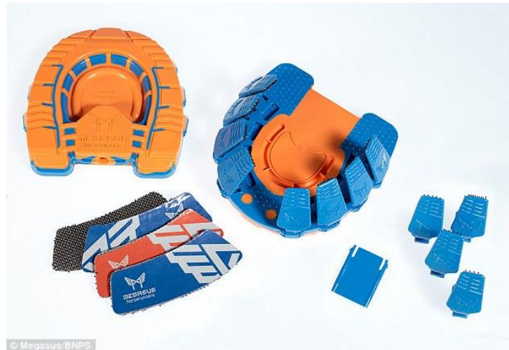
Slika 9. „Clip-on“ potkove

Primjer poboljšanja konjičke opreme su potkove koje se mogu zalijepiti ili zakačiti za kopito. Potkove koje se mogu zalijepiti dizajnirali su John Wright i Jeffery Newnman. Jedini problem na koji su naišli je taj što po zakonu u Ujedinjenom Kraljevstvu (UK) konje moraju potkivati licencirani profesionalci, tj. vlasnik ne smije sam potkivati konja, što znači da ne smije koristiti ovu vrstu potkova. Međutim, ovu inovaciju su priznali dizajneri iz USA-a pa ove potkove mogu koristiti vlasnici konja u državama gdje ne postoji zakon kao u UK-u. Još jedna zamjena za klasične potkove su „clip-on“ potkove (Slika 9). Te potkove su dizajnirane tako da se zakače na kopito, te ne sadrže materijal koji bi mogao naštetiti životinji.