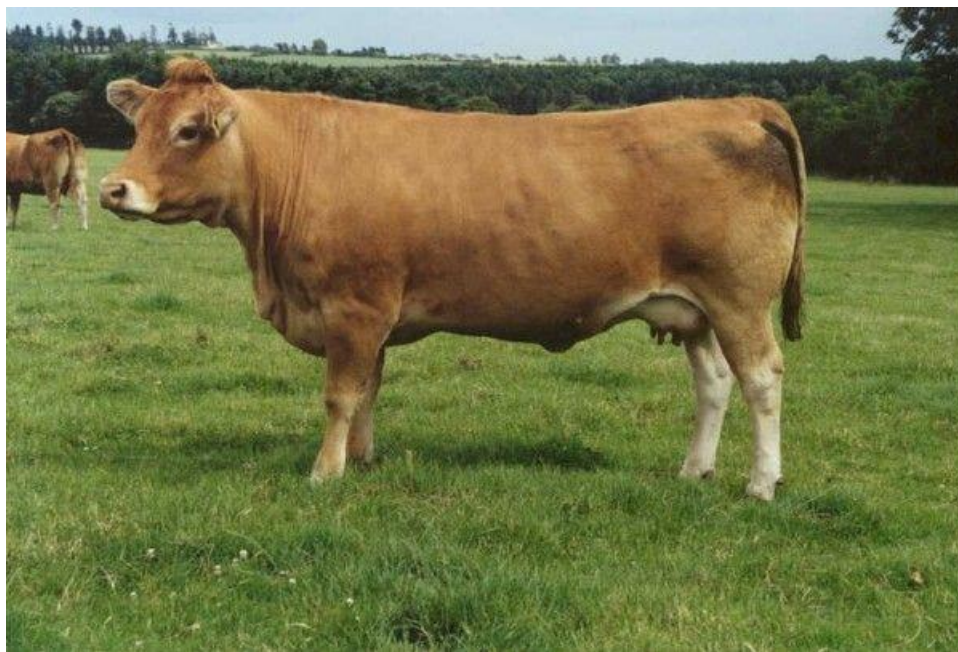
Slika 2. Limousin pasmina;

Limousin je pasmina goveda koja je specijalizirana za proizvodnju mesa. Naziv Limousin dobila je po istoimenoj pokrajini u Francuskoj. Karakteristična je po svojoj tamnožutosmeđoj boji dlake. Dimenzije tijela su joj vrlo velike, ali su i dalje vitalni te izrazito otporni na vanjske čimbenike. Zahvaljući tome ova pasmina je prilagođena ekstenzivnom načinu uzgoja što podrazumijeva da su goveda tijekom čitave godine na otvorenome bez zdravstvenih problema. Na temelju tih karakteristika ističe se kao odličan izbor pasmine za uzgoj u sustavu krava-tele. Sinonim za ovu pasminu je pasmina „crvenog mesa“ odnosno njeno meso odlikuje kao meso najbolje kvalitete, odnosno najvišeg postotka mišićnog tkiva u trupu i ukupne tjelesne težine. U prilog tome ide i činjenica da posjeduju malu količinu vanjskoj loja te relativno malo kostiju u trupu te visoki randvam klanja od 62 do 65 % . Uz sve prednosti ove pasmine, telad ove pasmine je mala što olakšava teljenje što povećava postotak uspješnih teljenja dok veterinarske troškove svodi na minimum.