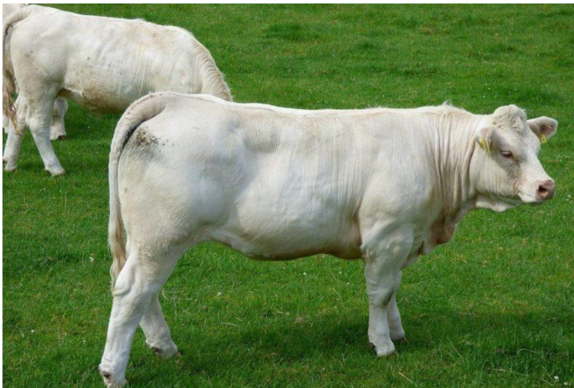
Slika 6. Charolais pasmina;

Charolais je francuska mesna pasmina koja je dobila ime po istoimenoj pokrajini. Preci ove pasmine vjerovatno su stigli u Francusku s rimskim legijama te u početku su služili pretežito za rad i izvor mesa. Poslije Drugog svjetskog rata došlo je do prave ekspanzije ove pasmine po cijelom svijetu kao dominantne pasmine. Danas u Francuskoj ima tri milijuna charolais goveda, a u svijetu je vrlo zastupljena kao čista i križana pasmina. Boja dlake joj je pšenične boje i velikog okvira. Tijelo joj se sastoji od malene glave, nabijenog i mišićavog vrata, dubokih grudi te mišićavih rebara. Odrasle krave dostignu tjelesnu masu oko 800 kg, visinu grebena oko 137 cm, širinu prsa od 62 cm i dubinu prsa 78 cm dok odrasli bikovi dostignu tjelesnu masu oko 1300 kg, visinu grebena oko 146 cm, širinu prsa 71 cm i dubinu prsa 83 cm.