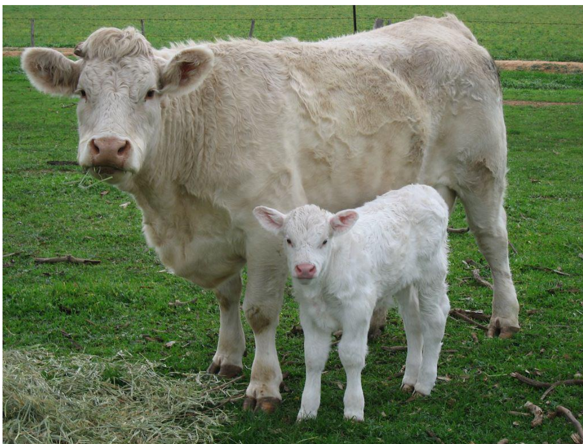
Slika 7. Charolais pasmina;

Charolais pasmina daje najveću težinu mesa odnosno najviše mesa po grlu na svijetu te je izvrsna u križanju za popravljanje kvalitete mesa ostalih pasmina. Meso tovljenika je vrlo kvalitetno, svijetlije boje. Telad ove pasmine teži oko 45 kilograma. Randman utovljene junadi je oko 65% , a junadi do 18 mjeseci i cca 600 kg žive vage uz postizanje dnevnog prirasta 1100-1200 g. Krave su mirnog temperamenta i čudi pa su pogodna za ograđene pašnjake i slobodan uzgoj držanja, ali potrebno je obezročiti goveda kako bi se spriječile moguće ozljede. S obzirom na veličinu ove pasmine preporučuje se da se prvotelke kasnije pripuštaju ili da se prvi puta pripuštaju bikovima sitnijih pasmina kako ne bi došlo do poteškoća pri teljenju.