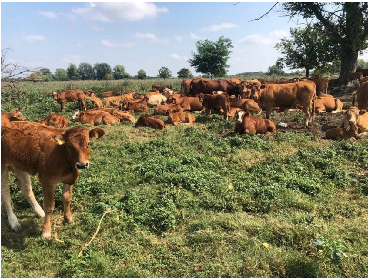
Slika 8. Limousin pasmina na OPG-u Bokun;

U svome stadu trenutno posjeduju: 65 krava, 15 steonih junica, 42 teleta i 2 rasplodna bika. Kao pasminu izabrali su Limousin jer je ona genetski predodređena za takav oblik uzgoja, a kao veliku prednost koja je presudila u izboru nad ostalim pasminama su manja telad pri porodu. Manja telad pri porodu osiguravaju lakša teljenja, što je vrlo važno za prvotelke, a također kravama olakšava teljenje i omogućuje samostalno teljenje bez ljudske pomoći.