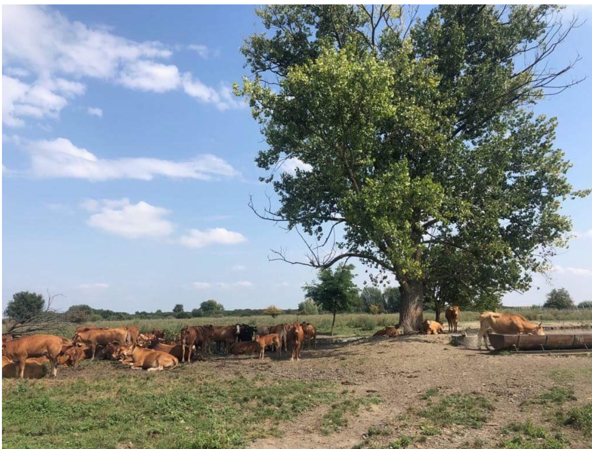
Slika 11. Limousin pasmina na OPG-u Bokun;

Zahvaljujući dugogodišnjem školovanju te iskustvu vlasnika OPG-a Dominika Bokuna, pojava bolesti na ovom OPG-u gotovo da i ne postoji. Od početka uzgoja imali su samo dva izlučenja iz stada. Prvo izlučenje je bilo zbog ozljede papaka te velike infekcije, dok su drugu kravu morali izlučiti zbog poteškoća pri teljenju koje je nastalo zbog ozljede kuka.