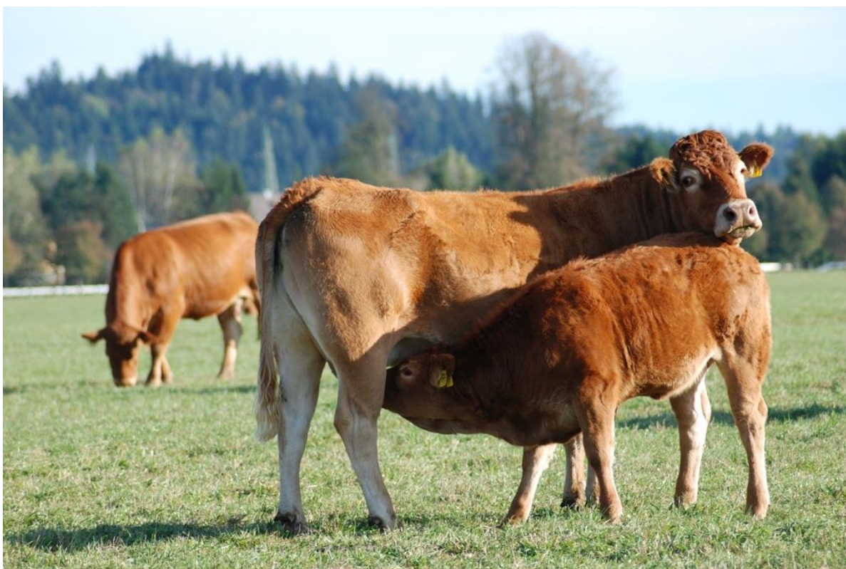
Slika 3. Limousin pasmina;

Majčinski instikt je vrlo izražen pa potupnu brigu oko teleta preuzima majka bez ikakve čovjekove pomoći. Štoviše, poželjno je da se čovjek što manje približava majci i teletu ako to nije neophodno kako ne bi uzrujavali majku, koja može pokazivati znakove agresivnosti koji mogu završiti s lošim posljedicama po čovjeka. Porodna težina muške teladi je od 35 do 45 kg, a ženske teladi je od 30 do 40 kg. Muška telad u vremenskom razdoblju do 365 dana može doseći težinu od 400 do 445 kg, dok ženska telad dosegne nešto manju težinu i od 340 do 375 kg. Krave su teške od 650 do 800 kg, a bikovi od 950 do 1100 kg. Visina križa kod krava iznosi od 135 do 145 cm, a visina do grebena je od 132 do 143 cm. Visina križa kod bikova iznosi od 140 do 152 cm, a visina do grebena je od 137 do 150 cm.