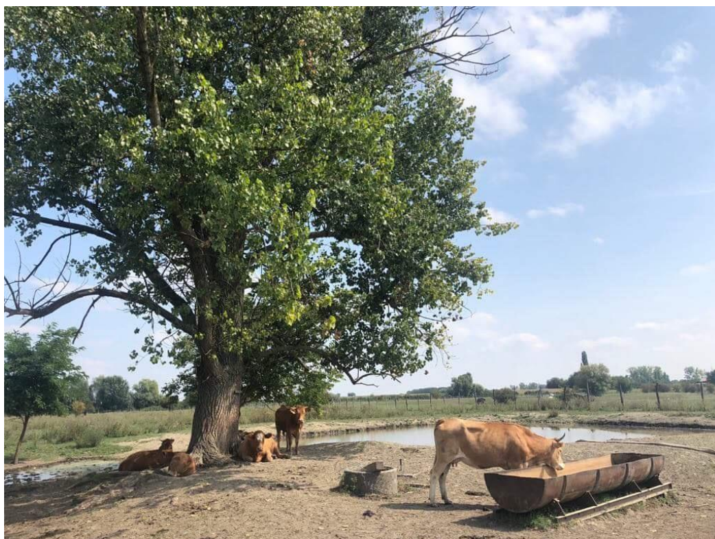
Slika 10. Limousin pasmina na OPG-u Bokun;

Preko ljeta hranidba se temelji na ispaši, osim ako se radi o izrazito sušnoj godini pa se manjak biljne vegetacije zamjenjuje kvalitetnim sijenom i silažom. Tijekom zime hranidba se sastoji od kvalitetnog sijena, silaže te male količine smjese ovisno o kategoriji goveda. Hranu u velikom postotku koriste iz vlastitog uzgoja. Kulture za silažu siju na 120 hektara, smjesu proizvode sami, a sijeno siju na 15 hektara, što je nedovoljno za njihove potrebe pa dobar dio sijena kupuju. Razmnožavanje na OPG-Bokun temelji se na prirodnom pripustu. Na 80 ženskih grla imaju 2 rasplodna bika te je postotak oplodnje izvrstan, a prilikom samog parenja nikada ne dolazi do ozljeda. Teljenja se događaju na samom pašnjaku bez poteškoća i bez potrebe za ljudskom intervencijom. Najčešće krava oteli svoje tele u raslinju kako bi se osjećala sigurnija za sebe i svoje tele. Tele se zatim zadržava s majkom oko 4,5 mjeseca te se hrani majčinim mlijekom. Postupnim razvojem buraga tele počinje uz mlijeko koristiti pašu sve dok se u potpunosti ne razvije buraga te tada prelazi isključivo na ispašu.