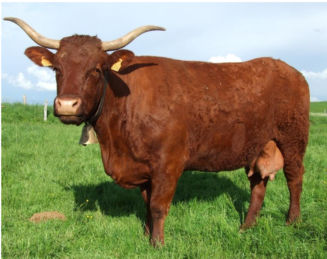
Slika 4. Salers pasmina;

Salers govedo je jedno od najstarijih francuskih pasmina, a stiglo je preko Pirinejskoj poluotoka. Uzgaja se u uobičajenoj veličini stada od 40 do 70 krava. Spada u veća goveda i dobro je prilagođena gorskim uvjetima držanja. Odlikuje velikom otpornošću na loše klimatske uvjete i odličnom iskorštavanju voluminozne krme. Pasma je mirnog karaktera pa se može uzgajati na manjim pašnjačkim područjima. Radi se o kasnozreloj pasmini pa se tako 77% junica prvi put teli s 32 do 40 mjeseci starosti. Salers govedo ima veliku plodnost čak 98% te laka teljenja zbog niže porodne mase teladi od 26 do 39 kg. Tijekom laktacije daje oko 3000 do 3500 litara mlijeka koje isključivo služi za othranu teleta.