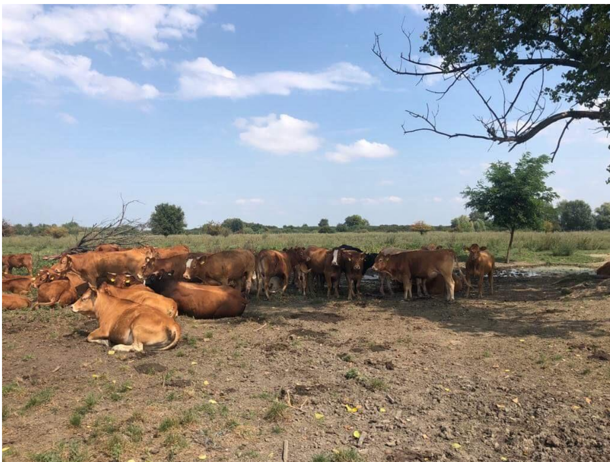
Slika 9. Limousin pasmina na OPG-u Bokun;

Površina pašnjaka je 50 hektara, predviđen je za korištenje u obliku pregonskog napasivanja, ali trenutno još nije u funkciji jer je opseg proizvodnje još mali. Na pašnjaku su zasijane djetelinsko-travne smjese koje su se pokazale kao najbolji izbor od voluminoznih krmiva. Pašnjak je ograđen tvrdom žicom te električnim pastikom. Od neophodnih stvari na pašnjaku voda je osigurana pomoću dva bunara iz kojih se crpi voda, a hlad životinjama prave mnogobrojna stabla te visoko raslinje u kojem životinje pronalaze sklonište. Preko zime životinje se odvoze u Hrastovac na farmu gdje borave u zatvorenom sve do proljeća kada se ponovno transportiraju na pašnjak u Brođance.