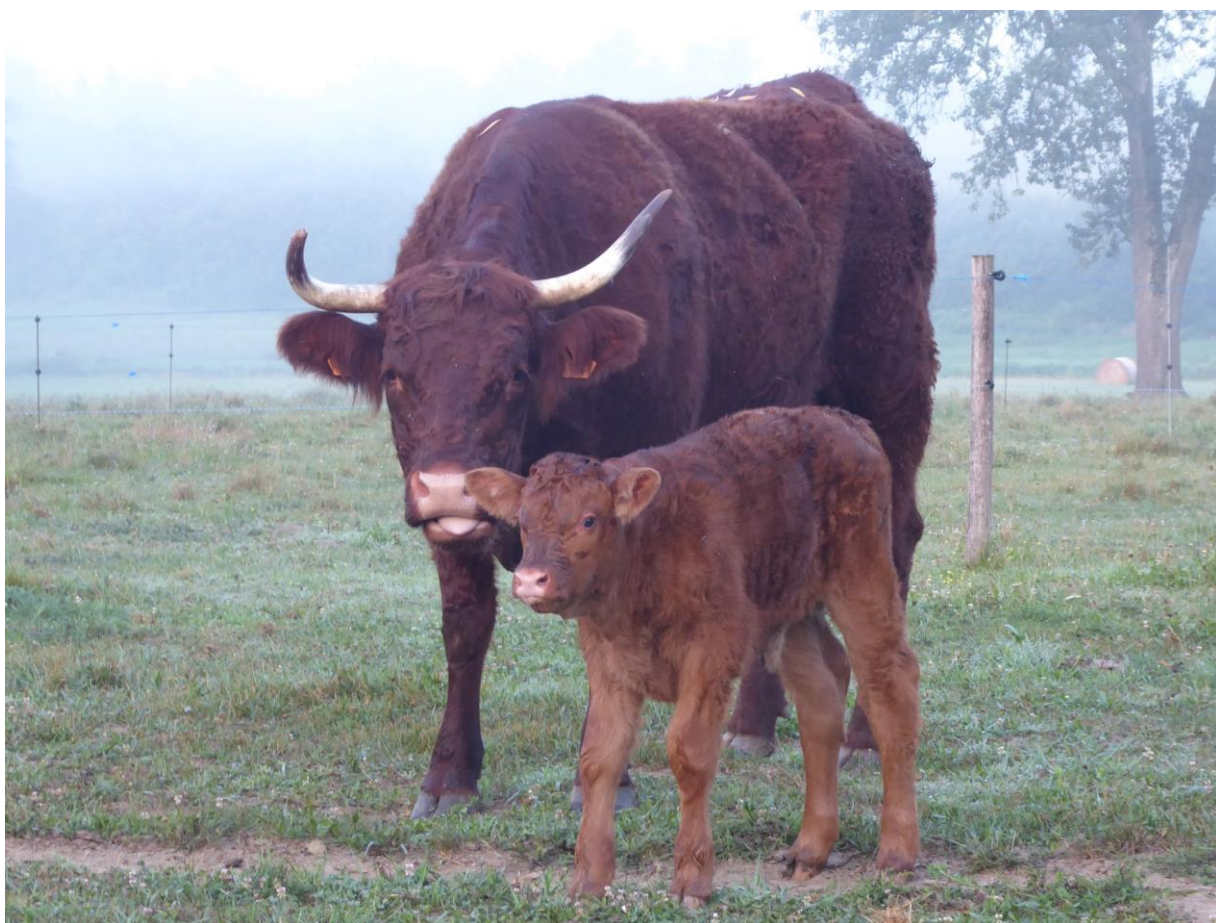
Slika 5. Salers pasmina;

Boja dlake je svjetlo do tamno crvenkasta. Zahvaljujući svojim čvrstim crnim papcima ova je pasmina prikladna za držanje na otvorenom tijekom čitave godine kao i u štalama. Dnevni prirasti pri intenzivnom hranjenju je oko 1300g uz randman oko 60%. Nakon 120 dana starosti muška telad teži oko 190 kg, a ženske oko 160 kg, dok nakon 210 dana muška telad teži oko 310 kg, a ženska 255 kg. Težina krava je oko 750 kg, a bikova oko 1100kg. Salers govedo je dugovječno od 10 do 15 godina , visoke u grebenu 140cm, a odrasli bikovi oko 150cm. Meso ove pasmine je dobro mramorirano, meko, sočno i prepoznatljive kvalitete. Posljednih godina ova pasmina postaje sve popularnija kod naših stočara te se očekuje još veće zanimanje zbog odlične prilagodbe za naša podneblja i mogućnosti proizvodnje u ekološkom uzgoju.