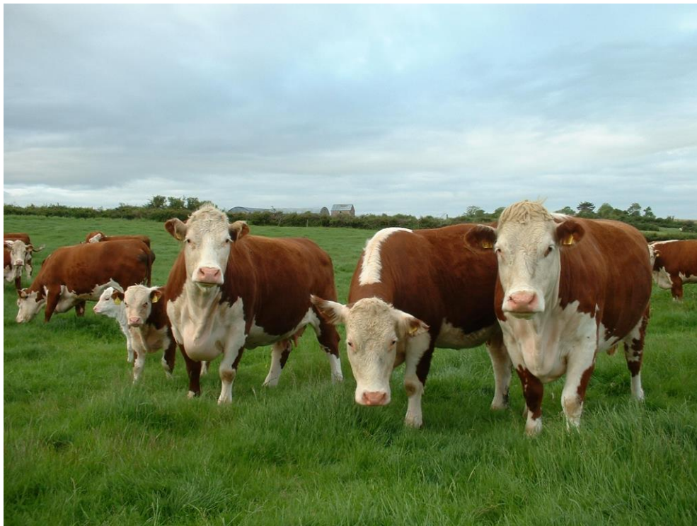
Slika 1. Mesna pasmina goveda Hereford ;

Mesne pasmine goveda specijalizirane su za proizvodnju mesa. (Gantner, 2011.). Kod nas uključuju samo 3% od ukupne populacije krava, a najčešće pasmine koje se uzgajaju su: Angus, Hereford, Limousine i Charolais. Uzgajaju se u sklopu intenzivnog ili ekstenzivnog uzgajanja. U intenzivnom uzgoju podrazumijeva se klasičan farmski uzgoj teladi i junadi uz točno preciznu hranidbu s različitim udjelima voluminoznih i koncentriranih krmiva u obroku, ovisno o hranidbenim potrebama životinje. Za razliku od intenzivnog uzgoja, ekstenzivni uzgoj podrazumijeva slobodnu ispašu na velikim prirodnim travnjacima koji su puni biljne vegetacije te je to glavni izvor hrane životinjama tijekom cijele godine uz povremeno dodavanje koncentriranih krmiva. Takav oblik uzgoja najčešće je organiziran u sustavu krava-tele. Svaka mesna pasmina ima svoje specifičnosti i karakteristike te je zbog toga vrlo važno definirati uzgojne ciljeve za svaku pasminu.