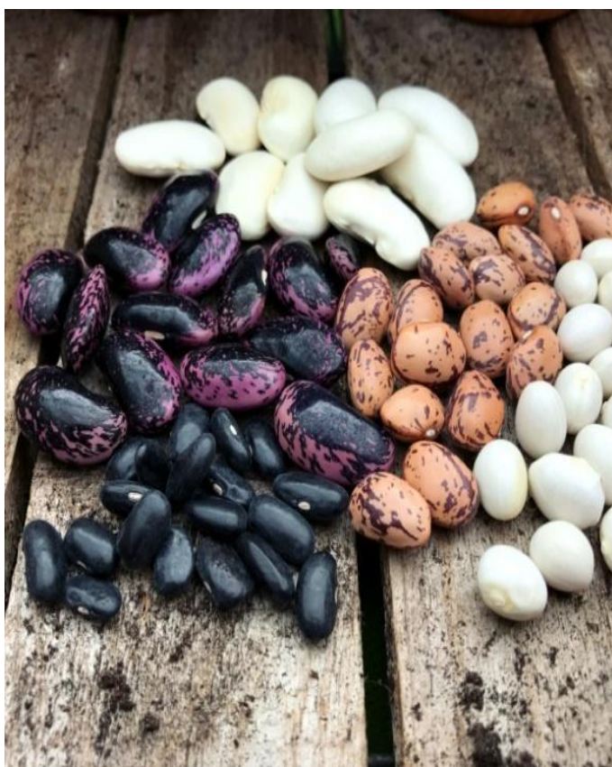
Slika 5. Izgled sjemenki graha

Masa 1000 sjemenki iznosi od 250 do 800 grama. Haploidni broj kromosoma je n = 11 (Spasojević i sur., 1984.). U povoljnim uvjetima sjeme može zadržati klijavost 4 do 5 godina.