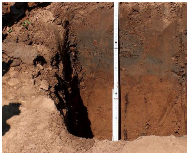
Slika 6. Eutrični kambisol

Na području Osječko – baranjske županije tla su različita po sastavu, strukturi i plodnosti. Najčešći tipovi tla koje na ovom području susrećemo su eutričnikambisol (Slika 6.), pseudoglej, černozem koji je često degradiran i ritska crnica.