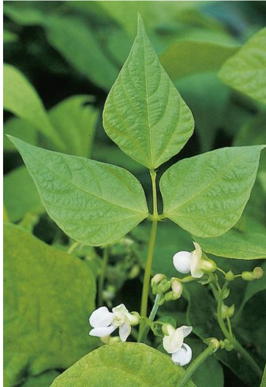
Slika 2. Izgled pravog lista graha