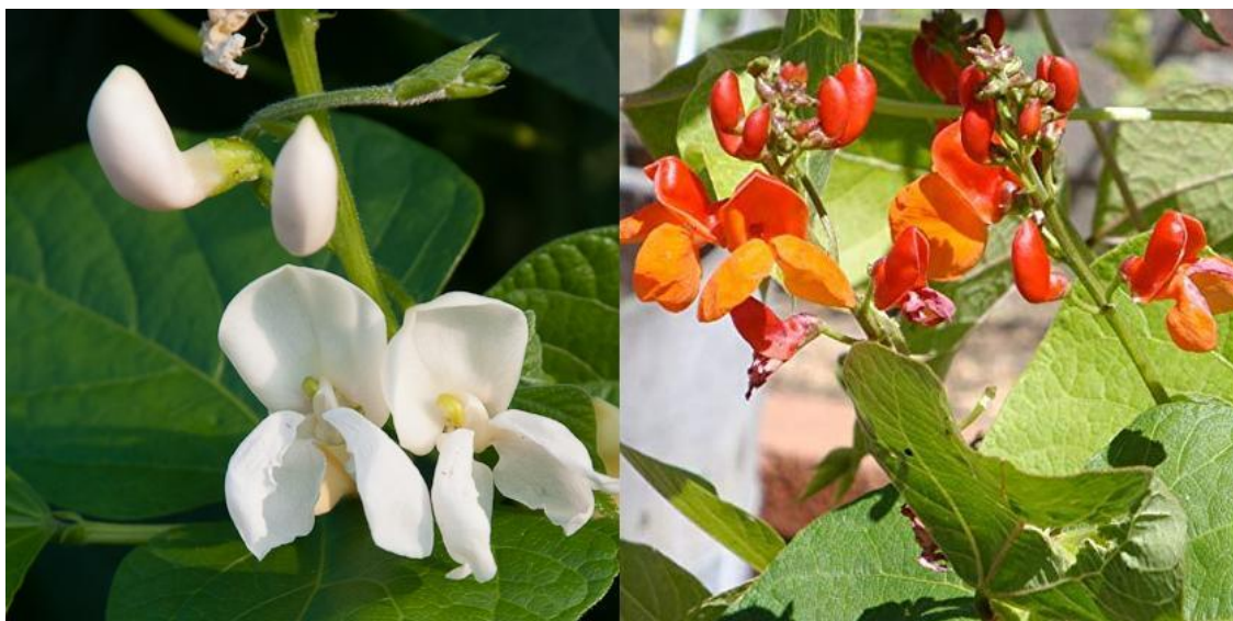
Slika 3. Izgled cvjetova graha različitih boja