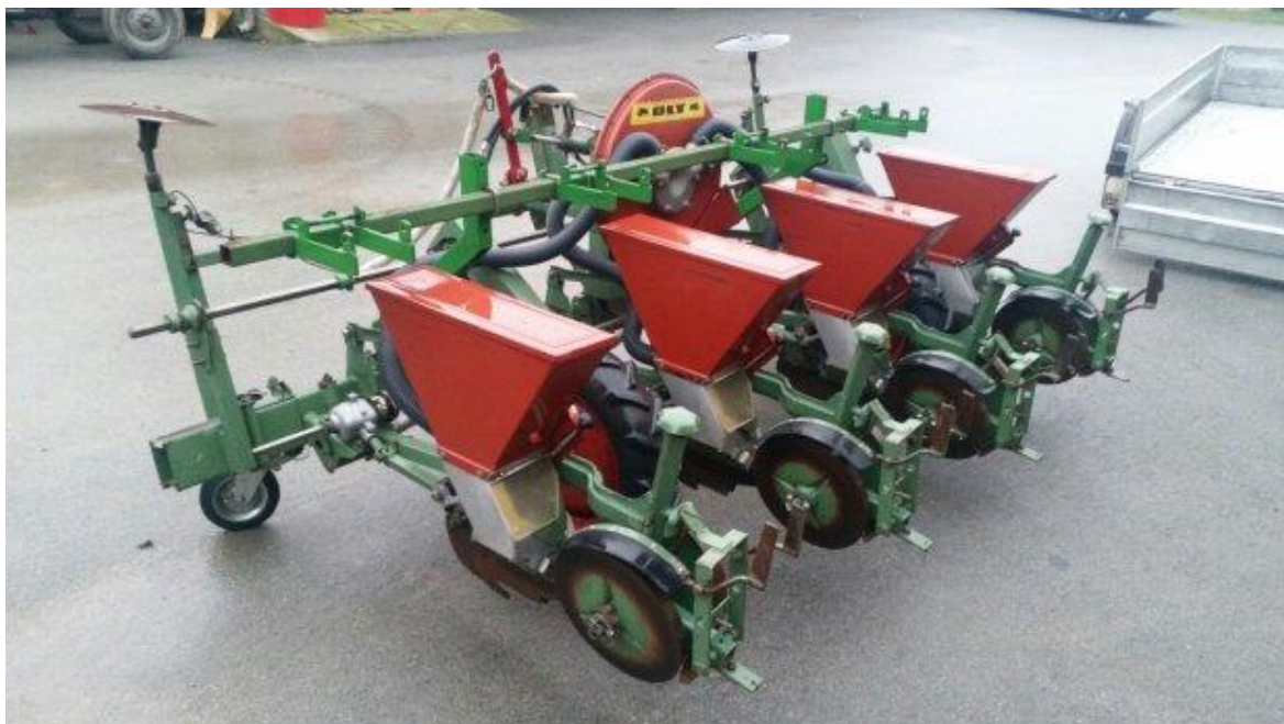
Slika 10. Primjer pneumatske sijačice

Za isplativi komercijalni uzgoj graha sjetva se vrši pneumatskim sijačicama (Slika 10.) na razmak od 50 cm između redova, a u redu razmak između sjemenja je 5 cm. Dubina sjetve je 4 do 5 cm. Za jedan hektar ovisno o sorti i krupnoći sjemena, potrebno je od 80 do 100 kg sjemena (Parađiković, 2009.).