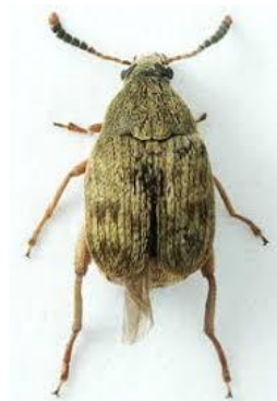
Slika 11. Grahov žižak – Acanthoscelides obtectus

Za suzbijanje navedenih štetnika treba voditi računa o karenci i vremenu primjene zaštitnih sredstava. Suzbijanje se provodi insekticidima s aktivnom tvari pirimifos metil u koncentraciji 0,1%, za vlažnu dezinfekciju skladišta 1 mL/m 2 površine, ili piretroidima u njihovim preporučenim koncentracijama od 0,3 do 0,4% (Parađiković, 2009.)