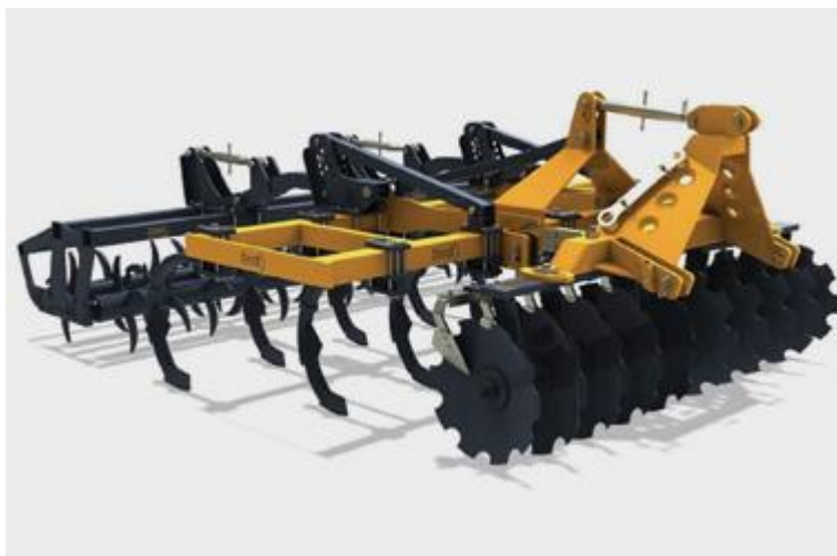
Slika 9. Primjer kombiniranog oruđa za predsjetvenu pripremu tla

Najveću pažnju ipak treba obratiti na dopunsku obradu tla u proljeće. Proljetna i predsjetvena priprema tla sastoji se od pravovremenog zatvaranja brazde što je vrlo važno za očuvanje vlažnosti tla, zatim uključivanja različitih priključaka (tanjurače, kultivatori te razna kombinirana oruđa) (Slika 9.) u obradu u cilju stvaranja rastresitog mrvičastog sloja tla kako bi posijano sjeme graha imalo što bolje i ujednačene uvjete za nicanje (Todorović i sur., 2008.) i razvoj korijena. Najbolji termin za dopunsku obradu tla je dva tjedna prije sjetve ako to vrijeme dozvoljava. Dobro je u dopunskoj obradi i još jednom isprovocirati nicanje korova kojeg uništavamo još jednom kultivacijom te unošenjem herbicida u tlo. Kultivaciji prethodi gnojidba ostatkom fosfornih i kalijevih gnojiva.