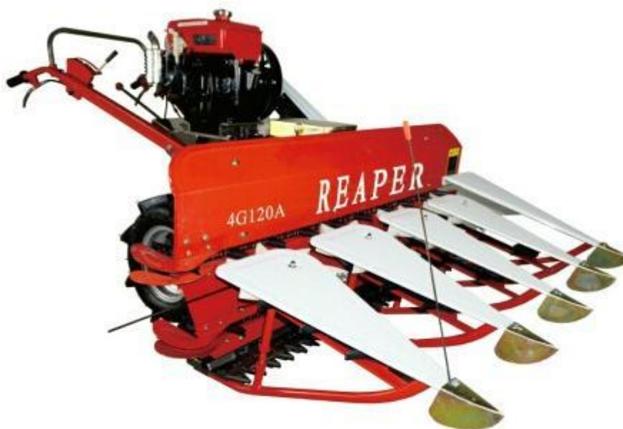
Slika 13. Mali kombajn za mehaniziranu berbu graha

Vrijeme i način berbe najviše ovise o načinu uzgajanja graha bilo da se radi o uzgoju na otvorenom ili u zatvorenom prostoru te o duljini vegetacije graha. Na otvorenom se berba obavlja jednokratno, kombajnima (Slika 13.), kada nastupi tehnološka zrelost koja se određuje prema razvijenosti sjemena u mahunama. Najpovoljniji je rok jednokratne mehanizirane berbe kada je postotak vlage zrna u najrazvijenijim mahunama oko 12% (Matotan, 1994.). Kod takve razvijenosti sjemena postiže se visoki prinos, duže skladištenje, mahune su otpornije na transport i održiva je kvaliteta zrna. Prema Parađiković (2009.) prinosi ovise o rokovima sjetve, sklopu, klimatskim uvjetima, gnojidbi i dr., a kreću se od 12 do 20 tona po hektaru. Također prema Parađiković (2009.) prinosi visokih sorti graha mahunara u zaštićenom prostoru kreću se između 40 i 60 tona po hektaru, ali su berbe obvezatno ručne u više navrata i to 7 do 12 tijekom 40 do 55 dana.