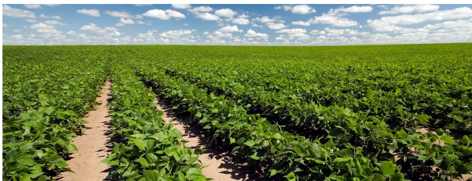
Slika 7. Polje graha