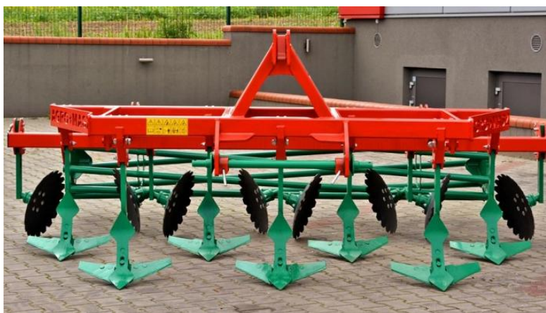
Slika 8. Višenožni gruber

Obradi tla pristupamo u trenutku povoljne vlažnosti tla. Tlo je najpovoljnije za obradu pri vlažnosti 40 – 60% PVK. Osnovna obrada tla vrši se plugom, a prašenje strništa se može obavljati i drugim oruđem kao što je tanjurača ili višenožnigruber (Slika 8.).