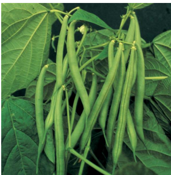
Slika 4. Izgled mahuna – plodova graha

Oblik mahune je postojana osobina i ne mijenja se prilikom djelovanja vanjskih činitelja (Todorović i sur., 2008.). U tehnološkoj zriobi mahune su krte i sočne, te u sebi nose 1 do 12 sjemenki.