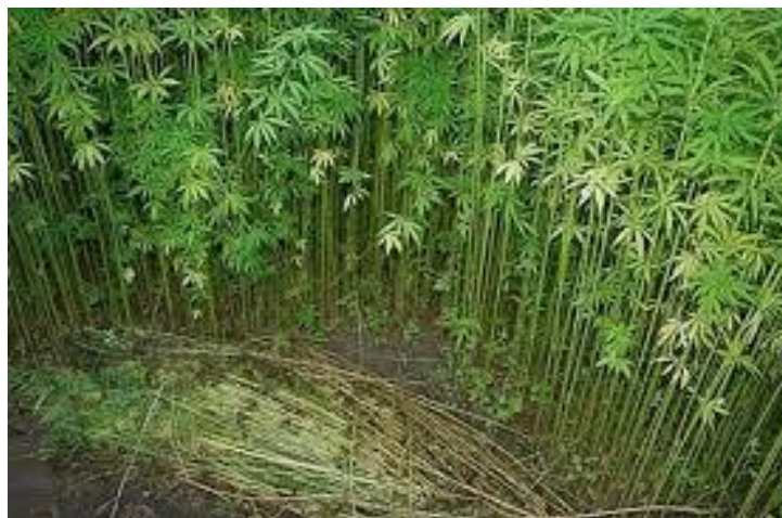
Slika 3: Industrijska konoplja

Van Gogh i Rembrandt su stvarali svoja dijela na platnu od konoplje. Ova biljka je kroz povijest bila korisna i zastupljena u svim granama (Mihelčić, 2017.).