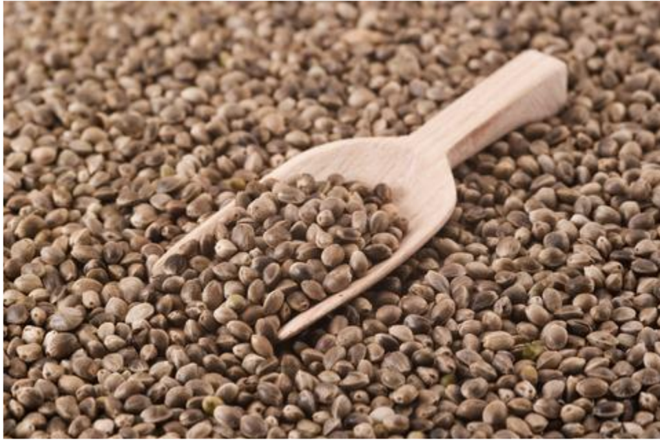
Slika 4.: Sjemenke konoplje