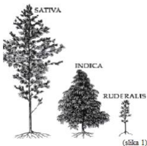
Slika 2: Forme konoplje

Postoji više formi konoplje: Cannabis sativa , Cannabis indica i Cannabis ruderalis (slika 2). Križanjem tih vrsta nastali su brojni hibridi (sorte) koje susrećemo danas. Forma Cannabis ruderalis prilagođena je hladnijim područjima, a otkrivena je tek 1924. u Sibiru. Cannabis indica , koja je klasificirana 1783. godine, sadrži više psihoaktivnih svojstava (u biljci je prisutna veća koncentracija tetrahidrokanabinola, poznatog još i kao THC) i potječe iz Indije. Također, svaka kultura razlikuje jačinu psihoaktivnog učinka konoplje, koja varira s koncentracijom THC-a unutar biljke, pa je možemo podijeliti na blagu, srednju i visoku. Industrijska konoplja predstavlja oblik konoplje kao materijal za razne proizvode. Rabi se za proizvodnju raznih prerađevina kao što su odjeća, konopci, papir, građevinski materijal, razna platna i tkanine te gorivo (Mihelčić, 2017.).