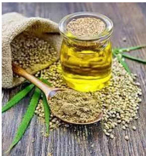
Slika 7.: Ulje od industrijske konoplje

Postoji još jedna velika blagodat primjene industrijske konoplje. To je ulje od industrijske konoplje koje može biti iznimno veliki potencijal.