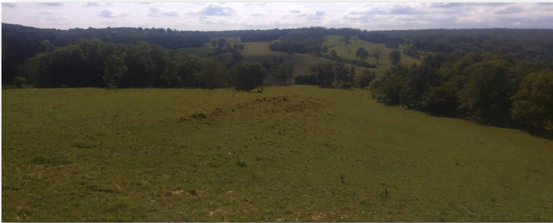
Slika 4: Pašnjaci na brdovitom terenu