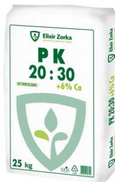
Slika 6: Složeno dvojno gnojivo (fosfor i kalij)

http://cerera-agro.hr/wp-content/uploads/2017/10/cerera-agro-SuperStart_10_35.png