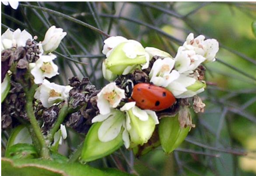
Slika 9. Prirodni neprijatelj na cvijetu heljde

bioraznolikosti privlačeći korisnu entomofaunu (Slika 9.), a smanjuje populaciju lisnih ušiju u narednoj glavnoj kulturi. Heljda korištena kao postrni usjev može poslužiti i kao „čistač tla“ jer usvaja značajne količine aluminija (Parahin, 2010.). Iznimno je otporna kultura na abiotski stres uzrokovan viškom Al u tlu te usvaja velike količine aluminija u list bez pojave simptoma fitotoksičnosti (Chen i sur., 2010.). Također usvaja i velike količine olova te se tako može koristiti kao fitoremedijator tala kontaminiranih olovom (Tamura i sur., 2005.).