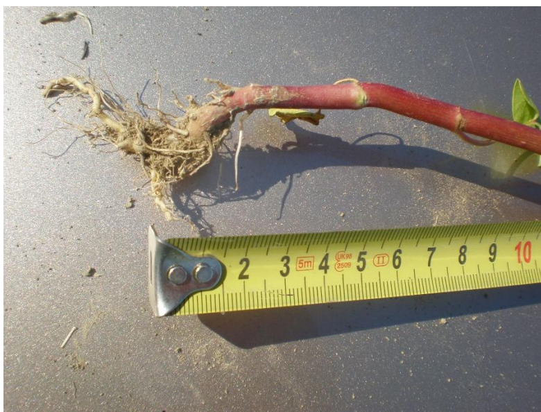
Slika 1. Korijen heljde

Korijen heljde (Slika 1.) je vretenastog oblika si dobro razvijenim lateralnim korijenjem (Stone, 1906.). U tlo prodire 90 do 120 cm, a većina korijenove mase (više od 85%) nalazi se na dubini od 20 do 30 cm. Iako čini samo oko 3 % ukupne mase biljke dobre je upojne snage kod opskrbe hranivima i vodom (Gondola i Papp, 2010.).