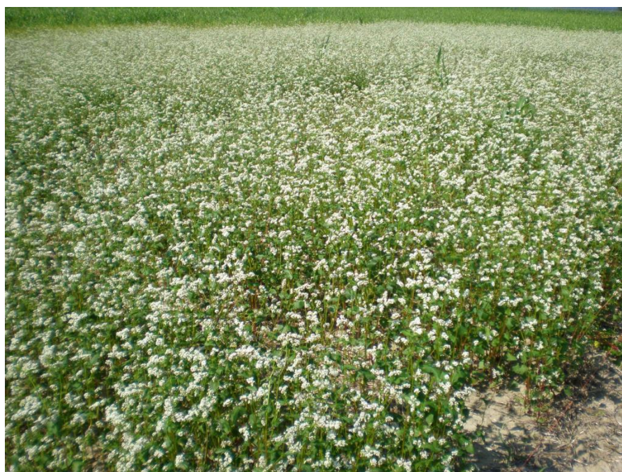
Slika 8. Heljda kao postrni usjev

Heljda se često navodi kao najlakše i najbrže rješenje prilikom odabira kultura za postrni usjev uz zadovoljavajuće prinose i u sušnijim agroekološkim uvjetima (Šimunić i sur., 2010.). Većinom se sije kao postrni ili naknadni usjev, a rjeđe kao glavni usjev. U Hrvatskoj se najčešće sije nakon žetve ranih usjeva. Kao postrnom usjevu koji brzo i učinkovito prekriva tlo, primarna uloga joj je suzbijanje korova te zaštita tla od nepovoljnih vanjskih utjecaja. Uvjet da heljda uspije kao postrna kultura je dostatna količina oborina, stoga bolje uspijeva u sjeverozapadnom dijelu Hrvatske, nego u istočnom. Na slabije plodnim tlima heljda je dobar postrni usjev ako se glavni usjev skine u vremenu od 15. lipnja do 27. srpnja (uljana repica, grašak, sjemenski krumpir, ozima pšenica i sl.). Veći prinosi heljde zabilježeni su kada se sijala nakon graška.