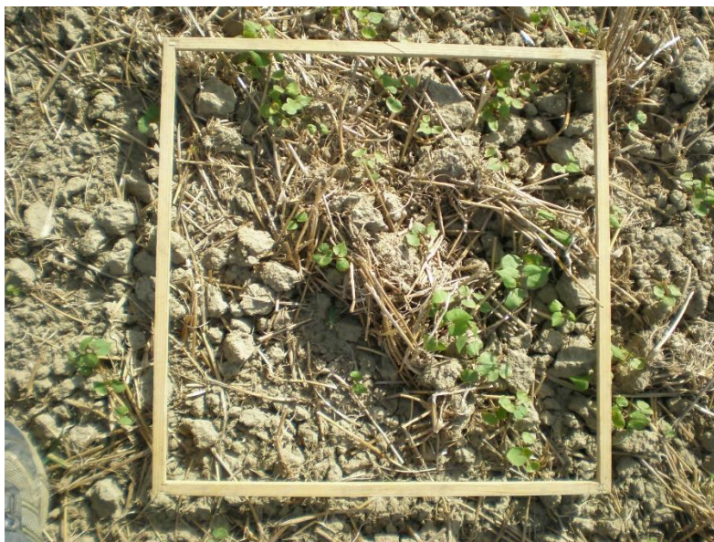
Slika 6. Nicanje heljde sijane u reduciranom sustavu obrade tla

Stipešević i sur., 2010. istraživali su postrni uzgoj heljde s tri različita tretmana obrade tla. heljda je sijana nakon oranja, višekratnog i jednokratnog tanjuranja. Najviši prinosi heljde u ovom istraživanju ostvareni su na sustavu reducirane obrade tla (jednokratno tanjuranje na dubini 20 cm).