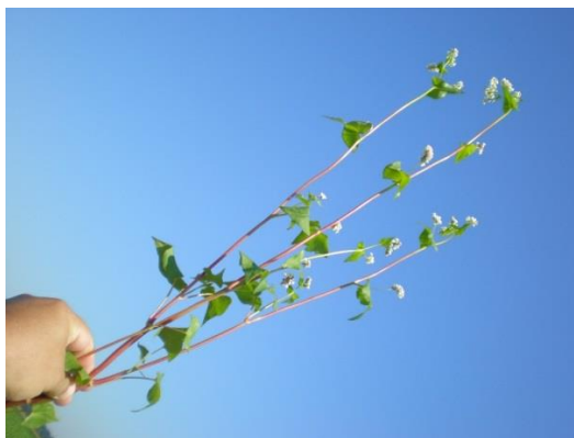
Slika 2. Stabljika heljde