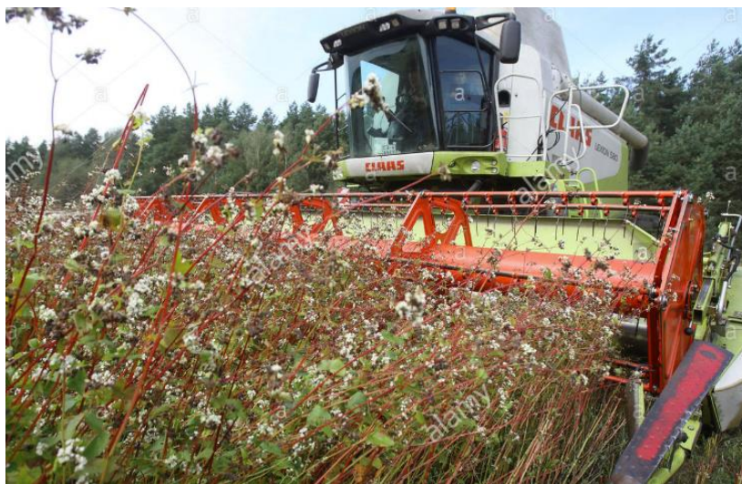
Slika 7. Žetva heljde

Žetva heljde obavlja se žitnim kombajnima koji se podese na odgovarajući način (Slika 7.). Heljda dozrijeva nejednolično i dugo i nikada ne dozriju baš svi plodovi. Zrno heljde obično dozrijeva 10 do 12 tjedana nakon sjetve (Radisc i Mikohazi, 2010.). Kada je većina plodova zrela, a ipak se ne osipa tada je vrijeme za početak žetve. Kalendarski, žetva heljde kao glavnog usjeva obavlja se početkom kolovoza, a kao postrnog usjeva tijekom rujna. Žetva heljde se može obaviti i dvofazno (Grabner, 1948.), a takvom primjenom tehnologije mogu se postići urodi 2,0-3,0 t/ha. Prirodi heljde općenito su niski i variraju, ovisno o klimatskim uvjetima, ali smatra se kako bi se u glavnoj sjetvi u optimalnim uvjetima ipak trebali postići prinosi zrna veći od 2 t/ha (Varga, 1966.), a u postrnoj sjetvi od 1,5 do 2 t/ha. Poželjno je 3 do 4 dana prije žetve provesti desikaciju lista (Radisc i Mikohazi, 2010.). Nakon žetve, zrno se suši jer je obično sadržaj vlage u zrnu previsok (Michalova, 2001.) i svodi na vlagu 13-14% (Antal, 2005.) te se skladišti u suhim skladištima relativne vlage zraka 40-50%.