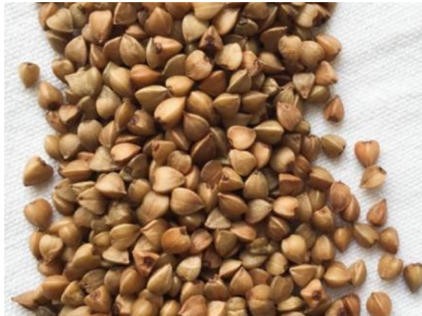
Slika 5. Plod heljde

masa zrna, odnosno masa 1000 zrna iznosi 20 do 30 grama, a hektolitarska masa iznosi 55 do 65 kilograma.