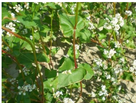
Slika 3. Listovi heljde

List (Slika 3.) se sastoji od peteljke i velike srcolike plojke. Gornji listovi su sjedeći jer nemaju plojku. Smješteni su jedan nasuprot drugome.