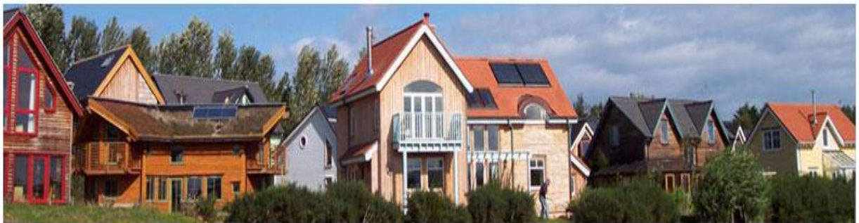
Slika 8. Eko selo Findhorn

Findhorn Foundation Ecovillage projekt dobio je od United Nations Centre for Human Settlements (Habitat) oznaku „Najbolje prakse“.