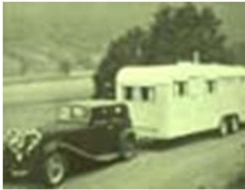
Slika 4. Osnivači stižu u kamp prikolici