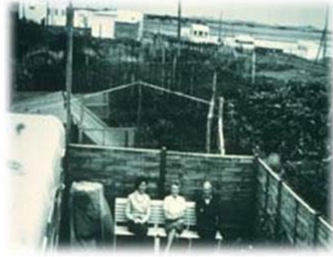
Slika 5. Dorothei Mclean, Eileen i Peter Caddy, osnivači