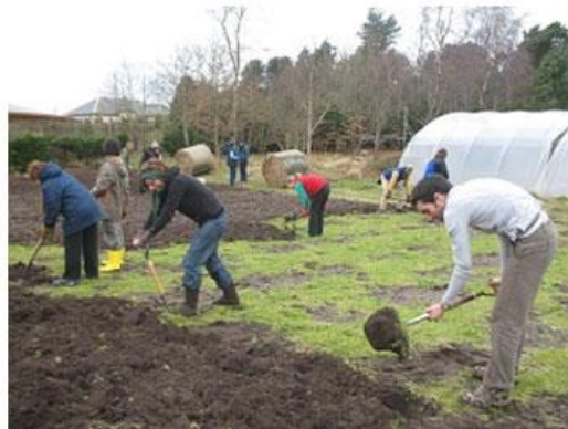
Slika 21. Cullerne Garden