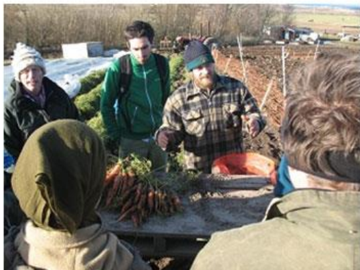
Slika 20. Eko proizvodnja mrkve na EarthShare farmi