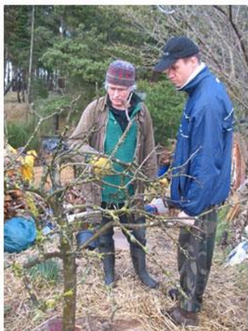
Slika 22. Individualno podučavanje o permakulturi