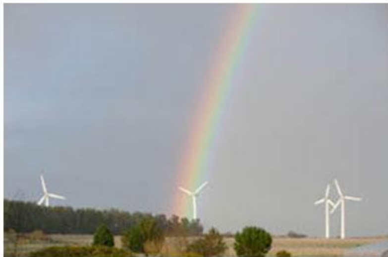
Slika 14. Četiri vjetrenjače

Četiri turbine na vjetar (slika 14.) koje su vlasništvo eko sela, imaju ukupni kapacitet od 750kW, osiguravajući više od 100% potreba zajednice za strujom. Eko selo ima vlastitu električnu mrežu i proizvodnja električne energije iz vjetrenjača provodi se do trafostanice koja mijenja prijenos napona i djeluje kao prekidačka stanica. Kada vjetar puše, električna energija se koristi odmah i ako proizvodnja premašuje potrošnju, višak se izvozi u mrežu. Ako vjetar ne puše, energija se uvozi iz mreže. Općenito, eko selo je proizvođač električne energije i oko 50% proizvodnje izvozi u mrežu te je na taj način to jedan od najunosnijih zelenih poslova eko sela.