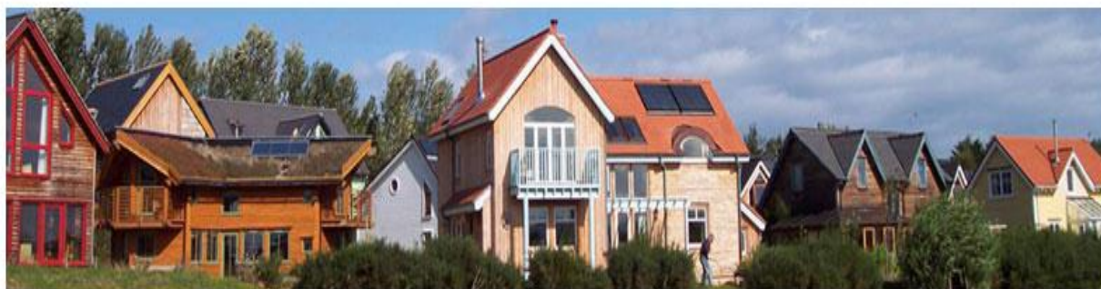
Slika 8. Eko selo Findhorn

Findhorn Foundation Ecovillage projekt dobio je od United Nations Centre for Human Settlements (Habitat) oznaku „Najbolje prakse“.