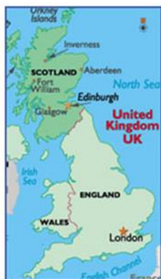
Slika 1. Velika Britanija

Findhorn Community Foundation smješten je na sjeveristoku Škotske na obalama Sjevernog mora (slike 1, 2 i 3). Satoji se od 2 dijela, Findhorn parka – eko selo, koje je smješteno nedaleko istoimenog sela Findhorn i Cluny Hill Collegea, udaljenog oko 10-tak kilometara od samoga eko sela.