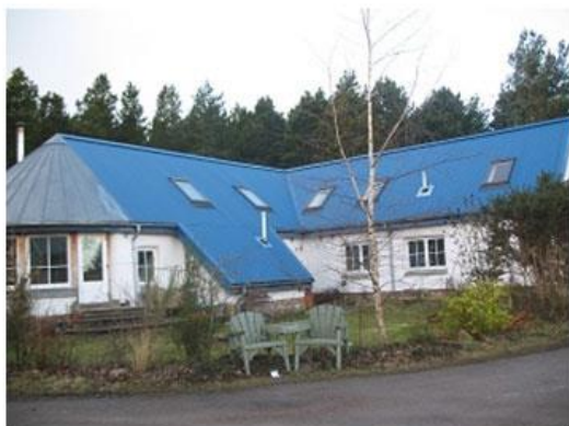
Slika 10. Kuća od slame, cca 120 m 2

zraka. Također, eksperimentirali su i sa izgradnjom kuća od slame (slika 10.), sistem „zemljeni brod“ koristeći pri tome i otpadne automobilske gume. I nadalje se radi na istraživanju inovativnih ekoloških mogućnosti za izgradnju prikladnih za okoliš.