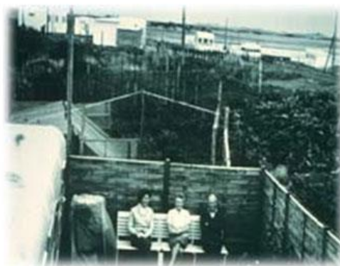
Slika 5. Dorothei Mclean, Eileen i Peter Caddy, osnivači