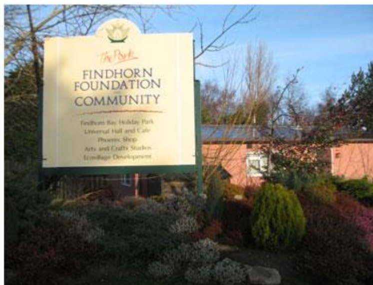
Slika 6. Ulaz u eko selo Findhorn

lokalne, regionalne i nacionalne zajednice koja se sve više okreće održivom razvoju. Kroz slijedeća poglavlja predstaviti ću posebnosti i uspjehe Findhorna kako u održivom razvoju vlastite zajednice, tako i u njihovom nemjerljivom utjecaju na cjelokupni održivi razvoj na planeti.