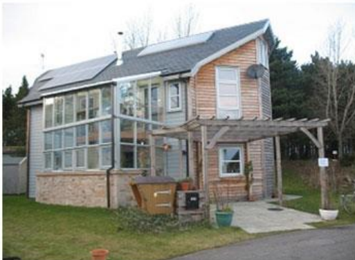
Slika 12. Eko kuća od prirodnih materijala, sa solarnim panelima i pasivnim grijanjem

Brojne kuće i zajedničke zgrade imaju ugrađene solarne panele za zagrijanje vode za centralno grijanje. Ujedno, većina zgrada u eko selu koriste pasivnu solarnu energiju kako bi smanjile potrebe za grijanjem, tako što prozore okreću prema jugu, a sjeverne zidove ostavljaju bez prozora i vrata (slike 12. i 13.).