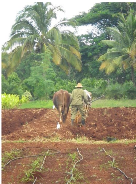
Slika 25. Korištenje životinja za prijevoz hrane