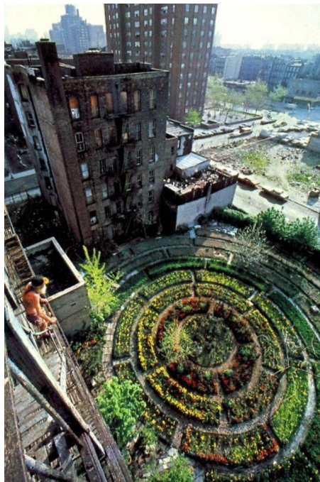
Slika 24. Permakulturni vrt u Kubi na parkiralištu

Od ranih 1990-ih, pokret urbane poljoprivrede se brzo proširio po Kubi i odveo ovaj glavni grad od 2,2 milijuna stanovnika na put prema održivosti.