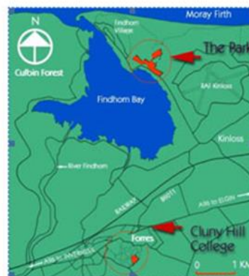
Slika 3. Findhorn zaljev i eko selo