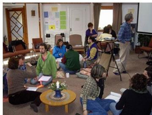
Slika 23. Grupni rad o socijalnom poduzetništvu