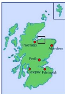
Slika 2. Škotska