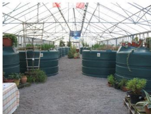
Slika 16. Unutrašnjost staklenika biljnim pročišćivačem