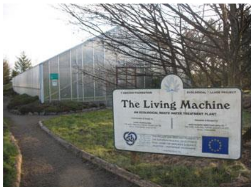
Slika 15. Ulaz u staklenik sa biljnim pročišćivačem

Prvi europski biljni pročišćivač tipa „Living Machine“ (slike 15. i 16.) postavljen je u listopadu 1995. godine u Findhornu. Sufinaciran je iz regionalnih razvojnih fondova EU.