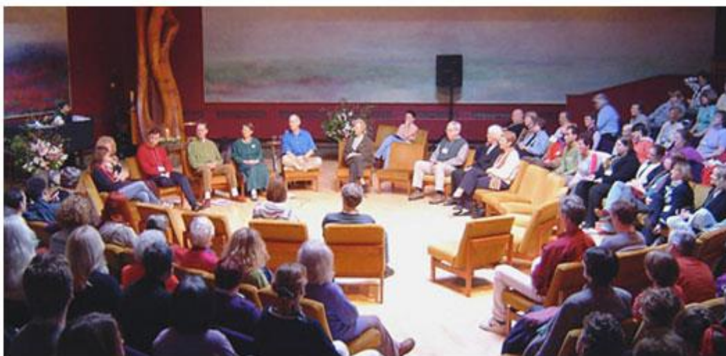
Slika 9. Zasjedanje vijeća

The New Findhorn Association osnovan je 1999. godine kako bi zbližio različite organizacije i ljude sa ekoselom u promjeru od 80 km. Organizacija izabire Vijeće (Slika 9.) na dobrovoljnoj bazi, koje nadzire ispravnost provedbe svih demokratskih procesa unutar NFA. U organizaciji su zaposlena dva „slušača – komunikatora“ čiji je profesionalni zadatak da oslušuju puls zajednice, osiguraju dobrodošlicu novim članovima, podržavaju organizacije i poslovne projekte, osnažuju članove koji potiču nove inicijative i facilitiraju sva događanja koja se zbivaju u zajednici.