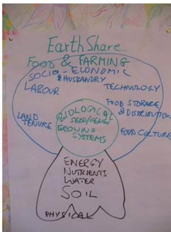
Slika 19. Vrijednosti za koje se zalaže EarthShare poduzeće

1994. godine osnovan je EarthShare (slika 19.), poduzeće za poljoprivrednu proizvodnju koje se temelji na organskim, biodinamičkim i permakulturnim principima uzgoja i proizvodnje hrane. Poduzeće ima za cilj povećati lokalnu proizvodnju i potrošnju hrane te povećati kvalitetu prehrane. Trenutno EarthShare (slika 20.) proizvodi hranu na oko 5 ha, rasprostranjenih na tri lokacije, uključujući i Cullerne Garden (slika 21.) smješten u samom eko selu. Proizvodnja trenutno premašuje potrebe 500-tinjak žitelja, uključujući i goste eko sela, tako da se višak proizvoda plasira u lokalnim trgovinama eko hrane. Poduzeće EarthShare ulaže velike napore u osvještavanju javnosti o negativnim utjecajima i opasnostima koje donosi GMO proizvodnja.