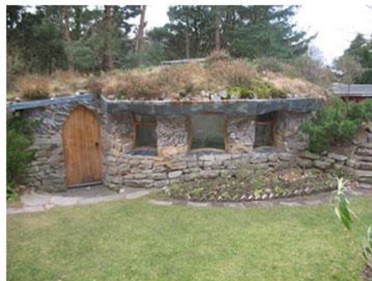
Slika 11. Prirodno svetište od kamena