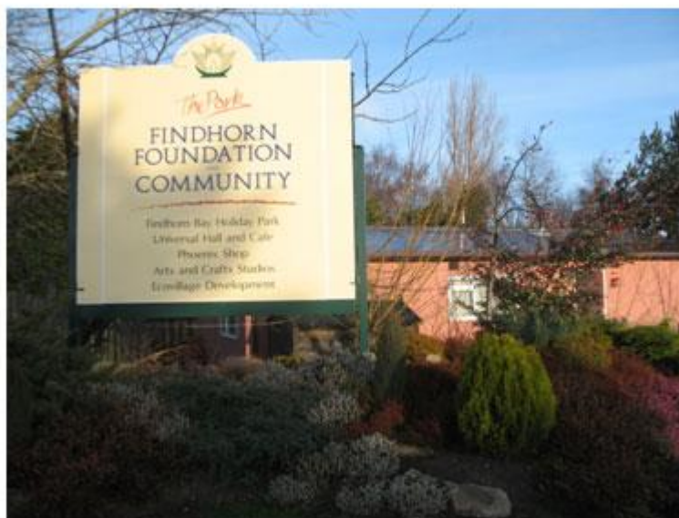
Slika 6. Ulaz u eko selo Findhorn

lokalne, regionalne i nacionalne zajednice koja se sve više okreće održivom razvoju. Kroz slijedeća poglavlja predstaviti ću posebnosti i uspjehe Findhorna kako u održivom razvoju vlastite zajednice, tako i u njihovom nemjerljivom utjecaju na cjelokupni održivi razvoj na planeti.