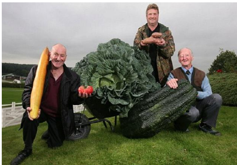
Slika 7. Povrće uzgojeno u vrtovima Findhorna