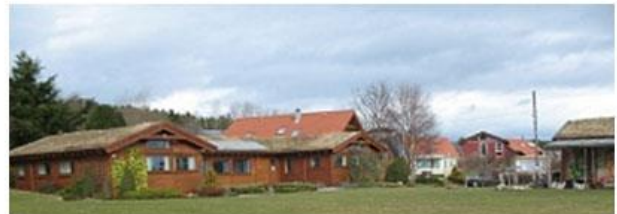
Slika 13. Gostinjska kuća sa travnatim krovom