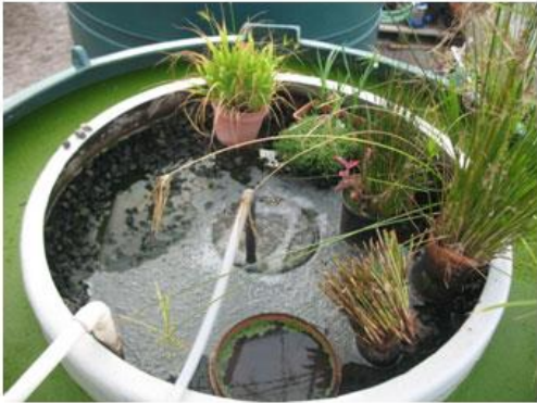
Slika 17. Aerobni spremnik

U Living Machine dolaze otpadne vode koje se biološki prerađuju u anareobnim i aerobnim uvjetima u spremnicima u kojima se nalaze različite kolonije bakterija, algi, protozoa, biljaka, zmija i riba (slike 17. i 18.) koje tvore jedan biocenozni ekološki filter. To je preslika procesa koji se zbiva u prirodi, ali daleko intenzivniji. Na kraju staklenika su spremnici iz kojih voda izlazi dovoljno pročišćena da se može direktno ispustiti u more ili se može ponovo koristiti u domaćinstvima i u vrtu. Ova tehnologija ne zadovoljava samo nove stroge standarde za kanalizacijske odljeve, već je i dosta jeftinija jer ne koristi skupe kemikalije.