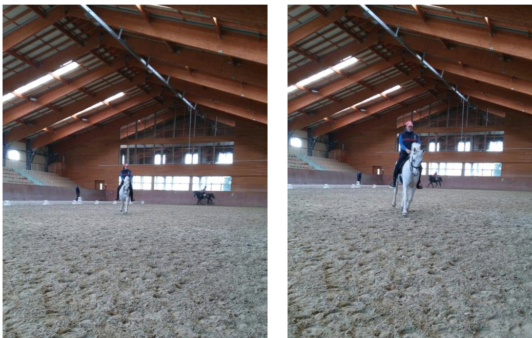
Slika 7. Promjena po dugoj dijagonali F-H