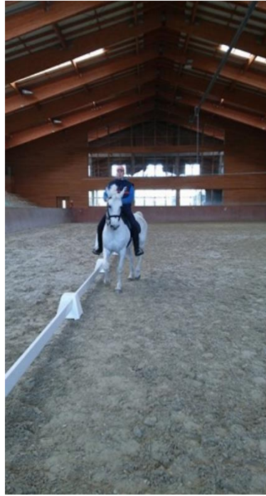
Slika 11. Izvedba vježbe renvers na konju lipicanske pasmine u Ergeli Đakovo