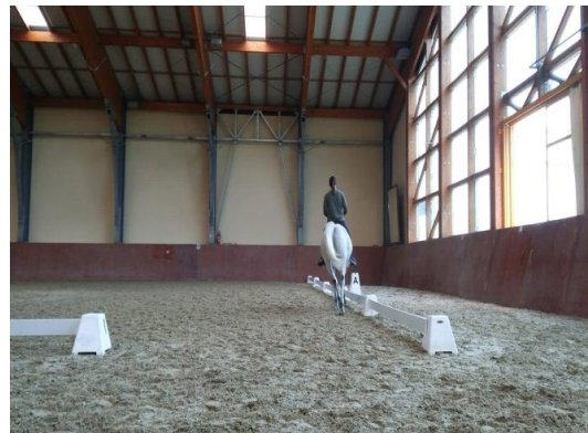
Slika 8. Projahivanje malih krugova promjera 10x10 metara