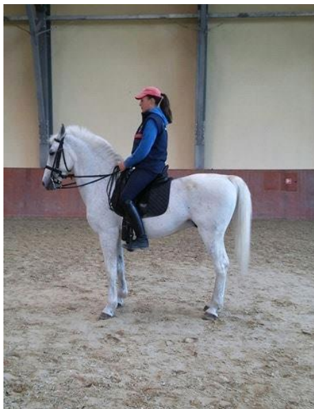
Slika 3. Jahač u sedlu, pravilan položaj tijela jahača

Jahač ima pravilan položaj tijela kada sjedi uspravno, opuštenih ramena prema unatrag. Laktovi ne smiju ići prema van, a nadlaktice bi trebale biti opušteno i okomite uz tijelo. Ruke jahača se drže za širinu šake iznad grive a palčevi trebaju biti okrenuti prema gore. Zapešća trebaju biti opuštena i savitljiva kako bi mogli osjetiti pokrete konjskih usta. Jahač koji ima opušteno ruke manje će nanositi štete konjskim ustima nego jahač koji kruto i čvrsto drži dizgine. Prema Ivančev i sur., (2014.) pravilan položaj jahača podrazumijeva i ispravno postavljanje skeleta u smislu kutova u pojedinim zglobovima i polugama što, sa svoje strane dodatno podržava ravnotežu. Dizgini uvijek trebaju biti lagano zategnuti kako bi imali kontrolu nad konjem. Opuštenost jahača najvažniji je dio pravilnog položaja, a to se odnosi i na noge (slika 3.). Koljeno jahača ne bi se smjelo pomicati tako da donji dio noge, list i peta budu pravilno postavljeni. Potkoljenice su najvažniji dio koji nam služi kao pomagalo za kontroliranje kretnji konja. Potkoljenice se trebaju nalaziti tik iza kolana. Najširi dio stopala treba se nalaziti na nagaznoj pločici stremena, tj. uzengiji, peta jahača je malo spuštenu a prsti su usmjereni prema naprijed. Dužina stremenskog remena ima važnu ulogu za pravilan položaj tijela jahača. Kako bismo bili sigurni da jahač ima pravilan položaj, može se povući zamišljena okomita crta od glave preko bokova pa do gležnjeva jahača (HKS, 2015.).