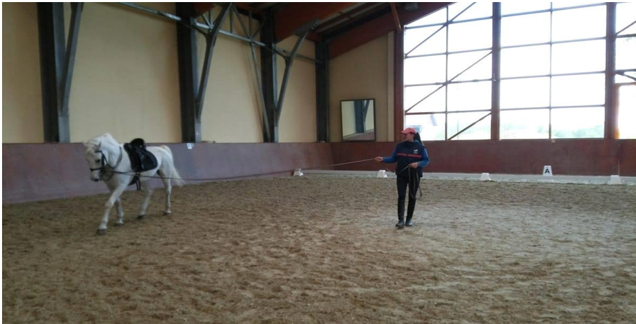
Slika 1. Lonžiranje konja sa sedlom i uzdom