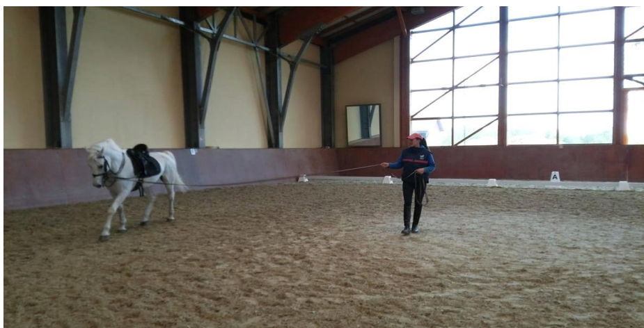
Slika 1. Lonžiranje konja sa sedlom i uzdom