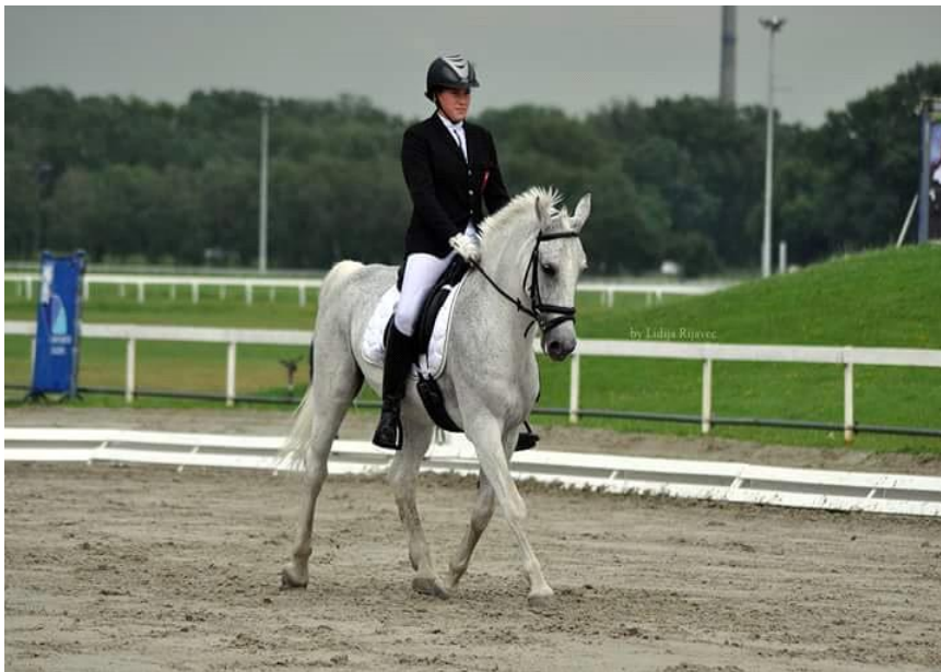
Slika 4. Oprema za konja i jahača na dresurnim natjecanjima

ili dresurna sedla. U utakmicama E i A kategorije te utakmicama za mlade konje dozvoljeno je sportsko sedlo, a u utakmicama L, LM, M i višim kategorijama preporuča se dresurno sedlo. U nižim kategorijama utakmica E i A dozvoljene boje podsedlica su bijela, bjeličasta, crna ili tamno plava, dok je u utakmicama viših kategorija dozvoljena samo uporaba bijele ili bjeličaste podsedlice. Žvale moraju biti proizvedene od metala ili nesavitljive plastike i mogu biti presvučene gumom. Savitljive gumene žvale nisu dopuštene (HKS, 2018.). U svim kategorijama utakmica dozvoljena je uredno ispletena griva ali bez dodataka kao što su cvijetici, mašnice i slično (HKS, 2016.).