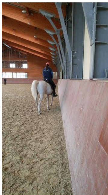
Slika 10. Izvedba Travers na konju lipicanske pasmine u Ergeli Đakovo

- Travers se izvodi u prikupljenom kasu i galopu. Bočno kretanje konja na način da je glava konja primaknuta zidu a konj gleda u smjeru svog kretanja pri čemu je konj savijen oko jahačeve unutarnje noge. Travers se započinje tako da se stražnji dio trupa gurne unutar staze ili se nakon ugla ne vraća na stazu, jaši se pod kutom od 35 stupnjeva (slika 10.). Sprijeda i straga se vide četiri traga (HKS, 2015.).