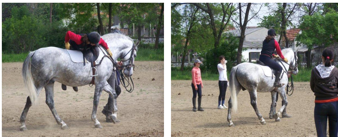
Slika 2. Postupno privikavanje konja na jahača (izvor: Budimir 2016.)

dvoje ili više ljudi. Kod najahivanja jahač ne smije odmah sjesti na konja, već se postepeno konj privikava na težinu jahača (slika 2.). Prvo penjanje na konja obavlja se tako da se jahač trbuhom nasloni na sedlo. Kada se konj navikne da ima nekoga na leđima jahač može normalno sjesti u sedlo. Prva jahanja rade se na malim ograđenim površinama te započinju laganim korakom konja. Nakon nekoliko dana postepeno se uvodi lagani kas, a nakon toga i galop. Nakon što se konj navikne na jahača, nakon nekoliko dana, ukoliko je miran tijekom jahanja može se maknuti lonža i nastavlja se jahanje u krug bez lonže. Kada procijenimo da je konj pripremljen, može se prijeći na veće otvoreno jahalište (Ivanković, 2004.).