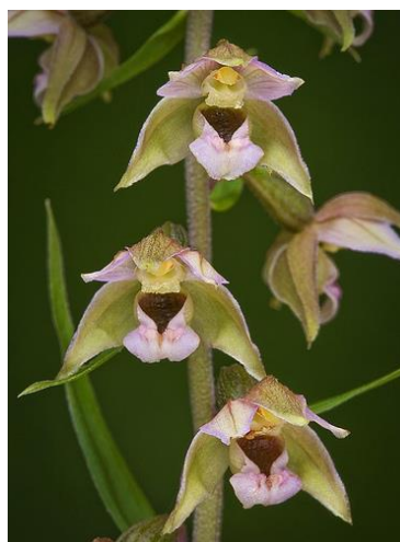
Slika 10. Epipactis helleborine