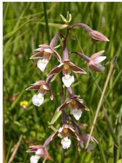
Slika 12. Epipactis palustris