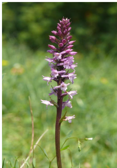
Slika 14. Gymnadenia odoratissima (L.)

http://www.orchidmeadow.co.uk/gallery.html )