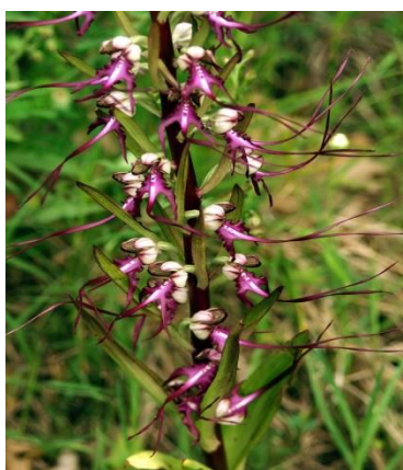
Slika 16. Himantoglossum caprinum (L.) Spreng.