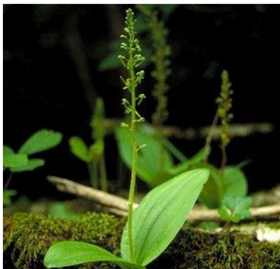
Slika 19. Listera ovata L.