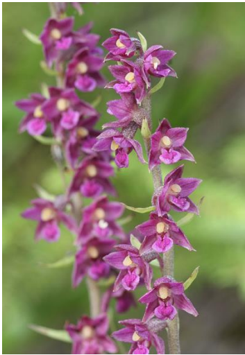
Slika 9. Epipactis atrorubens

Raste u bukovim šumama i šumama brdskog područja. Cvate od lipnja do rujna.