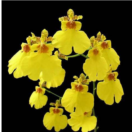
Slika 30. Vrsta roda Oncidium