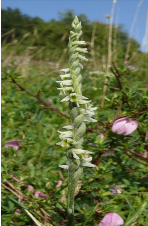
Slika 23. Spiranthes spiralis (L.) Chevall