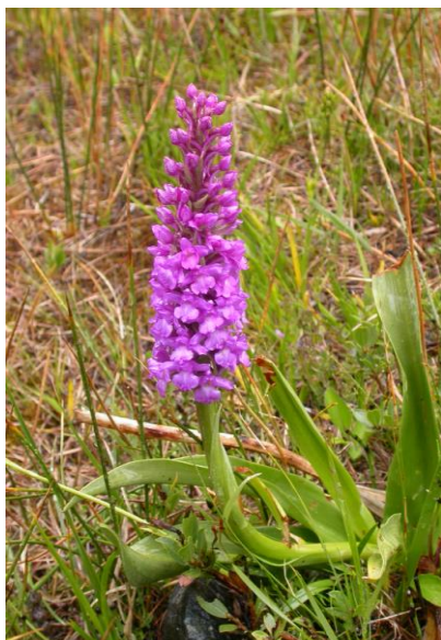
Slika 13. Gymnadenia conopsea (L.) R.