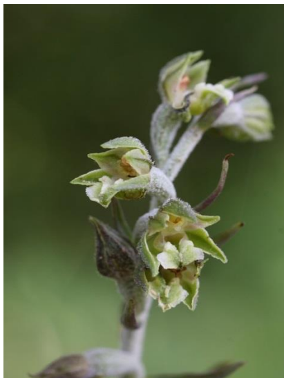
Slika 11. Epipactis microphylla