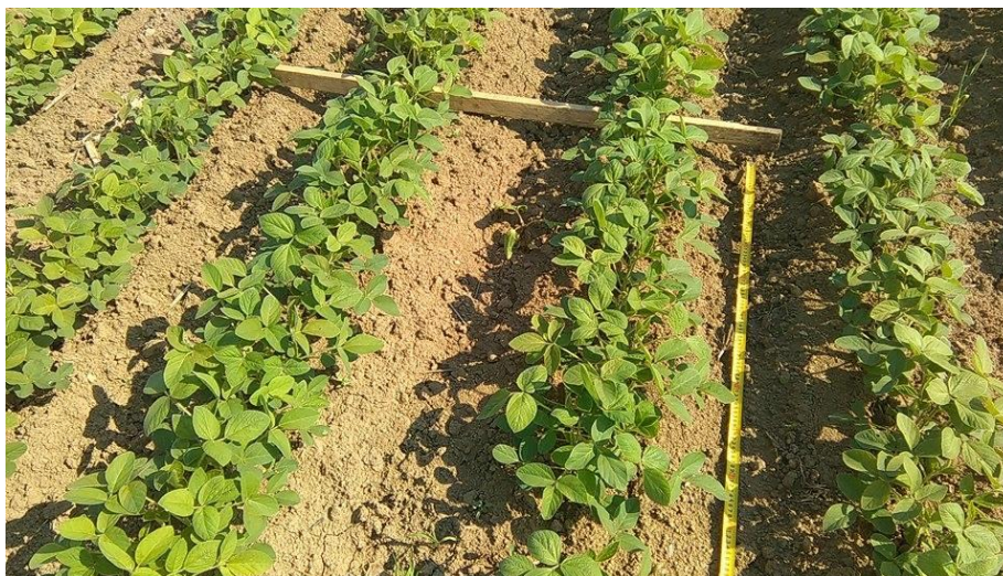
Slika 15. Metoda prebrojavanja ličinki po m^2 na soji

U poljima soje, krajem svibnja pronađene su ličinke Vanessa cardui L. (stričkovog šarenjaka). Pregled i prebrojavanje gusjenica vršio se na m^2 nasumičnim odabirom deset mjesta u polju kako bi se utvrdio prag odluke i primijenila odgovarajuća zaštita na površinama gdje je bilo potrebe za njom (Slika 15.).