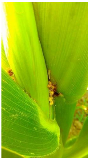
Slika 11. Tragovi ubušivanja kukuruznog moljca uz klip

Kukuruzni moljac jedan je od najznačajnijih štetnika u ratarstvu. Polifag je, ali najveće štete čini u kukuruza. Njegova prisutnost može sniziti prinose od 2- 25% pa i više (Maceljski i Igrc, 1991.). Kod kukuruznoga moljca izražen je spolni dimorfizam, ženke su nešto veće (raspon krila oko 3 cm) i svjetlije, dok su mužjaci tamniji i sitniji (Capinera, 2008.). Štete čine gusjenice. Prezimljava u stadiju ličinke u biljnim ostacima. Leptiri su dobri letači te se pri masovnim letovima jako brzo mogu proširiti. Ženke odlažu jaja na naličje lista u glavnu žilu. Ličinke se pri razvitku kratko hrane na listu te se ubušuju u stabljiku kukuruza gdje nastavljaju ishranu izgrizajući njen sadržaj i ometaju protok vode i hranjivih tvari (Slika 11.).