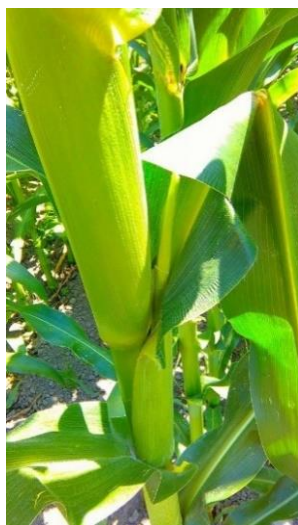
Slika 10. Izlazak klipa iz lisnog pazušca

Kukuruz je jednodomna biljka, ima odvojen muški i ženski cvat, ali se nalaze na istoj biljci. Muški cvat se naziva metlica, a ženski klip. Metlica se nalazi na vrhu stabljike te se sastoji od jedne glavne te nekoliko bočnih grana na kojima sazrijeva polen. U određenom trenutku polen sazrije, te počne opadati. Jedna metlica može imati oko 150 – 200 milijuna peludnih zrnaca. U samoj oplodnji je bitno da su vremenski uvjeti tih nekoliko dana povoljni, te da je voda pristupačna biljci. Klip se formira u pazušcima listova (Slika 10.).