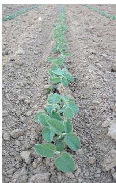
Slika 4. Pojava prvih trilistni soje

Stabljika soje je visine 80-120 cm ovisi o sorti koja se sije ( Pospišil, 2010.). Stabljika se sastoji od članaka ili internodija kojih ima od 10-18. Grananje soje ovisi o prostoru koji jedna biljka ima, tako su biljke u rjeđem sklopu u pravilu razgranatije dok su biljke u gušćem sklopu slabije razgranate.