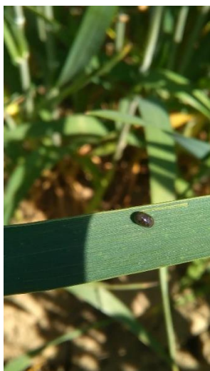
Slika 2. Ličinka žitnog balca na zastavičaru

Žitni balac je jedan od najučestalijih štetnika na pšenici. Imago je dug 4 – 6 mm, pokrilje mu je plave boje, a noge i nadvratni štitić narančasti. Godišnje imaju jednu generaciju, a prezimljavaju u obliku imaga na ostacima strnih žitarica. Prva imaga se pojavljuju u proljeće kada srednje dnevne temperature dostignu 7°C (Macelj i Igrc, 1991.). Štete prave ličinke i imaga progrižanjem listova u vidu crtičastih trakica. Ženka odlaže 100-150 jaja, a uz više temperature period embrionalnog ciklusa se smanjuje (Guppy i Harcourt 1978.).