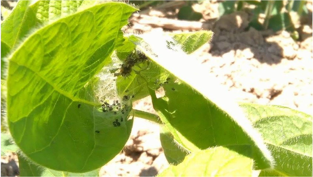
Slika 17. Ličinke stričkovog šarenjaka pronađene na listovima soje