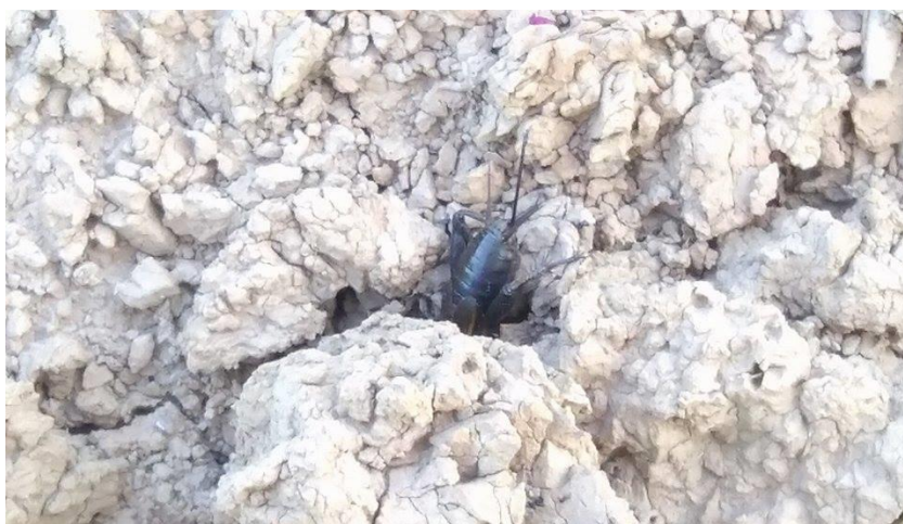
Slika 8. Poljski šturak na ulasku u rupu

Poljski šturak pripada redu pravokrilaca. Jedni su od većih kukaca na našem području, dugi su 2-3 cm i crne su boje (Maceljki i Igrc, 1991.). Žive u rupama u tlu koje se mogu lako uočiti (Slika 8.). Polifagi su, hrane se svim vrstama bilja, a najveće štete u ratarskim kulturama čine na suncokretu, to jest na listu suncokreta u obliku izgrizenih rupa na listovima. Prezimljava u obliku imaga ili ličinke.