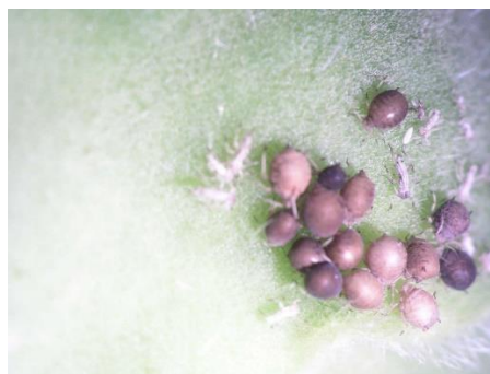
Slika 19. Ličinke lisnih ušiju na glavici suncokreta

Na pločama koje su postavljene u soji i suncokretu nisu uočene štetne vrste kukaca. Pregledom polja suncokreta pronađene su glavice suncokreta obložene kolonijama lisnih uši. Brojnost kolonija bila je velika na rubnim dijelovima parcela te je prema Banks-ovoj ljestvici ocjenjena ocjenom 2 – 3 ovisno o polju (Slika 19.).