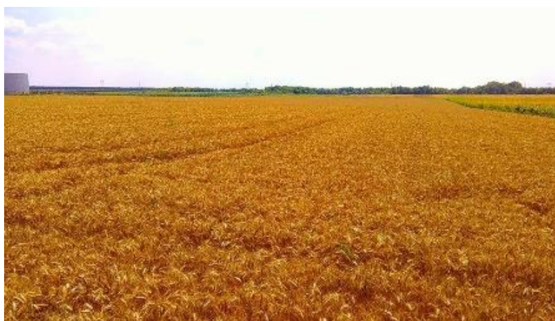
Slika 1. Pšenica u punoj zriobi

Uz uške se nalazi i jezičac koji sprječava ulazak vode u prostor gdje se spajaju stabljika i list, te samim time sprječava razvoj mikroorganizama. Plojka je dio lista koji je površinom višestruko veći. Izražene je centrale nervature i izduženog oblika.