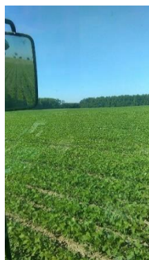
Slika 5. Soja u zadnjim vegetativnim stadijima