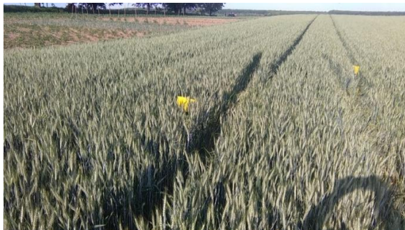
Slika 13. Postavljene ploče na pšenici sorte Mia,

Ploče su pregledavane dva puta tjedno u trajanju 6 tjedana.