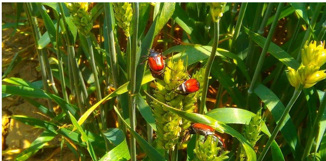
Slika 3. Žitni pivci na klasovima pšenice

Pivci su kukci koji imaju smeđe pokrilje, a neke vrste imaju i križić na njima. Tijelo im je dugo oko 15 mm (Maceljski i Igrc, 1991.). Imaga se javljaju krajem svibnja i početkom lipnja. Pivci imaju usni ustroj za grizenje i žvakanje, te se hrane na klasovima vrsta iz porodice Poaceae (Slika 3.). Prehranu vrše tako što izgrizaju sadržaj zrna dok je zрно u mliječnoj zriobi. Razvojni ciklus im traje dvije godine, a prezimljuju u obliku ličinke koja se naziva grčica. Razvoj ličinke traje 22 mjeseca, te se imago pojavljuje tek u trećoj godini. Imago štete čini na klasovima u rubnim dijelovima polja, pretežito u sušnijim godinama (Ivezić, 2008.), dok grčice štete čine na korijenu žitarica. Pogoduje im uzgoj u monokulturi, ili uski plodored strnih žitarica. Nakon jedne godine uzgoja žitarica na istoj površini očekuje se 1 grčica/m 2 , dok se nakon tri uzastopne godine uzgoja žitarica na istoj površini očekuje 10 grčica po/m 2 (www.agroklub.com). Pragom odluke smatra se 4-6 pivaca na m 2 .