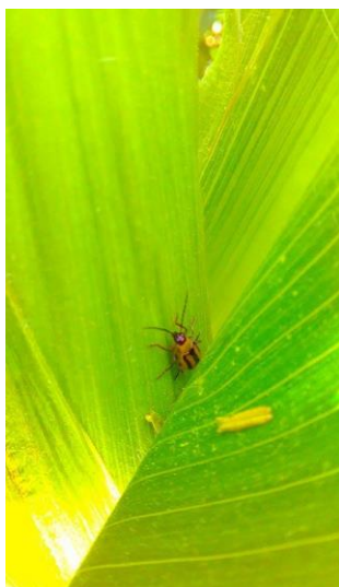
Slika 12. Kukuruzna zlatica u pazušcu lista kukuruza

Kukuruzna zlatica je vrsta koja je 1992. godine unesena iz Amerike u Europu. Kroz sljedećih nekoliko godina raširila se u 30 europskih zemalja ( https://gd.eppo.int/ ). Ovaj kukac je veličine nekoliko milimetara, dobar je letač i velike štete pravi na kukuruзу.