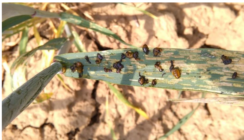
Slika 21. Ličinke žitnog balca tri dana poslije tretiranja s „LAMBDA 5EC“

Kultiviranjem soje krajem mjeseca svibnja uočene su paučinaste prevlake na listovima koji su bili izgrizeni. Pregledom je utvrđena prisutnost ličinki Vanessa cardui L. Polja koja su bila zahvaćena ovim štetnikom tretirana su insekticidom „Nurelle D“ (klorpirifos-etil) te su se biljke mogle neometano dalje razvijati. Ovaj tretman insekticidom bio je potreban iz razloga što ovaj štetnik u pogodnim uvjetima kakvi su za njega bili ove godine, ima 2-3 generacije. Bergman i Pedigo (1978.) također su utvrdili učinkovitost insekticida protiv gusjenica stričkovog šarenjaka na bazi karbarila međutim od 2007. godine ova aktivna tvar zabranjena je u zemljama članicama europske unije ( http://eur-lex.europa.eu/ ). U toplijim krajevima s višim temperaturama cijeli ciklus razvoja od jajeta do imaga traje između 33 i 44 dana, dok se u hladnijim ciklus produžuje na oko 60 dana (Stefanescu i sur., 2013.). Aplikacijom insekticida zaustavio se dalji napad i širenje ovog štetnika. Prinosi soje nisu bili sasvim zadovoljavajući (1.9 – 2.5 t/ha) zbog visokih temperatura koje su zahvatile cijeli srpanj te pola kolovoza 2015. godine. Prema Raspudić i sur. (2007.) 2007. godine također je uočena masovna pojava stričkovog šarenjaka na soji gdje je brojnost bila čak 4-5 gusjenica po jednoj biljci soje.