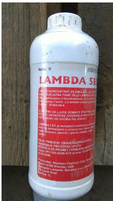
Slika 20. Insekticid „Lambda 5EC“

Prve veće štete na usjevima pojavile su se početkom mjeseca svibnja na pšenici. Oulema melanopus L. je pronađena u nekim poljima, te je apliciran insekticid aktivne tvari lambda cihalotrin (Slika 20.) kako bi se spriječilo dalje širenje i oštećenje biljaka.