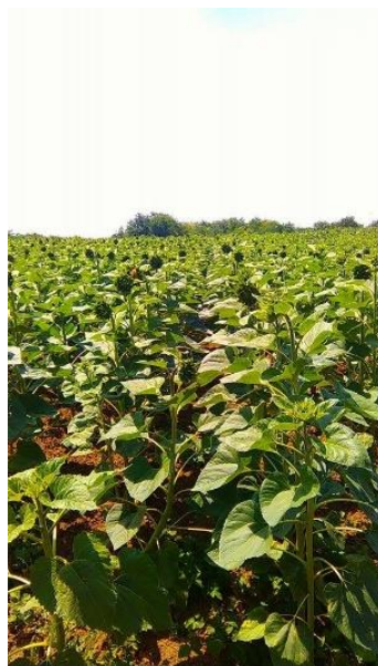
Slika 7. Suncokret pred cvatnju

Korijen suncokreta je vrlo dobro razvijen. Glavni korijen prodire u tlo na dubinu od 2-3 metra. Kao i kod ostalih biljaka, većina korijenove mase je u oraničnom sloju. Korijen se u početnim fazama razvija više nego nadzemni dio. Korijen ima jaku apsorpcijsku moć i zbog toga čak i u sušnim uvjetima može opskrbljivati biljku vodom iz dubljih slojeva tla.