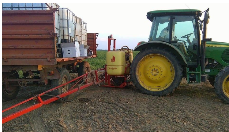
Slika 16. Punjenje prskalice vodom i pesticidima u polju

U zaštiti usjeva korišten je traktor John Deere serije 5820 te nošena prskalica zahvata 12 metara (Slika 16.). Prskalica je kapaciteta 650 litara. Za tretiranje 1 ha prskalica potrošila je oko 200 litara vode. Kako bi se tretiranje što brže obavilo, korištene su i četiri plastične cisterne od 1000 l instalirane na prikolicu.