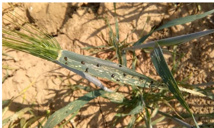
Slika 18. Žitni balac

Pregledom pšenice utvrđeno je prisutstvo žitnog balca. Štete od žitnog balca već su bile vidljive te se pristupilo prebrojavanju ličinki. U poljima gdje je bilo potrebe za tretmanom insekticidima, moglo se pronaći čak i do 10-12 ličinki po listu zastavičaru što prelazi ekonomski prag štetnosti utvrđen za pšenicu od 0,5-1 ličinka po listu zastavičaru za očekivani prirod veći od 6 t/ha (Maceljski, 1999.). Zaražena pšenica uglavnom je bila na rubnim dijelovima parcela (Slika 18.), dok je na ostalim dijelovima parcela utvrđena jedna ličinka žitnog balca na svakom drugom ili trećem listu zastavičaru.