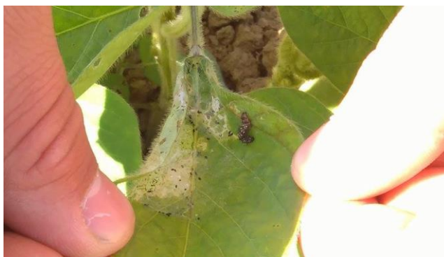
Slika 6. Gusjenica stričkovog šarenjaka na listu soje

Leptir je hrđasto crvene boje s mnogo šara. Raspon krila mu je oko 5.5 cm. Ova vrsta je periodični štetnik soje i suncokreta, iako se hrani i korovima. Štete na listovima uzrokuju ličinke (gusjenice). Masovni let u godinama kada ova vrsta pravi štete počinje u proljeće. Jedan imago odlaže oko 500 jaja na listove. Razvoj gusjenice iz jaja traje 2-3 tjedna ovisno o temperaturi.