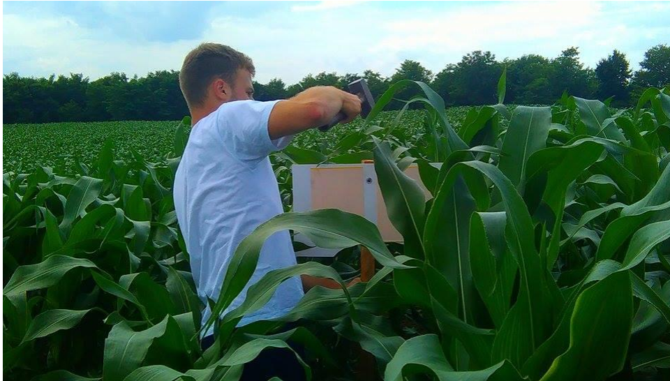
Slika 14. Postavljanje ljepljivih ploča u kukuruzište