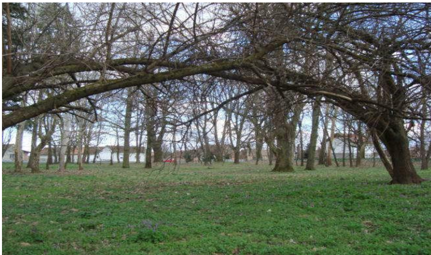
Slika 16_ Perivoj dvorca