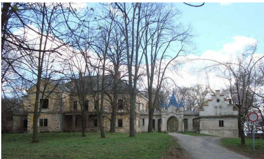
Slika 11_Sjeverno pročelje dvorca