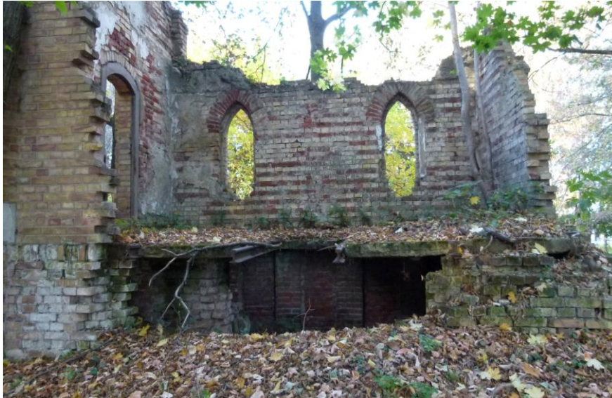
Slika 19_Grobna kapelica (zapadna strana)