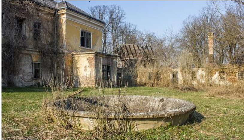
Slika 27_Betonska kružna fontana