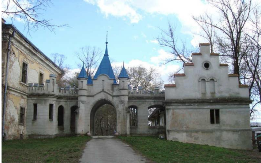
Slika 13_Ulazni paviljon – pogled sa sjeverozapada