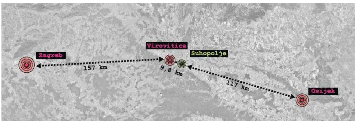
Slika 3_Prikaz prosječnih udaljenosti Suhopolja od Zagreba, Virovitice i Osijeka; izrađivač: ZPUVPŽ