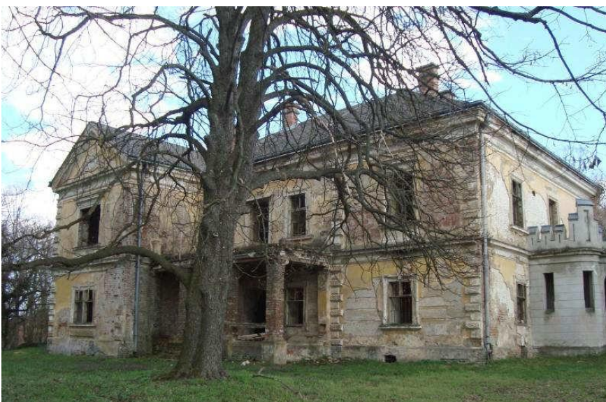
Slika 12_Središnja zgrada dvorca