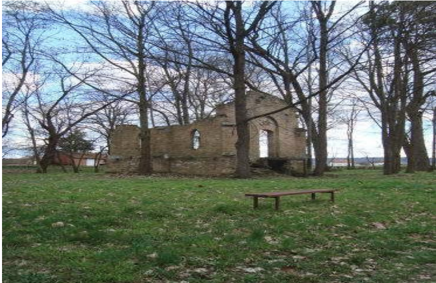
Slika 17_Grobna kapelica