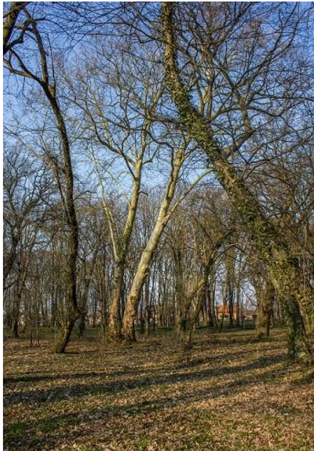
Slika 24_Perivoj dvorca