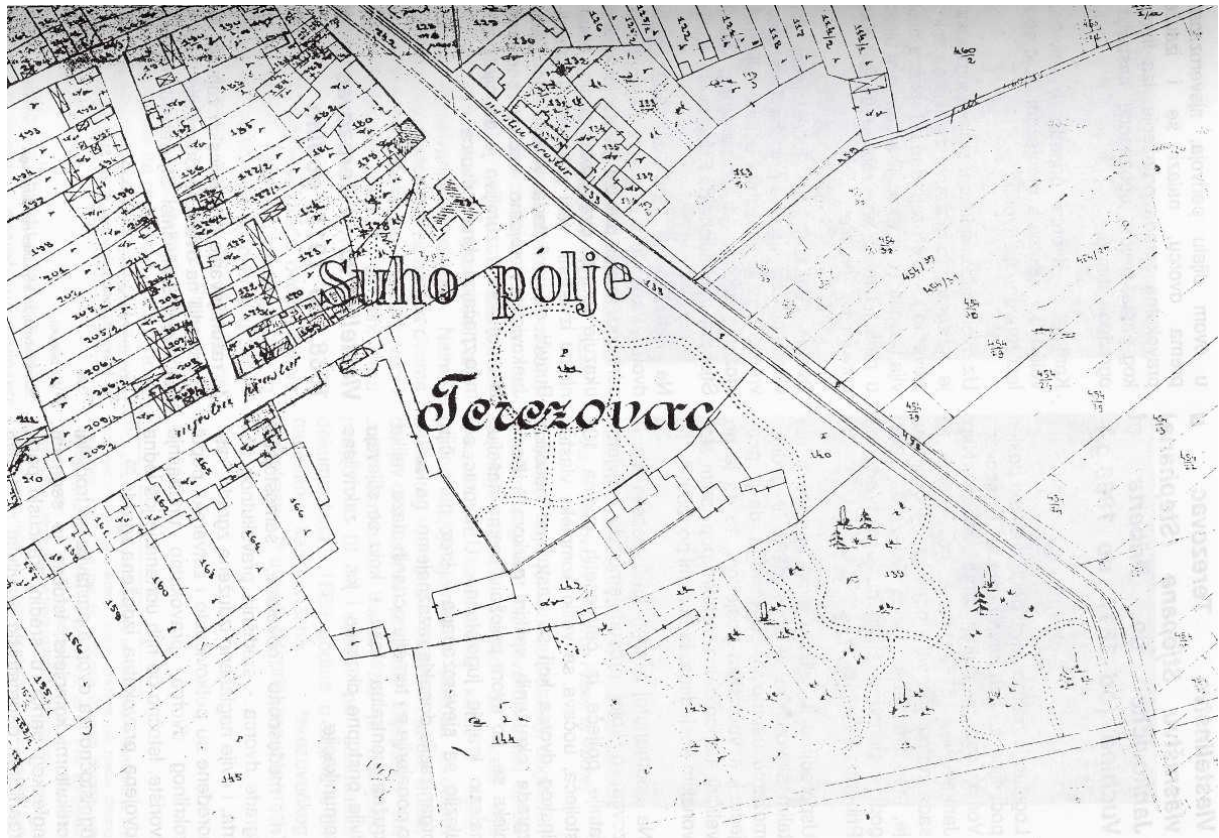
Slika 8_Katastarski plan iz 1862. g.; izvor: Dvorac u Suhopolju; Tone Papić; Osijek, 1993.

Prema katastarskom planu (slika 8) iz 1862. godine, istočno od dvorca nalazila se još jedna samostojeća pravokutna i izdužena zgrada, koja poput konjušnice s manježom, nekoć smještene zapadno od dvorca, te oranžerije smještene jugozapadno od dvorca, danas tamo više ne postoji 5 .