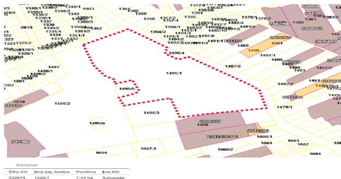
Slika 6_ Prikaz katastarske čestice na kojoj se nalaze dvorac i perivoj

Za sve građevne zahvate na zaštićenim kulturnim dobrima, kao i za radove održavanja, te nadzor u svim fazama radova, potrebno je od nadležnog Konzervatorskog odjela ishoditi posebne uvjete (postupak ishodaženja lokacijske dozvole) i prethodno odobrenje (postupak izdavanja građevne dozvole). Nadalje, samo na temelju posebnih uvjeta Konzervatorskog odjela moguća je i provedba uređenja okoliša.