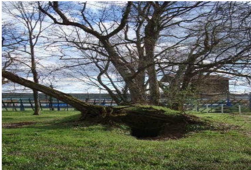
Slika 18_Ledenica