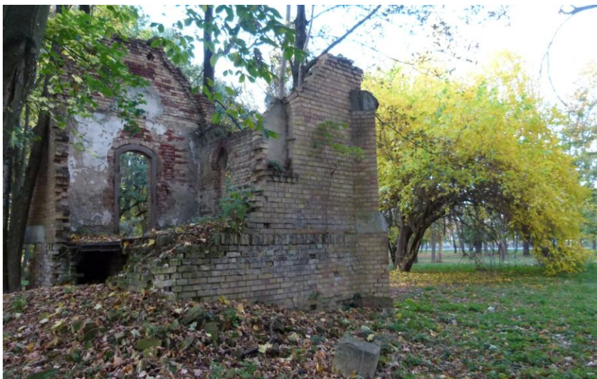
Slika 20_Grobna kapelica (južna strana)