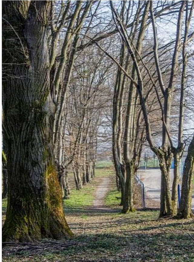
Slika 25_Perivoj dvorca