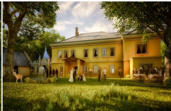
Slika 10_Virtualni prikaz preuređenog dvorca; južna strana

Hotel bi trebao imati 30 soba sa 60 ležajeva, sagradit će se i bazen, saune, wellness centar, restoran s kulinarskim praktikumom za potrebe gastro akademije, wine bar te dvorane za praktične radionice u kojima će se održavati i prezentacije lokalnih i regionalnih proizvoda.