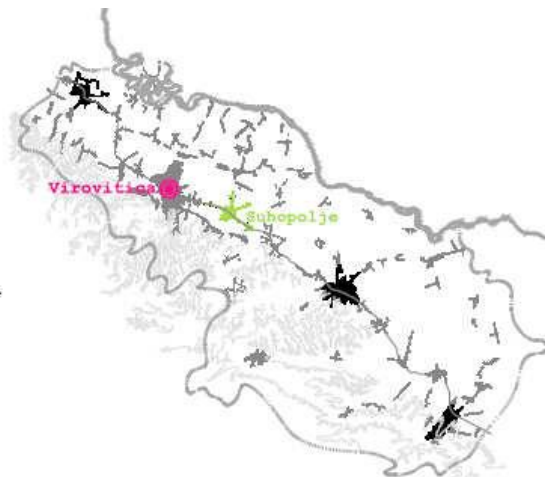
Slika 2_Položaj naselja Suhopolje u Virovitičko-podravskoj županiji; izrađivač: ZPUVPŽ