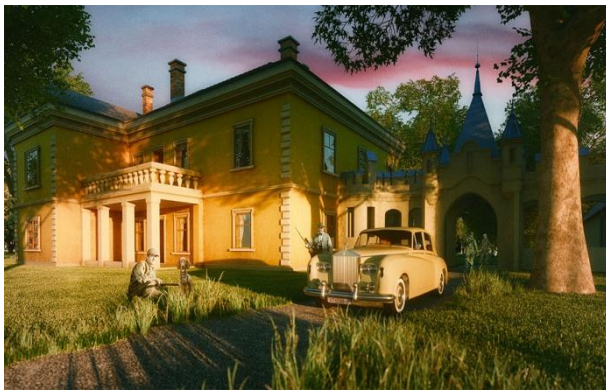
Slika 9_Virtualni prikaz preuređenog dvorca; sjeverna strana

Predlaže se da se dvorac preuredi u tzv. školski hotel. Recepcioneri, kuhari, sobarice, menadžment hotela, čistačice, konobari i sve ostalo osoblje bit će sastavljeno od učenika i studenata kojima će mentori biti stručnjaci, a cilj je da mladi tamo ostanu raditi ili da se pripreme za tržište rada. Zbog toga bi i cijena smještaja trebala biti mnogo niža nego u objektima iste kategorizacije - noćenje bi moglo stajati oko 50 eura.