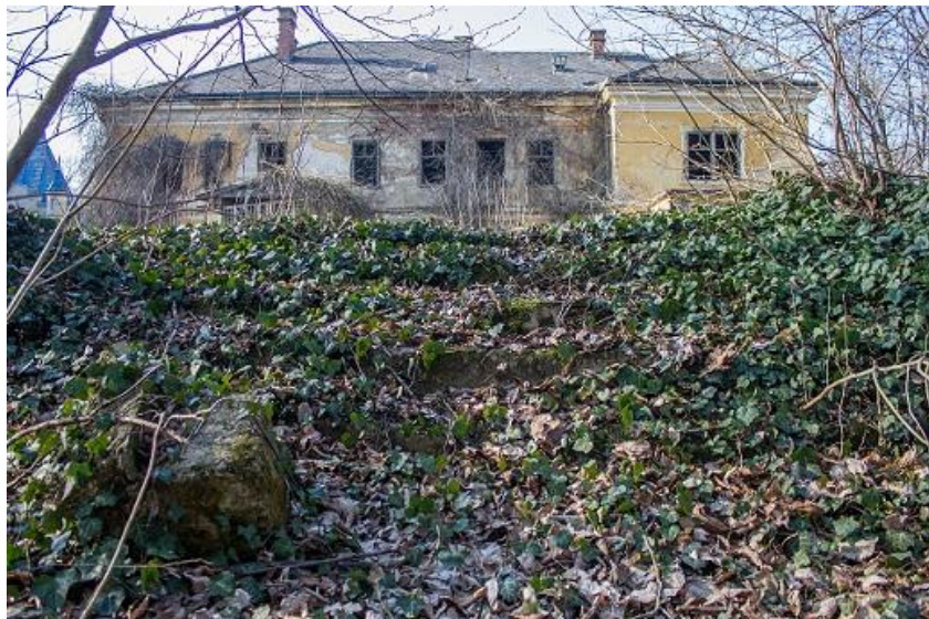
Slika 26_Stube dvorišnog prostora