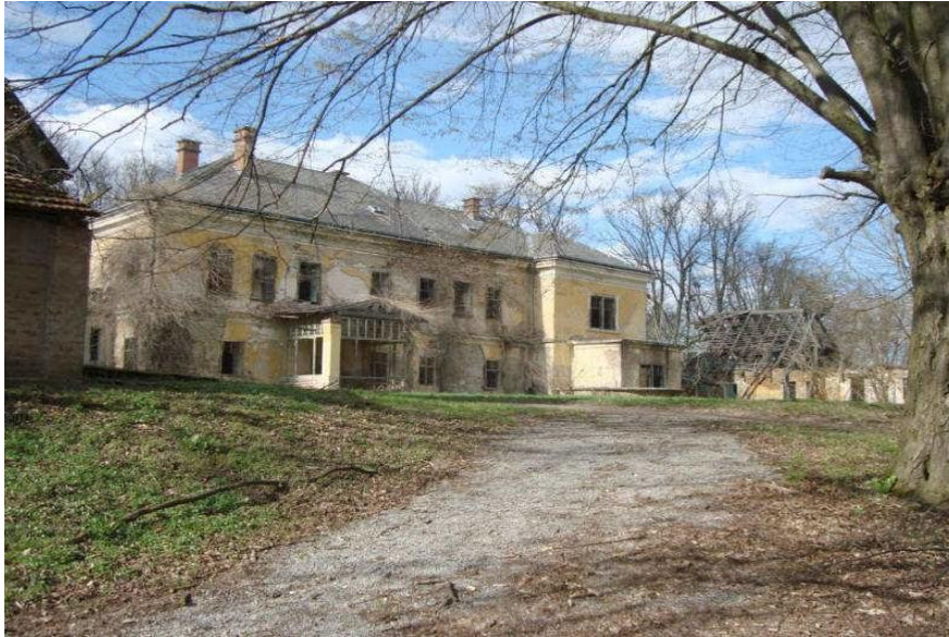
Slika 15_ Pogled prema unutrašnjem dvorištu s juga