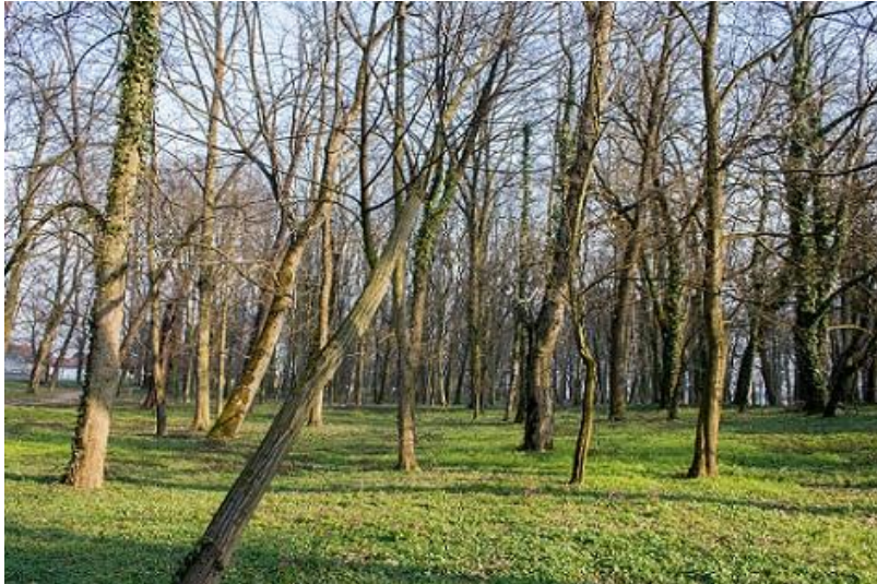
Slika 23_Perivoj dvorca; snimio Matija Gotal