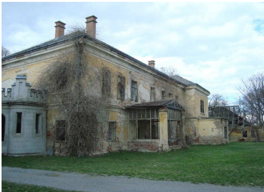
Slika 14_ Dvorišna (južna strana) središnje zgrade