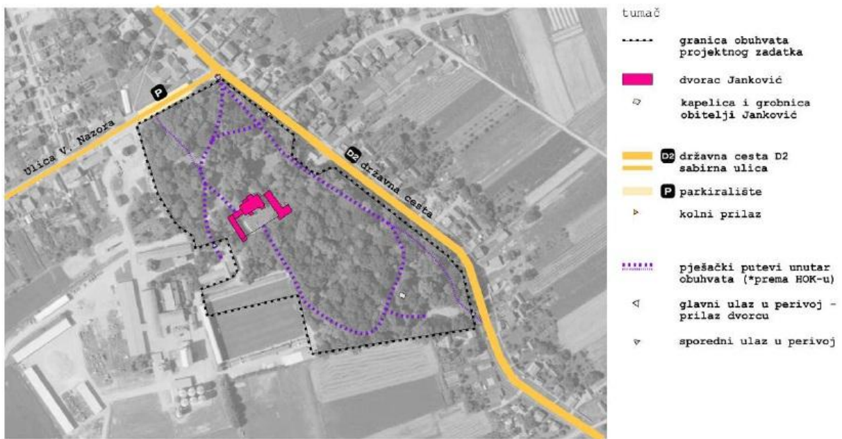
Slika 4_ Postojeći kolni i pješački promet; izrađivač: ZPUVPŽ

U neposrednoj blizini dvorca Janković u Suhopolju promet se odvija državnom cestom D2, koja tangira perivoj dvorca na njegovoj sjeveroistočnoj strani, te sabirnom ulicom (Ulica V. Nazora), koja tangira perivoj na njegovoj sjevernoj strani. U Ulici V. Nazora organizirano je parkiralište s obje strane ulice nasuprot perivoju, dok parkiranje vozila na samoj parceli dvorca nije riješeno. Unatoč tome, određen broj vozila parkiran je uz prilazni put koji vodi do restorana i kuglane jugozapadno od dvorca. Pješački putevi i staze unutar perivoja su putevi i staze čije su trase uglavnom trase puteva i staza prvotnoga perivoja, koje je potrebno obnoviti. Glavni ulaz u perivoj nalazi se na sjeveru i u neposrednoj je blizini križanja Ulice V. Nazora s državnom cestom D2. Osim toga, postoje još tri ulaza u perivoj. U perivoj je moguće kolno ući sa sjeveroistoka preko asfaltirane površine koja vodi sve do restorana i kuglane.