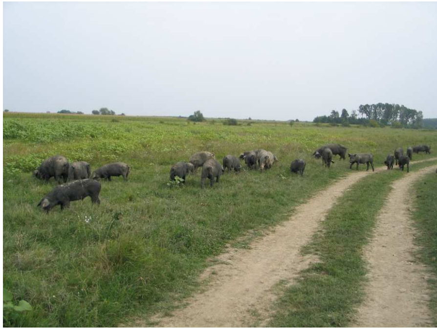
Slika 2. Crne slavonske svinje u otvorenom sustavu držanja