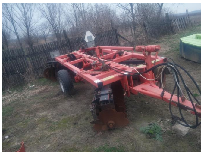
Slika 3. Teška tanjurača OLT