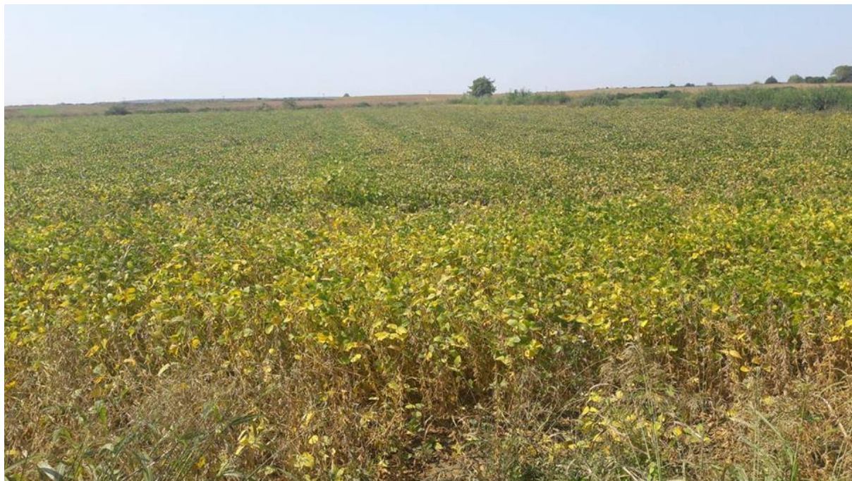
Slika 5. Usjev soje na OPG-u Milinković

najmanjim mogućim gubicima. S obzirom da je sojina slama nepovoljnija za vršidbu, a zrno zatvoreno u mahuni vršidbeni aparat kombajna treba raditi sa smanjenim brojem okretaja.