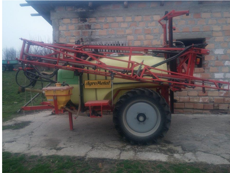
Slika 4. Prskalica Hardi 1200 l