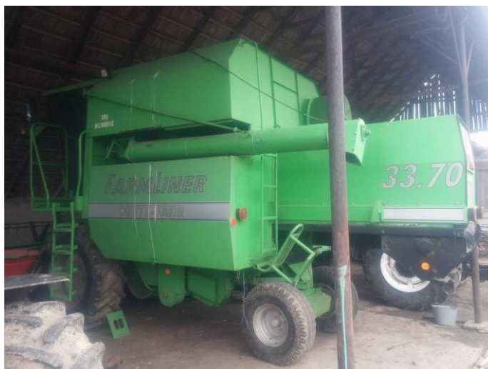
Slika 1. Kombajn Deutz Fahr 33.70