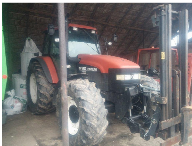
Slika 2. Traktor New Holand M160