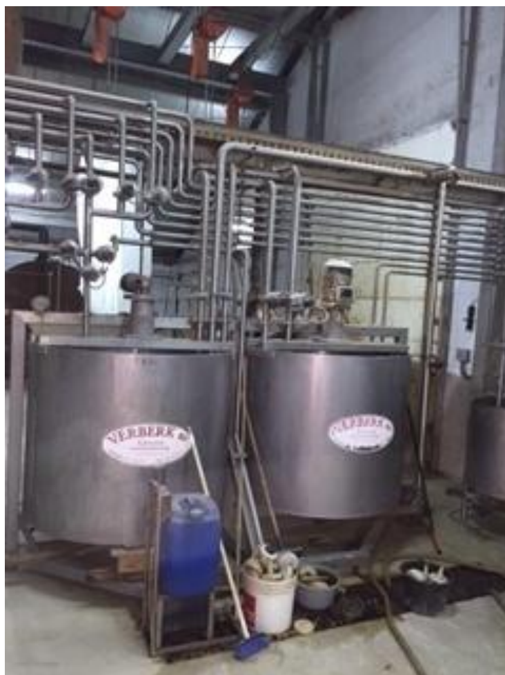
Slika 7. Centralna kuhinja u staji br.2

Materijali korišteni za izgradnju farme su beton, opeka i čelik. Temelji i prihvatne jame za gnoj su od vodonepropusnog betona. Zidovi su od opeke na koju dolazi čelična nosiva konstrukcija, krovšte je od izolacionog panela debljine 6 cm. Vanjska strana krovšta je od izoliranog lima, a unutrašnja strana panela je folija otporna na amonijak i vlagu. Unutar proizvodnih objekata u objektu br. 2 smještena je centralna kuhinja tj. proizvodno mjesto gdje se pripravlja mliječna zamjena za hranidbu teladi. Centralnu kuhinju čine 3 prihvatna tanka za superkoncentrate i sirutku te tri pužna transportera, koji iz tankova transportiraju sirovinu u centralni tank za miješanje. U centralnom tanku se miješa superkoncentrat, sirutka, topla voda te palmino i kokosovo ulje. Temperatura vode u bojlerima je 70 °C, a temperatura ulja je 40 °C. Temperatura kod napajanja je 38 °C. Sustavima cijevi gotova mliječna zamjenica transportira se u sva tri objekta. U staji broj tri je skladište superkoncentrata i sirutke.