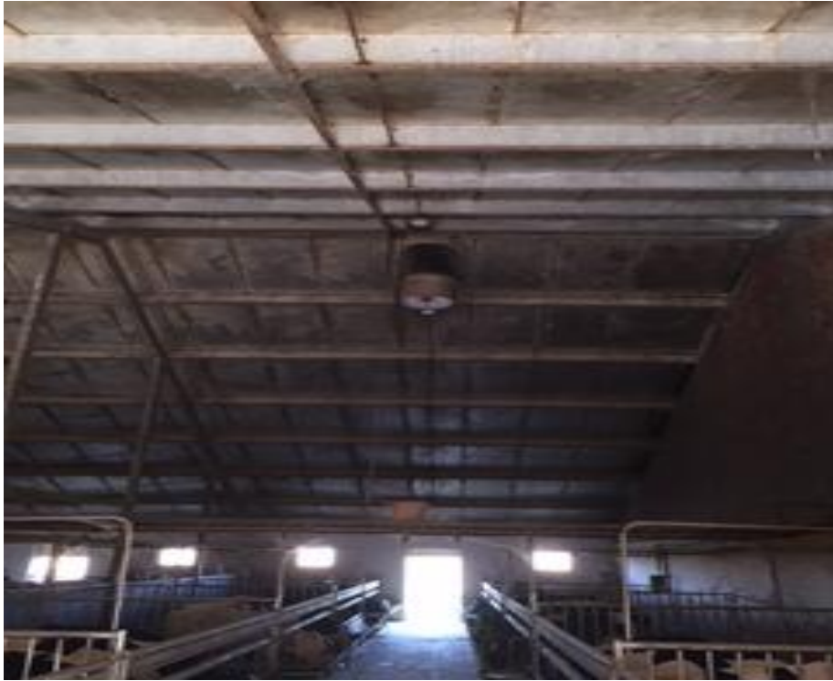
Slika 5. Ventilacija na farmi teladi