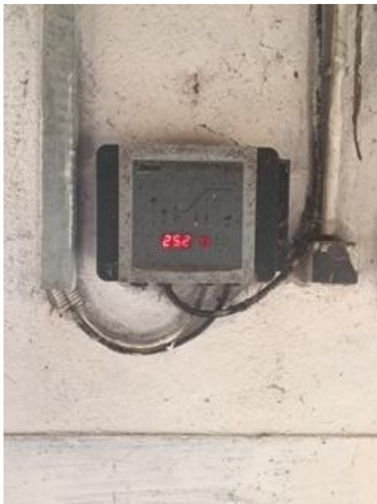
Slika 4. Upravljačka jedinica za ventilaciju proizvodnog objekta

Oprema za boksove na farmi je od nizozemskog proizvođača, a to su: drveni podovi od specijaliziranog amazonskog drveta termički obrađenog i zaštićenog, pregrade na boksovima su od inox cijevi i navedenog drveta i valovi za napajanje su od tvrde plastike. Ventilacija u stajama je poluautomatska i omogućuje redovnu filtraciju zraka. Pod staje tj. unutrašnjost boksa je drvena rešetka, što osigurava udobno i toplo ležište za telad. Skladište gnojovke nalazi se ispod rešetaka dubine 1,2 m udovoljavaju propisima europske unije, jer kapacitetom omogućavaju prihvatanje gnojovke u razdoblju od 8 mjeseci. Pražnjenje gnojovke provodi se prema kalendaru za raspodjelu gnojovke sukladno EU propisima te se izvozi na polja u neposrednoj blizini farme.