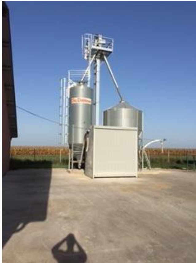
Slika 12. Cikloni za spremanje koncentriranih krmnih smjesa za telad

Prijem teladi na farmi odvija se po principu formiranja skupina od 120 teladi, koja popunjava jedan odjel u staji. Po prijemu telad dobiva izotoničnu otopinu u količini od 2 litre po teletu. Telad se u prvom razdoblju tova hrani mliječnom zamjenom, starter smjesom za telad i ječmenom slamom. Skladištenje smjesa starter i grover te smjese za tov teladi je u ciklonima smještenim na farmi, a miješanje smjesa je u drugom objektu.