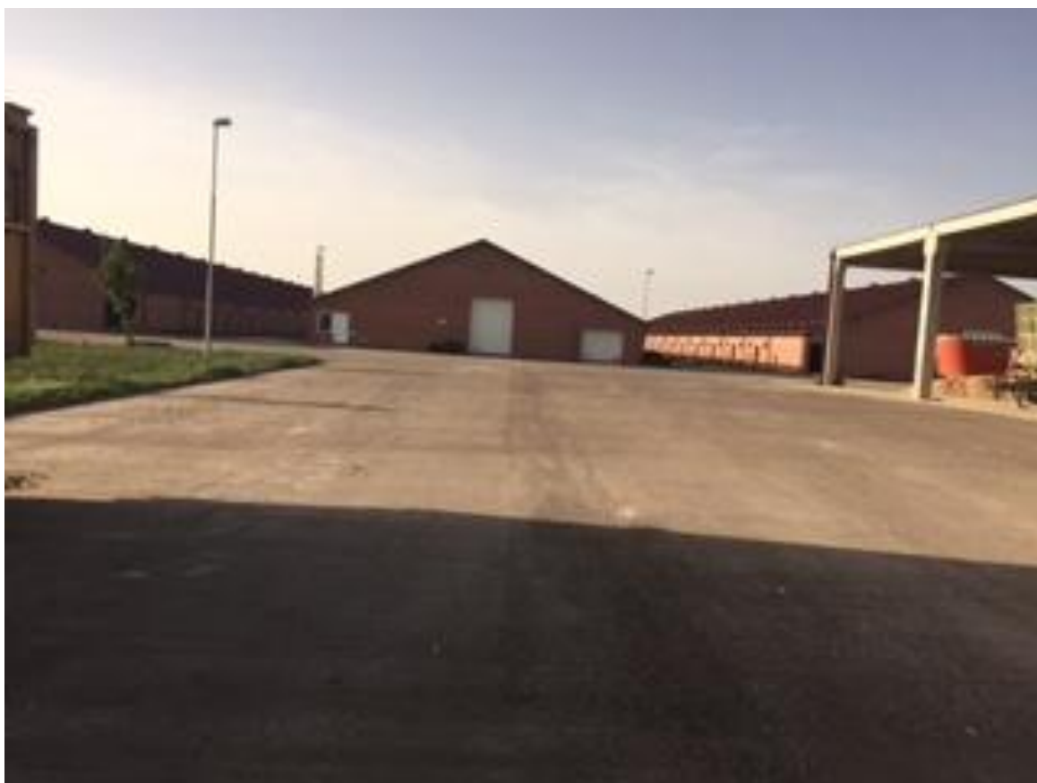
Slika 3. Proizvodni objekti farme teladi Simental Commerce d.o.o.

Farma teladi Simental Commerce d.o.o. se nalazi u Tenju. Izgrađena je 2008. godine, a idejni projekt za ovu farmu potječe od nizozemske tehnologije uzgoja teladi. Farma se sastoji od tri tovna objekta (staje za tov) koje su poredane jedna pored druge. Staje su dugačke 118 m, širine su 24 m i visine 9 m. Svaka staja se sastoji od 7 odjela u kojima se nalazi 4 reda po 5 boksova. Širina odjela je 24 m, a dužina odjela je 15 m. Dužina boksa je 2,75 m, a širina 4,20 m. Boks je kapaciteta 6 teladi, što znači da se u svakoj staji nalazi 840 teladi. Po jednom turnusu u sva tri objekta je smješteno oko 2 520 teladi.