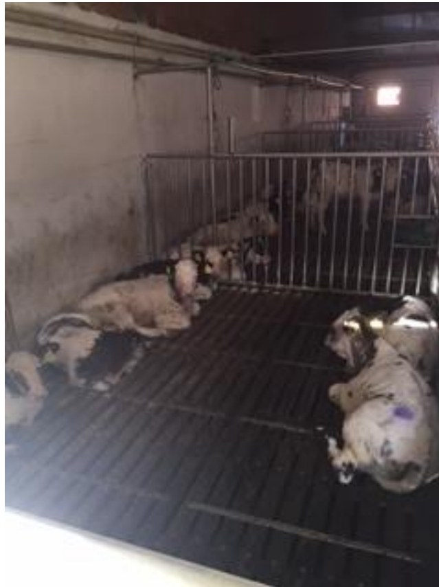
Slika 6. Drvene rešetke u boksu