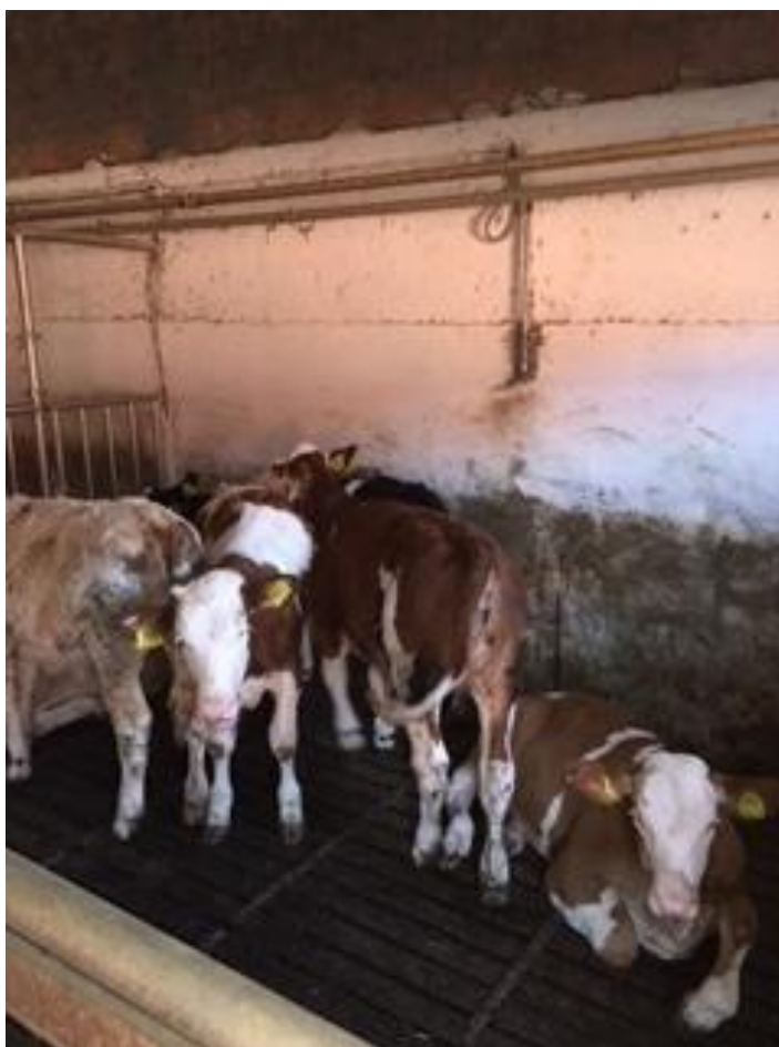
Slika 11. Telad simentalke pasmine u tovu

Telad holstein pasmine dolaze na farmu sa starošću od 15 – 30 dana i tjelesnom masom od 50 –60 kg. Pri dolasku smještaju se individualno u boksove i to tako da prvo razdoblje uzgoja vremenski traje trideset dana. Nakon toga ostaju u boksu po šest teladi na slobodnom načinu držanja. U objektima 2 i 3 se tove telad simentalke pasmine i mesni križanci, a oni dolaze u tov sa starošću 2 – 3 mjeseca i tjelesne mase od 90 – 120 kg. Drže se grupno u boksu od po šest teladi. Telad holstein pasmine u dobi od 6 – 8 mjeseci upućuje se na klanje, a simentalka telad i mesni križanci u dobi od 6 – 8 mjeseci idu u daljnji tov, tov junadi.