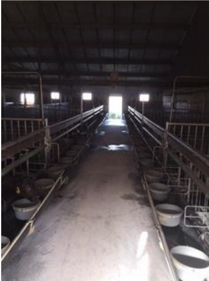
Slika 1. Kantice za napajanje teladi mlijekom

napajanju teladi je higijena. Nezadovoljavajuća higijena dovodi do proljeva, što u težim oblicima može izazvati i uginuća.