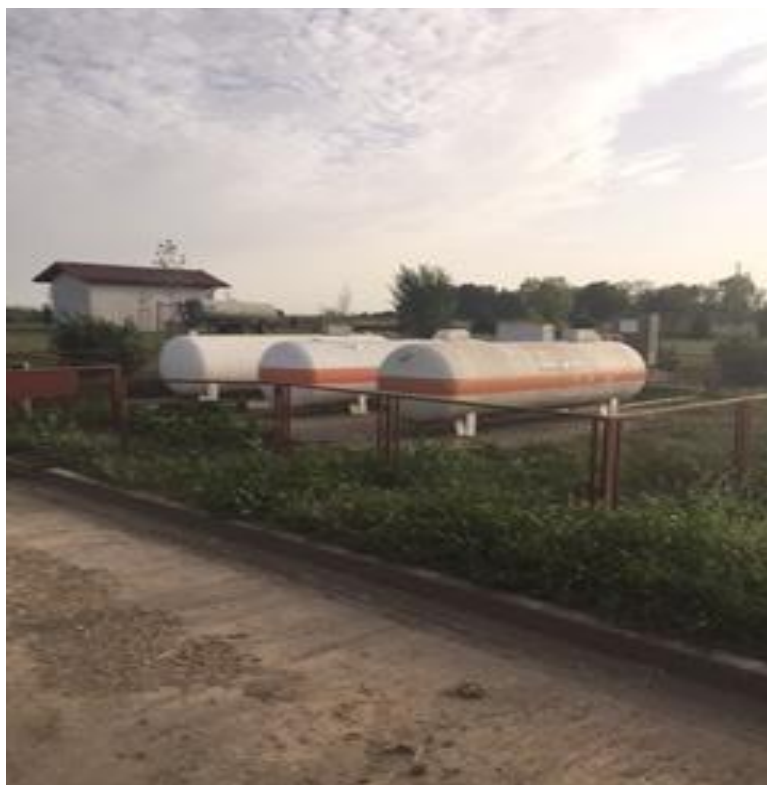
Slika 9. Tankovi za plin