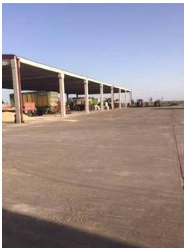
Slika 10. Nadstrešnica za mehanizaciju