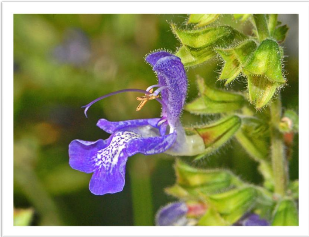
Slika 2. Građa cvijeta predstavnika porodice Lamiaceae

Porodica Lamiaceae je biljna porodica iz reda Lamiales (Štefanić, 2014.). Ime je dobila po vjenčiću koji je građen u obliku gornje i donje usne (Slika 2. ). Cvjetovi predstavnika ove porodice su dvospolni (ponekad poligamni) i monosimetrične građe.