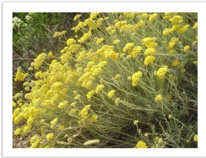
Slika 8. Helichrysum arenarium (L.) Moench- Smilje

Smilje je trajna zeljasta biljka sivkaste boje, obrasla vunanim dlakama (Slika 8.). Naraste do 60 cm visine. Stabljika je uspravna, ne razgranjena, i na njoj su na izmjenice raspoređeni listići čvrste kutikule, koji su s lica zeleni, a s naličja sivo zeleni, prekriveni sitnim dlačicama. Donji listići pri osnovi su skupljeni u rozetu.