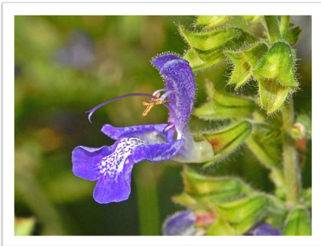
Slika 2. Građa cvijeta predstavnika porodice Lamiaceae

Porodica Lamiaceae je biljna porodica iz reda Lamiales (Štefanić, 2014.). Ime je dobila po vjenčiću koji je građen u obliku gornje i donje usne (Slika 2. ). Cvjetovi predstavnika ove porodice su dvospolni (ponekad poligamni) i monosimetrične građe.