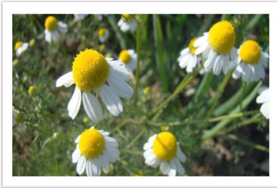
Slika 9. Prikaz cvati kamilice