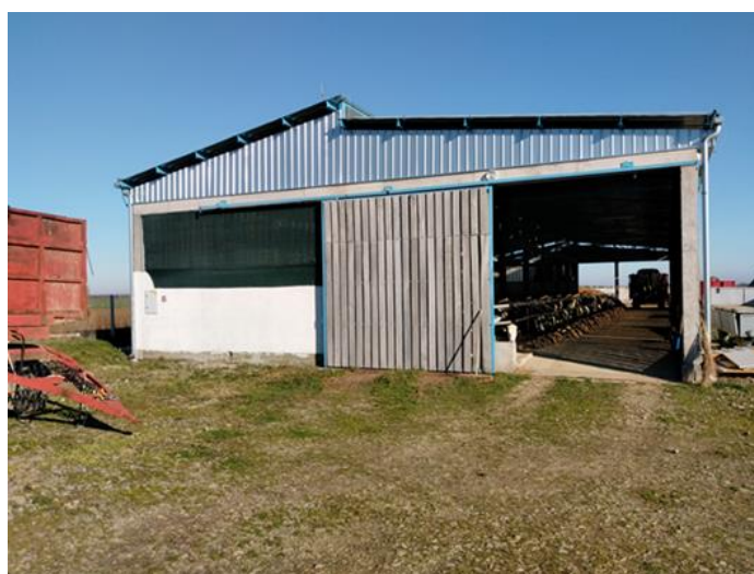
Slika 7. Proizvodna staja

Na OPG-u Franković staja je podijeljena na kosi pod, blatni hodnik i hranidbeni hodnik. Pod staje je puni pod od betona. Vrata su klizna, napravljena od željeznih okvira na koje su učvršćene daske u razmaku od 3 cm. Vrata se nalaze na blatnom i hranidbenom hodniku.