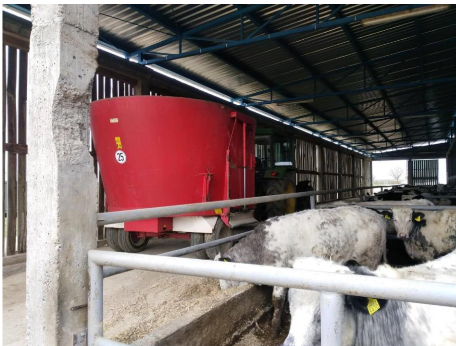
Slika 17. Mikser prikolica za pripremu i raspodjelu obroka u staji

Zadnjih godina sve značajnije mjesto u hranidbi zauzimaju „mikser prikolice“ u kojima se krmiva doziraju (važu), usitnjavaju i miješaju u „kompletno izmiješani obrok“. U ovako pripremljenom obroku krmiva su potpuno izmiješana te goveda ne mogu probirati krmiva, čime se popravlja učinkovitost hranidbe te umanjuje učestalost hranidbom uvjetovanih metaboličkih poremećaja.