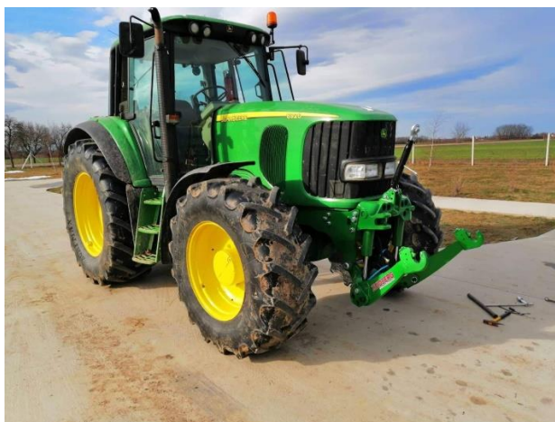
Slika 14. Traktor