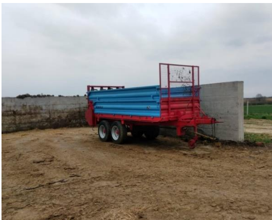
Slika 15. Prikolica