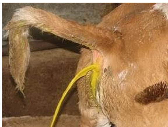
Slika 19. Proljev kod teladi

Proljev je najčešći veliki problem u uzgoju teladi i može znatno usporiti rast i razvoj teleta u određenom razdoblju. Dva su najčešća uzroka proljeva: zarazni proljev nastaje zarazom bacilom Colli, najčešće preko pupka ili probavnog trakta. Izmet teleta je žućkasto bijel, neugodnog mirisa, a tele je bez teka. Liječenje je skupo i često neuspješno. Preventivna mjera je bespriječna higijena poroda. Običan proljev nastaje uslijed hranjenja hladnim, slabo kiselim ili bakterijama zarađenim mljekom, upotrebom prljavog posuđa kod napajanja, sisanjem bolesnog vimena, prevelikih količina mlijeka, neredovitih obroka, nečistih objekata, pokvarenih krmiva i drugog. Kada dođe do proljeva treba drastino smanjiti obrok, količinu mlijeka na 1-1,5 l prokuhanog mlijeka. Nakon poboljšanja postupno povećavamo količine hrane u obroku (Caput, 1996.).