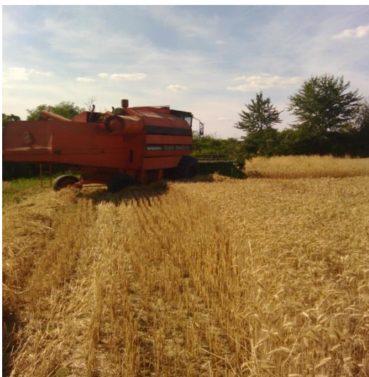
Slika 13. Kombajn

OPG Franković raspolaže s mehanizacijom nešto starijeg tipa, a nešto novijeg. Mehanizacija je prilagođena broju hektara i veličini gospodarstva. Za obradu usjeva OPG sadrži sve potrebne strojeve, te u svome vlasništvu ima 3 traktora i kombajn.