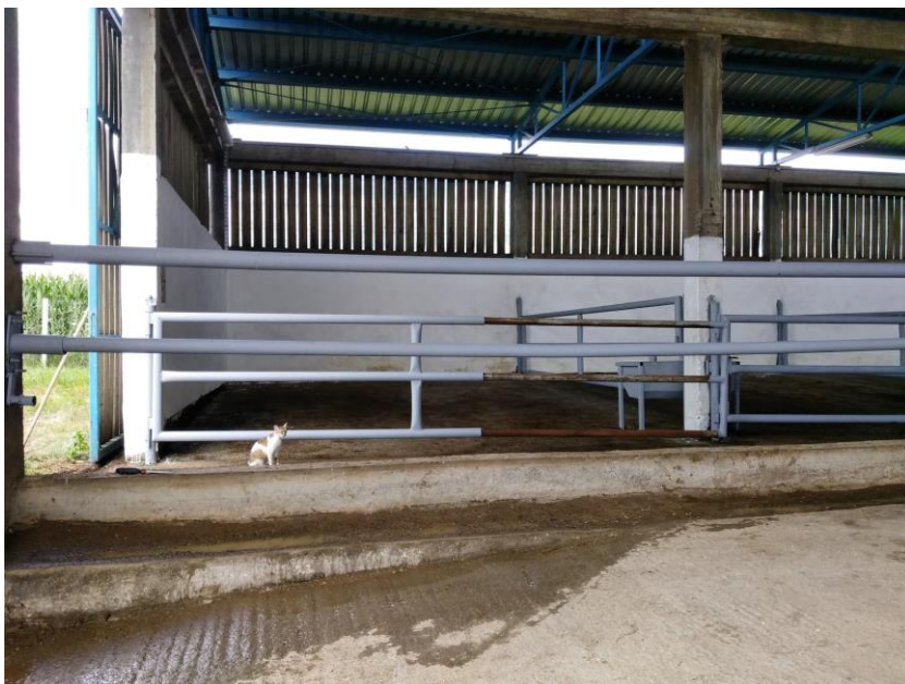
Slika 9. Staja nakon čišćenja