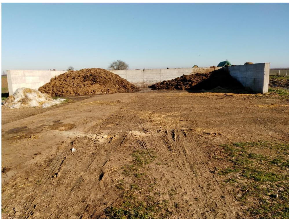
Slika 11. Betonski plato za smještaj krutog dijela stajnjaka

U blizini štale nalazi se betonski plato na kojemu se odlaže stajnjak. Betonski plato ograđen je zidovima visine 2 m. Ispod njega nalazi se betonska jama koja je vodonepropusna tako da ne dođe do izlivanja, ispiranja ili otjecanja stajskog gnoja u okoliš i onečišćenja podzemnih i površinskih voda.