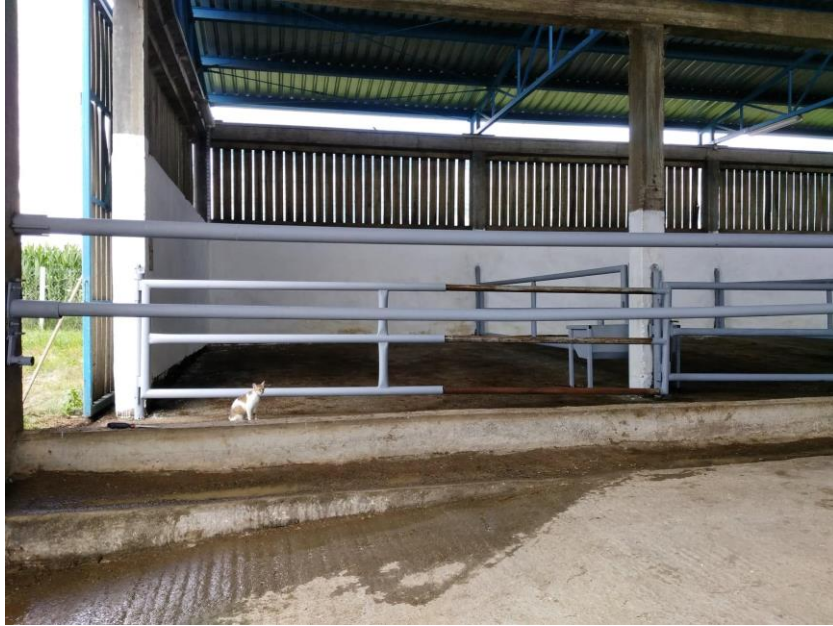
Slika 9. Staja nakon čišćenja