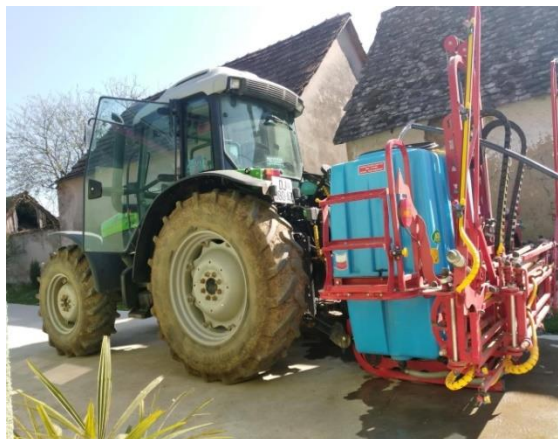
Slika 16. Prskalica