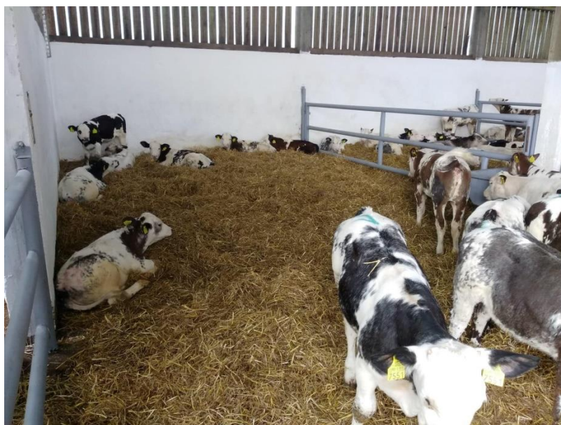
Slika 10. Telad u boksovima

Nakon dolaska nove teladi na farmu, čišćenje se obavlja svaki drugi dan. Na početku telad je teška do 150 kg, te je važno da boravi u suhom i čistom prostoru, kako nebi došlo do razvoja bolesti. Tijekom čišćenja pregrade se izvlače i telad se zatvara na kosi pod, tako da blatni hodnik ostane prazan. Bagerom se stajnjak odgura u betonski plato. Nakon toga dovozi se slama, jedna rolo bala ručno se razbacuje na dva boksa.