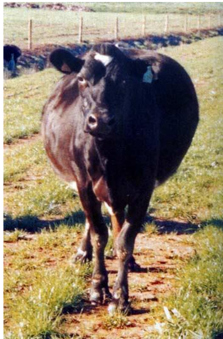
Slika 20. Nadam

Nadam nastaje nakon uzimanja većih količina lako fermentirane hrane, a to su leguminoze, lišće kupusa, trop i druga hrana. Može biti posljedica hranjenja pokvarenom i pljesnivom hranom ili napajanja odmah nakon hranidbe sočnim krmivima ili hranidbe pašom. Pojavom nadma prestaje preživanje, javlja se strah, često baleganje i mokrenje, a ruminacije i podrigivanje prestaju, te se burag jako proširi i trbuh postaje napet. Kako bi spriječili ugibanje životinje, potrebno je snažno masirati burag svakih 10 do 15 minuta kako bi došlo do podrigivanja i izlaženja plinova iz predželudaca. Ako ovaj način ne pomogne, plinovi iz buraga ispuštaju se sondom ili troakrom.