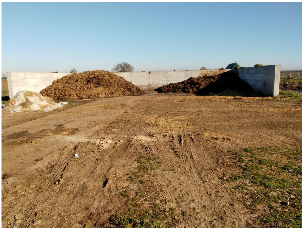
Slika 11. Betonski plato za smještaj krutog dijela stajnjaka

U blizini štale nalazi se betonski plato na kojemu se odlaže stajnjak. Betonski plato ograđen je zidovima visine 2 m. Ispod njega nalazi se betonska jama koja je vodonepropusna tako da ne dođe do izlivanja, ispiranja ili otjecanja stajskog gnoja u okoliš i onečišćenja podzemnih i površinskih voda.