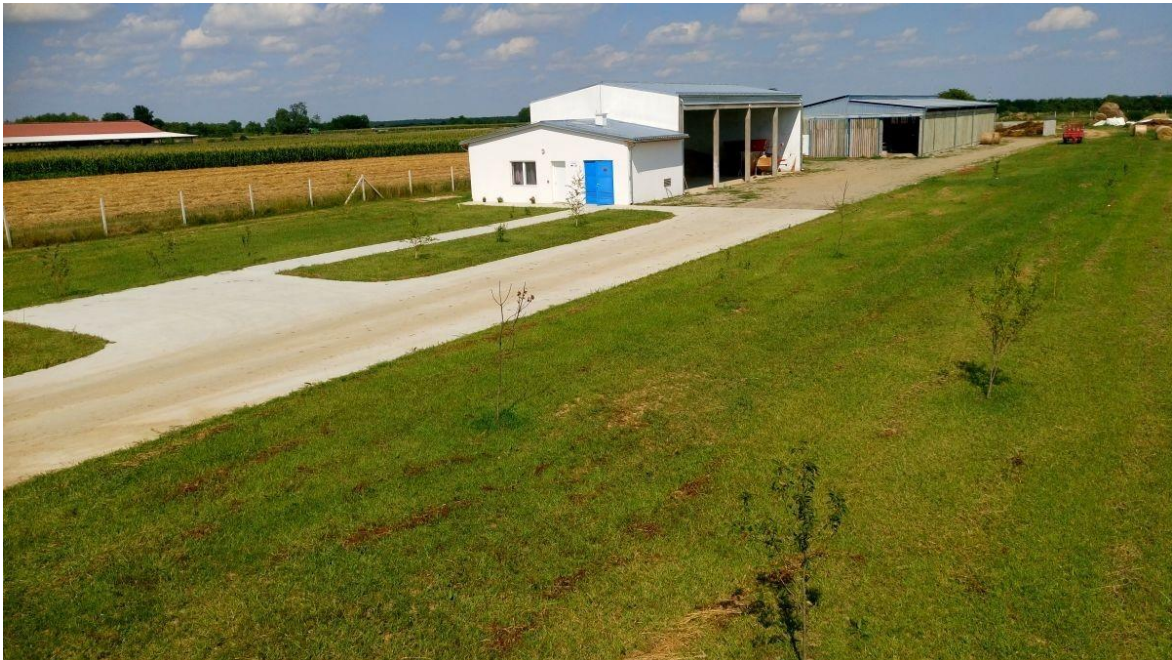
Slika 1. Farma Franković

Obiteljsko poljoprivredno gospodarstvo bavi se tovom junadi već 4 godine. Farma se nalazi na relaciji Gorjani- Đakovačka Satnica i udaljena je 500-tinjak metara od Gorjana. Osim tovom junadi, OPG se bavi i ratarstvom. Obraduje 80 hektara privatne i državne zemlje uz vlastitu mehanizaciju koju je kompletirao tijekom godina, te sam proizvodi svu hranu potrebnu za tov junadi. Na OPG-u nema radnika već cijela obitelj sudjeluje u poslu. Trenutno se na farmi nalaze 93 junice.