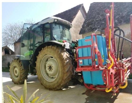
Slika 16. Prskalica