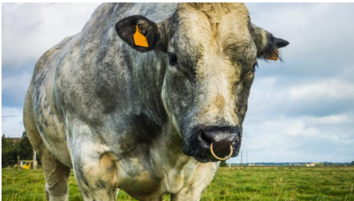
Slika 2. Bik belgijskog plavog goveda

Ova pasmina ima dug, dubok i širok trup. Tjelesna masa bikova varira između 1.100 i 1.300 kg, a krava između 700 i 900 kg. Visina bikova u grebenu je 145 do 150 cm, dok su krave visine 135 do 140 cm.