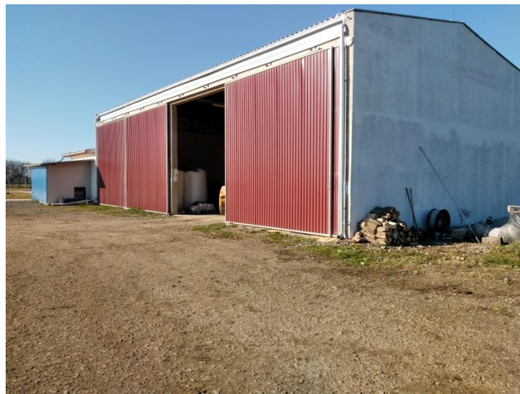
Slika 6. Nadstrešnica za skladištenje hrane

Nadstrešnica služi za skladištenje hrane i vitamina koji se dodaju u smjesu. Skladišti se kukuruz u zrnju, a ječam i soja se skladište u jumbo vrećama. Tu je smješten i mlin u kojem se melje hrana potrebna za smjesu.