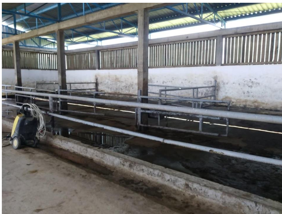
Slika 8. Čišćenje staje

Kada životinje napuste farmu radi se detaljno čišćenje štale, prvo se sav stajnjak izveze iz štale, te se sa visokotlačnim čistačem opere pod, zidovi, valov, pregrade i pojilice.