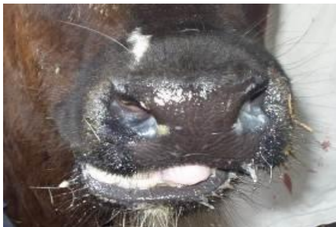
Slika 18. Tele s upalom pluća