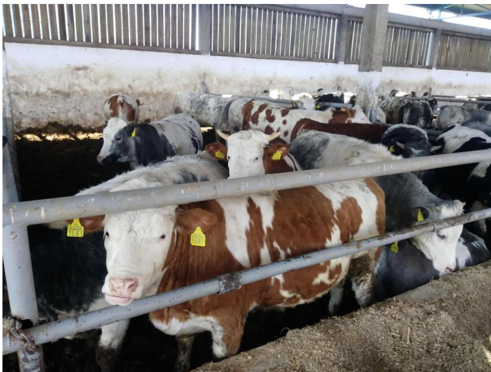
Slika 5. Simentalska goveda na OPG-u Franković