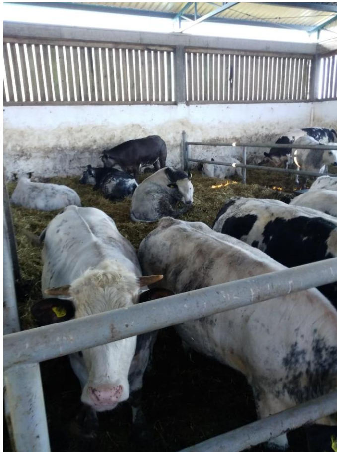
Slika 3. Križanci belgijskog plavog goveda

U tovu mladi bikovi postižu dobre priraste (između 1.200 i 1.400 g dnevno) i izvrsnu iskoristivost trupa.