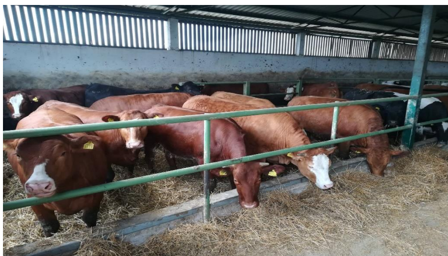
Slika 12. Grla Limusine pasmine

Limuzin je poznat i kao pasmina "crvenog mesa". Meso je intenzivno crveno, blago mramorirano, nježno i sočno. Limuzin je pogodan za intenzivne i poluintenzivne sustave proizvodnje, no također radi svoje prilagodljivosti i manje zahtjevnosti na krmi može biti korišten i pašnim sustavima proizvodnje kvalitetnog mesa uz određenu dohranu krepkom krmom