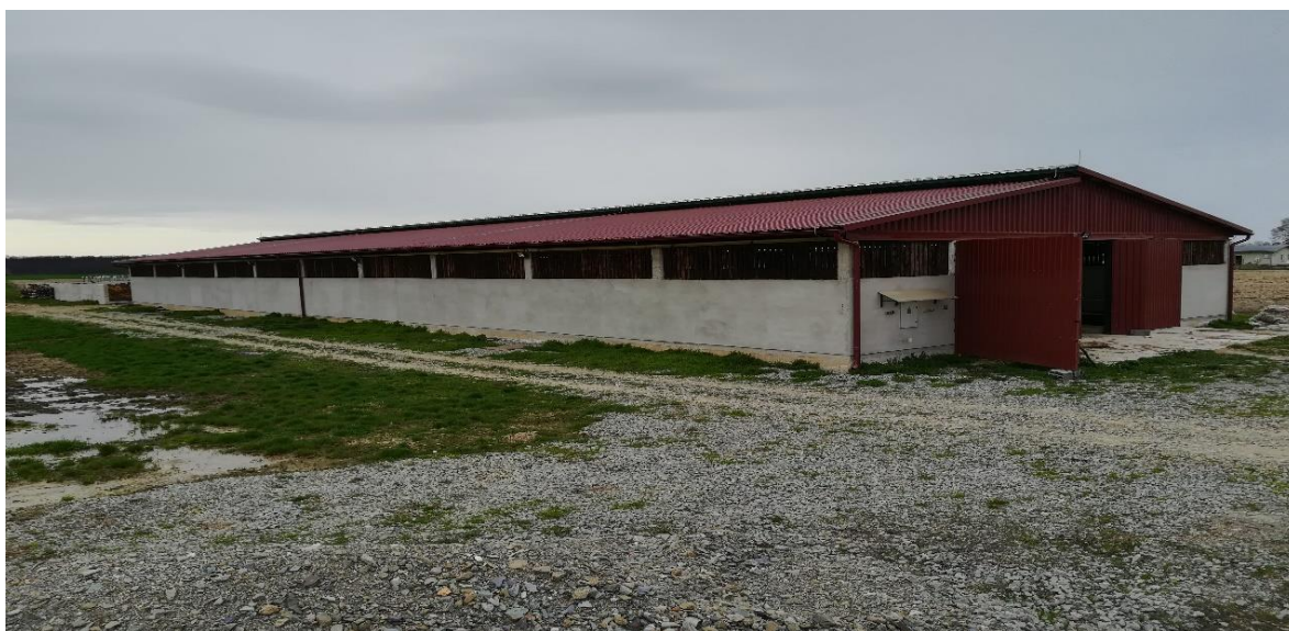
Slika 4. Objekt namijenjen za tov junadi – vanjski izgled

Objekt namijenjen tovu junadi suvremene je izvedbe i praktičan za tov junadi. Građen je 2015. godine u sklopu cijele farme. Dužina objekta je 50 metara, a širina 15 metara. Sa svake strane nalazi se pet boksova za junad. Objekt se izgnojava na principu kose ploče, odnosno kosog ležišta za goveda koja su smještena u njemu te koja svojim kretanjem guraju stajnjak niz kosinu u blatni hodnik. Stajnjak iz blatnog hodnika se strojno iznosi van objekta jednom tjedno. Slamljenje objekta vrši se dva puta tjedno. Na čelima objekta nalaze se vrata koja se otvaraju ili zatvaraju ovisno o vremenskim uvjetima. Grla se napajaju iz termo pojilica, koje sprječavaju njihovo smrzavanje zimi. Objekt je prozračan, osvijetljen i pogodan za tov. Kapacitet objekta je od 200 grla u jednom turnusu.