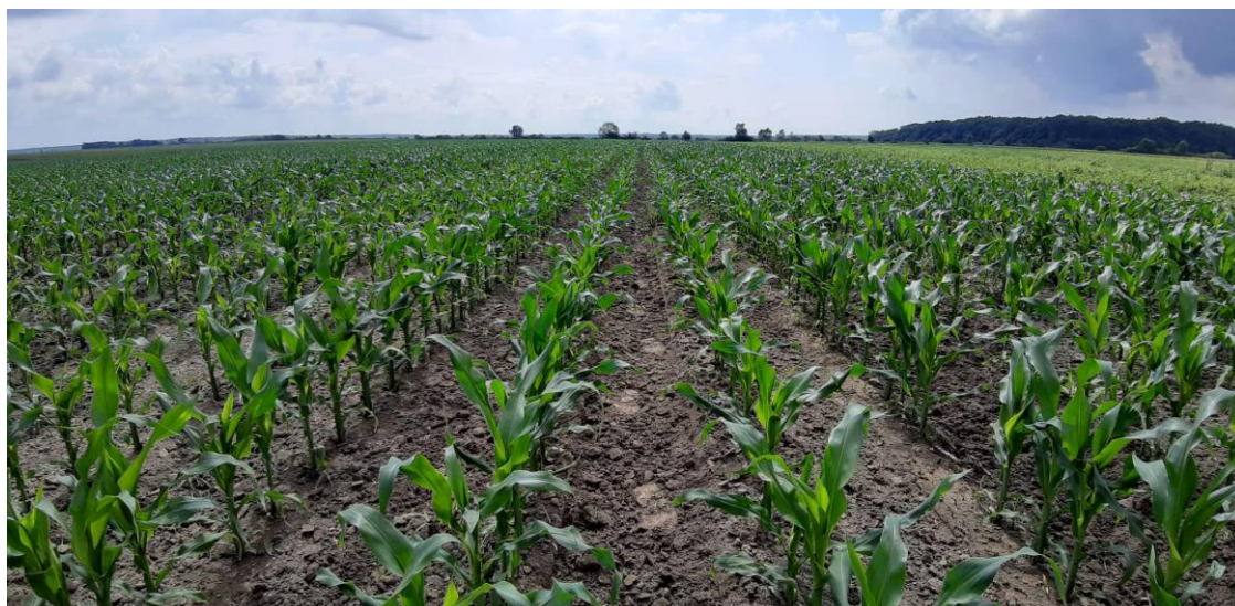
Slika 15. Kukuruz

Također važna komponenta u smjesi je i pšenica koji je treća po redu zastupljenosti od ukupne količine obradivih površina, kao i soja. Pšenicu meljemo a soju ekstrudiramo. Koristimo ih kao proteinska krmiva.