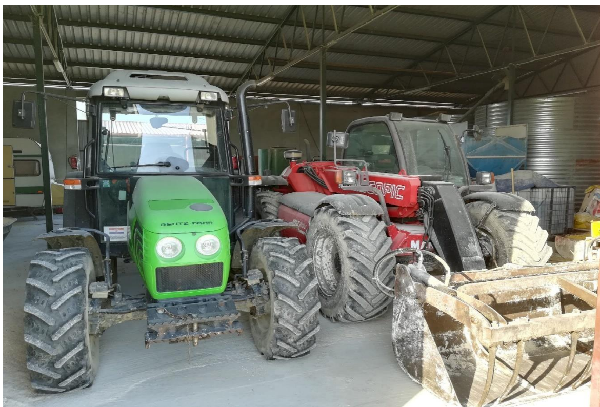
Slika 14. Traktor Deutz Fahr i teleskopski utovarivač Manitou

Na farmi zbog povećanja broja grla planira se kupovina mikser prikolice koja bi nam uvelike olakšala hranjenje i vremenski skratila vrijeme spremanja obroka kao i samo hranjenje koje se trenutno izvodi ručno.