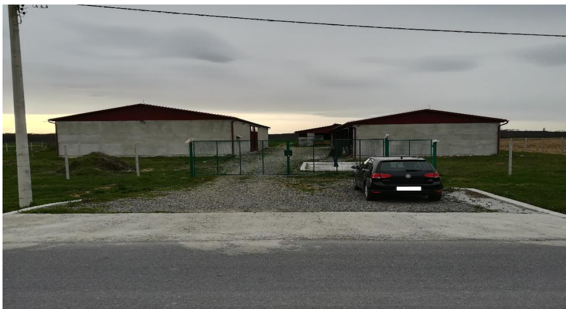
Slika 3. Ulaz u farmu

( https://earth.google.com/web/@45.5839048,18.32502707,88.58426319a,433.51924198d,35y,0h,0t,0r )