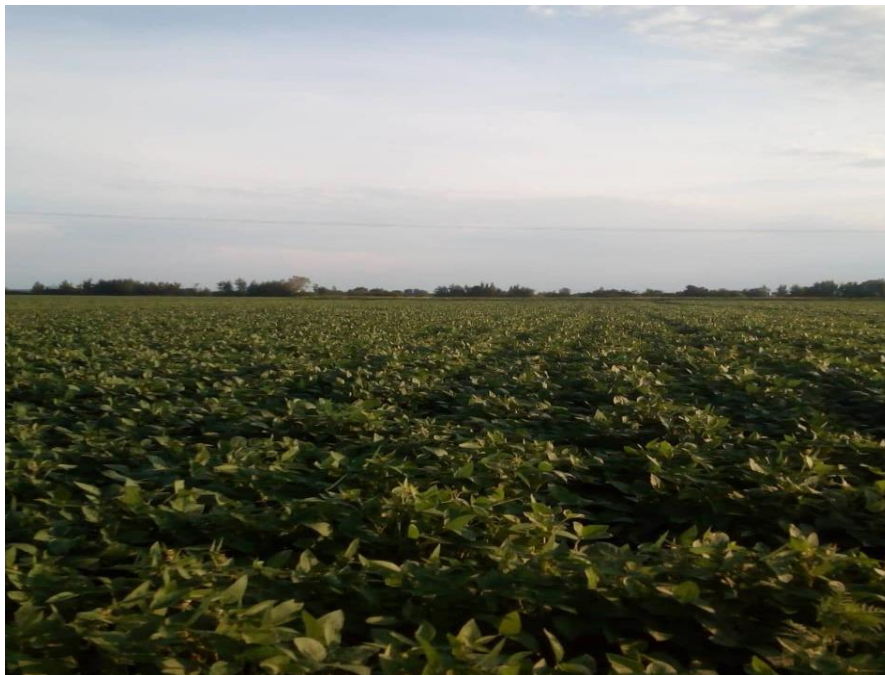
Slika 16. Soja