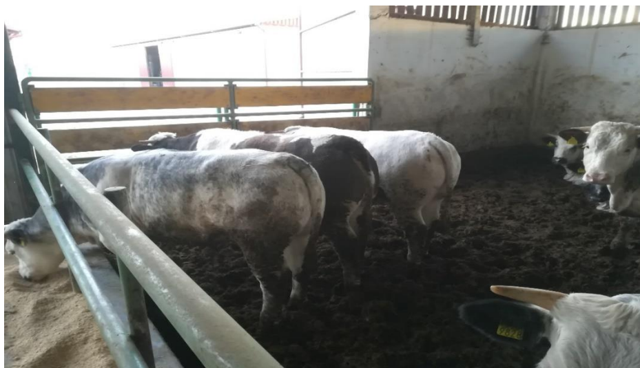
Slika 11. Grla Belgijsko – plave pasmine

Zbog specifičnih problema u reprodukciji i uzgoju ove pasmine, njezina zastupljenost ne zadovoljava potražnju za mesom. Budući da je tijekom tova nakupljanje masnog tkiva u trupu i mesu gotovo zanemarivo, kaže se da je zbog manjeg udjela intramuskularne masti meso „krto“ i slabije aromatičnosti jer većina okusnih spojeva koji mesu daju aromu su u masnom tkivu