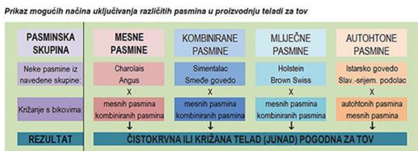
Slika 1. Pasmine goveda

Pasmine pogodne za tov su Belgijsko plavo bijelo govedo , Charolaise , Limousine , Piemontese , Hereford , Aberdeen Angus , Blonde d'aquitaine . Cilj tova je proizvesti što više mesa, kako bi trup goveda bio što veći provodile su se selekcije u tu svrhu što je na kraju rezultiralo nepovoljnim utjecajem na plodnost goveda i prilagodljivost.