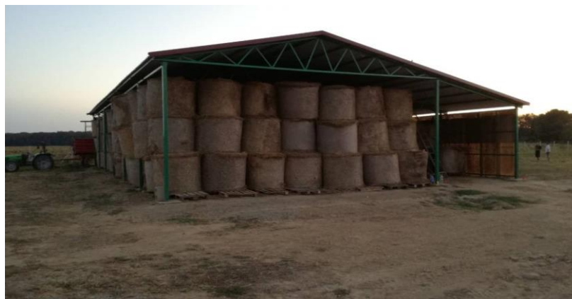
Slika 7. Nadstrešnica za skladištenje sijena