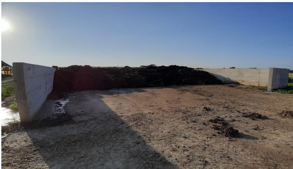
Slika 10. Depo stajskog gnoja

Prema nitratnoj direktivi količina dušika u stajskom gnoju koja se dobije godišnjim uzgojem domaćih životinja preračunata na UG kod goveda iznosi 70, a budući da je po jednom ha dozvoljeno 170 kg dušika (N) proizlazi da je potrebno imati 41 hektar ratarskih površina što i posjedujemo. Depo stajnjaka za šestomjesečno razdoblje na broj UG mora imati površinu od 8m 3 /UG što je na farmi i predviđeno.