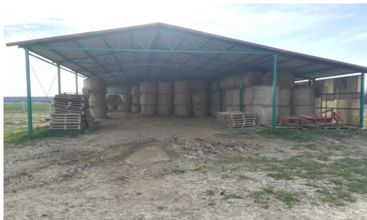
Slika 8. Nadstrešnica za skladištenje slame