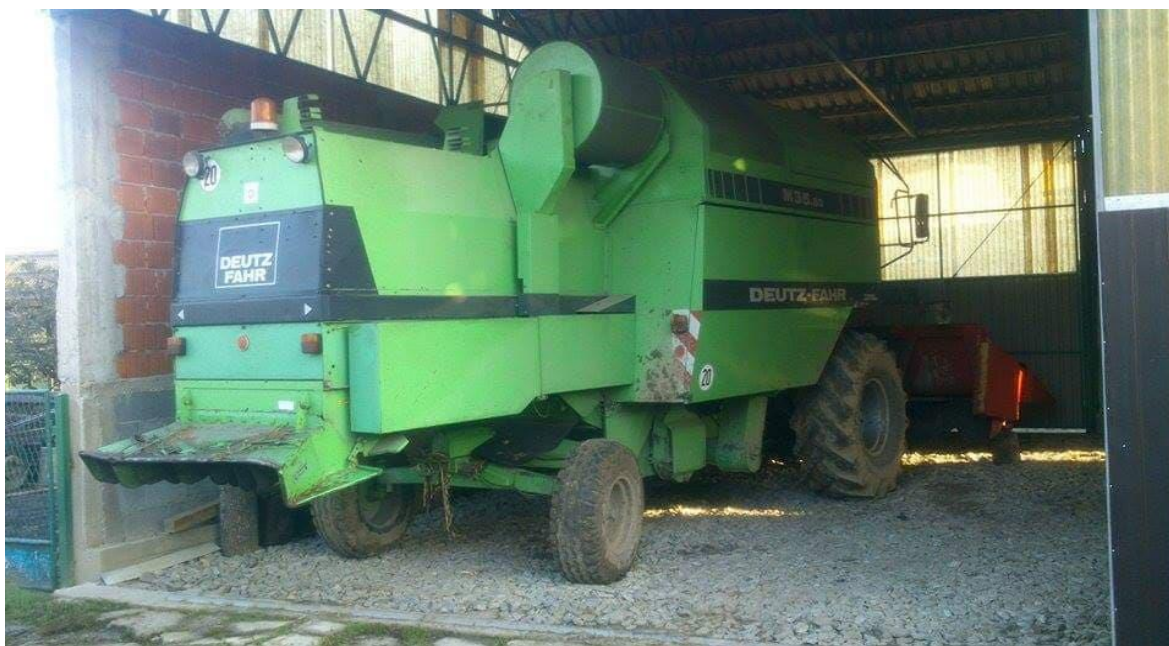
Slika 13. Kombajn Deutz Fahr

Priključne strojeve također imamo za sve poslove, prskanje, bacanje mineralnih gnojiva, razbacivanje stajnjak, priprema tla za sjetvu, sjetva, kultiviranje, preša za slamu, prikolice za transport itd. Posjedujemo žitni kombajna marke Deutz Fahr, pomoću kojeg skidamo usjeve kad za to dođe vrijeme.