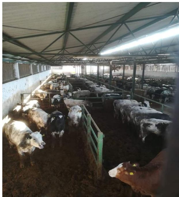
Slika 5. Objekt namijenjen za tov junadi – unutrašnji izgled