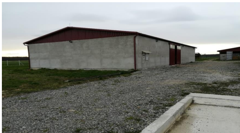
Slika 6. Podno skladište

Sijeno i slamu skladištimo zasebno u poluotvorenim nadstrešnicama od kojih se svaka prostire na 350 m 2 i zaprima cca 550 rolo bala. Pravilnim skladištenjem sijena u nadstrešnicama čuvamo njegove hranidbene sastojke, postizemo bolju kakvoću sijena, poboljšavamo njegov miris i okus.