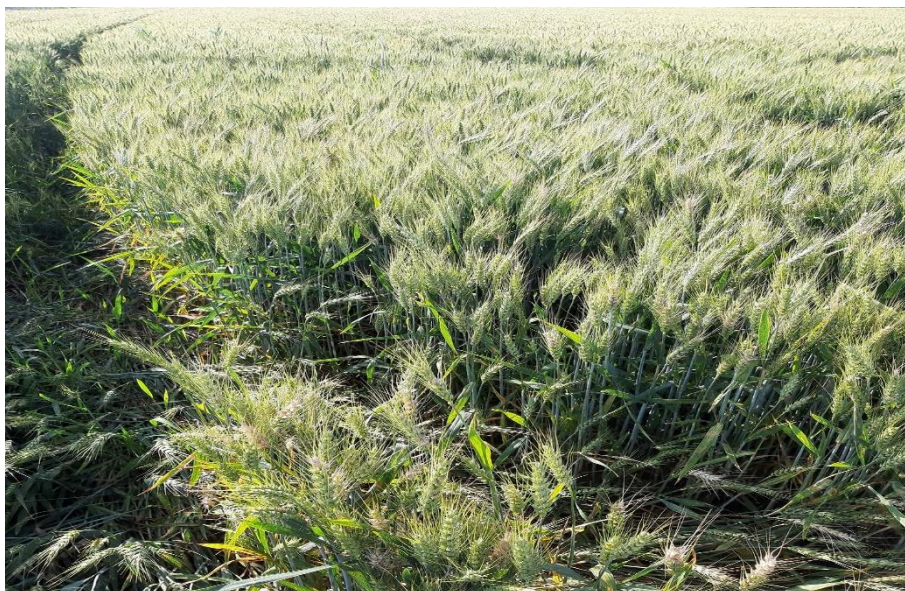
Slika 17. Pšenica