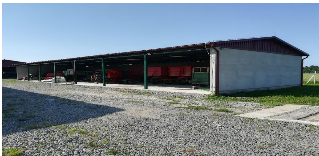
Slika 9. Objekt namijenjeni mehanizaciji i uređajima

Traktori, strojevi za obradu tla i dodatni priključci čuvaju se u jednostavnom objekt, čija je funkcija zaštita poljoprivredne mehanizacije tijekom nepovoljnih vremenskih uvjeta. Skladište se prostire na 350 m 2 .