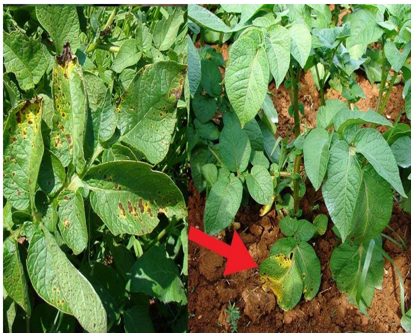
Slika 2. Koncentrična pjegavost na listu krumpira

Izvoz: https://www.syngenta.hr/news/krumpir/koncentricna-pjegavost-lista-krumpira-alternarija , 2019.