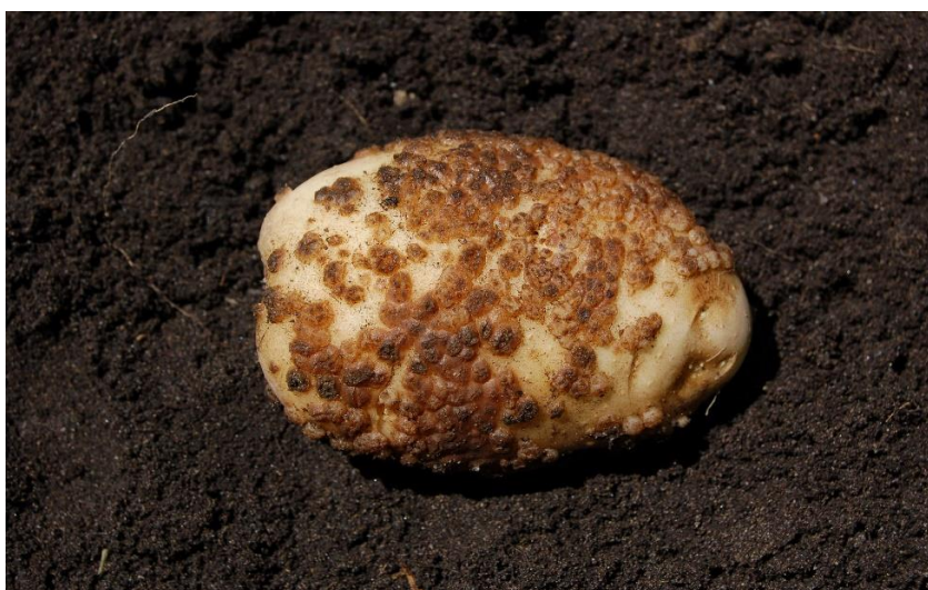
Slika 3. Prašna krastavost na gomolju krumpira