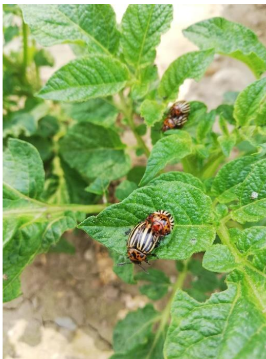
Slika 6. Imago krumpirove zlatice na listu biljke krumpira