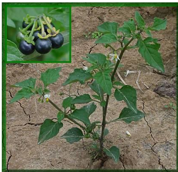
Slika 9. Crna pomoćnica, Solanum nigrum L.