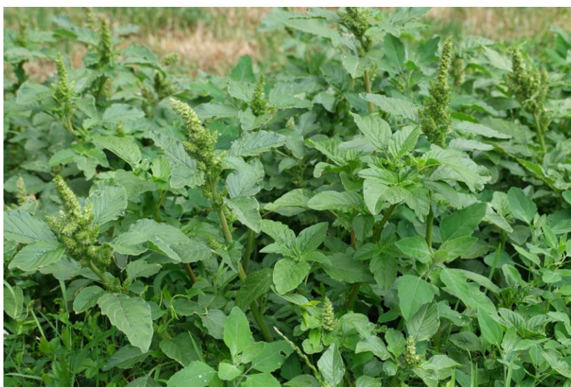
Slika 10. Šćir, Amaranthus retroflexus L.