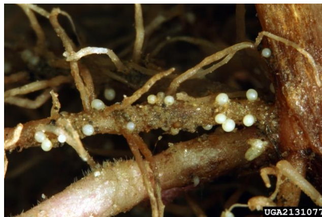
Slika 8. Blijedožuta krumpirova cistolika nematoda Globodera pallida