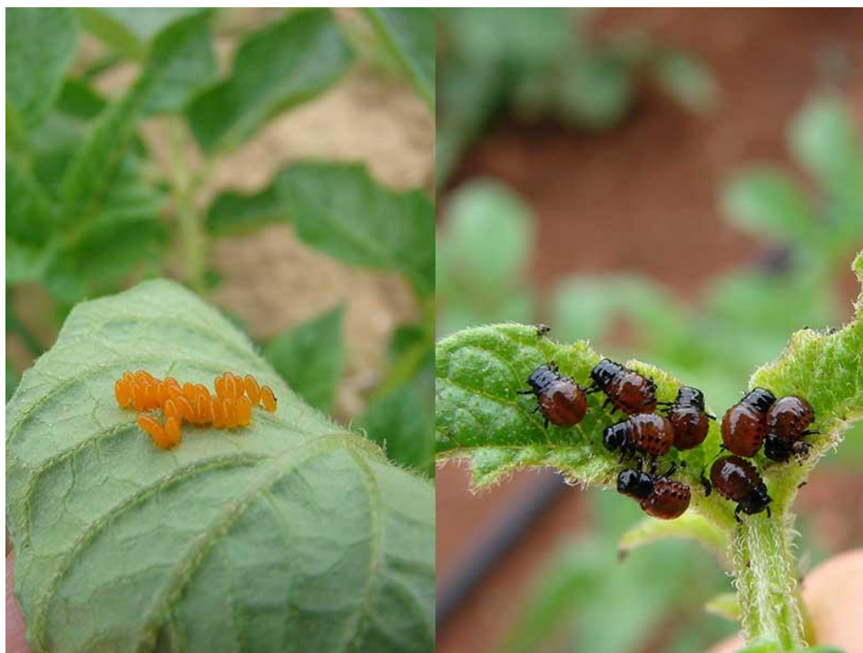
Slika 5. Jajašca i ličinke krumpirove zlatice na listu krumpira