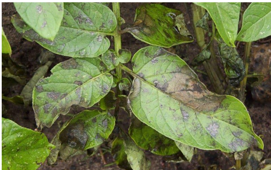
Slika 1. Biljka krumpira pod napadom bolesti krumpirove plamenjače ( Phytophthora infestans )

Volčević (2006.) navodi da se prvo tretiranje fungicidima obavlja pojavom prvih pjega na lišću (početkom cvjetanja krumpira), svako slijedeće tretiranje ovisi o vremenskim uvjetima koje se provodi u razmaku od 10-20 dana.