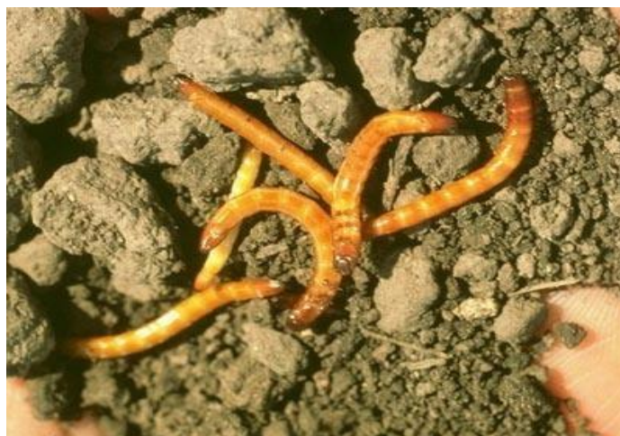
Slika 4. Žičnjaci

Izvor: https://www.gospodarstvo-petricevic.hr/kor/picture.php?/333/category/38 , 2019.