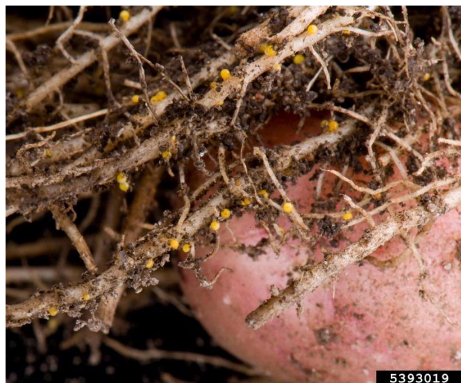
Slika 7. Zlatnožuta krumpirova cistolika nematoda Globodera rostochiensis

Prikupljanjem uzorka tla iz Međimurske i Varaždinske županije u 2002. godini otkrivene su G. pallida s mješovitom populacijom G. rostochiensis . (Grubišić i sur., 2013.) su na temelju molekularnih analiza utvrdili kako na navedenim lokalitetima dominira G. rostochiensis .