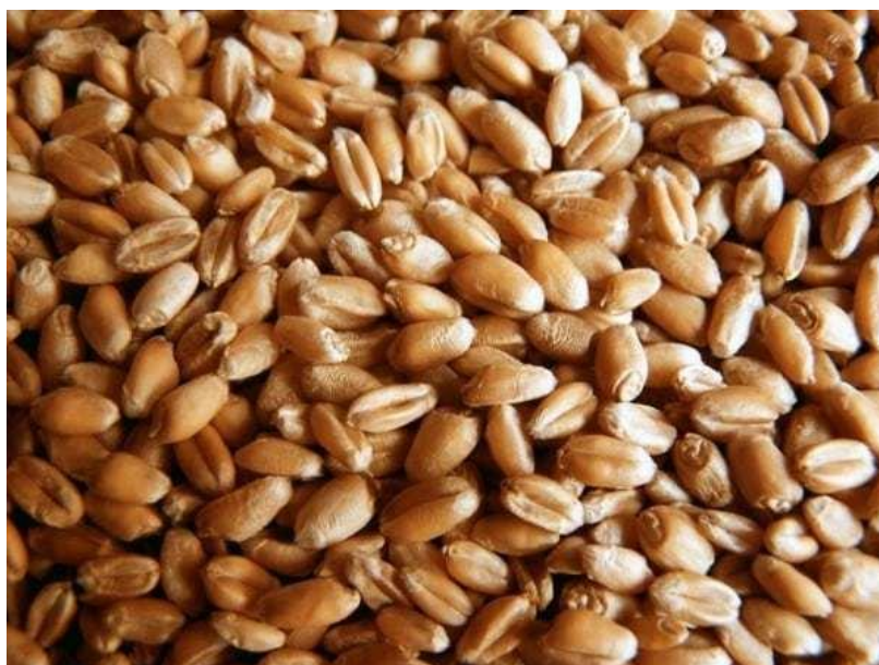
Slika 7. Zrno pšenice