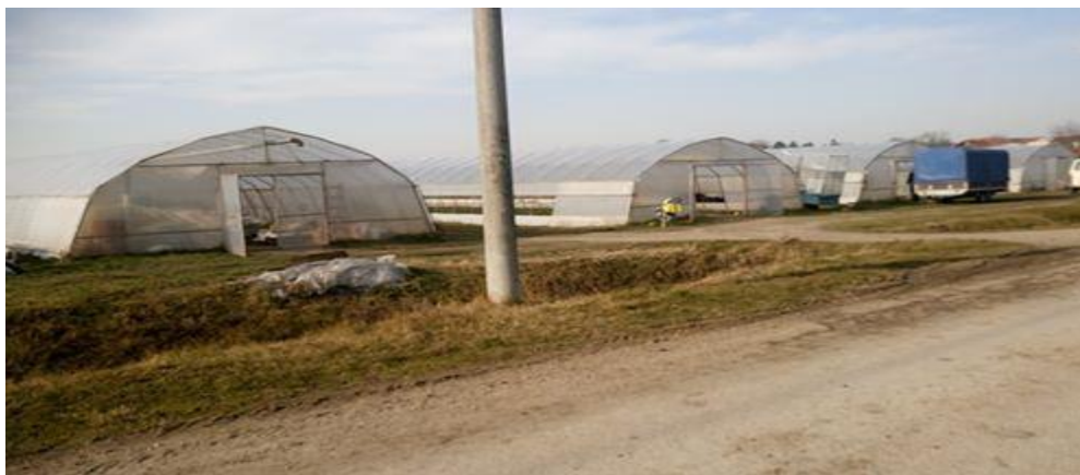
Slika 1. Platenici

Gospodarstvo proizvodi rajčicu u platenicima. Posjeduju vlastitih 10 platenika prikazanih Slikom 1 i 2, a čija je ukupna površina 3600 kvadrata.