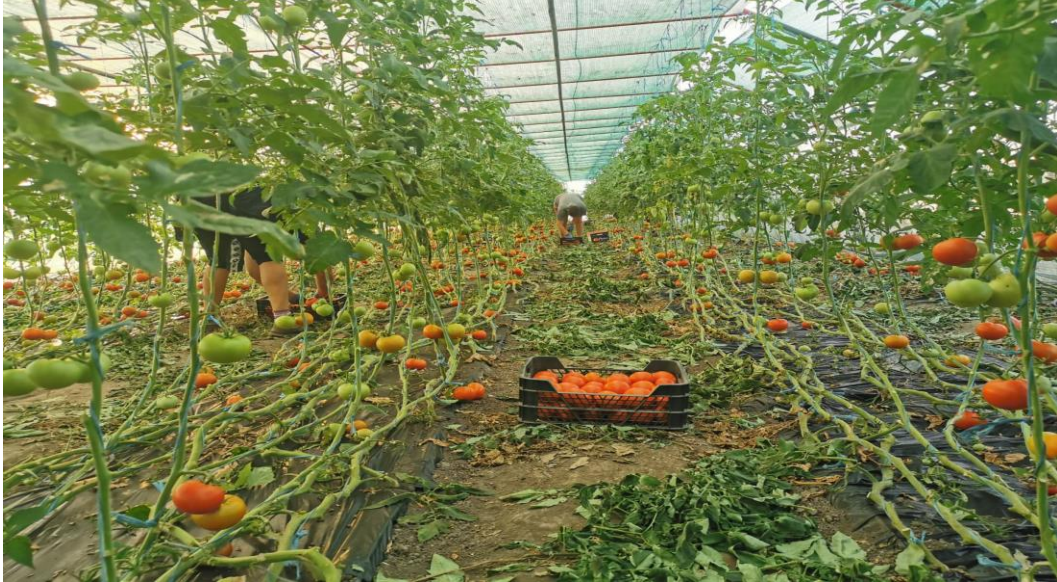
Slika 7. Berba rajčice

oko špage. Kako biljke rastu te grozdovi se penju prema gore, vrši se spuštanje biljaka prema dolje kako je prikazano Slikom 7.