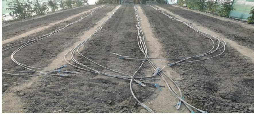
Slika 5. Cijevi za navodnjavanje u plastenicima