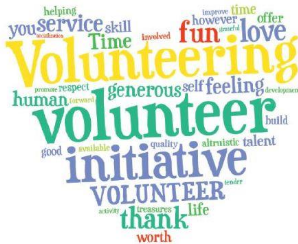
Slika 1: Volonterstvo

organizatora volonterskih aktivnosti i krajnjih korisnika s ciljem osiguravanja adekvatnog društvenog okruženja za razvoj volonterstva i prevenciju zlouporabe volontiranja. Nadalje, uređena su temeljna načela i uvjeti volontiranja, terminologija, te relevantni ugovori, etički kodeks i certifikati. Osim toga, isti zakon predviđa raspoređivanje financijskih sredstava za rad Nacionalnog odbora za volonterstvo te za dodjelu godišnje nacionalne nagrade za volonterstvo.