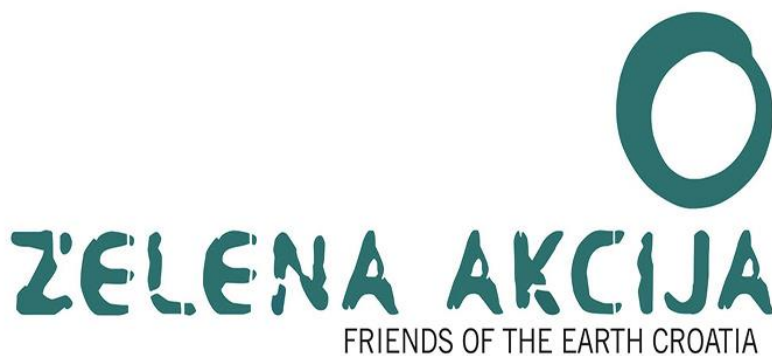
Slika 5: Logo udruge Zelena akcija

Zelena akcija je članica najveće mreže udruga za zaštitu okoliša na svijetu Friends of the Earth .