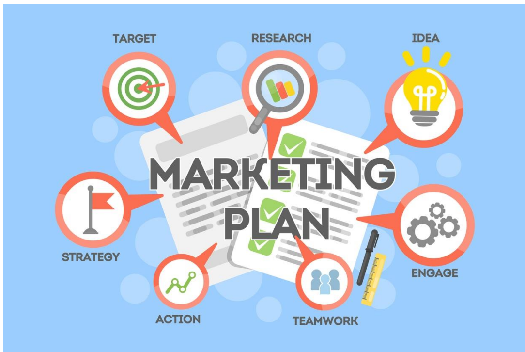
Slika 2: Marketing plan