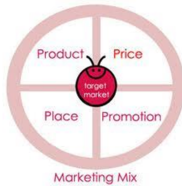
Slika 4: Marketing mix

koji moraju biti u skladu sa porukom kako bi se ona prenijela na razumljiv način i kako bi se ostvarili ciljevi te povratna veza koja je najvažnija stavka cijelog procesa. Temeljni ciljevi koji se sredstvima ili promocijskim miksom žele prenijeti su bitni za cijelu organizaciju. Podsjećanjem, informiranjem i uvjeravanjem te povezivanjem marketinških aktivnosti u zajedničku cjelinu poruka koja se prenosi sadržajno je prihvatljivija u javnosti.