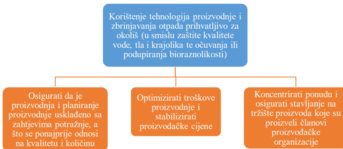
Slika 2. Ciljevi proizvođačkih organizacija

Proizvođačka organizacija se osniva na inicijativu proizvođača te se radi o organizaciji proizvođača jednog ili više proizvoda koji su namijenjeni isključivo preradi čiji su ciljevi prikazani slikom 2.