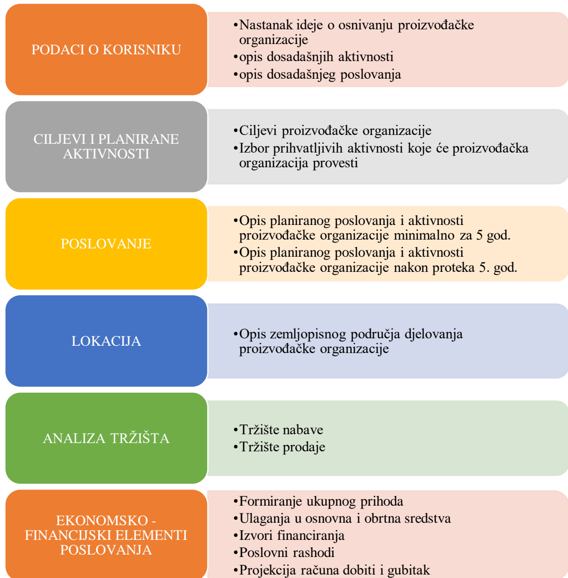
Slika 5. Sadržaj poslovnog plana

Ako se kupi prostor, prihvatljivi troškovi ograničeni su na troškove najma tog prostora po tržišnim cijenama. Prilikom dostavljanja poslovnog plana proizvođačka organizacija treba dostaviti i prikaz troškova za svaku nabavu opreme, plaću, najam i uslugu. Prikaz mora biti u obliku tablice, a iznos troškova mora biti izražen u hrvatskim kunama. (Pravilnik o priznavanju i potporama za početak rada proizvođačkih organizacija, 81/15)