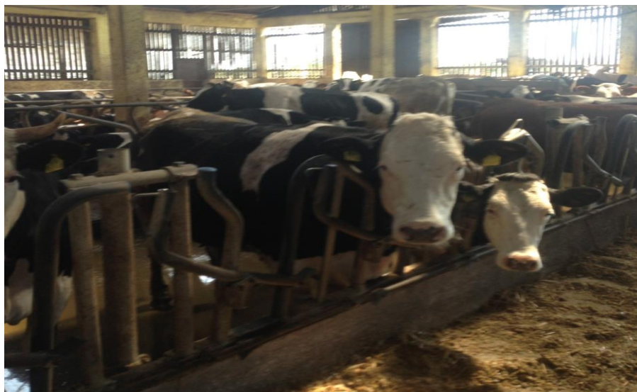
Slika 4. Tovna junad na PG-u Rastina (holstein-friesian, simentalac, limousin, charolais)