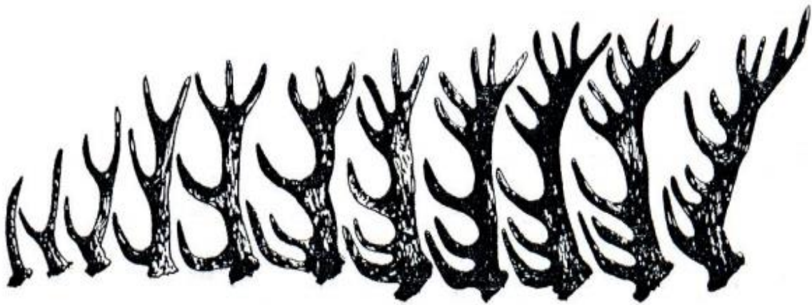
Razvojni oblici rogovlja jelena običnog prema Dragišić P.: 1. šiljkan; 2. rašljan; 3. šesterac; 4. osmerac; 5. deseterac krunaš; 6. dvanaesterac krunaš s paroškom ledenjakom; 7. četrnaesterac krunaš s paroškom ledenjakom; 8. šesnaesterac krunaš s paroškom ledenjakom; 9. osamnaesterac krunaš s parošcima ledenjakom i vučja- kom; 10. dvadeseterac krunaš sa sedam parožaka u kruni; 11. osamnaesterac krunaš s vučjakom i dva ledenjaka