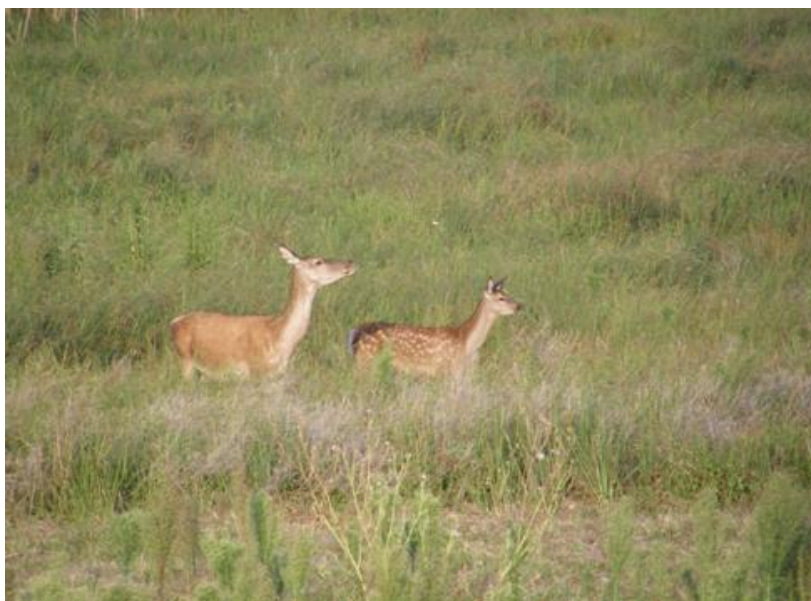
Slika 4. Košuta i tele jelena običnog