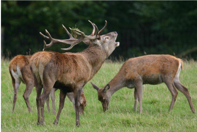
Slika1. Jelen u rici