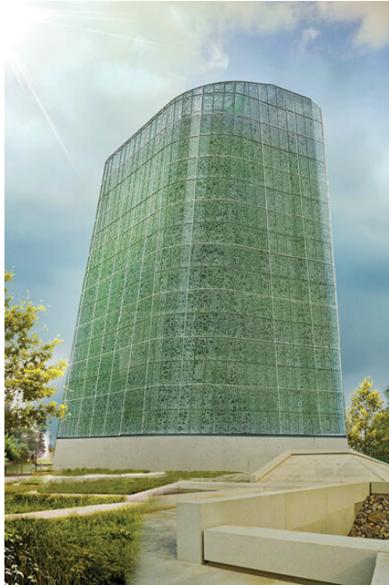
Slika 9. „World Food Building“ u Linköpingu, Švedska

U državi Singapur, u vertikalnoj farmi „Sky Greens“ (slika 10.) zasijano je prvo sjeme 2012. godine i danas proizvode do 10 tona lisnatog povrća svaki dan što je spas za otok kojem nedostaje zelene površine.