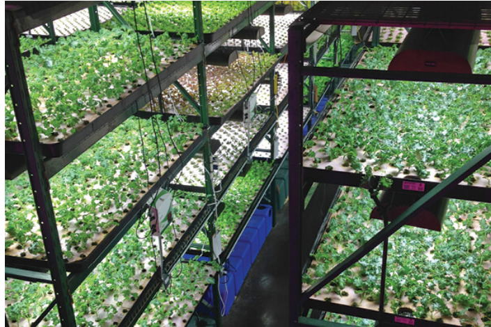
Slika 11. „Green Spirit Farms“, u Michiganu, SAD

svakodnevna preokupacija na farmi, a poljoprivredno gospodarstvo od osam hektara sada proizvodi hranu koristeći 98 % manje vode u odnosu na konvencionalni uzgoj (greenspiritfarms.com).