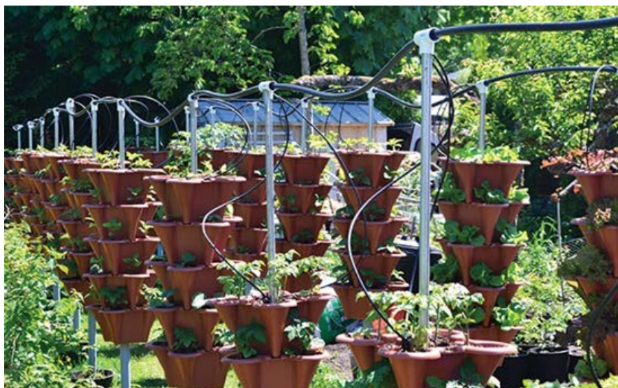
Slika 17. „Squamish“ sustav navodnjavanja