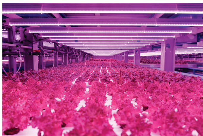
Slika 12. „Badia Farms“, u Dubaiju, UAE

Sigurnost hrane sve je veći problem na Bliskom istoku. Opskrba vodom i plodnom zemljom u tim sušnim, pustinjskim zemljama ograničena je, a te zemlje oslanjaju se na uvoz od 80 % hrane koju konzumiraju. Prva komercijalna vertikalna farma na Bliskom Istoku, „Badia Farms“, u Dubaiu, UAE (slika 12.), otvorena je početkom 2018. godine. Nudi održivo rješenje za uzgoj u pustinji, biljke su uzgajane pod LED svjetlima, a koriste 90 posto manje nego u konvencionalnoj proizvodnji (badiafarms.com).