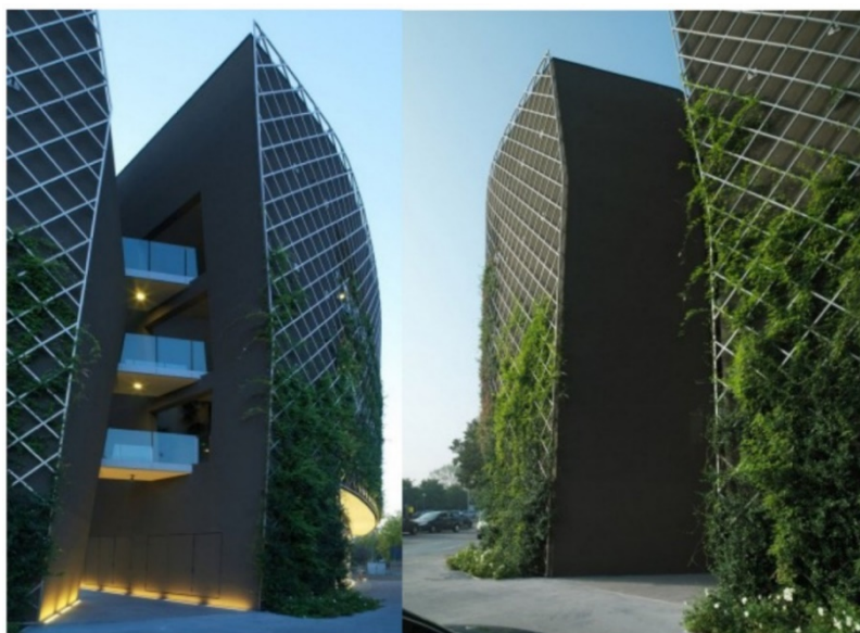
Slika 5. Mrežni i žičani sustav, „Ex Ducati“ u Italiji