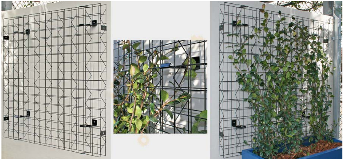
Slika 3. Modularni sustav panela

Prednosti ovog sustava su mogućnost mijenjanja veličine mreže, modularna konstrukcija, jednostavna instalacija te izdržljivost panela.