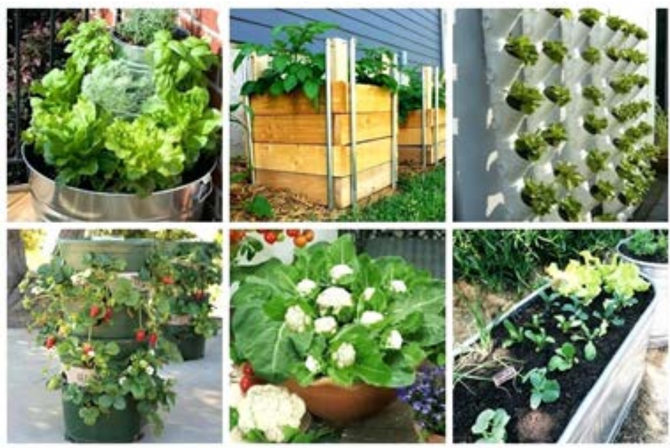
Slika 15. Posude sa povrćem u vertikalnom vrtu

prostoru može se uzgajati veliki broj biljaka, ukrasnih i jestivih. Sljedeća prednost je nepostojanje korova jer je tlo u posudama sterilno i nema sjemenki korova koje bi proklijale. Zalijevanje posuda je jednostavno, ali tlo u posudama ima tendenciju brzog isušivanja. Prilikom odabira veličine posude, treba imati na umu veličinu korijenovog sustava biljke koja se uzgaja, te što je posuda veća to će uzgoj biti uspješniji. Posude (slika 15.) možemo osigurati tako da djelomično zakopamo posudu u tlo ili stabiliziramo stranice ciglama (McLaughlin, 2012.).