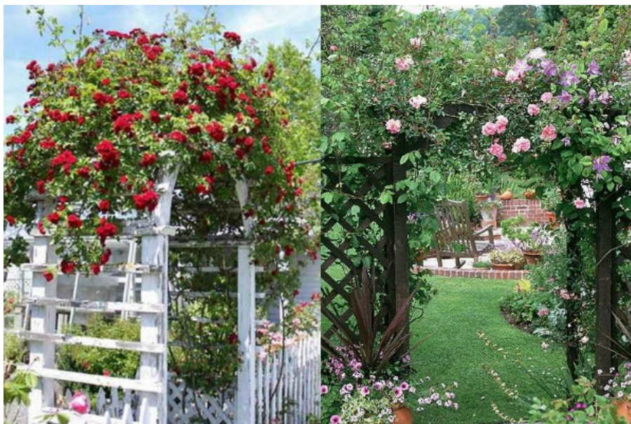
Slika 14. Primjeri vrtnih lukova

Vrtni lukovi pružaju sjenu za klupu, ležaljku ili ljuljačku. Lukovi su jednostavni, definiraju ulaz u vrt ili označavaju prijelaz između različitih vrtних prostora i uključuju rešetke. Vrh luka nije uvijek zakrivljen, može se izrađivati od ravnih vodoravnih ili šiljastih prečki. Neki vrtni lukovi su prilično lagani i jeftini, obično napravljeni od drvenih letvica ili žice. Ovi jednostavni lukovi idealni su za potporu brzorastućim biljkama poput ukrasnog cvijeća (Slika 14.).