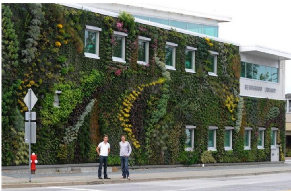
Slika 6. Živi zid, „Semiahmoo Library“ u Kanadi

Živi zidovi (slika 6.) su potpuno suvremeni izum i sastoje se od konstrukcije koja je spojena na zid i koja sadrži hranjivi supstrat, biljku i sustav za navodnjavanje i ishranu biljaka. Cijela površina podijeljena je na puno manjih dijelova koji se mogu montirati kad su sadnice u već izrasloj fazi. Vrijeme potrebno da cijeli zid poprimi konačan izgled je puno kraće, a ponekad i trenutno ako su segmenti prethodno uzgojeni i tako gotovi montirani. Ovi paneli mogu biti izrađeni od plastike, ekspaniranog polistirena, sintetičkih tkanina, gline, metala i betona te podržavaju veliku raznolikost i gustoću biljnih vrsta. Zbog svoje raznolikosti i gustoće vegetacije, živim zidovima potrebna je veća zaštita od zelenih fasada. Ovaj sustav podržava razne biljne vrste, kao što je mješavina vegetacije višegodišnjih cvjetova, niskog grmlja, paprati itd. (Massingham, 2011.).