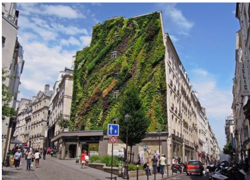
Slika 7. „Oaza Aboukir“ u Parizu (Izvor: https://www.pinterest.com )

„Mur végétal“ je jedinstveni oblik zelenog zida koji je uveo Patrick Blanc, čime je omogućio stvaranje živahih i složenih instalacija u gotovo svakom većem gradu u cijelom svijetu. Na nosivom zidu ili konstrukciji postavljen je metalni okvir koji podupire PVC ploču debljine 10 milimetara, na kojoj su spojena dva sloja poliamidnog filca debljine 3 milimetra. Ovi slojevi oponašaju mahovinu koja raste na liticama i podupire korijenje mnogih biljaka. Mreža cijevi kontroliranih ventilima osigurava hranjivu otopinu koja sadrži otopljene minerale potrebne za rast biljaka. Korijeni biljaka uzimaju hranjive tvari koje su im potrebne, a višak vode skuplja se na dnu zida žlijebom prije nego što se ponovno uvede u mrežu cijevi jer sustav radi kao zatvoreni krug. Njegovo djelo u kojem se nalazi 237 različitih biljnih vrsta, 'Oaza Aboukir' u Parizu (slika 7.), privukla je najveću pažnju. (agritech.tnau.ac.in.) To je zeleni zid visine 25 metara koji se prostire na 5 katova i nudi organsku alternativu za prethodno praznu betonsku fasadu (Massingham, 2011.).