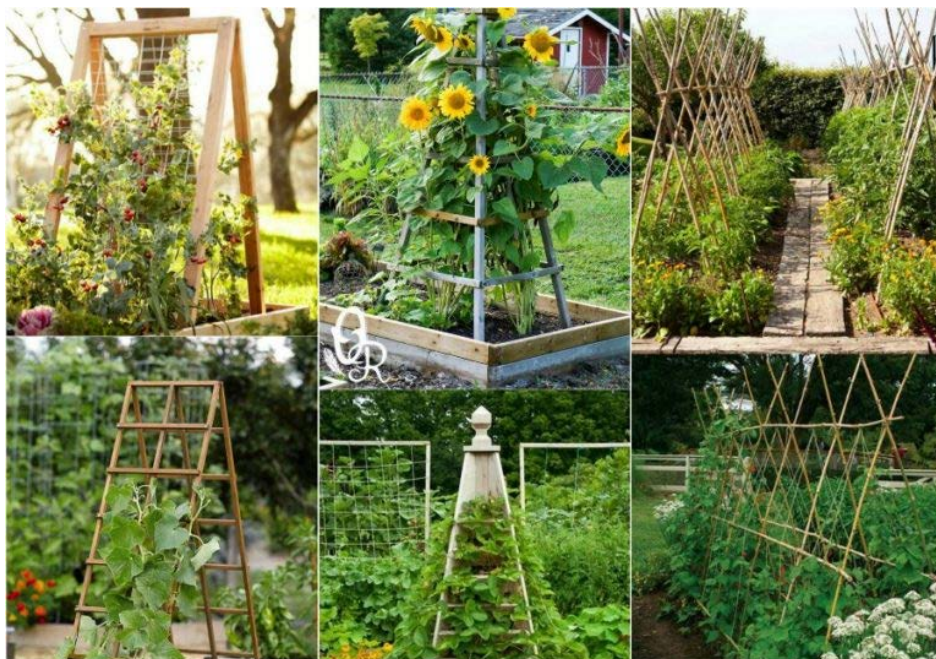
Slika 13. Primjeri uzgoja povrća kao vertikalni vrtovi u obliku rešetki

Pojam rešetka dolazi od francuske riječi „treillage“ što znači potpora od isprepletenih žica unutar čvrstog okvira za uzgoj biljaka. Biljke penjačice mogu proizvesti okomitu „zavjesu“ od lišća, cvijeća, pa čak i plodova na širokom rasponu prekrasnih i praktičnih vrtnih rešetki (slika 13.). Izvorno, rešetke su bile izrađene od drveta, ali danas se mogu izraditi od trajnijih metala ili plastike. Rešetka može biti samostojeća ili položena na zid. Rešetke su vrlo jednostavno dizajnirane, obično u obliku dijamanta, kvadrata ili kruga. Drvena rešetka može biti izrađena od ravnih drvenih letvica kako bi se stvorio simetrični dizajn, ili se može učiniti rustikalnom korištenjem bambusovih štapova, vrbinih grana ili čak iskrivljenih dijelova grančica drveća. Jeftini gotovi dijelovi rešetki mogu se kupiti u vrtnim centrima. Prilikom ugradnje rešetke kupljene u vrtnim centrima, najbolje je držati dno iznad razine tla, jer letvice mogu lako trunuti ako dođu u dodir s tлом. Rešetke mogu biti domaće izrade uglavnom izrađene od izdržljivih bambusovih štapova (McLaughlin, C., 2012.).