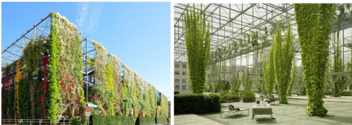
Slika 4. Mrežni i žičani sustav, „MFO park“ u Švicarskoj

Mrežni i žičani sustavi se izrađuju pomoću mreža i žica. Mreže se koriste na zelenim fasadama koje su dizajnirane kako bi podržale brzo rastuće penjačice s gustim lišćem. Žičane mreže često se koriste kako bi podržale sporije rastuće biljke kojima je potrebna dodatna podrška koju ti sustavi pružaju. Oba sustava koriste čelične kabele visoke čvrstoće s dodatnom opremom. Različite veličine i uzorci mogu se primijeniti jer su fleksibilne vertikalne i horizontalne žičane užadi povezane križnim stezaljkama (slika 4. i 5.) (Massingham, 2011.)