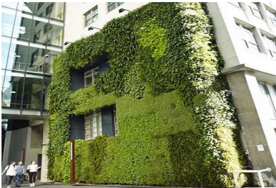
Slika 2. Zelena fasada

Zelene fasade sastoje se od biljaka penjačica koje imaju korijenje u posudama na zidu specijalno napravljenim za njih, ili jednostavno rastu iz tla. Puzajuće su ili se penju po specijalnoj konstrukciji koja je sastavljena na zidu (najčešće mreža od inox užadi i nosača), a koja točno odgovara odabranoj biljnoj vrsti. S obzirom na izabrane biljke i klimatske uvjete potrebno je nekoliko sezona da fasada dobije konačni oblik, ali promjenjivost pridaje kvaliteti ovih fasada jer one stalno izgledaju drugačije (slika 2.).