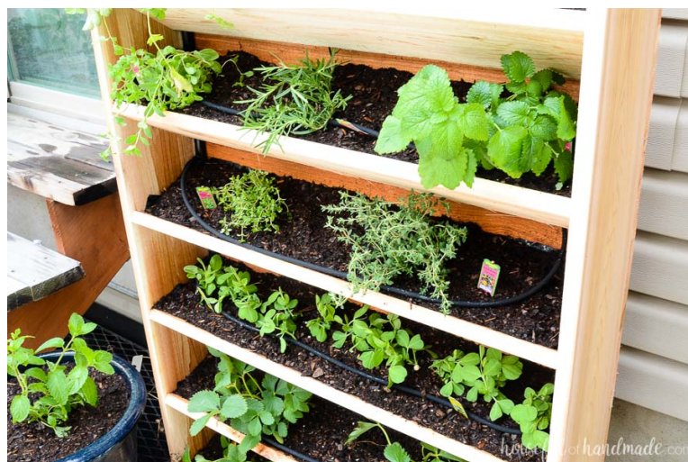
Slika 16. Sustav navodnjavanja „kap po kap“