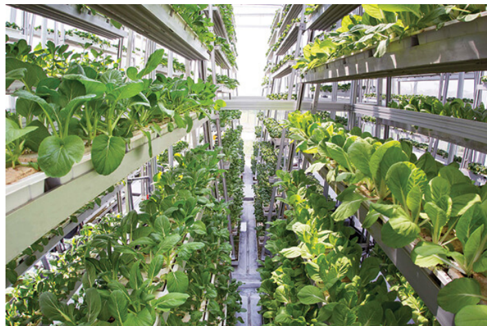
Slika 10. Vertikalna farma „Sky Greens“, Singapur

U državi Singapur, u vertikalnoj farmi „Sky Greens“ (slika 10.) zasijano je prvo sjeme 2012. godine i danas proizvode do 10 tona lisnatog povrća svaki dan što je spas za otok kojem nedostaje zelene površine.