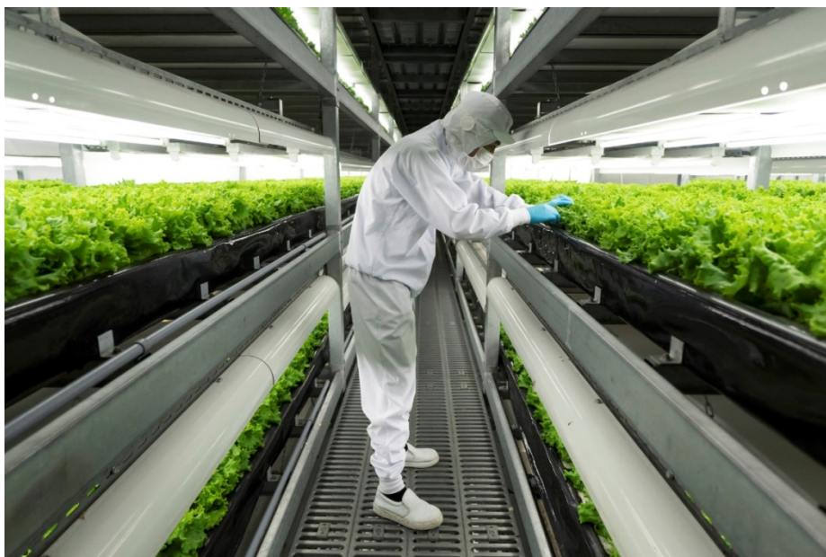
Slika 8. Unutar vertikalne farme u Kameoki, Japan

Tvrtka „Spread“ je izgradila najveću svjetsku tvornicu povrća na svijetu (slika 8.) s ciljem postizanja tehnološki jeftine poljoprivrede. Uzgajaju više od 30 000 biljaka salate dnevno na stalcima pod prilagođenim LED svjetlima. Zatvorena prostorija štiti povrće od štetočina, bolesti i prljavštine. Temperatura i vlaga su optimizirani za brzi rast biljaka koje roboti prihranjuju, njeguju i beru. Cilj im je bez izlaganja biljaka vremenskim uvjetima proizvesti jeftino organsko povrće, ublažiti utjecaj klimatskih promjena te proizvesti veliku količinu povrća dobre kvalitete za prodaju po fiksnoj cijeni tijekom cijele godine, bez upotrebe pesticida. Tvrtka je 2016. osvojila nagradu „Edison“ za svoj sustav vertikalnog uzgoja ( https://www.bloomberg.com/ ).