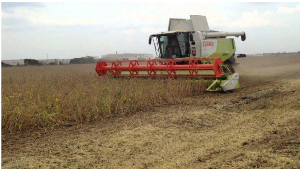
Slika 6. Žetva soje