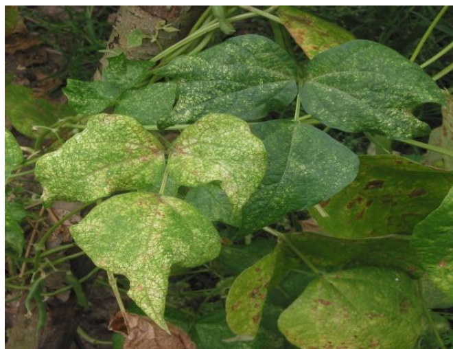
Slika 10. Štete na soji od crvenog pauka

Grinje napadaju soju od pojave prvih listova pa do kasne jeseni, ali najveći napad obično slijedi tijekom mjeseca srpnja kada su najviše prosječne temperature zraka. To je normalno jer brzina razvoja grinja ovisi o temperaturi zraka. Kod temperature od 10°C razvoj traje 33 dana, na temperaturi od 17°C do 22°C, uz relativnu vlagu od 70% razvoj traje 6-8 dana, a kod temperature od 33°C i više, razvoj traje samo 3 dana (Ivezić, 2009.). Tijekom vegetacije soje u jednoj godini u našim uvjetima, posebno u toplijim područjima uzgoja, grinje ( Tetranychus spp.) mogu imati deset i više generacija. Za suzbijanje štetnika koristimo insekticide na bazi Abamektina u dozi 1.5 l/ha najviše 2 puta u sezoni. Karenca je osigurana vremenom primjene.