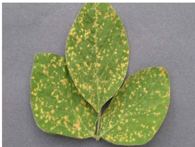
Slika 7. Plamenjača soje (Izvori: http://pinova.hr )

Plamenjača ili peronospora (slika 7.) ubraja se među najraširenije gljivične bolesti u svim područjima svijeta gdje se uzgaja soja. Bolest je lista, mahuna i sjemena. Redovito se javlja tijekom vegetacije soje, s jačim intenzitetom u hladnim i vlažnim godinama. Posebno je jak intenzitet zaraze u prvoj polovici vegetacije soje, odnosno tijekom svibnja i lipnja, ako ima dovoljno vlage. Ukoliko i dalje tijekom vegetacije traju povoljni uvjeti za razvoj bolesti, ona se razvija i na sjemenu i značajno smanjuje njegovu kvalitetu (Vratarić, 2008.).