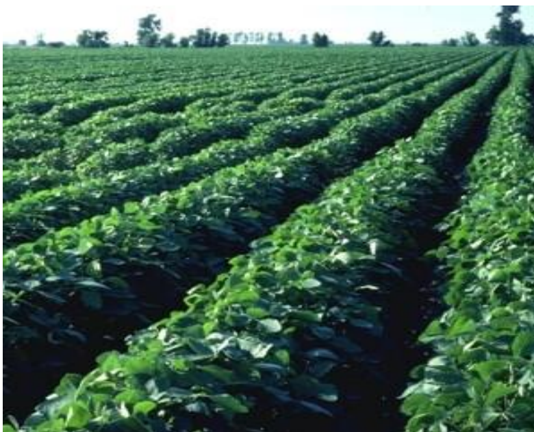
Slika 1. Soja

Soja ( Glycine max (L.) Merr.) (slika 1.) jedna je od najznačajnijih uljanih i bjelančevinastih kultura na svijetu, jer može proizvesti više jestivih bjelančevina od bilo koje druge jednogodišnje kulture. Po aminokiselinskom sastavu soja ( Glycine max (L.) Merr.) je vrlo dobra za ishranu domaćih životinja i ljudi. Sjeme soje prije upotrebe potrebno je termički obraditi kako bi se uništili štetni inhibitori u bjelančevinama sjemena soje. Razni prehrambeni sojini proizvodi imaju tradiciju u prehrani ljudi diljem svijeta. Postoji dva načina kako bi dobili ulje iz sojinog sjemena i to da sjeme prolazi kroz proces prešanja ili proces ekstrakcije. Kod prešanja pored ulja se dobiju pogače, a kod ekstrakcije se dobije sirovo ulje i sačma. Iz sojinog ulja se izdvaja lecitin koji se koristi kao emulgator i antioksidans, a sojino ulje ima široku primjenu u prehrambenoj industriji. Soja, osim što je poželjna u prehrambenoj industriji, vrlo je poželjna i u plodoredu, zbog izuzetne sposobnosti simbioze korijena soje s kvržičnim bakterijama Bradyrhizobium japonicum te tako obogaćuje tlo dušikom 40 do 60 kg/ha (Vratarić i Sudarić, 2008.).