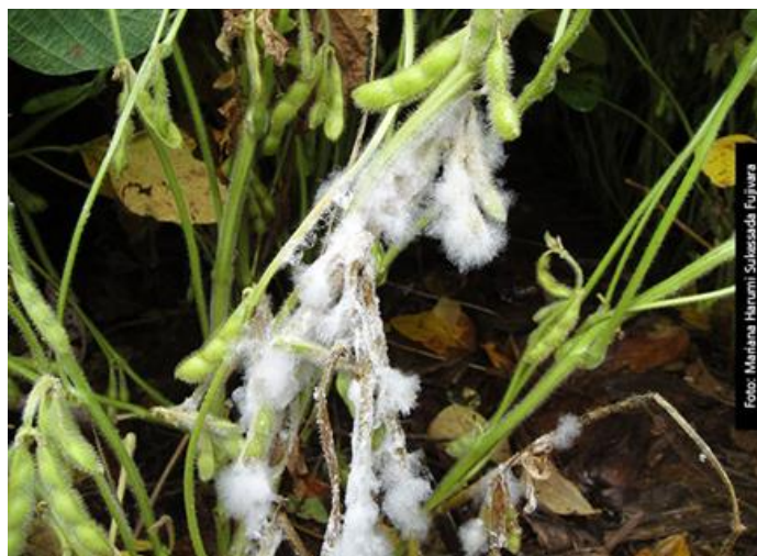
Slika 8. Bijela trulež korijena i stabljike na soji