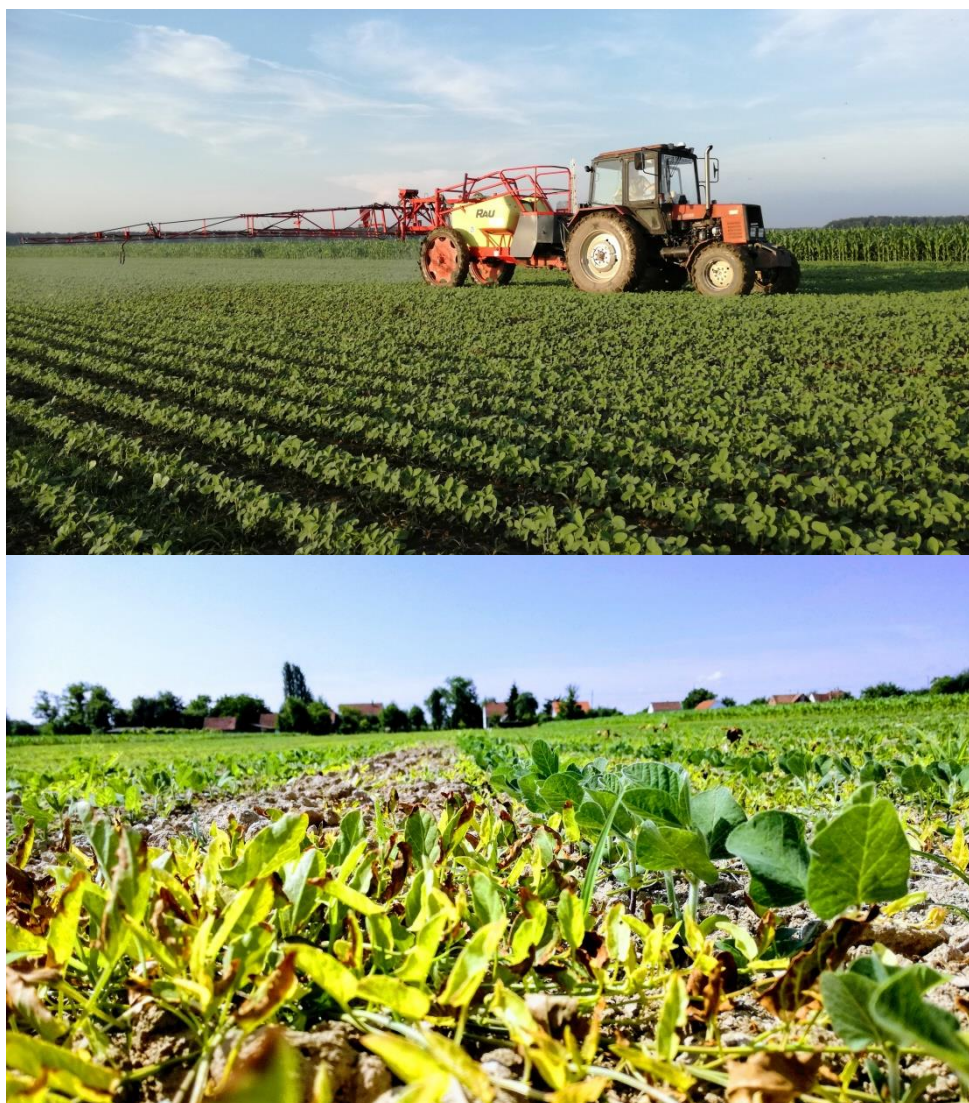
Slika 12. Primjena zaštitnih sredstava na OPG-u