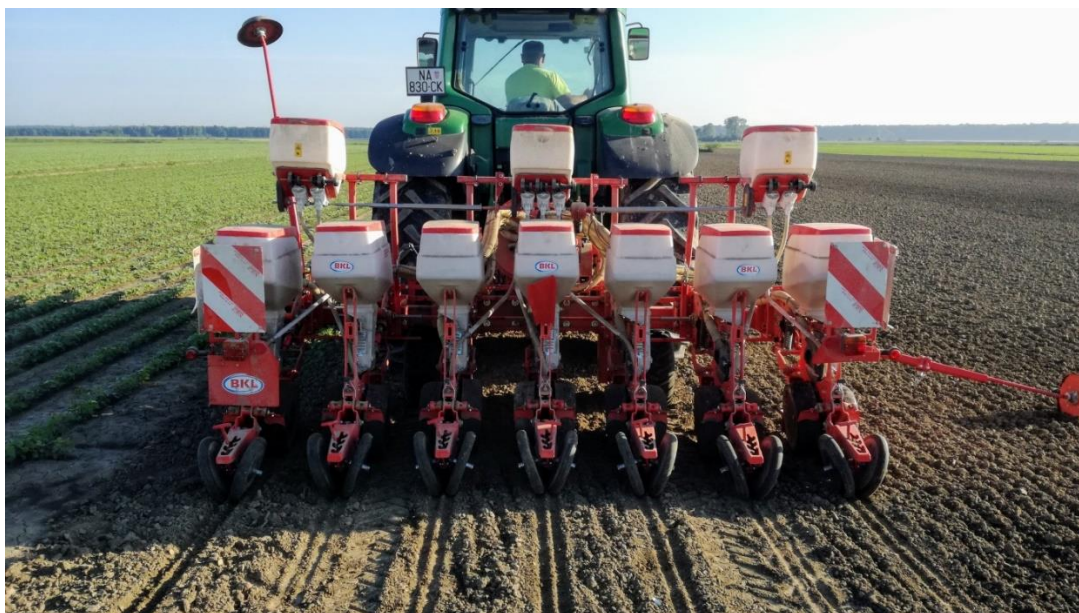
Slika 4. Sjetva soje

Soja se može sijati na uske i široke redove, u trake, kućice, te širom kao postrni usjev. Sjetvu treba obaviti na 50 cm međurednog razmaka, na 70 cm prepolavljanjem prohoda kojim se postiže međuredni razmak od 35 cm ili sjetvom žitnim sijačicama sa ili bez zatvaranja svakog drugog reda u sijačici. U ovom području prevladava sjetva (slika 4.) u redove na razmak od 45 ili 50 cm, a izvodi se pneumatskim sijačicama.