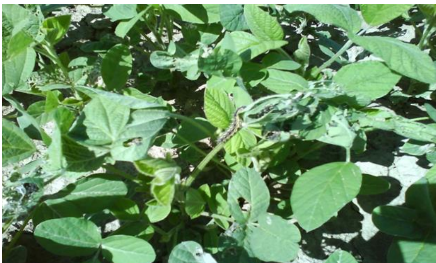
Slika 9. Gusjenica stričkovog šarenjaka ( Vanessa cardui L.)

Šareni leptir koji ima 2-3 generacije godišnje, polifagna je i migratorna vrsta. Leptir na lišću polaže sitna, spljoštena, svijetlozelena jaja, a njegove gusjenice mogu narasti do 4 cm, dlakave su, crne s dvije žute lateralne linije. Napadnuto lišće gusjenice povezuju nitima praveći karakteristična gnijezda. Gusjenice se prvo hrane na korovima (stričak, čičak i dr.), a kasnije prelaze na soju (Raspudić i sur., 2007.). Za suzbijanje štetnika ( Vanessa cardui L.) koristimo insekticide na bazi Cipermetrina u dozi 1.2 l/ha. Karenca je osigurana vremenom primjene i iznosi 42 dana.