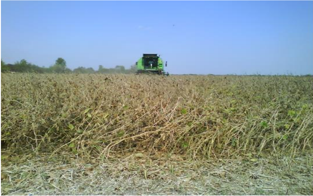
Slika 5. Žetva soje na OPG Teskera 2018. godine