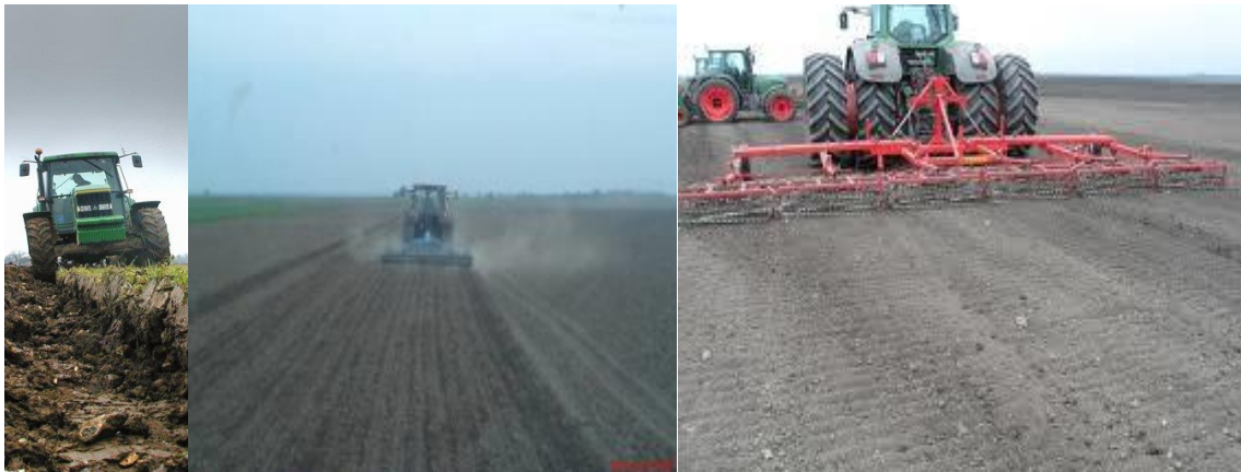
Slika 3. Obrada tla

Pravilna obrada tla (slika 3.) važna je za uspjeh proizvodnje i treba joj posvetiti dužnu pažnju. Pravilnom osnovnom obradom stvara se povoljna struktura tla, potiče se biološka aktivnost u tlu, a biljna hranjiva postaju pristupačna. Obradom tla popravljaju se fizička, kemijska i biološka svojstva tla.