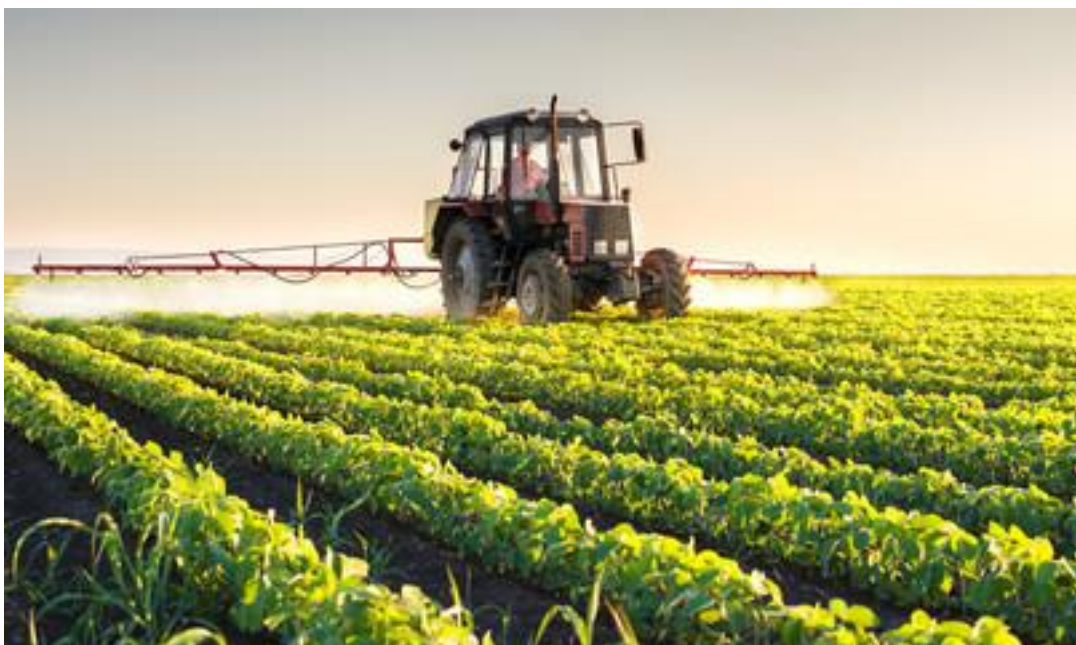
Slika 4. Folijarna gnojidba

Folijarna gnojidba (slika 4.) je tehnika gnojidbe usjeva putem lista ili drugih nadzemnih dijelova biljke. Biljke su sposobne apsorbirati esencijalne elemente biljne ishrane kroz puči i epidermu lista. Folijarna gnojidba je prikladna za primjenu manjih količina gnojiva, osobito mikroelemenata. Folijarna gnojidba zapravo je dodatna gnojidba (prihrana) te ne predstavlja zamjenu za gnojidbu usjeva putem tla, dakle preko korijena, jer su potrebe biljaka za hranivima (tu se prvenstveno misli na makroelemente dušik, fosfor i kalij) najčešće veće od koncentracija koje podnosi lišće, pa bi trebalo vrlo često primjenjivati folijski sprej što nije niti praktično, a niti financijski isplativo.