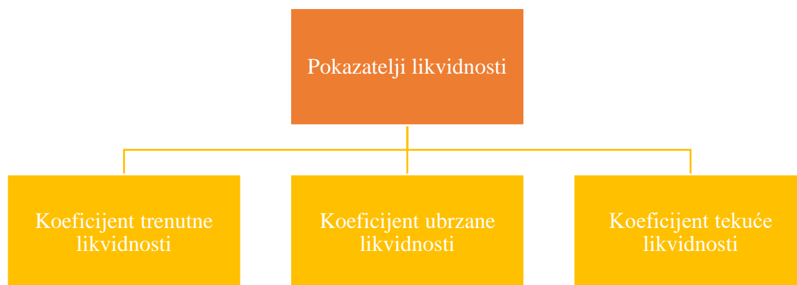
Slika 4. Pokazatelji likvidnosti

preuzetih obveza. Pokazatelji likvidnosti prikazani Slikom 4 uspoređuju kratkoročne obveze s kratkoročnim izvorima dostupnim za podmirivanje obveza.