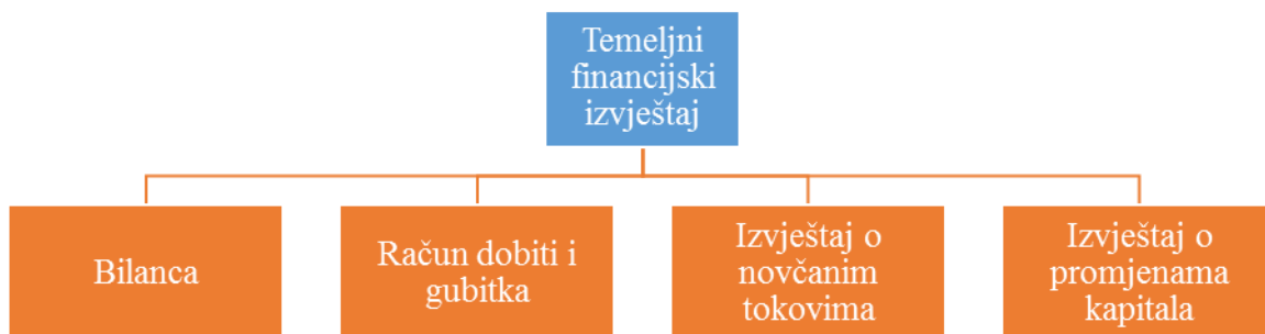
Slika 1. Temeljni financijski izvještaji

Financijsko izvješćivanje ima dvije osnovne svrhe. Struktura financijskih izvještaja prikazana je Slikom 1. Prva svrha je pomoć menadžmentu da se uključi u učinkovito donošenje odluka o ciljevima i ukupnim strategijama poduzeća.