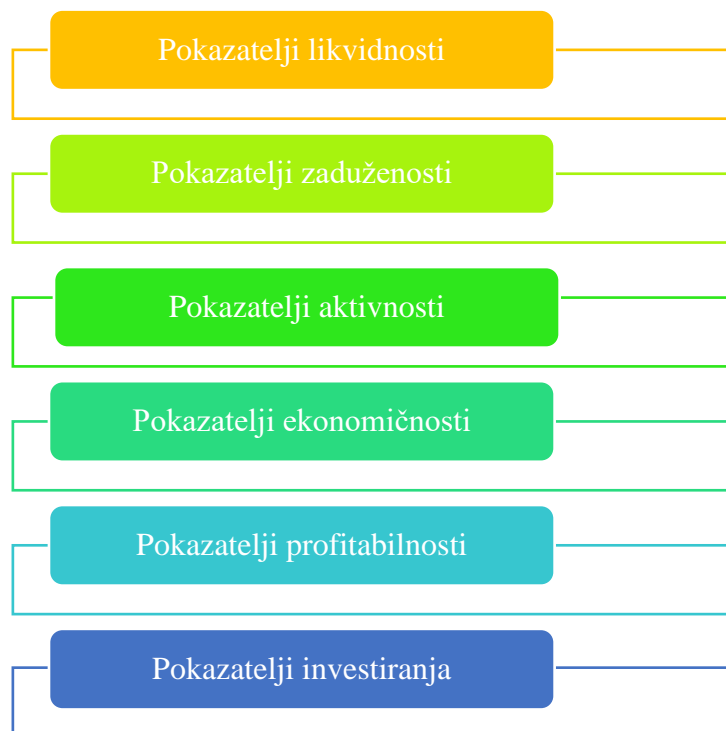
Slika 3. Kategorije ili skupine financijskih pokazatelja