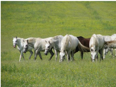
Slika 9. Lipicanci Autor: S. Butković

Lipicanski konji poznati su po plemenitoj i čvrstoj tjelesnoj građi, otpornosti, skromnosti u smještaju i hranidbi, sposobnosti učenja i volji za radom. Glava im je srednje duga, umjerene veličine, a oči su im bistre i radoznale. U nosnom dijelu glave može se javiti umjerena konveksnost. Vrat se ističe lijepom povijenošću, mišićjem i visokom nasadenošću. Prsa su umjerene dubine i širine. Lopatica je duga, blago položena i dobre mišićavosti. Sapi su im blago zaobljene, čvrste i jake. Noge su korektno građene, stav nogu korektan, dok su zglobovi naglašeni i suhi, a upravo im to omogućava njihove elegantne kretnje. Kretnje su izdašne, prepoznate po visokom hodu i dugom koraku. Lipicanac se uzgaja na cijelom području Republike Hrvatske, a naročita intenzivnost uzgoja ističe se u Slavoniji i Baranji. Ergele u Đakovu i Lipiku kao matične ergele lipicanske pasmine predstavljaju centar uzgoja lipicanaca u Hrvatskoj i svojim radom kontinuirano izravno i neizravno utječu na podizanje kvalitete u zemaljskom uzgoju. Lipicanac je uzgojno prisutan u mnogim drugim zemljama, a važniji uzgoji su u Sloveniji, Austriji, Italiji, Hrvatskoj, Mađarskoj, Rumunjskoj i Slovačkoj. (MPRRR, 2010.)