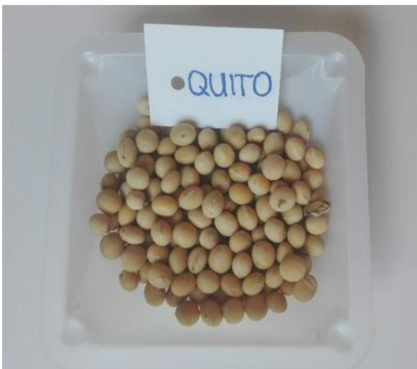
Slika 10. Zrno kultivara Quito