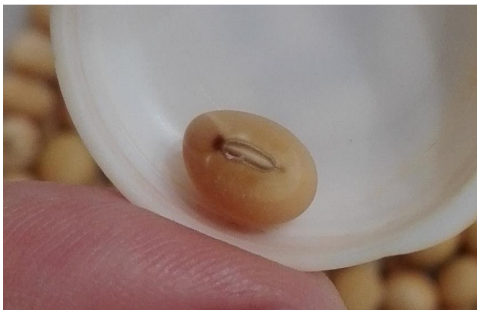
Slika 21. Različita boja funikulusa hiluma od ovojnice zrna kod kultivara Quito

Postoje dvije ocjene boje funikulusa hiluma zrna, ocjena 1 označava istu boju kao ovojnica zrna, dok ocjena 2 predstavlja različitu boju od ovojnice zrna. Od svih deset kultivara soje samo je u jednog utvrđena različita boja od ovojnice zrna i to kod kultivara Quito (slika 21), odnosno 10% dok za 90% kultivara utvrđena istu boju funikulusa hiluma kao i boju ovojnice zrna.