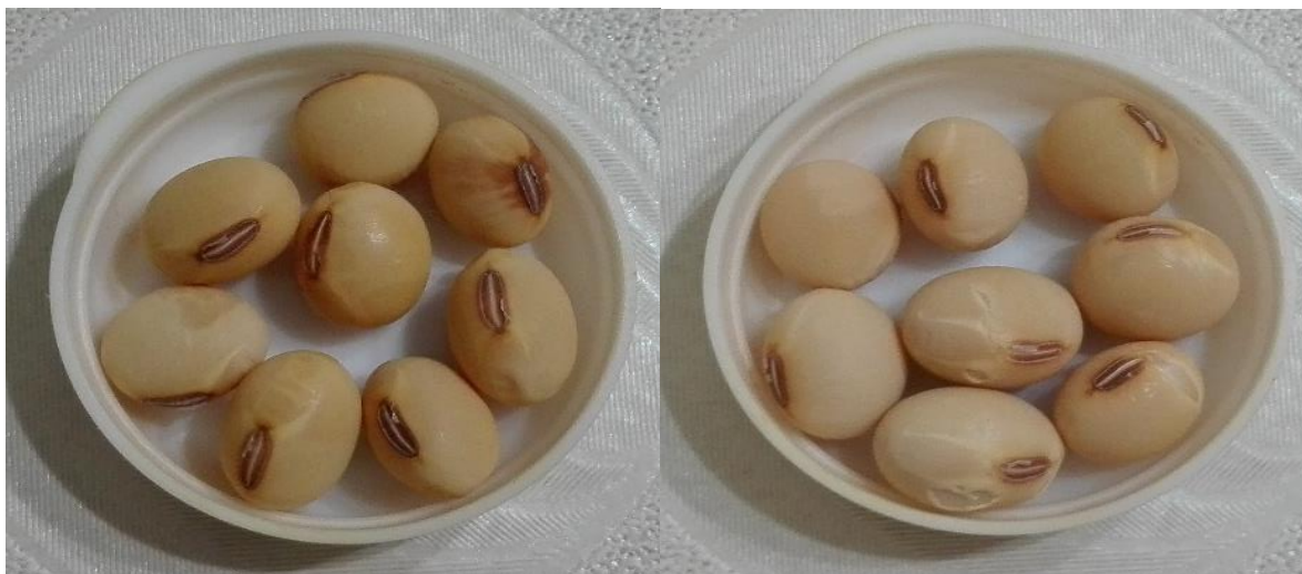
Slika 20. Svijetlo smeđa boja hiluma kultivara Vita i Sonja