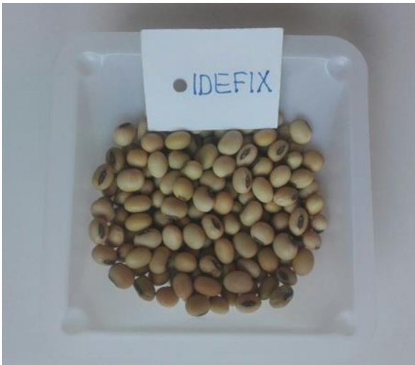
Slika 8. Zrno kultivara Idefix