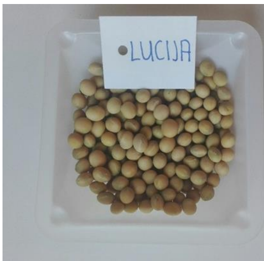
Slika 4. Zrno kultivara Lucije

Kultivar Lucija (slika 4) je vrlo rani kultivar koji se prema dužini vegetacije svrstava u grupu zriobe 00, poludeterminiranog je tipa rasta, visina biljaka se kreće od 85 do 100 cm, ljubičaste boje cvijeta, žutih dlačica, zrna su žuta sa sivim hilumom, ima čvrstu stabljiku koja ima mogućnost grananja i kompaktnog je habitusa. Otporna je na polijeganje i visoke je tolerantnosti na plamenjaču i bijelu trulež stabljike. Kultivar ima veći broj mahuna po biljci koje sadrže najčešće po četiri zrna. Masa 1000 zrna većinom se kreće oko 185 g, sadržaj bjelančevina u zrnju je do 41%, a ulja oko 22%, dok je genetički potencijal rodnoći zrna do 5 t/ha (Vratarić i Sudarić, 2008.).