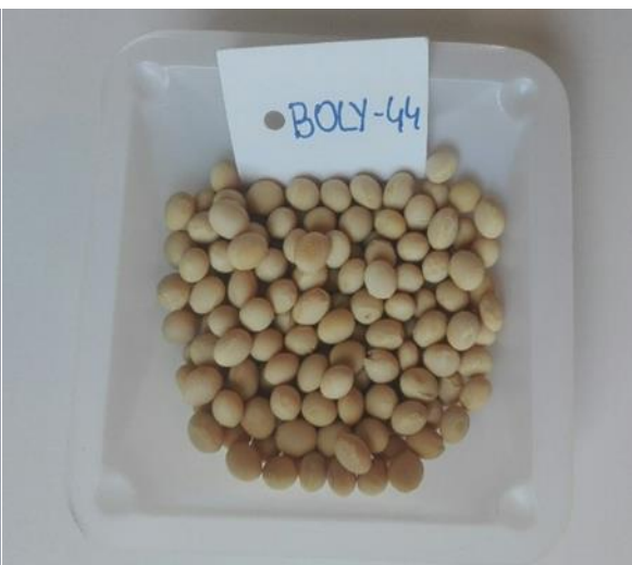
Slika 7. Zrno kultivara Boly-44