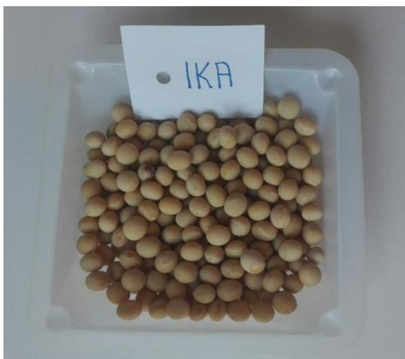
Slika 2. Zrno kultivara Ika

Kultivar Ika (slika 2) je srednje rani kultivar koji se prema dužini vegetacije svrstava u grupu zriobe 0-I, indeterminiranog je tipa rasta, visina biljaka se kreće od 90 do 100 cm, zbitog je habitusa, ljubičaste boje cvijeta, sivih dlačica, zrna su žuta sa žutim hilumom te ima čvrstu stabljiku koja ima mogućnost grananja i otporna je na polijeganje. Sorta posjeduje bolju tolerantnost na glavne bolesti u odnosu na ostale kultivare u proizvodnji, osobito na plamenjaču. Masa 1000 zrna se kreće između 175 i 180 g, sadržaj bjelančevina u zrnu je do 41%, a ulja do 22%, dok je genetički potencijal rodnosti zrna oko 6 t/ha (Vratarić i Sudarić, 2008.).