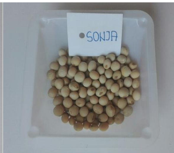
Slika 5. Zrno kultivara Sonje