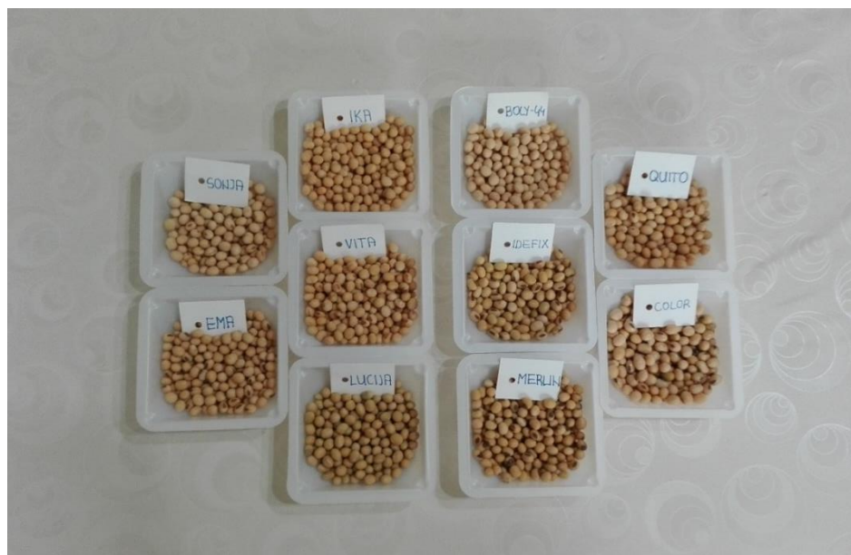
Slika 15. Prisustvo žute boje ovojnice zrna kod svih deset kultivara soje

Kod svojstva boje ovojnice zrna utvrđeno je da su svi kultivari soje žute boje zrna (slika 15), odnosno ocjenjeni su ocjenom 1 od mogućih 7 različitih ocjena boja (žuta, žuto zelena, zelena, svijetlo smeđa, srednje smeđa, tamno smeđa i crna). Za ovo svojstvo 100% kultivara je ocijenjeno kao žuto zrno.