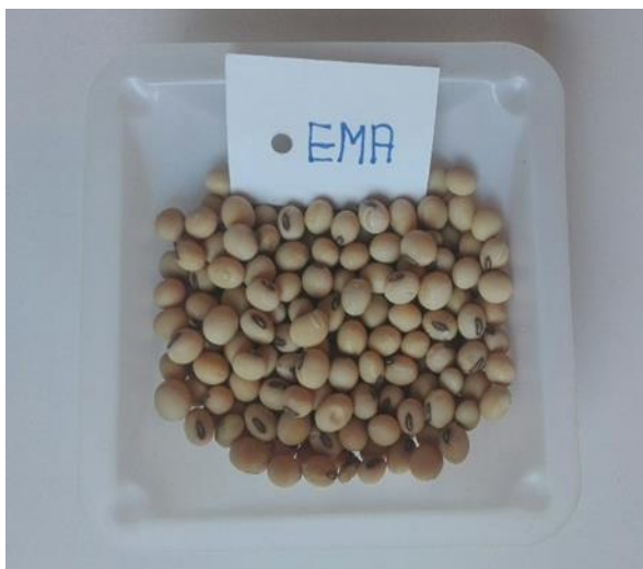
Slika 6. Zrno kultivara Eme

Kultivar Ema (slika 6) je vrlo rani kultivar koji se prema dužini vegetacije svrstava u grupu zriobe 00 – 0, biljke su srednje visoke, cvijet je ljubičaste boje, dlačice su žute, a zrna su žuta sa tamno smeđim hilumom, te ima stabljiku otpornu na polijeganje i izrazito je tolerantna na najzastupljenije bolesti. Sadržaj bjelančevina u zrnju je do 41%, a sadržaj ulja do 22%, dok je genetički potencijal rodosti zrna iznad 4,5 t/ha.