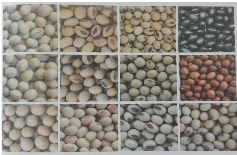
Slika 1. Varijabilnost zrna soje

imalo žutu boju ovojnice, zatim je najviše genotipova bilo crne i smeđe boje ovojnice i to iz Koreje, Indije i Afrike. DUS-ispitivanje provodi se prema Pravilniku o postupku utvrđivanja različitosti, ujednačenosti i postojanosti novih biljnih sorti u svrhu dodjeljivanja oplemenjivačkog prava i priznavanja sorti (NN 61/11) i prema CPVO-im i UPOV-im tehničkim vodičima. Postupak DUS-ispitivanja novog biljnog kultivara obuhvaća ispitivanje kultivara u pokusnom polju i laboratoriju, gdje su u pokus uključeni novi biljni kultivari i kultivari referentne kolekcije. DUS-ispitivanjem utvrđuju se ona svojstva novog biljnog kultivara (navedena u tehničkim vodičima), koja su bitna za utvrđivanje različitosti, ujednačenosti i postojanosti, a to uključuje 18 svojstava kod soje ne uzimajući u obzir svojstva za gospodarsku vrijednost. DUS-ispitivanje temelji se na vizualnom ocjenjivanju i na mjerenju određenih svojstava kultivara, te su dva kultivara različita, ako je razlika između njih utvrđena na barem jednom pokusnom mjestu, očita, i postojana. Cilj ovog istraživačkog rada je utvrditi varijabilnost morfoloških svojstava zrna deset kultivara soje.