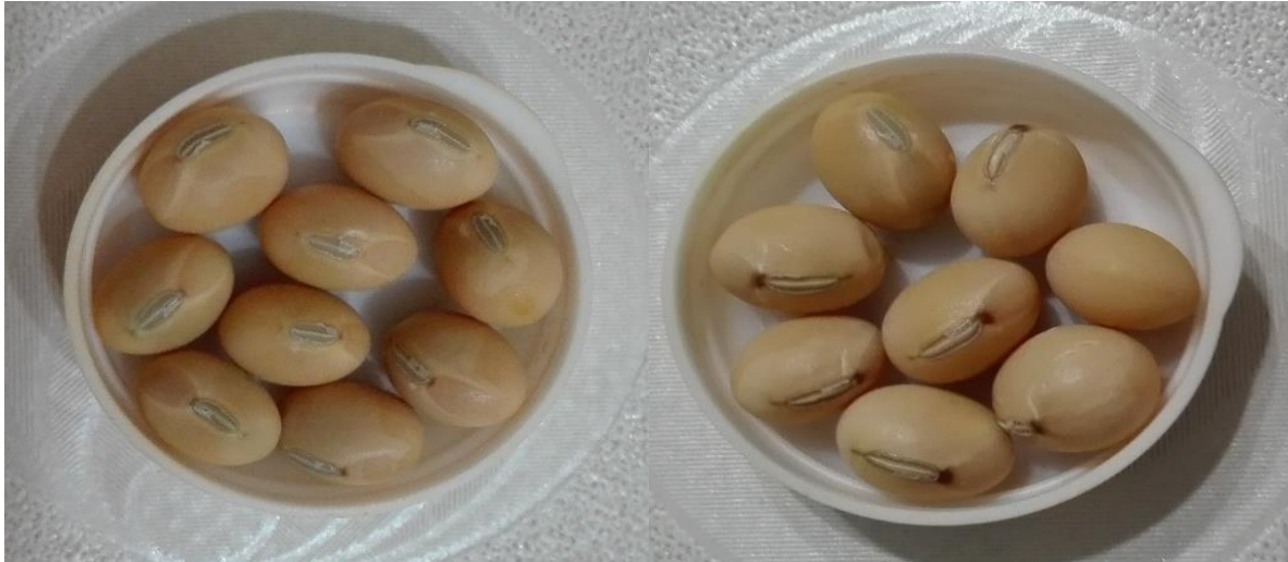
Slika 16. Siva boja hiluma kultivara Lucija i Quito

raspodjelu pigmenta na specifična područja ovojnice zrna. R i T lokusi kontroliraju specifične boje ovojnice zrna, a to su crna (i, R, T), nesavršena crna (i, R, t), smeđa (i, r, T) i svijetlo smeđa (i, r, t). (Song i sur., 2016.; Yang i sur., 2010.)