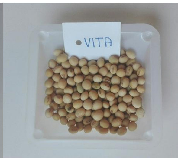
Slika 3. Zrno kultivara Vita