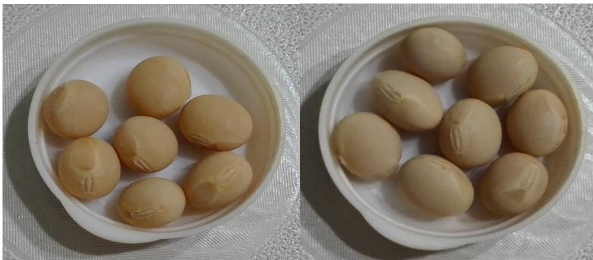
Slika 18. Žuta boja hiluma kultivara Ika i Boly-44