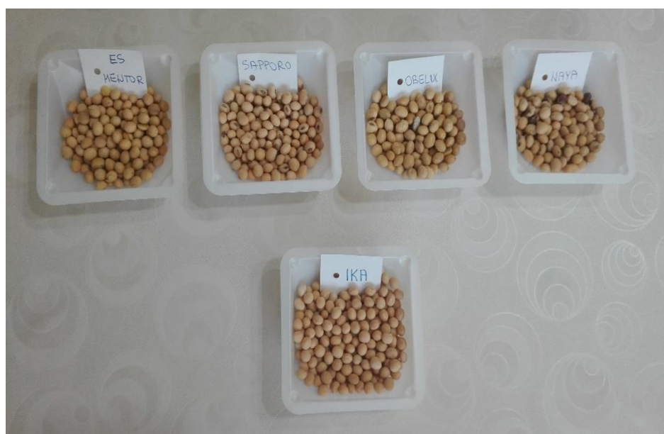
Slika 12. Ocjenjivanje svojstva oblika zrna pomoću standardnih kultivara

Ocjenjivanje pet morfoloških svojstava zrna obavljeno je na deset različitih kultivara soje, koje se temeljilo na vizualnom zapažanju pojedinoga svojstva. Kultivari su se uspoređivali uz pomoć standardnih kultivara koji su navedeni u Protokolu za ispitivanje različitosti, uniformnosti i stabilnosti te su na temelju njih svakom kultivaru dodijeljene ocjene za određeno svojstvo. Za svaki kultivar ocijenjeno je 20 zrna pri čemu je izračunata prosječna ocjena za svako pojedino svojstvo. Za određivanje boje hiluma i boje funikulusa hiluma korišteno je povećalo.