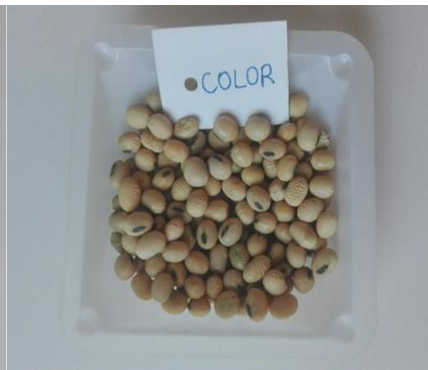
Slika 11. Zrno kultivara Color