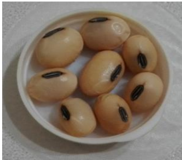
Slika 17. Crna boja hiluma kultivara Color

Nasljeđivanje boje hiluma zrna je slično nasljeđivanju boje ovojnice zrna. Isti geni koji proizvode pigment u ovojnici zrna, utječu na pigmentaciju u hilumu.