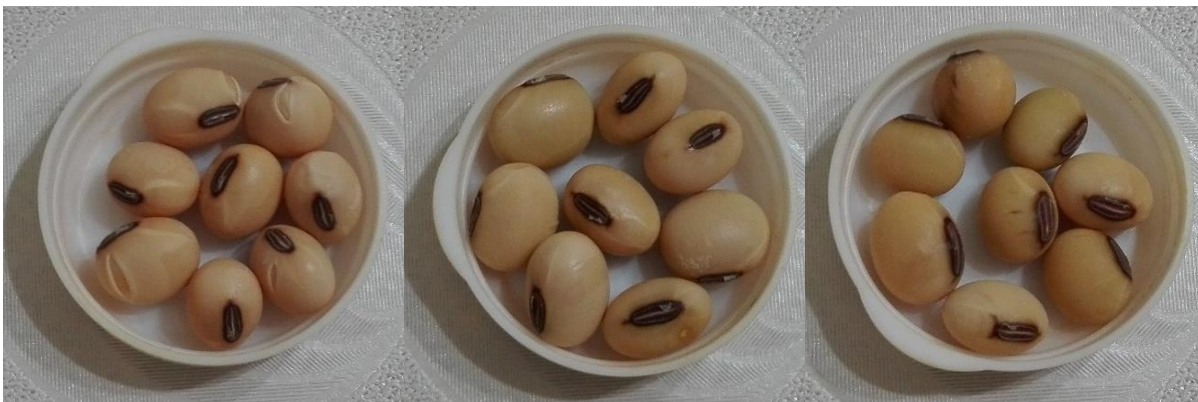
Slika 19. Tamno smeđa boja hiluma kultivara Ema, Idefix i Merlin

Za svojstvo boje hiluma dva kultivara su ocjenjena s ocjenom 1 koja predstavlja sivu boju hiluma (Lucija i Quito, slika 16), za žutu boju hiluma s ocjenom 2 su ocjenjena Ika i Boly – 44 (slika 18), a ocjena 3 dodijeljena je kultivarima Vita i Sonja koja predstavlja svijetlo smeđu boju hiluma (slika 20). Kod tri kultivara, Ema, Idefix i Merlin utvrđena je tamno smeđa boja hiluma (ocjena 4, slika 19), dok je s ocjenom 6 – crna boja hiluma ocjenjen samo jedan kultivar Color (slika 17). Najviše kultivara za svojstvo boje hiluma je ocijenjeno s tamno smeđom bojom točnije njih 30%, zatim 20% sa svijetlo smeđom bojom, 20% s žutom bojom, 20% sa sivom bojom i samo 10% sa crnom bojom hiluma.