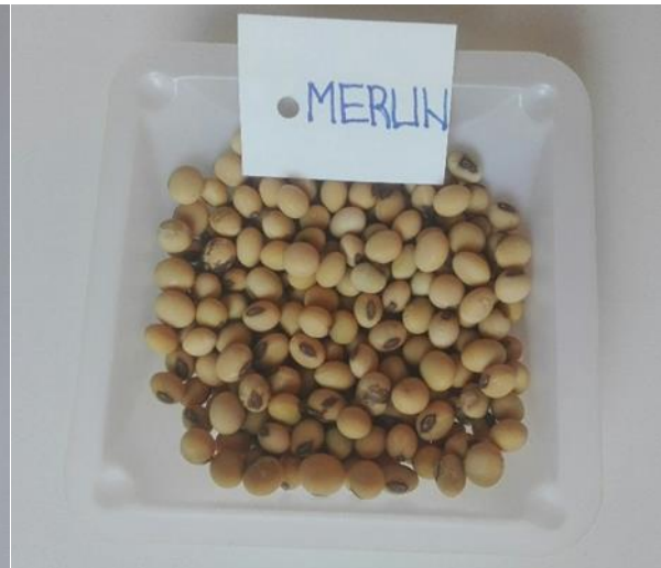
Slika 9. Zrno kultivara Merlin