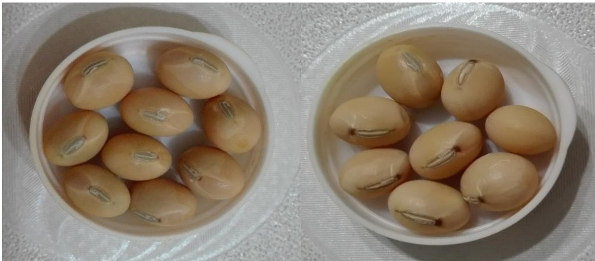
Slika 16. Siva boja hiluma kultivara Lucija i Quito

raspodjelu pigmenta na specifična područja ovojnice zrna. R i T lokusi kontroliraju specifične boje ovojnice zrna, a to su crna (i, R, T), nesavršena crna (i, R, t), smeđa (i, r, T) i svijetlo smeđa (i, r, t). (Song i sur., 2016.; Yang i sur., 2010.)