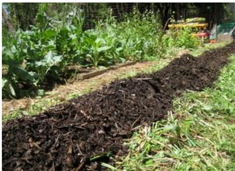
Slika 5. Primjena komposta kao gnojiva i poboljšivača tla ( http://www.youris.com/bioeconomy/agriculture/organic-by-product-derived-biochar-a-greener-option.kl )