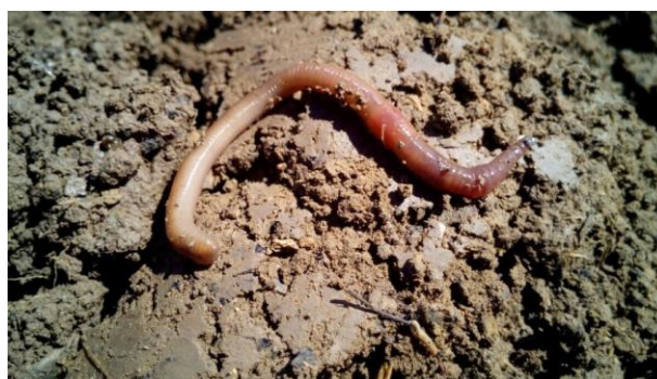
Slika 3. Gujovice u tlu

( http://www.bmcroatia.hr/wp-content/uploads/2019/03/milanovic-kompostiranje.pdf )