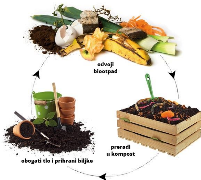
Slika 6. Organski materijal odnosno biootpad

Postoji različite definicije kompostiranja, od onih jednostavnijih pa sve do vrlo složenih. Jedna od jednostavnijih definicija kaže da je kompostiranje mikrobiološka razgradnja u hrpe složenih organskih materijala (slika 6.) u djelomično razgrađene rezidue, koje se nazivaju kompost. Složenija i sveobuhvatnija definicija kompostiranja opisuje ga kao aerobni, biološki proces, gdje se uz pomoć mikroorganizama razgrađuje organska tvar u humusu sličan proizvod, koji je „zdrav“, stabilan, bez patogenih mikroorganizama i klijavog sjemena korova i pogodan za aplikaciju u tlo (Haug, 1993.).