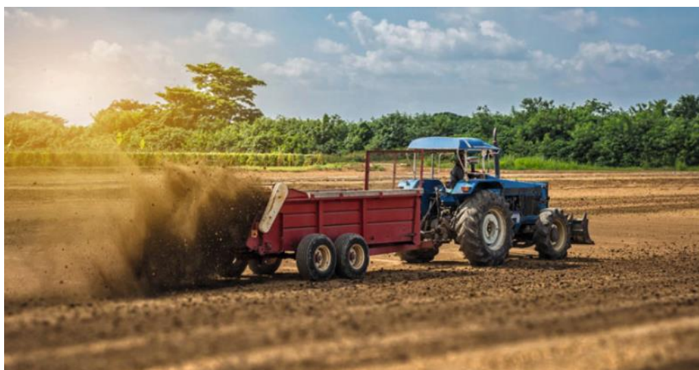
Slika 2. Primjena komposta

Primjena komposta (slika 2.) je od velikog značaja za plodnost tla, a samim tim i za održavanje određenih funkcija tla. Njegovom primjenom tlu možemo osigurati odnosno povećati volumen i broj pora u tlu, koje direktno utječu na vodozračni režim preko kojeg se povećava i poljski kapacitet tla za vodu. Tla koja su bogata humusom, odnosno tla koja sadrže više organske tvari, bolje podnose prekomjerne stresove izazvane većom količinom oborina, navodnjavanja i drugih tipova vlaženja, kao i stresove izazvane sušom. Vrlo često se kao osnovni pokazatelj plodnosti nekog tla navodi brojnost gujavica (slika 3.), čija fiziološka skupina kao i brojnost uvelike ovise o kvaliteti tla koja se primjenom komposta povećava (Funtak, 2016.).