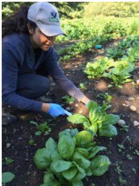
Slika 4. Primjena komposta u povrtlarskoj proizvodnji ( http://sal-lab.landfood.ubc.ca/projects/the-effects-of-high-throughput-in-vessel-compost-on-soil-properties-and-crop-productivity/ )

Komposti se upotrebljavaju u rataskoj proizvodnji kao i u hortikulturi (slika 4.), bilo kao gnojivo ili kao poboljšivač, odnosno kondicioner tla (slika 5.)